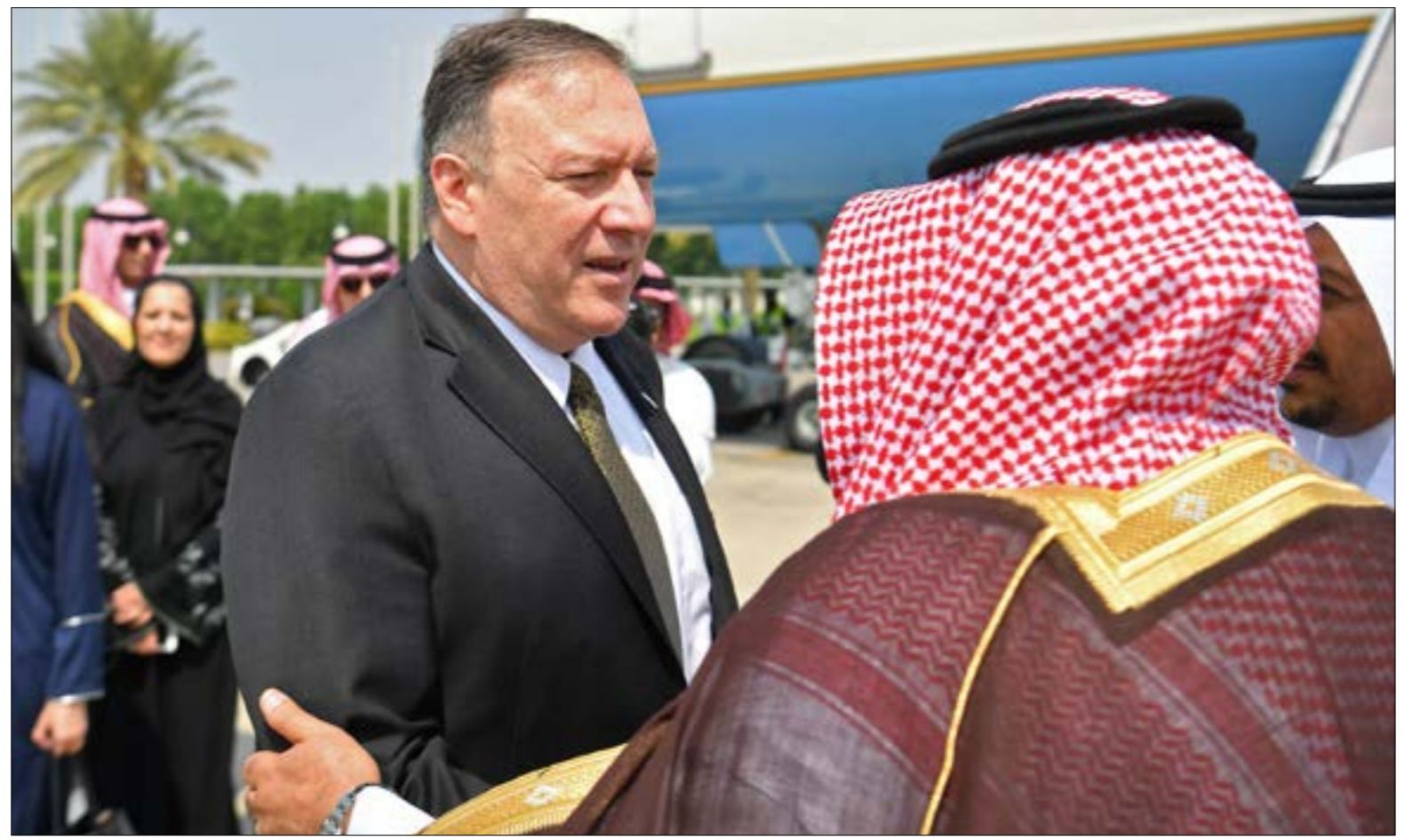
بومبيو من اليمين، «ترغب في حل سلمي... واهل ان تري الجمهورية الإسلامية المسألة بالطريقة نفسها»

«لواء الفتح» حاول التواصل مع غرفة عمليات «التحالف» لإنقاذ أفراده بعدما وقعوا في كاشنة قوات صنعاء، إلا أنه لم تتم الاستجابة لنداءاته، بل وأثناء قيام مقاتليه بتسليم أنفسهم باعتراف طيران «التحالف» بسلسلة غارات لتصفيتهم، في وقت عمدت فيه القوات السعودية في نجران إلى دهم بعض الغازين بإطارات الأليات العسكرية. أحد الناجين من «محرقة كتاف» اتهم «التحالف» ببيع الآلاف من المقاتلين، والزج بهم في معركة موت حقيقية في وادي أبو جبارة». وأشار، في حديث إلى «الأخبار»، إلى أن قوات الجيش واللجان كانت قد تمكنت، وأواخر الشهر الماضي، من إسقاط مناطق السلمات من يد «لواء الوحدة» الموالي لـ«التحالف» (سقط من هذا اللواء قرابة ألف أسير المدرعات الحديثة ومن مختلف الأسلحة المتوسطة والخفيفة والآليات العسكرية، والتي سيكشف عنها في الأيام المقبلة بشكل تفصيلي. وأفادت نجران مستمرة، بعد تأمين مديرية كتاف ومناطق أخرى باتجاه التهمة بمشاركة قبائل كتاف مع الجيش واللجان في العملية التي انتهت بالسيطرة على كل المناطق التي سبق أن تقدمت فيها القوات الموالية لـ«التحالف» على مدى السنوات الماضية. وأوضحت أن قوات صنماء لتخفيف الضغط العسكري على قواته