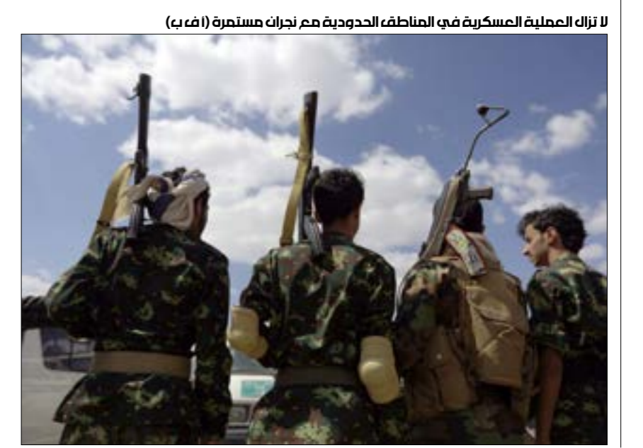
لا تزال العملية العسكرية في المناطق الحدودية مع نجران مستمرة

عملية نوعية قد تكون الاضخم في تاريخ العمليات الحدودية بين السعودية واليمن: نفذتها قوات الجيش اليمني واللجان الشعبية، خلال الأسبوعين الماضيين، من تنفيذ عملية عسكرية واسعة في مديرية كتاف شرقي محافظة صعدة قبالة نجران السعودية. استعادت فيها قرابة 500 كيلومتر من الأراضي المحاذية للحدود. العملية، التي فقدت فيها القوات الموالية لـ«التحالف» جميع مكاسبها التي تحققت منذ فتح جبهة كتاف أواخر عام 2016، ترفض حكومة الرئيس المستقيل عبد ربه منصور هادي الاعتراف بها؛ كون القوات التي خاضتها تابعة مباشرة لغرفة عمليات «التحالف» إلا أن قائد محور كتاف المعلن من قبل هادي، العميد السلفي رداد الهاشمي، اعترف بقدان «لواء الفتح» المكون من 3000 فرد منجذبين بمختلف أنواع الأسلحة الحديثة بكامل قوته البشرية ومعداته، عازياً ذلك إلى «أخطاء في تنفيذ المهمة العسكرية».