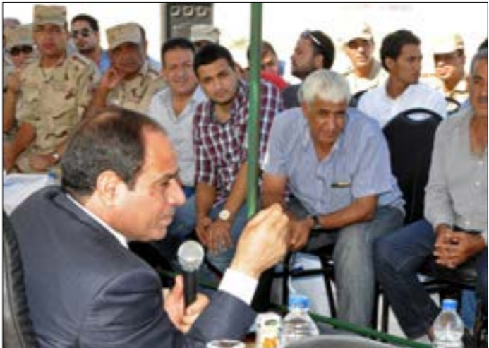
يسبحم السيسي مسالة توجهه الى نيويورك خلال الساعات القليلة المقبلة

داخلياً، وهو ما سيسحسه الرئيس خلال الساعات القليلة المقبلة. ويتراقب الاستنفار الأمني والعسكري، الذي تصاحبه اجتماعات على أعلى مستوى بين القيادات المختلفة بعد إقرار خطة تتركز في الشوارع، مع حملات إعلامية مكثفة لإبراز ما يرى النظام أنها «إنجازات للرئيس»، وتصدرت وسائل الإعلام المحلية التي اذاعت مقاطع لمواطنين في الشارع يعلنون تأييدهم للسيسي، وخصصت تلك الوسائل غالبية أوقات البث التلفزيوني والإذاعي لإظهار «الإنجازات» المفترضة، فضلاً عن مقاطع تدين «عنف» جماعة «الإخوان المسلمون» المصنفة «إرهابية»، وسط تأكيدات أن هناك محاولة لـ«إسقاط الدولة».