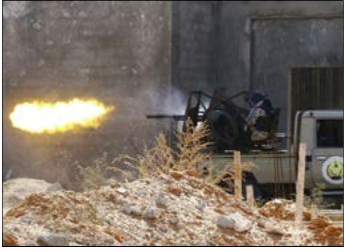
حلل في حال وقف إطلاق النار، لا شيء يضمن أنه لا يكون مجرد استراحة

عشر من نيسان/ أبريل الماضي، ويكون تنويعاً لجهود بذلتها البعثة لأشهر في تنظيم لقاءات قاعدية ضمن المجتمعات المحلية في ليبيا شملت الآف الأشخاص، حيث نسق اجتماعاً وزارياً في الأمم المتحدة الأسبوع المقبل، وتلت ذلك زيارة للرئيس الفرنسي، إيمانويل ماكرون، لروما أول من أمس، التقى جوزيبي كونتي، وأمتدح في مؤتمر صحافي تنسيق وزيرى خارجية البلدين، معتبراً إياه «تنقيحاً ملموساً لإرادة تحقيق استقرار في ليبيا».