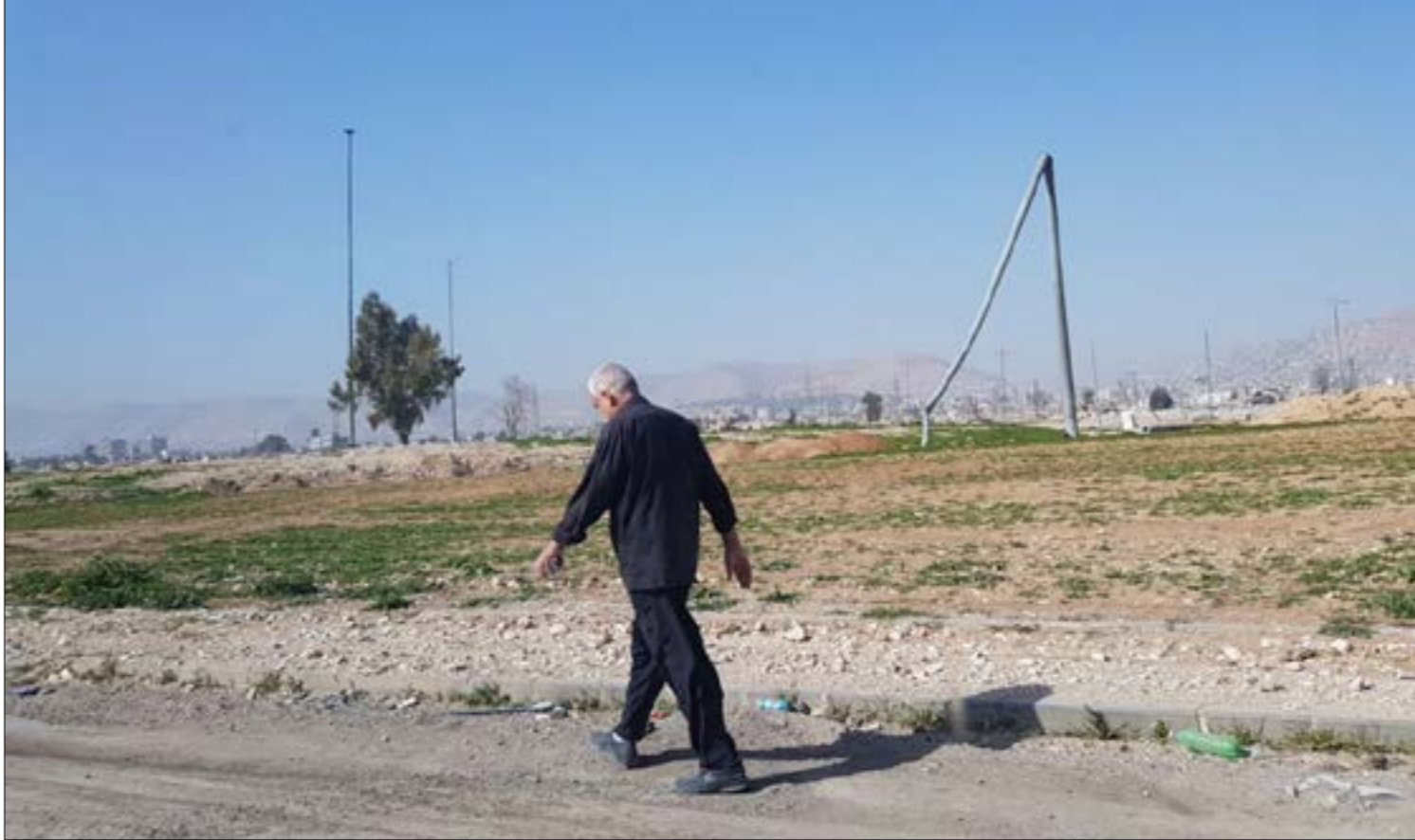
تقدر احصائيات اهلية نسبة العائدين إلى الفوطه باقل من 750 (الأخبار)

ليس طقس دمشق الخريفي الضام بين حر النهار وبرد الليل غريباً عن المناخ الصحراوي. فالعاصمة التي كانت تحضن في خمسينيات القرن الماضي 30 مليون شجرة فواكه تحض بها الفوطه اختلف طقسها بفعل تراجم غطائها الاخشار. غيرت سنوات الحرب اوضاع «سلة دمشق الغذائية»، قضت على شجرها وحجرها وقلبت حياة ابناءها بتساوه في ذلك الياضون فيها والمناحون اليها والمهجرون عنها. ويعتقد ان الفوطه الشريفة تحتاج الى ما يقارب 10 سنوات لتتعتك من استعادة غطائها الاخضر. فيما تحتاج اشجارها المزروعة هذا العام الى 5 سنوات لتعطي اول موسم خير لها