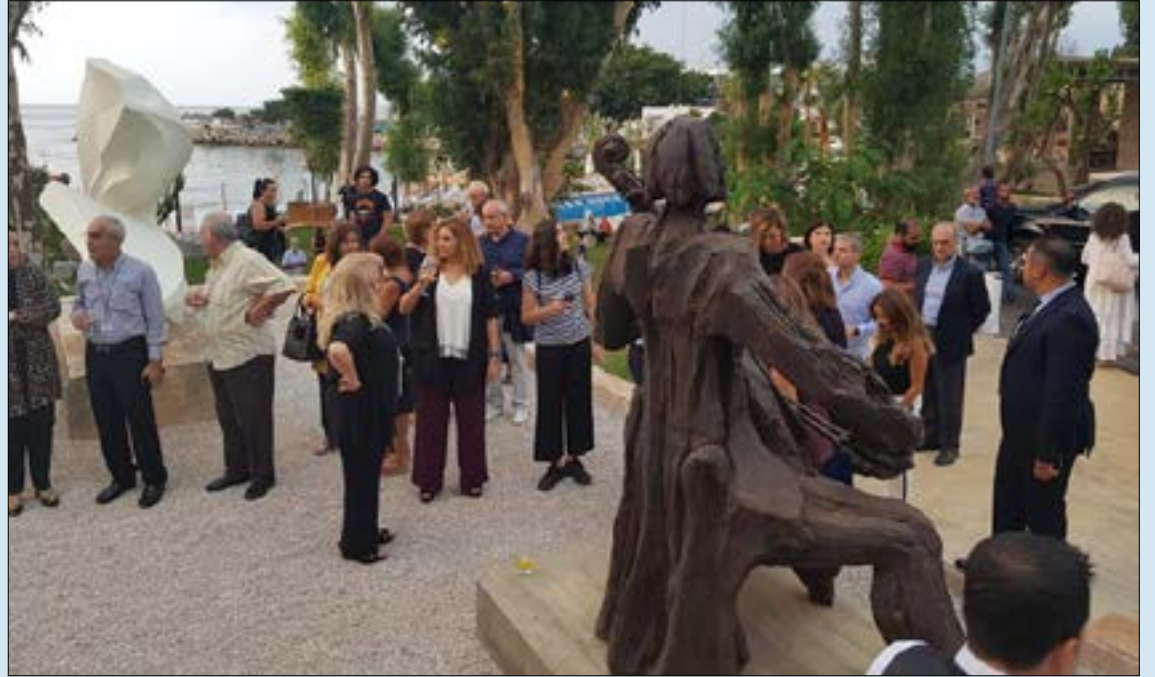
يستمر المعرض لمدة ستة أشهر