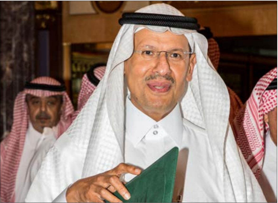
تقول الرياض إن إنتاجها النفطي سيعود إلى مستوياته الطبيعية بحلول نهاية الشهر الجاري (أ ف ب)

«ألا يتضح حجم الضرر بالكامل، إلا في الأسابيع المقبلة». أما غاري روس، مؤسس شركة «بلاك غولد إنفستورز» وأحد الخبراء في صناعة النفط، فقال إن الرياض «مقرطة في التفاؤل» حيال جدولها الزمني، وذلك في ضوء «تحركات سعودية لتأجيل شحنات وخفض كميات الخام في منشآتها النفطية» مؤكداً أن «النقص في المعروض قادم».