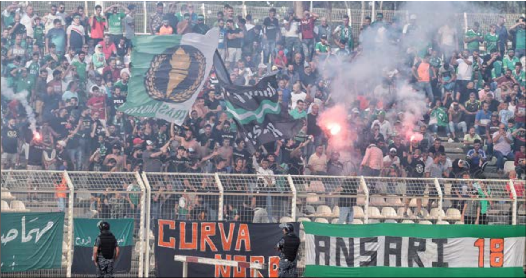
بدأ جمهور الأنصار غضاباً بعد خسارة السوبر