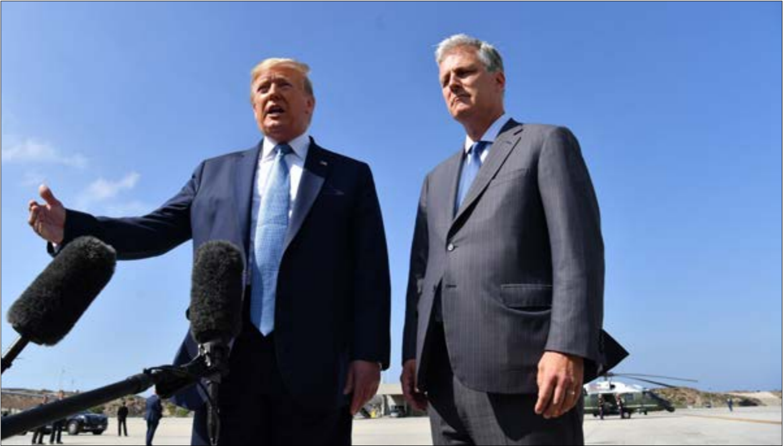
ليست لدى ترامب مصلحة في اختيار شخصية قوية لتلحق منصب مستشار الأمن القومي (ف اف ب)

لكن هذا السيناريو لا يلغي خسارة نتنهاهو، وربما أيضاً لا يلطف منها، خاصة أن محلّ قياس الفشل من الفوز لدى الرجل في هذه المرحلة حزبه و«الليكود» و«أزرق أبيض»، كما تدلّ تسميتها السابق لولاية ويسكونسن سكوت وكري، لعام 2016، كذلك اضطلع بدور كبير مستشاري السياسة الخارجية للسيناتور الحالي ميت رومني، حين ترشح الأخير للرئاسة في عام 2012. وفي عام 2016، نشر أوبراين مجموعة من المقالات المتشدّدة حول السياسة الخارجية بعنوان «بينما نتنام أميركا»، خصّصها لانتقاد