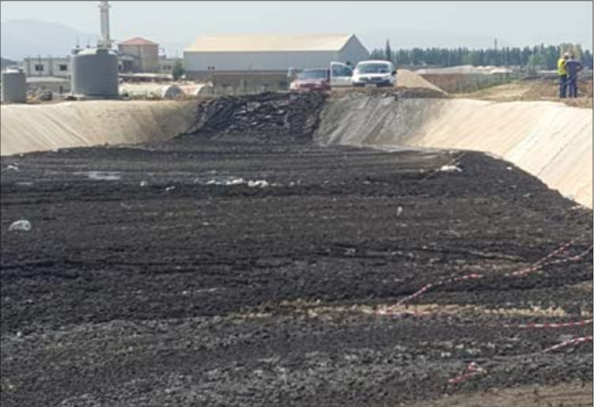
الفترة الاستيعابية للحفر الحالية تنتهي بعد ثمانية اشهر (مصلحة الليطاني)

وما إذا كانت الحفرة الاولى مطابقة للمواصفات، لكنه اكتشف حفرة ترابية غير معزولة بسعة 8 الاف متر مكعب مليئة بالحماة، بئر اسمر عدم عزلها بأنها «استعملت في البداية لتتخفي المصلحة التدقيق في