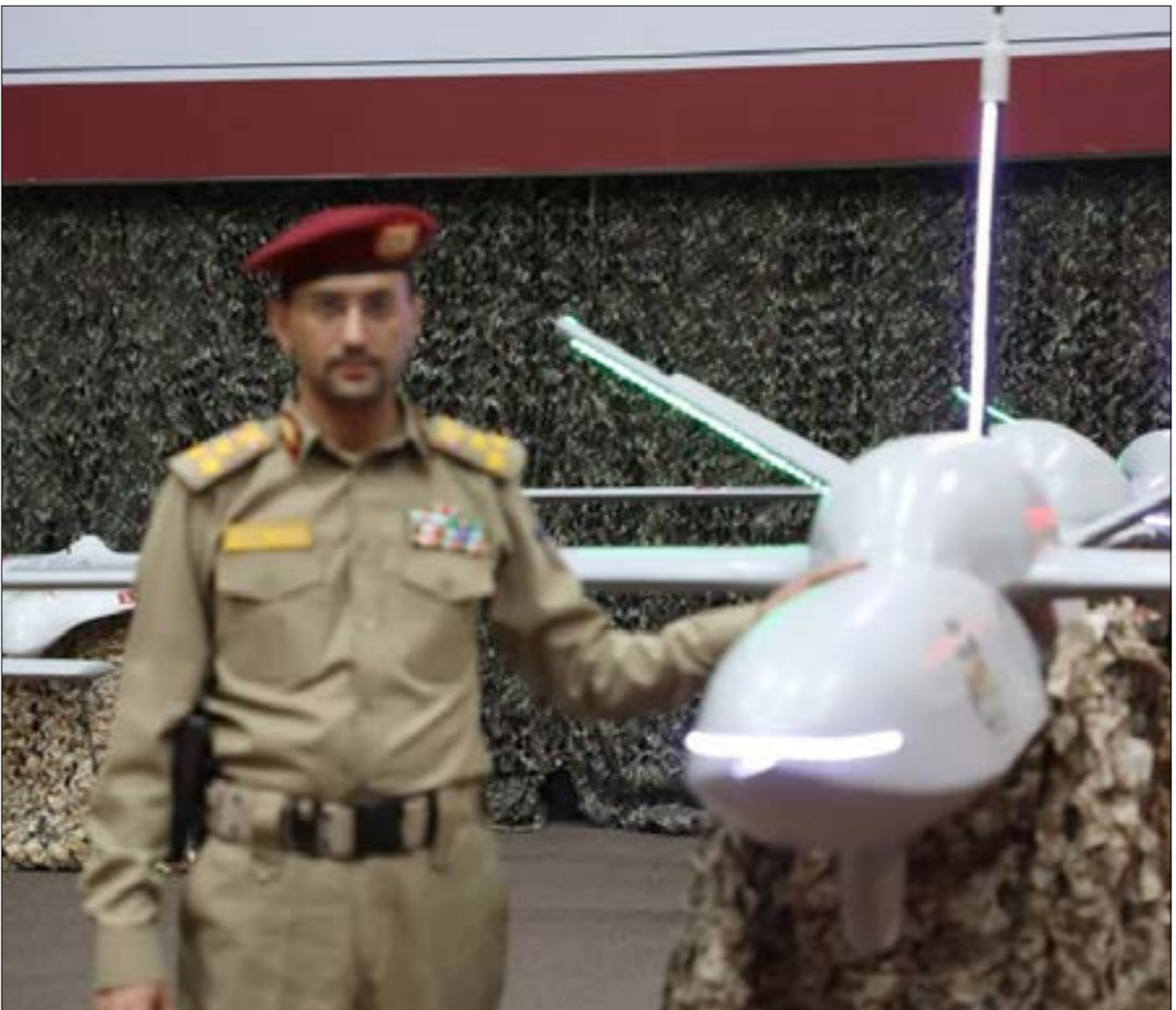
الطائرات المسيرة وصواريخ الكروز متوفرة بكثرة لدينا وتم عرض بعضها في عدة مناسبات

وكان المتحدث السعودي قد تحدّث في المؤتمر أمس بلجنة إنكليزية ثقيلة، محدداً تأكيده أن الاعتداء الجنوب، وسخر طهران من الإعلان السعودي. وعرض المالكي حطام