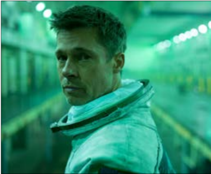
للمخرج اميريكي جيس غراي Ad Astra تفتتح هذه الدورة بفيلم

المهرجان في دورته الثالثة اسمن عريين شهيرين: الممثل المصري محمد هندي والمخرجة الفلسطينية في أفضل فيلم إسرائيلي» في أقسام سي المصري، ولعلّ قد لاحظت بالفعل الحضور الفلسطيني المكثّف في هذه الدورة، يعتمد على عدد من الورش والمحاضرات لجذب محبي السينما