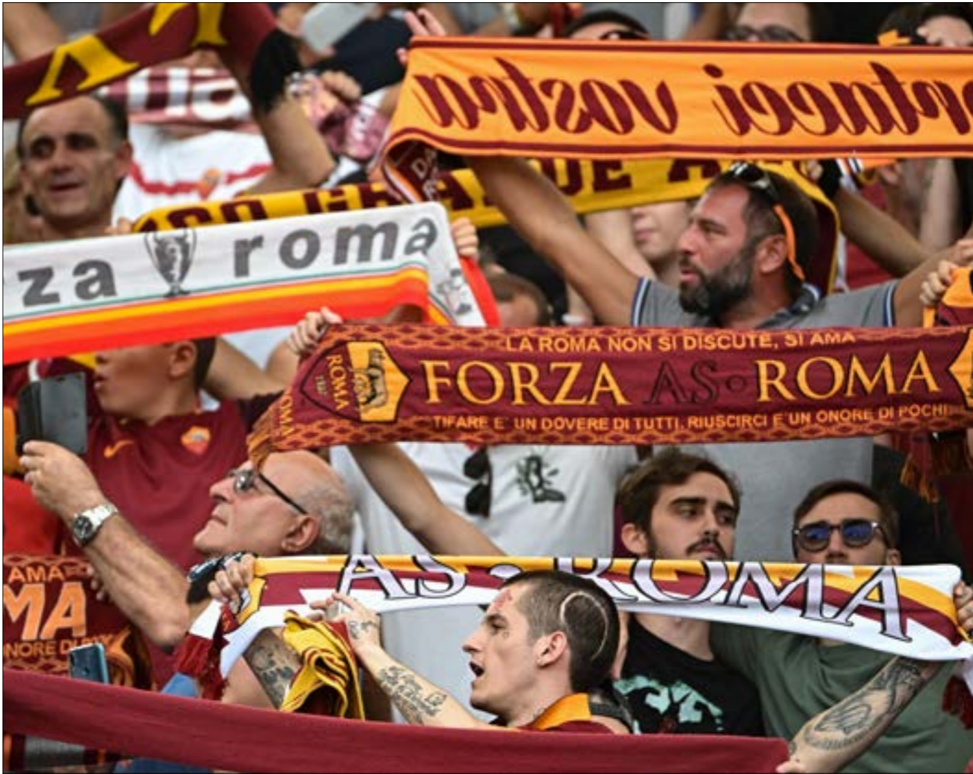
يستقبل روما اليوم نادي بطولة أبطال شاهر (ميسونو) بنوع خاص، (أ.ب.ب)

ويستهل أرسنال الإنكليزي وصيف النطل حملته بلقاء بالغ الصعوبة على أرض إنتراخت فرانكفورت الألماني بطل 1980 (كأس الاتحاد الأوروبي حينها)، ويكتفي فريق