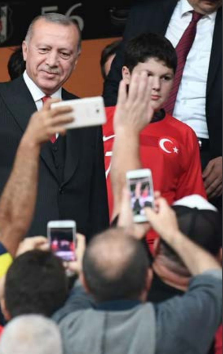
وقف استطلاعات، استراجم اصوات «العدالة والتنمية، في الحد الأدنى إلى أقل من 135 (اف ب)

ازمة مرتقبة بين وزارة المالية والقضاة بسبب آلية احتساب الضرائب على رواتبهم، على أساس الأجر الشامل المتضمن البدلات والامتيازات التي يحصلون عليها، وتفوق قيمتها في أكثر الأحوال قيمة الراتب الأصلي، وهي الية من شأنها إدخال غالبيتهم تحت الشريحة الأعلى من الضرائب التي تصل إلى القضاة لإعلان رفضهم قرار وزير استقطاع ما يبلغ قيمته 22,5% من الأجر، بدلاً من نحو 11% حالياً للسواد الأعظم منهم، وكان وزير