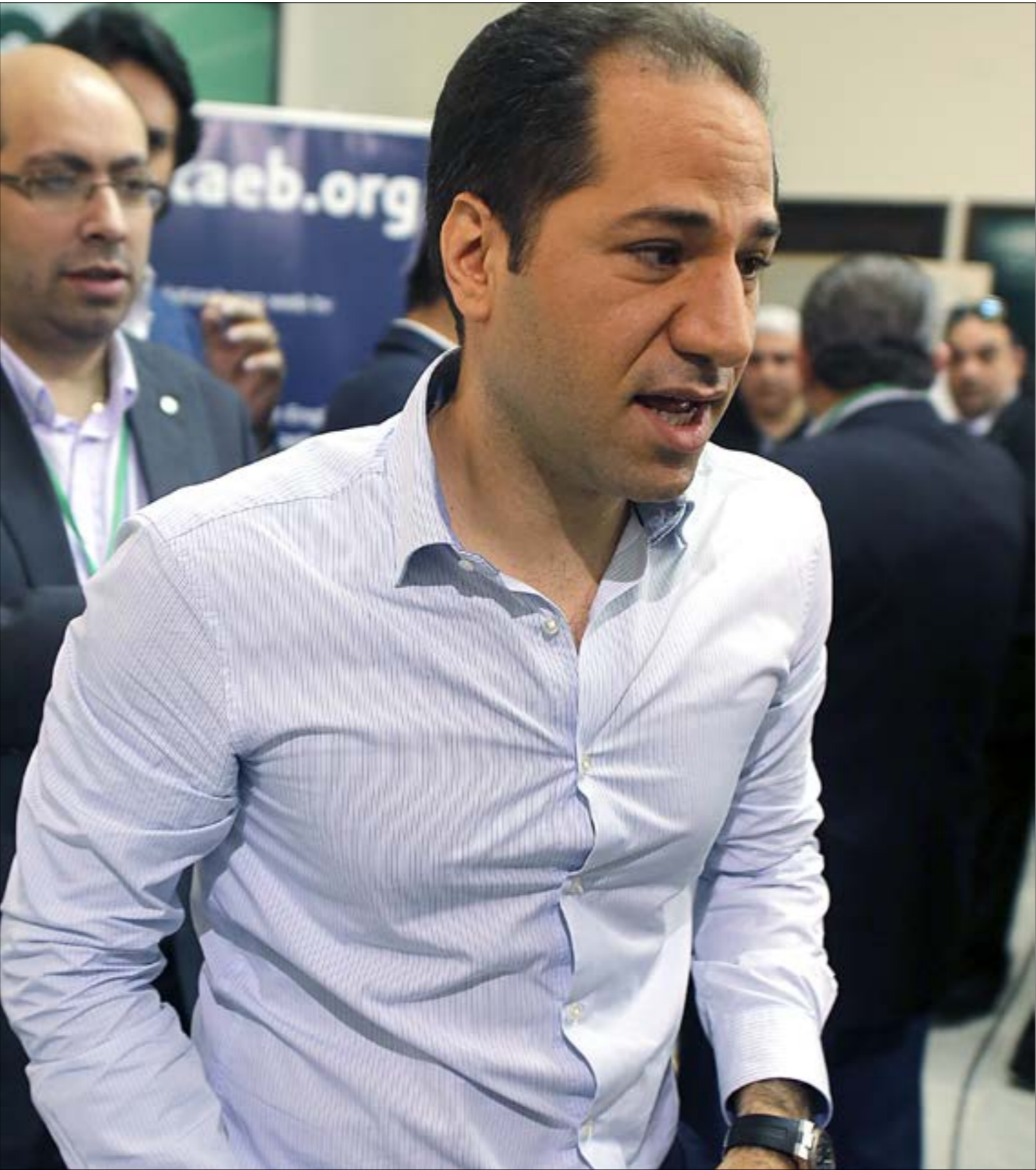
بين الكتائبون ان القوات تخلت عن حلفائهما واعقبت بيوتاهم السياسية (هيلم الموسوي)

انطلقت المحامية الراعي في مطالعتها، أمس، من استغراب أنّ موكلها يُزّي في البلد الذي كاد أن يقع فيه التفجير، لكنه متهم ومحرور حريته في وطنه الأم. استعادت الراعي مراحل التوقيف وشخصية موكلها الضعيفة لتنتهي بطلب الجراءة له. قبل أن إليه.