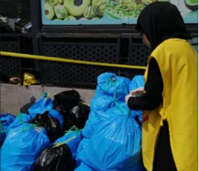
وصلت كمية ما جمع من زجاجات بلاستيكية في الأيام العشرة الى 2000 كيل

هذا العام في حملة الفرز، «ولسنا وعى الناس لأهمية هذا النشاط، وبرز ذلك في معرفتهم لألية الفرز»، انتهت مهمة الأيام العشر، لبدأا مشروعاً في الضاحية الجنوبية البيروت وجبل لبنان في الحملة التي دعته إليها الجمعية، بالتعاون مع العمل الإجماعي في حزب الله والهيئات النَسائِيَّة في بيروت وبلدِيَّات المناطق وعدد من الجمعيات والمبادرات البيئية، وبحسب غدير سلامة، نائبة رئيس الجمعية، زادت المشاركة