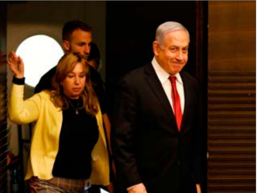
سياراو حكومة الوحدة لا يلغي خسارة نتنهاهو. وربما أيضا لا يلطف منها

لكون غانتس رئيس الحزب الأكبر في «الكنيست». إذ اتفق نتنهاهو مع اليمين المؤيد له على التفاوض ككتلة واحدة في المفاوضات الحكومية، وهو ما من شأنه تصعيب مهمة غانتس وتاليا إفشالها، ما يعني العودة لاحقاً إلى تكليف نتنهاهو، بوصفه رئيس الحزب ذي المرتبة الثانية في «الكنيست». توجّه كان واضحاً في حديث رئيس الحكومة، حيث قال إن هناك خيارين: حكومة برئاستي، أو حكومة تعتمد على الأحزاب العربية المعادية للصهيونية، ما يعني أنه يعارض حكومة وحدة، ويأمل في مسارات قد تتكئنه من تشكيل الحكومة برئاسة يراهن نتنهاهو على عامل الزمن، وعلى مستجدّات قد تتكئنه هو من تشكيل الائتلاف، سواء عبر شقّ أحزاب وتكتلات في المعسكر المقابل، أو نتيجة ظرف زاهم سياسي أو ميداني يؤدي إلى تلمين المواقف