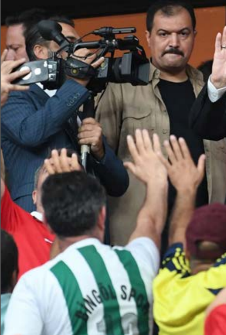
وقف استطلاعات، استراجم اصوات «العدالة والتنمية، في الحد الأدنى إلى أقل من 135

ميزانية الدولة على تحصيل الضرائب والرسوم والخدمات بصورة رئيسية. وحتى الآن، لم تيد وزارة المالية أي موقف تجاه القضاة، على رغم حالة الغضب التي تسيطر عليهم. وعلى رغم التصعيد الجاري حالياً، تتحدث التقارير الأمنية عن صعوبة تشكل موقف موحد لدى القضاة، أو ترجمة