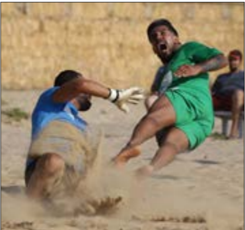
الأندية تتجمع هم الملعب العام للاتحاد اليوم

النجمان مخططان بشكل كبير، إذ أن اسميهما يرتبطان اليوم بالخيانة وقلة الوفاء، هما وكأنهما لم يشاهدا أبداً كل وسائل الشكر والمحبة التي خصّها جمهور تشلسي لنجمه البلجيكي إيدين هازار يوم قرر الرجيل إلى الريال، وذلك بعدما احترمها بخروجه بطريقة طبيعية من النادي اللندني ومن دون أي تصاريح أو تلميحات استفرة.