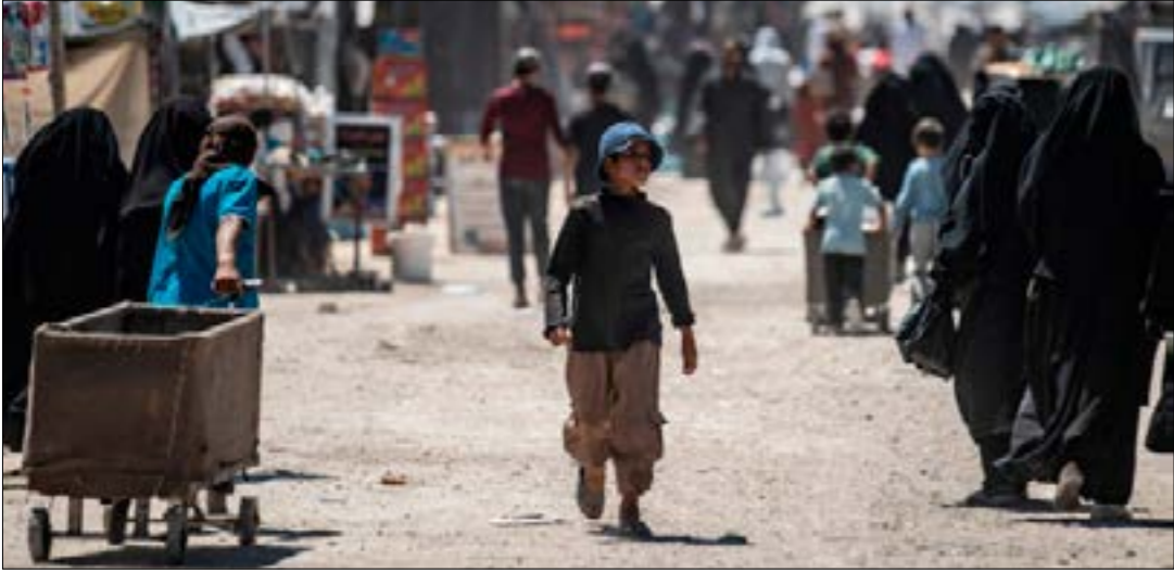
ألقى مجلس الأمن جلسة بشأن سوريا، أمس، بسبب تعرض المبعوث الأممي لحادث سير

ترى أن «أي عمل عسكري أحادي الجانب من قبيل أي طرف سيكون غير مقبول... وخاصة مع احتمال وجود أفراد أميركيين». وأكدت أن «مثل هذه الأعمال غير مقبولة، وأن