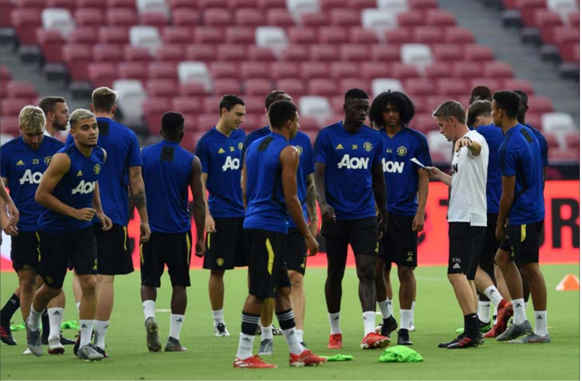
لم ترم الإدارة تعاقدات مميزة حتى الآن

بسبب ما وصفه الأخير بمزاجية اللاعب وتقلباته. بوغبا فشل حتى الآن بإثبات أنه كان يستحق المبلغ الذي دفع فيه. أسماء أخرى كروميلو لوكاكو، أنخيل دي ماريا، مروان فياليني، شنأيدرين، كُتب لها الفشل أيضاً في كتيبة الشياطين، نظراً لتعاقب مدربي لديهم فلسفات كروية مختلفة في مدة زمنية