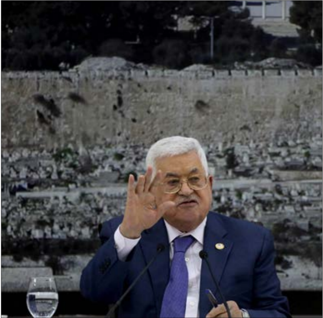
سأهمت إجراءات العدو الإسرائيلي في دهم عباس إلى إعلانه الأخير

وعلى رغم أن البيان حاول إضفاء نوع من الخطورة على المحاولة المفترضة الجديدة، عبر القول إنها كانت تتهدد بـ«عودة نظام المؤتمر الوطني البائد للحكم، وقطع الطريق أمام الحل السياسي وتأسيس الدولة المدنية»، نصر الدين عبد الفتاح، انبرى استقبل الإعلان بالتكذيب والسخرية من كثرة المحاولات الانقلابية التي أعلن عنها المجلس العسكري منذ توليه زمام الأمور في البلاد. لكن تناول منسوبي «حزب المؤتمر الوطني» و«الحركة الإسلامية» منذ سقوط نظام الرئيس المخلوع، عمر حسن البشير، ولخبرير حملة الاعتقالات الواسعة هذه، كان لا بد من الربط بين المعتقلين ومحاولة انقلابية مفترضة أعلنت عنها القوات المسلحة