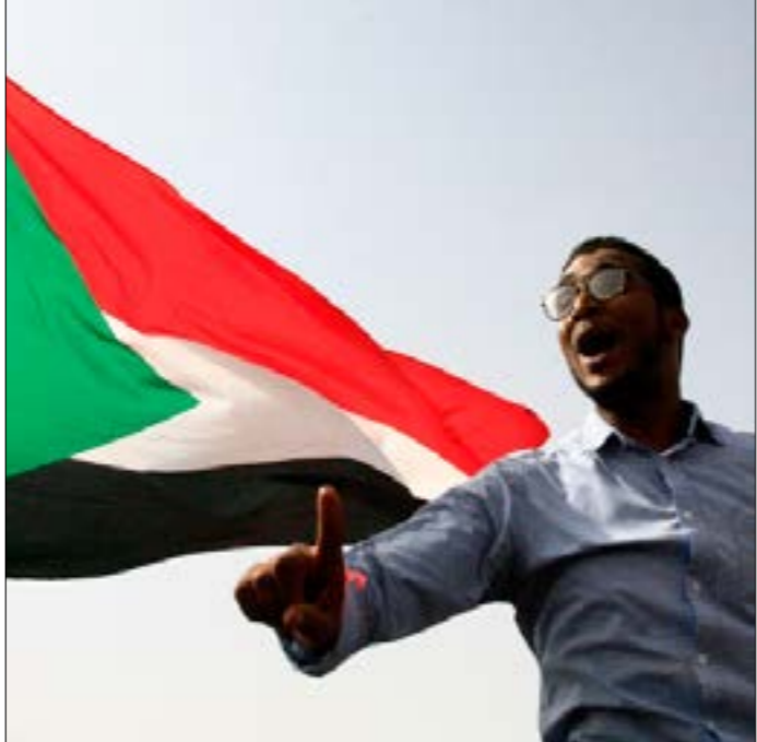
لم تزد إجراءات المجلس العسكري من اسمه ولا زحله القوي «حميدي»، لدى الشارع (أ ف ب)

أول من أمس، لتكون الخامسة من نوعها منذ الـ 11 من نيسان/ أبريل الماضي (تاريخ سقوط البشير). وبحسب بيان القوات المسلحة، فإن مدير تلك المحاولة هو صاحب أعلى رتبة عسكرية في الجيش، أي رئيس هيئة الأركان المشتركة الفريق أول ركن هاشم عبد المطلب المعروف بميوله الإسلامية. كما أن من بين الذين شاركوا فيها عدداً من ضباط القوات المسلحة وجهاز الأمن برتب ريفية، إلى جانب قيادات من «الحركة الإسلامية» وحزب «المؤتمر الوطني». تم التحفظ عليهم جميعاً وجار التحقيق معهم وتوطة محاكمتهم.