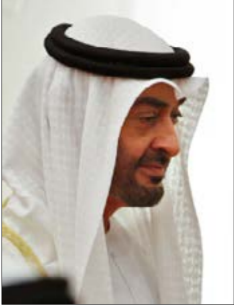
ليس الخلاف بين ابن زايد وحاكم الشارقة حديثاً

بعد أيام على هروب زوجة حاكم دبي محمد بن راشد، شقيقة الملك الأردني عبد الله الثاني، هيا بنت الحسين، إلى أوروبا واستقرارها في المملكة المتحدة، انتشر نبأ وفاة نجل حاكم الشارقة سلطان بن محمد القاسمي، خالد بن سلطان (39 عاماً)، في بريطانيا في 1 تموز/ يوليو الماضي. وفاة لا يزال يلغها الغموض، وخصوصاً أن التحقيق الذي فتحتته شرطة لندن في وفاة رجل الأعمال الإماراتي، صاحب شركة «بيت أزياء قاسمي»، لم يخلص إلى نتيجة حاسمة في ما يتعلق بأسباب الموت. وما ضاعف عدم الوضوح هذا، الإسراع في دفن خالد قبل تشريح جثته، في مراسم حضرها والده بغياب ولي عهد أبو ظبي محمد بن زايد، وحاكم دبي محمد بن راشد، على رغم أن كليهما كانا موجودين في الإمارات. هكذا، أضيفت حادثة مبهمة جديدة إلى تاريخ البلاد المليء بالانقلابات وسفك دم القربى، فاتحة الباب على تشكيلك واسع داخل المملكة المتحدة وخارجها في حقيقة ما آل إليه مصير آخر الأبناء الذكور لحاكم الشارقة. وفقاً لمعلومات حصلت عليها «الأخبار»، فإن سلطان «تعرض لعملية اغتيال مَعقدة بأمر من محمد بن زايد»، بعد أشهر عدة من التخصيص. وتقول المصادر إن «قرار القتل اتخذ بعدما وصلت إلى يدي ابن زايد تقارير أمنية عن وجود اتصالات بين الأمير الإماراتي الذي تمت تصفيته، والأجهزة