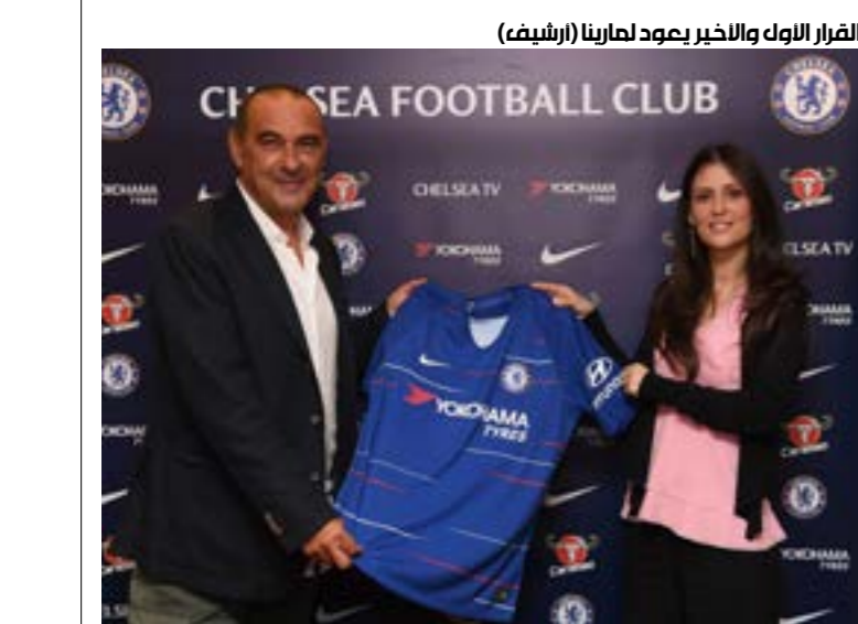
القرار الأول والأخير بصود لامبارنا (أرشيف)

وسط هذه «الزحمة»، يبدو خيار لامبارد الأقرب إلى التحقّق. رغم نجاح موسمته الأول مع ديربي كاوتشي، بعد أن كانت محصورة بيد مارينا. جاءت مارينا إلى تشيلسي برفقة أبراموفيتش عام 2004. مع مرور الوقت، بدأت تتدرج في المراكز الإدارية، حتى سيطرت على المناصب كافة، بعد المشاكل التي تعرض لها مالك النادي مع الاتحاد الأوروبي، والتي حالت دون دخوله بريطانيا إلا بشروط صارمة. كانت بصمة مارينا الأولى من خلال نظام الشباب، السياسة التي بنفرد بها تشيلسي عن غيره من الأندية، والتي أدخلت عائدات كبيرة إلى النادي من وسائل غير مألوفة في عالم كرة القدم. تقضي السياسة بشراء لاعبين شباب وإعارتهم إلى دوريات أخرى، خاصة الدوري الهولندي الذي شكّل سوق تشيلسي لعرض اللاعبين وتطويرهم وحصولهم على تأشيرة للعب في أوروبا، ثم بيعهم بأسعار مضاعفة. سنوات من النجاح توقفت هذا العام، بعد أن وقع تشيلسي في فخ اللعب المالي الخفيف، بعد التوقيع مع العديد من اللاعبين دون السن القانونية وإدراجهم للعب في مصاف الفرق الأولى. العقوبات كانت قاسية، إذ حرم النادي من سوقي الانتقالات المقبلين، ما عقّد الأمور داخل قلعة ستامفورد بريدج.