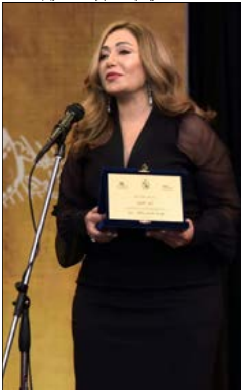
حصلت الممثلة المصرية ليلى علوي على تكريم

اختتام «مهرجان طرابلس للأفلام» غداً الأربعاء - الساعة السابعة مساءً - «بيت الفن» (الميناء - طرابلس/ شمال لبنان). للاستعلام: 71/400101