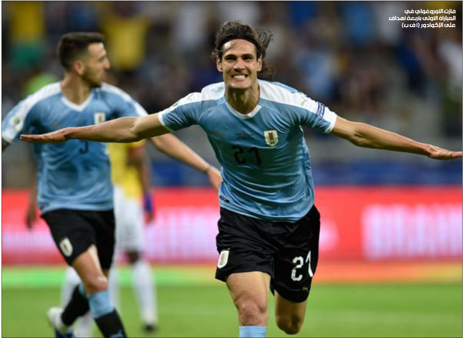
فازت الأوروغواي في المباراة الأولى باربعة أهداف على الأكوادور (أضرب)

تضع الأوروغواي من بين المرشحين، هو تاريخ هذا المنتخب في بطولة «كوبا أميركا». التاريخ الذي يضعه في صدارة ترتيب المنتخبات الأكثر تنوعياً بلقب البطولة القارية، بواقع 15 لقباً. الأداء الذي قدّمه هذا المنتخب في المباراة الافتتاحية من النسخة الحالية، والتي انتهت بفوز زملاء نجم باريس سان جيرمان إيدنسون كافاني بنتيجة (0-4)، تيشر بالخير للشعب الأوروغواياني، الذي لطالما كان مسانداً لمنتخب بلاده، تماماً كغيره من الشعوب اللاتينية المتعلقة بكرة القدم وبمنتخبهم الوطني.