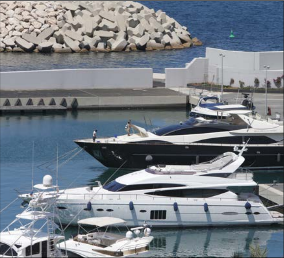
إلغاء رسوم (رخص القومية والسلاح... والبخوت غير مغطاة (هيلم الموسوي)

في صلب المادة، بحيث يصار إلى تحديد المواد التي تطالها الرسوم الضريبية في المادة، وهو سيقدم صيغة في هذا الإطار. رسم المفاعل يزيد 40 ضعفاً النقاش الحاد طال أيضاً المادة 67 المتعلقة بفرض رسم طابع مالي على رخصة استثمار المفاعل أو الكسارة بقيمة خمسة ملايين ليرة،