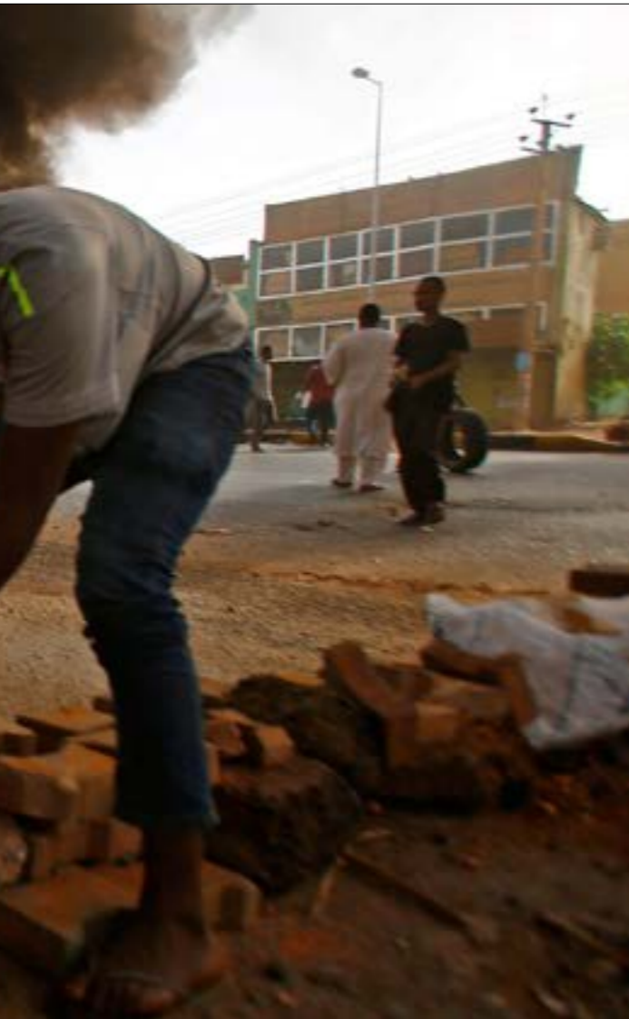
يره قادة الحراك ان الصلح ان الطرف الى إسقاط طغمة المجلس العسكري

وضع تهوّر «المجلس العسكري» وحماسة الداعمين الخليجيين المشهد في السودان امام مرحلة جديدة يبدو العسكر في الحلقة الاعمق فيها، في ظل انسداد افق التفاوض الذي كان يسمح له بالتسوية والمطالبة في تسليم السلطة للمدنيين، وافتضاح نياته في الاستئثار بالسلطة داخليا وخارجياً، ما يضعه امام تحديات عديدة، تبدأ من الشارع ولا تنتهي بالمؤسسية العسكرية