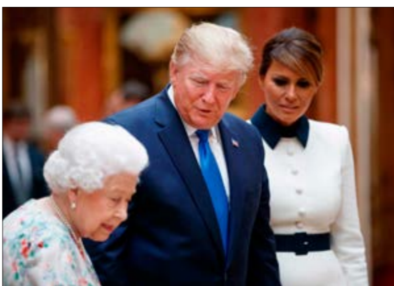
تستمر زيارة ترامب لاندل لالة أيام

تتخذ قرارنا النهائي لكننا أوضحنا أننا ندرس المسائل الفنية، أي كيفية ضمان عدم وجود باب خلفي يتيح لدولة ثالثة استغلال شبكات الجبل الخامس في التجسس علينا، وايضاً المسائل الإسرائيلية، حتى نضمن عدم الاعتماد تقنياً بنحو مفرط على دولة ثالثة في ما يتعلق بهذه التكنولوجيا الحيوية للغاية». فضلاً عن ذلك، تحتل العلاقات التجارية الأساسية لبريطانيا في مرحلة ما بعد «بريكست» حيزاً كبيراً من المحادثات، وإن كان البعض في لندن يخشى ألا تجري الأمور في مصلحة بلدهم. وسيختم الرئيس الأميركي زيارته، غداً، بعد حضور مراسم إحياء الذكرى 45 لإنزال الخورماندي في نورثسموث، مع الملكة والرئيس الفرنسي إيمانويل ماكرون.