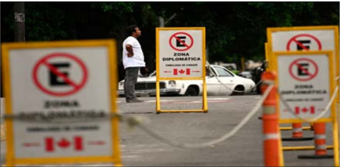
عزت كندا إغلاق سفارتها لدى كاراكاس إلى عدم قدرة دبلوماسيها على تجديد تأشيراتهم

مع انخفاض حرارة الانخراط الأميركي في الملف الفنزويلي، وغياب تطورات لافتة في موازاة المفاوضات التي حصلت في أوسلوبيث المعارضة والحكومة. عادت الدول المهتمة بإيجاد حل للزمة في كاراكاس إلى الدعم السياسي، وهو ما كات وراء لقاء سيرغي لافروف بنظيره الكولومبي