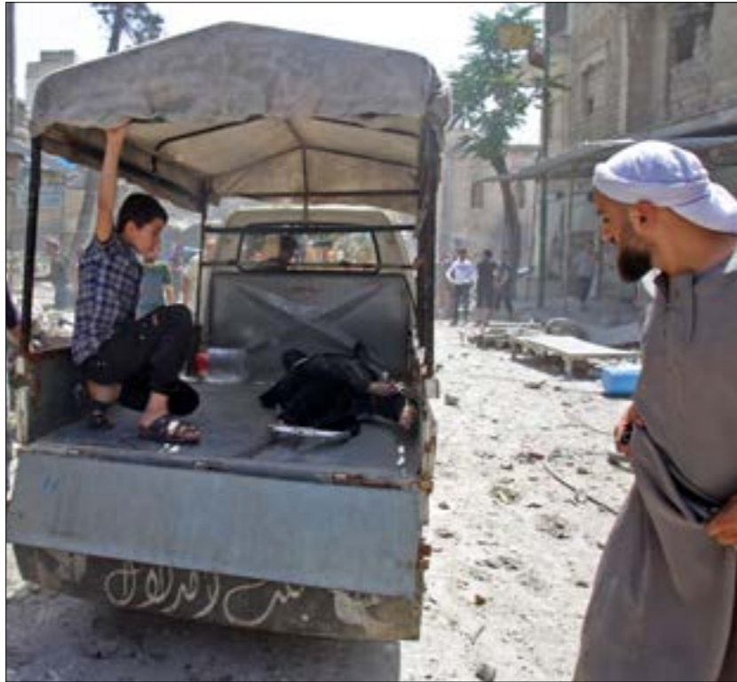
تركزت الغارات الجوية على عدة مواقع في ريف