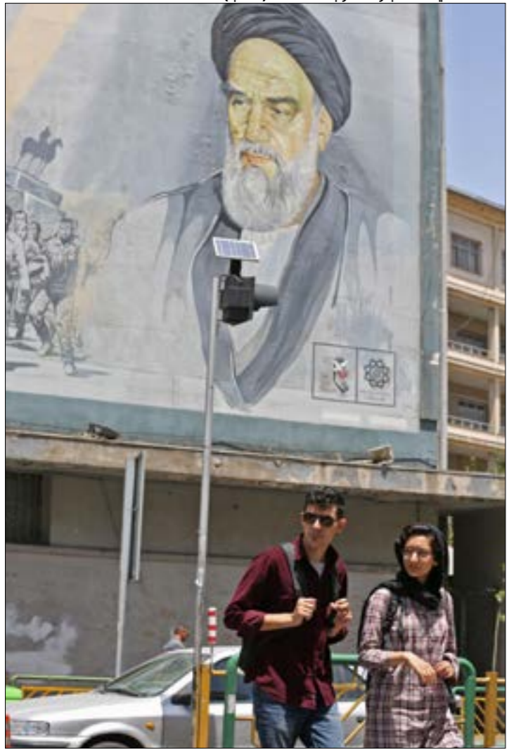
الحرس الثوري في ذكره الخميني: إيران عازمة أكثر من السابق على تحطيم الصواب والعقوبات الطالمة

يعتبر رمزياً للغاية. وتابعت الصحيفة أن ترامب يعتبر خطراً على السلام والديموقراطية ومناخ كوكبنا، مشيرة إلى أنه «لا يمكن إنكار أن وجود رئيس منتخب ديموقراطيا من قبل شعبه، وأكبر للحفاء المقربين لبريطانيا، أمر جيد، إلا أن دعوته إلى زيارة البلاد