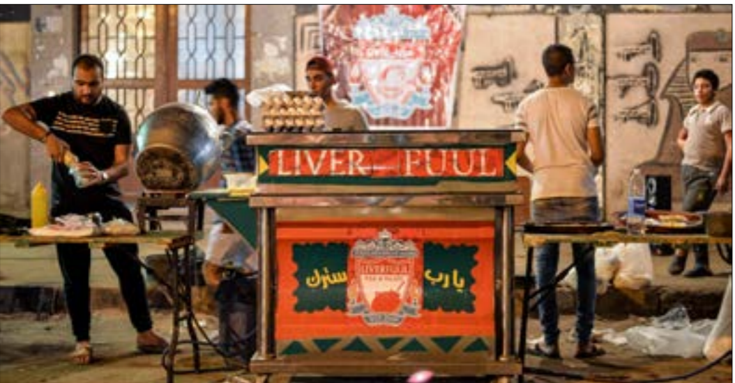
عربة طعام في القاهرة أطلق عليها «البرفول»، (أحمد حسنة، افهنا)

البدايات. لحظة احتفاله بدوري أبطال أوروبا، لم ينس صديقه، واللاعب الذي أحبه عندما كان طفلاً وتاجر به. سال مباشرة «أبو تريكة فين؟»، «سكرة» الفوز بدوري الأبطال لم تنسه محمد أبو تريكة، اللاعب المصري الخلاق والموهوب الذي يشبه صلاح، والذي خرج من ذات الأذقة التي خرج منها «أبو مكة». يغنون سابقاً «من العتبة جيتا ومن شبرا. يا تريكة يا بو فانيلاً حرير حمرا»، جمهور ليفربول يغني لصلاح «الملك المصري»، الجميع يحب صلاح. فشرته تخطلت كل الحدود، ولكن الحب الحقيقي يبقى للمصريين، الذين يقولون، محمد صلاح «ابننا»، الصور التي انتشرت للمصريين في مختلف القرى والمدن، الفقراء والأغنياء الذين يتابعون المباراة النهائية لدوري الأبطال توضح ماذا يمثل «أبو مكة» للناس هناك. «هو واحد منّا». الصور الحقيقية جاءت من الأحياء الشعبية، الأحياء الحقيقية التي اهتملتها الدولة في مصر، وفي روزاريو ريو دي جينيرو أيضاً. في المتوقية بشمال القاهرة صور أطفالين يتابعون المباراة