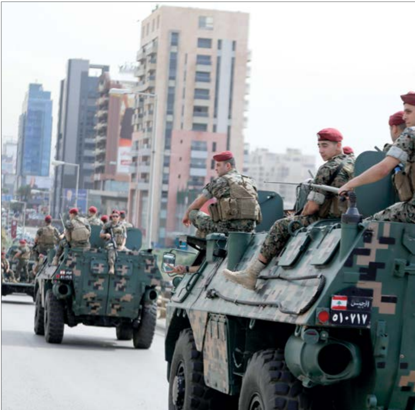
أخر الجيش عملية الدهم للتأكد من خلو المبنى من سكانه (مروان بو حيدر)

للمرة الاولى منذ انتهاء موجة العمليات الإرهابية في لبنان عام 2016 (تفجيرات القاع)، ويعد أقل من سنتين على تحرير الأراضي اللبنانية التي كانت تحتلها التنظيمات الإرهابية في جرد السلسلة الشرقية، شهد لبنان عملية نفذها «ذئب منفرد» من تنظيم داعش الإرهابي.