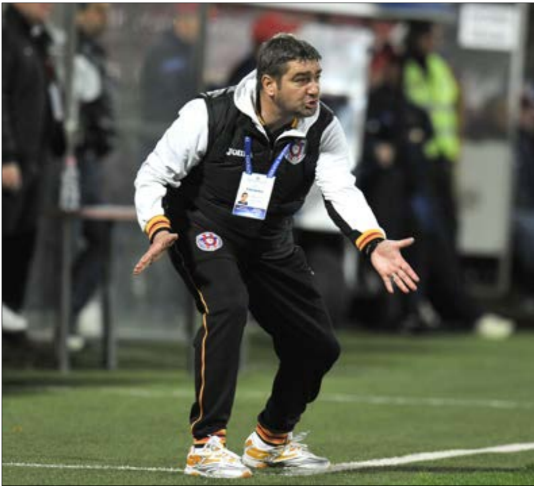
لا يملك المدرب الروماني خبرة ذاتية كبيرة (عن الوب)