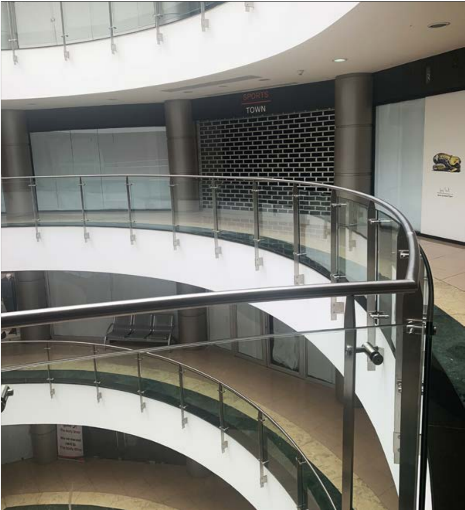
الهدوء، بات يختم على الـمول، الذي أقلل اكثر من نصف محلاته (تفريد الزبائن)

يقول موظف المبيعات في أحد المحلات الباقية إن تجربة The Spot باءت بالفشل في النبطية لأسباب عدة، أبرزها تردّي الحالة الاقتصادية بشكل عام، وعدم قيام إدارة المول بنشاطات تسويقية كافية لجذب السكان المحليين وبناء ثقة بينهم وبين المجمع الجديد. موقف تشاركه إياه موظفة المبيعات في متجر آخر تؤكد أنه عندما كانت الإدارة تنظّم