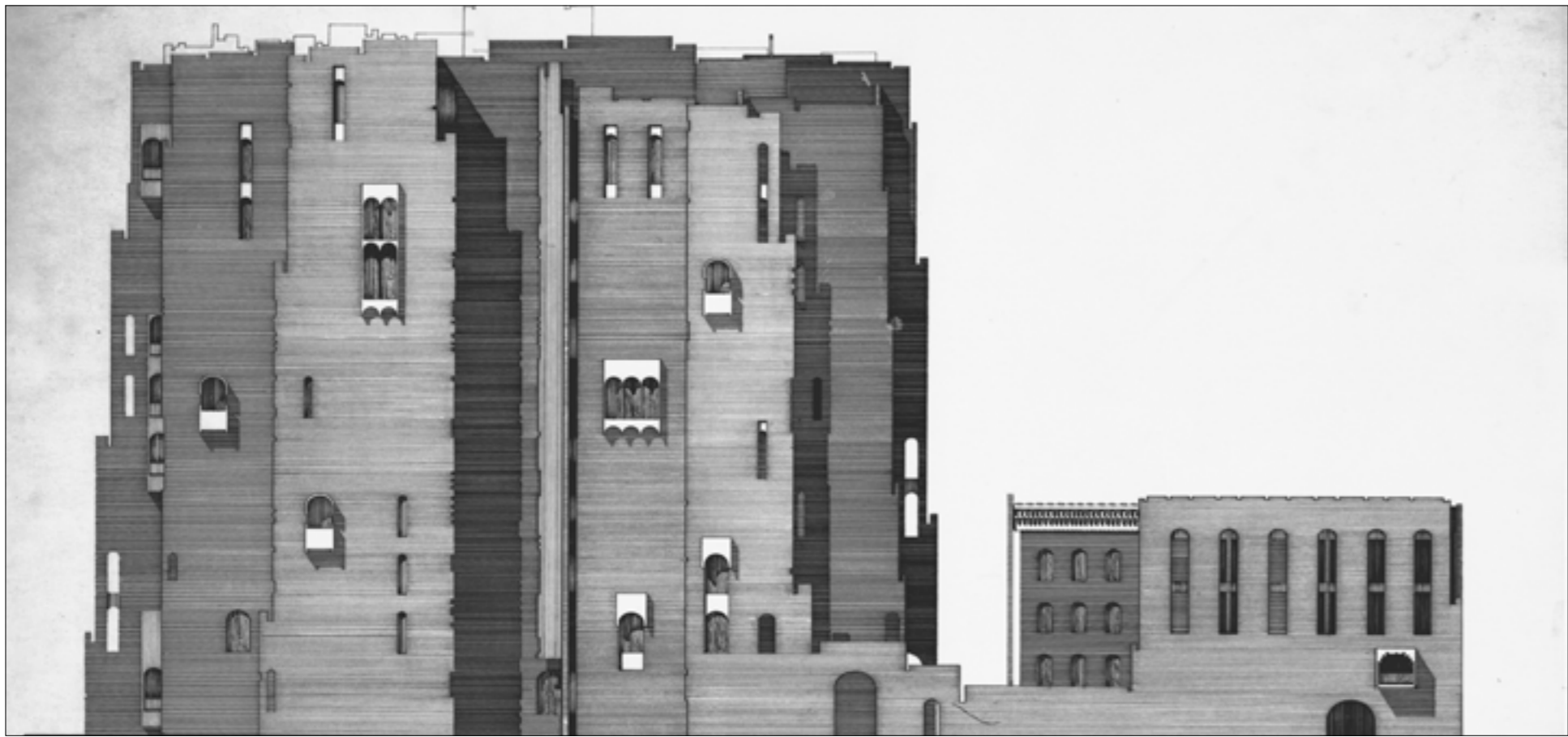
رصفة الجادري - وزارة البدييات والشؤون الريفية - بغداد 1965