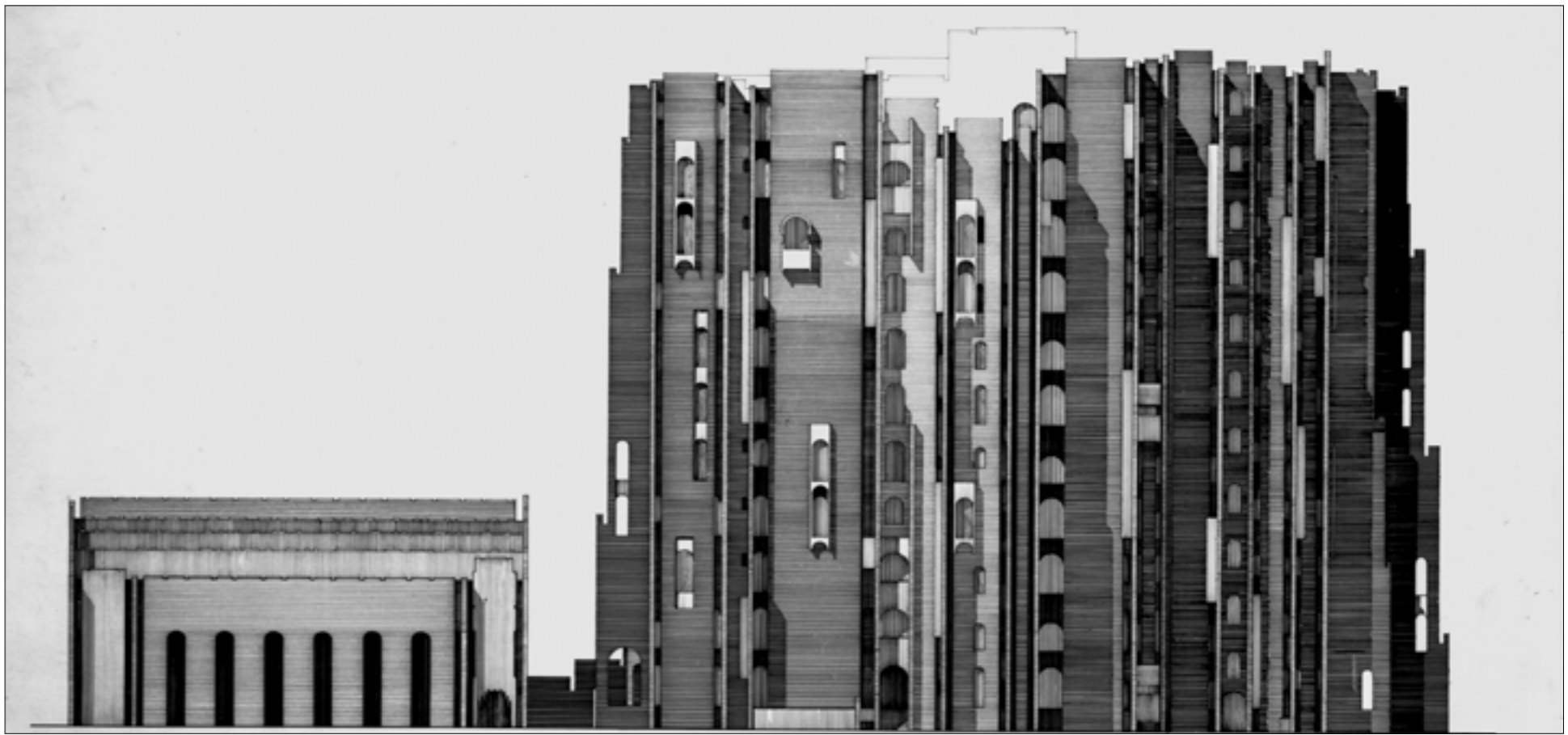
رصفة الجادري - وزارة البدييات والشؤون الريفية - بغداد 1965