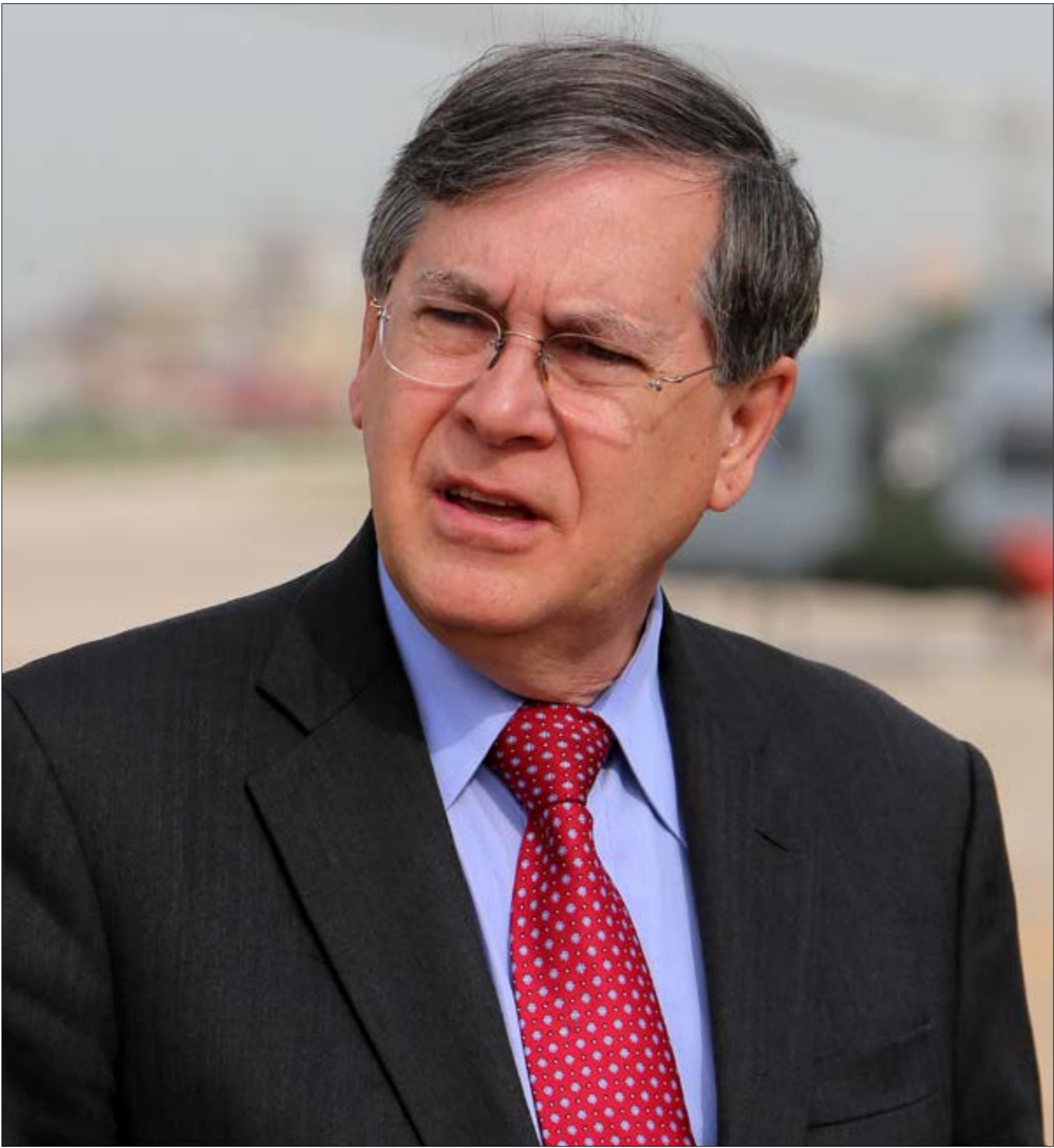
لعجة سائر فيلاد، كانت مرثمة وحادة في الحديث عن إيران وحزب الله، (ميلم الموسوي)

جاء مساعد وزير الخارجية الأميركية لشؤون الشرق الأدنى ديفيد سائر فيلاد في اليومين الماضيين، ملتقياً جميع الشخصيات السياسية الرئيسية التي تدور في الفلك الأميركي. الاستثناء الوحيد كان الاجتماع مع وزير الخارجية جيران باسيل، هدفه سائر فيلاد واحد: تجميع جبهة ضدّ حزب الله وتحذير من التعامل معه ومع إيران. الجولة الثانية من «التهديدات» والتحذيرات، سيتولى نفاها وزير الخارجية مايك بومبيو منتصف الشهر الجاري