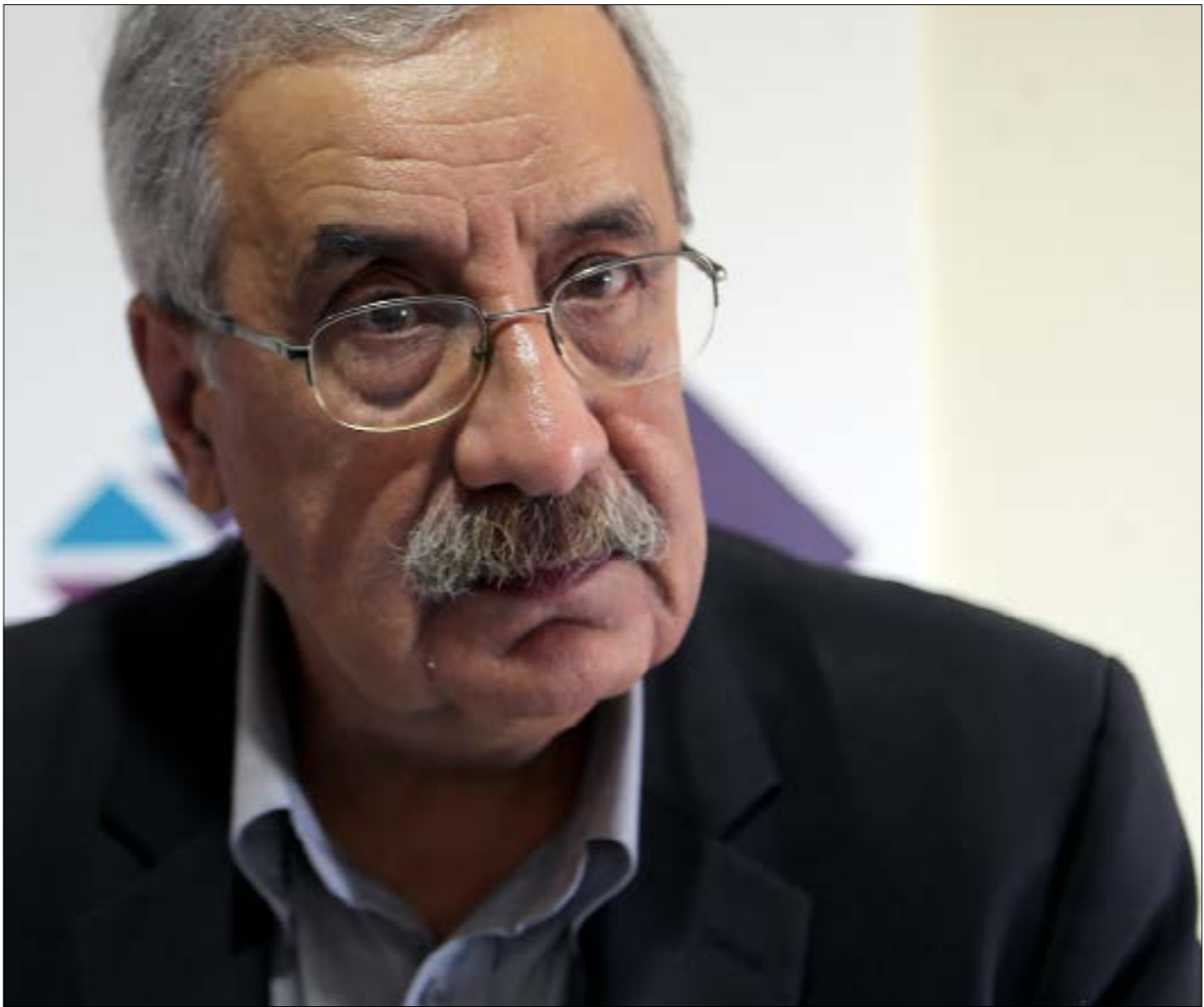
الإنفاق (رئب دينا عاما على الخزينة قد يصبح دينا جازرا بعد تدقيق الحسابات (مهيل الموسوي)

«قد تكون حسابات منظمات المافيات صحيحة بين نفاها وابرادتها وارصدتها، لكن هذا لا يثبت شرعيتها». هذا المنكاح بقدمه الوزير السابق شريك نحاس لمقاربة ملف الحسابات المالية. بالنسبة إليه، حتى الآن يجري التعامل مع إنجاز قطوعات الحسابات العائدة لنحو 26 سنة مضت على أنها تكشف عن مكامن الفساد والهدر، فيما هي ليست أكثر من عملية مطابقة محاسبية بين الإيرادات المحصاة والإنفاق الفعلي والرصيد. سواء أكان دينا ام غائبا، ضرورة إنجاز قطع الحساب تكتمت في أنه شرط للوصول إلى مرحلة التدقيق، حيث يجري التثبت من شرعية الحسابات