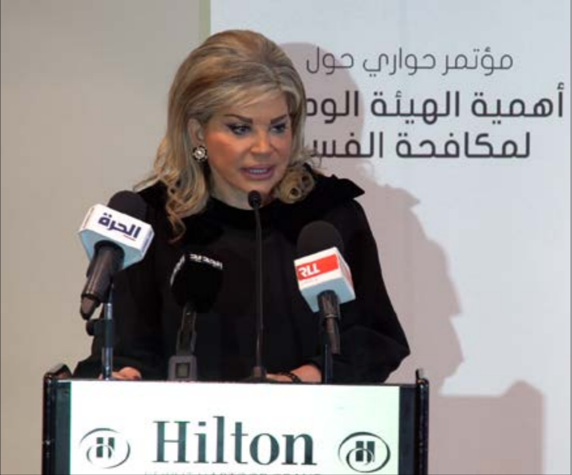
المؤتمر «الفساد»، كان برعاية وزارة الشؤون التنمية الإدارية في شدياق

ليرفع يده من قرأ منكم الإستراتيجية الوطنية لمكافحة الفساد؟ لم يرفع أحد يده. بدوا هذه المرة أشبه ب«عصابة» (مع سوء الظن) أو أشبه بهواة سنج (مع حسن الظن)... وسوء الظن من حسن الفطن. ذهب مخير أبعد في «لطشاته» القوية: «كتتير جمعيات للأسف لا تُأادر إلى خطوة إلا بتمويل وحجر فندق ومصاريف... قبل ما كنأ هيك، ما كانت الصورة هيك لما بلشنا من سنة 2006 ناقش موضوع الهيئة الوطنية لمكافحة الفساد». ارتبك المنظمون هنا، لم يعقلوا بكلمة هكذا، يبدو أن «المجتمع المدني» (أو فرع «المافيا» منه) قفز إلا فتوته «مهروجة» مكافحة الفساد. عما قريب سيسهر اللبنانيون بالرق في هذه الكلمة. لقد أصبحت الآن «ملجقة» والقيام أكثر «جلجقة». عما قريب سنفضّل بقاء الفساد على أن نسمع عن مكافحة. بالمناسبة، أحد «قادة» حملة «طلعت ريحتكم» كان حاضراً في المؤتمر. جلس بداية في المقاعد الخلفية، قبل أن يتقدّم إلى الأمام، ثم للاسف لا تُأادر إلى خطوة إلا بتمويل وحجر فندق ومصاريف... قبل ما كنأ هيك، ما كانت الصورة هيك لما بلشنا من سنة 2006 ناقش موضوع الهيئة الوطنية لمكافحة الفساد». ارتبك المنظمون هنا، لم يعقلوا بكلمة هكذا، يبدو أن «المجتمع المدني» (أو فرع «المافيا» منه) قفز إلا فتوته «مهروجة» مكافحة الفساد. عما قريب سيسهر اللبنانيون بالرق في هذه