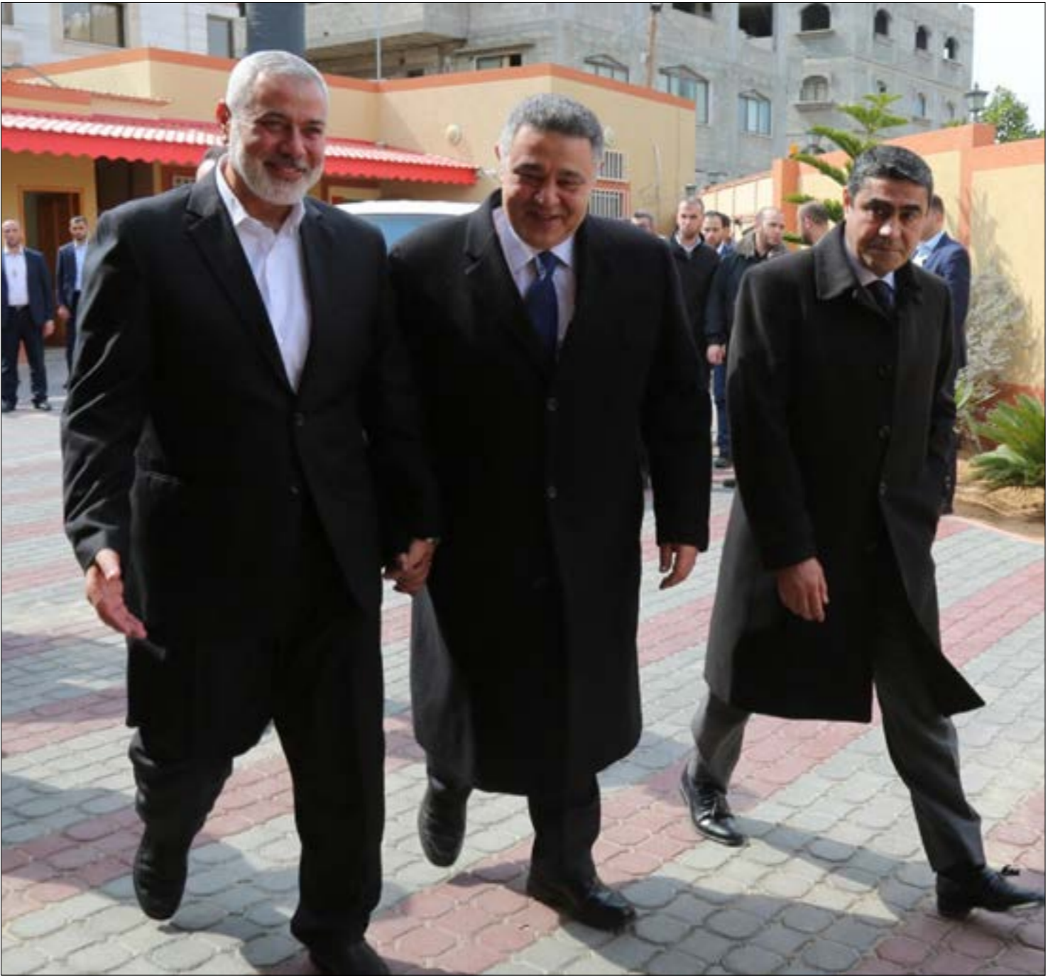
الوفد المصري هو الأرفع الذي يصل غزة منذ بدء «مسيرات العودة»

لا تزال الخلافات بين أقطاب حركة «فتح» على وراثة رئيس السلطة، محمود عباس، مستمرة، خاصة مع سعي كثيرين إلى ترسيخ نفوذهم تجهيزاً للحظة التي ستلي رحيل الأجهزة الأمنية، فيما شد فرج على مقرية من عباس إن «خلافات شديدة اندلعت داخل أروقة السلطة، أتت إلى تهديد عباس بقلب الطاولة على رؤوس الجميع»، قائلة إن «حجم المعلومات والتسجيلات الصوتية والتقارير الأمنية التي تصل إلى الرئيس تحتاج منه التفرد كاملاً لقراءتها والاستماع إليها». وحصلت «الأخبار» على تسجيل صوتي لعضو الجنتين التنفيذية لمنظمة التحرير، و«المركية لفتح»، عزام الأحمد، وهو في جلسة داخلية ورد فيها قوله إنه «أكبر من أبو مازن (رئيس السلطة) ومن رئيس الحكومة (رامي الحمدالله)». في حديثه، تشير المصادر، إلى أن «خلافات طاحنة» تدور بين عضو «المركية» جبريل الرجوب من جهة، وبين التحالف المستجد الذي يجمع نائب رئيس «فتح» محمود العالول،