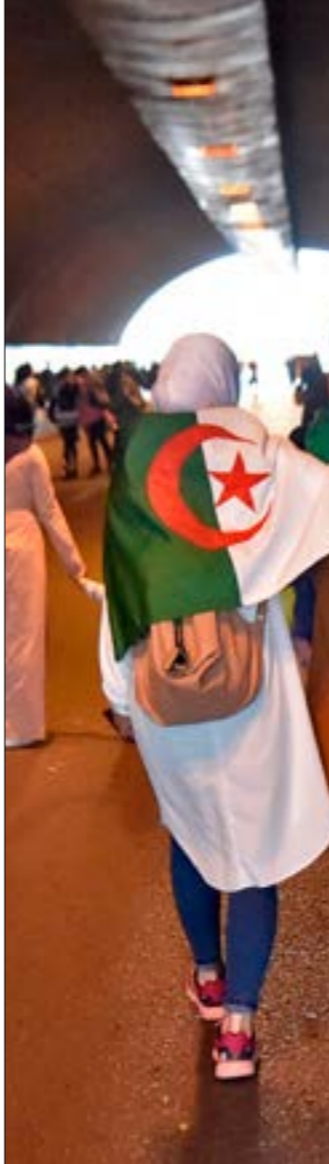
رسال «المهادنة» لم تخل من تأكيد المؤسسة العسكرية على دورها الساسي كـ«مقدّم»

«مهادنة» للمتظاهرين لأول مرة، مقارنة بتصريحات سابقة أدلى بها خلال زيارة إلى محافظة تمناست جنوب البلاد في 26 شباط/