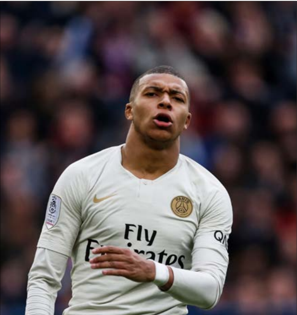
انضم النادي الباريسي اموالا طائلة على الصفقات

يقول فيرناندو غوميس أحد أبرز أساطير النادي البرتغالي بورتو، والذي يشغل اليوم منصب مدير الكشافين (أي المدير الرياضي) في النادي، والذي بالمنااسبة، يضم أربعة أعضاء مكسيكي الجنسية، «البرتغال بيئة جيدة لتجنب مواجهة ثقافية مع الدوريات الأوروبية الأخرى، وتعتبر بيئة مميّزة ومناسبة تماماً للاعبين القادمين من أميركا الجنوبية أو من أميركا الوسطى، أي أن نوعية اللاعبين التي