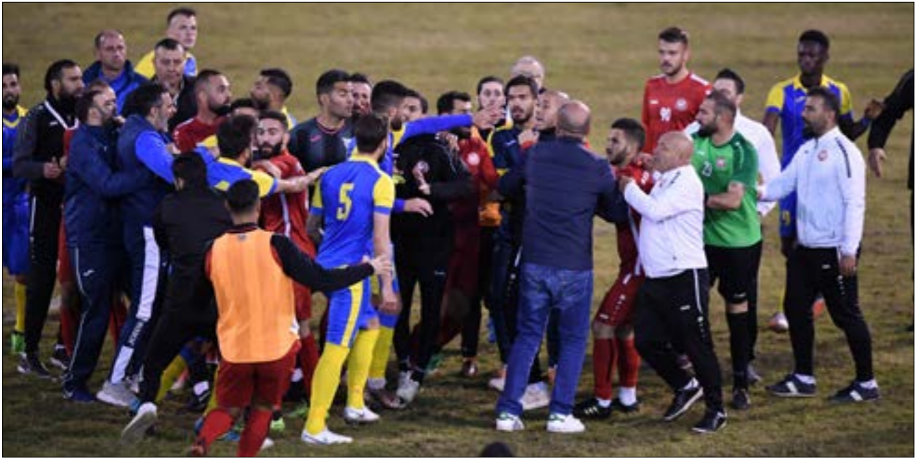
شهدت ارض ملعب بيروت البلدي إشكالاً كبيراً بعد نهاية المباراة

بل لأغلب مواطني الأميركيين، الكثير من الخصائص المشتركة بينها وبين بورتو، والذي من الممكن أن ينتج عنه بالنسبة إلى الغريم التقليدي بنفخكا، حيث ينسجم البرازيليون أكثر من المكسيكيين، وذلك بحكم اللغة المشتركة بين البلدين. وهذه القاعدة لا تستثني اللاعبين الأرجنتينيين أيضاً. مباراة اليوم بين بورتو وصاحب الأرض ونادي العاصمة الإيطالية روما (22:00 بتوقيت بيروت). سيسشارك فيها بكل تأكيد كل من: زميله هيريرا وخيسوس كورونا، ومعظم اللاعبين البرازيليين، يتقدمه الظهير الأيسر المميز ألكس تيليس، والمهوب الصغير أوتافيو مونتيرو. مباراة سيمتلي فيها ملعب «راغاو» عن آخره، مساندة أبناء بلدهم ومشاهدة من اصبحوا جزءاً من هذا البلد أيضاً، يفوزون ربما على روما، ولم لا، التأهل إلى الدور المقبل؟ كل ما يحتاج إليه الفريق هو الفوز بهدف نظيف، وهو ما يعد مهمة ليست مستحيلة.