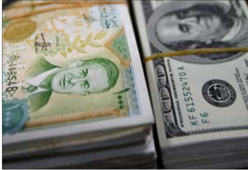
النمو في الأرباح مرتبط بنحسّ سعر صرف الليرة السورية مقابل الدولار الأميركي

في مؤشر لامتداد، حققت المصارف السورية ذات المساهمات من مصارف لبنانية أرباحاً عام 2018 بعد تسجيلها خسائر ملحوظة عام 2017. الأرقام قد لا تحتمل المبالغة في الاستنتاج والتأويل كما تفيد مصادر مصرفية مظلّمة، إلا أنه أيضاً يمكن غض النظر عنها. كونها تبيّن تحسناً واستقراراً في الظروف الأمنية والاقتصادية في سوريا