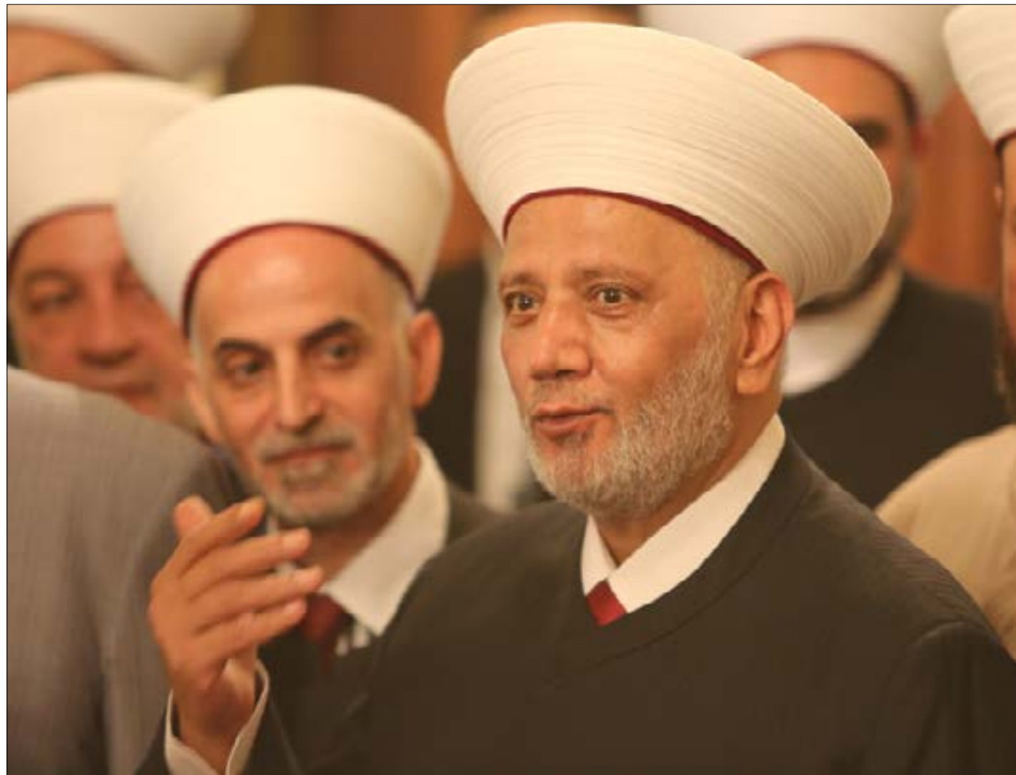
ديوان: السنيورة خط احمر (مرنان طحطح)

ولم يُحسم بعد إذا ما كان المرشّح لخلافة خوري سيكون من قضاة مجلس الشورى أو من القضاء العدلي، ويبحث ملف التعيينات بصورة حثيثة (وسرية) بين رئيس الحكومة سعد الحريري والوزير جبران باسيل. وإذا كانت القوى المشاركة في الحكومة تعد اللبنانيين