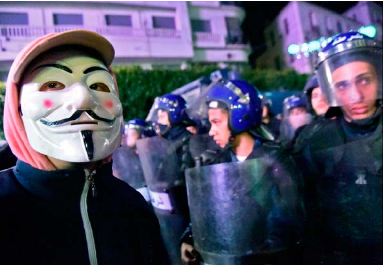
دخلت نقابات المحامين في ولايتي قسنطينة والأغواط في صياح مندب

على أهدافه وتضحياته، ومحاولة لتمدد عمر هذا النظام». ويسود انطباع لدى المعارضة والمواطنين الراضين لترشّح الرئيس بأن ما أعلن هو محاولة فقط لإسكات الحراك الشعبي، بتقديم عود بان بوتفليقة لن يمكث على الأكثر سوى عام إضافي بعد الانتخابات المقبلة، ثم الانقلاب على ذلك بعد أن يخمد هذا الغضب، بمعنى أن السلطة تراهن على عامل الوقت لإضعاف الحراك وتقسيمه، ويستشهد المشككون في نيات الرئيس الحقيقية بما جرى في سنة 2011، عندما تعهد في خضم أحداث ما يسمى «الربيع العربي» بإصلاحات جذرية، ثم تنصّل من ذلك في ما بعد، معزّزاً موقفه