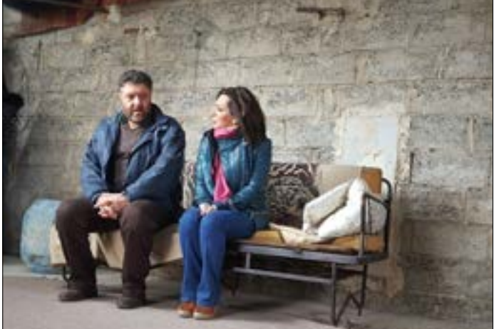
أمك عرفة فادي صبيح في صلب من الشريط

عزف منفرد» (2018) الذي شاهدناه أخيراً في «سينما سبتي» في دمشق. هناك تقاطعات واضحة في بناء الحكمة والاشغال على ثيمة بسيطة وشحنها بجرعات كوميدية مشبعة، مراهناً على مهارة البساطة لا مهارة التقعيد، في سرده البصري الموازي لصناعة المفارقة التي تنطوي على حسن ريفي أصيل في المقام الأول. حتى في حال اشتبكت بعض أفلامه بوضوحات مدينية (العاشق) مثلاً. هكذا أحط عبد اللطيف عبد الحميد، قبلما وراء آخر، بصمته الشخصية المستعمون، و«سائل شفهيّة»، و«سبح الروح» عن شخص أفلامه حتى الريق الأخير، بنوع من النبالة، متنكاً على مخزون ثري من المفارطة الحياتية عن بشر مهلين ومسنين، بالكاد تلتفت إلى مكابدهم لكن عدسة مكبرة سنضيء حيواتهم من الداخل من دون مراوغة. ليست الذاكرة الشخصية وحدها ما يعيد البريق إلى هؤلاء الهامشيين، إنما فيخبره الصديق بأنه انتهى إلى