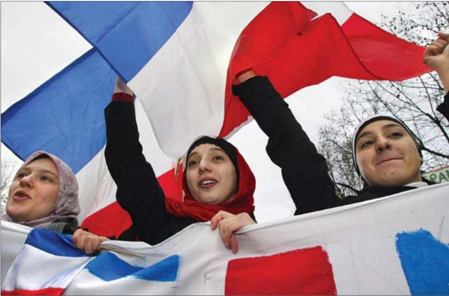
العنصرية الفرنسية ليست جديدة ضد المسلمين والمهاجرين (أرشيف)

غرفة ملابس مدريد غير مشتركة (خافيير سوريانو، أ. ف. ب.)