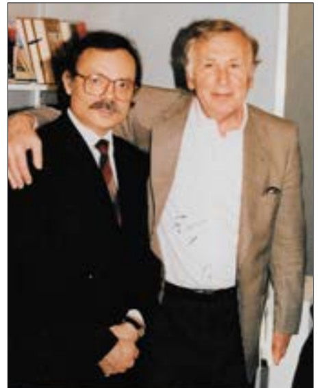
مع نزار قباني (لندن - 1987)