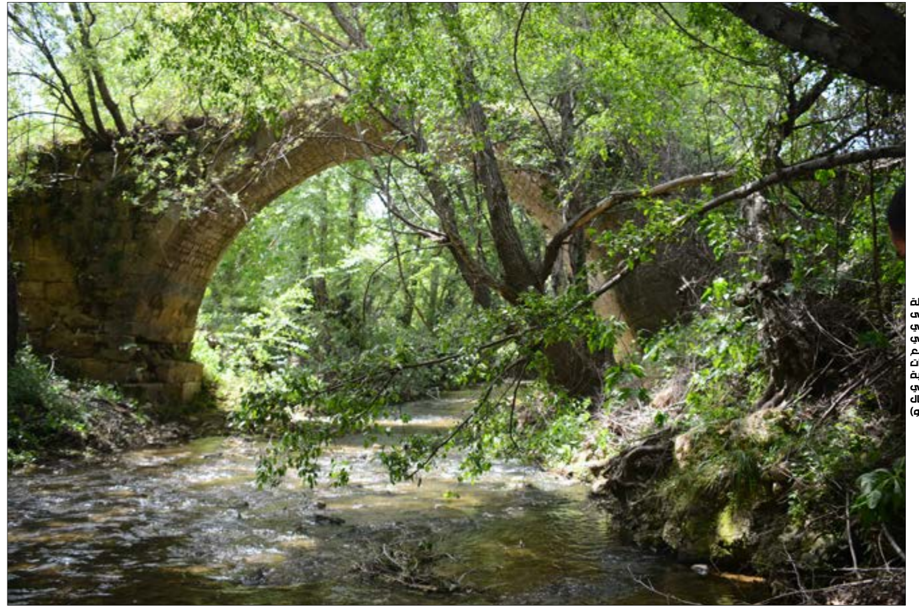
ندو السلطة ماضية الى تكرار جرميها بقتل جنة وادي بسري مع بدء التحضيرات الميدانية للمباشرة في الأشغال