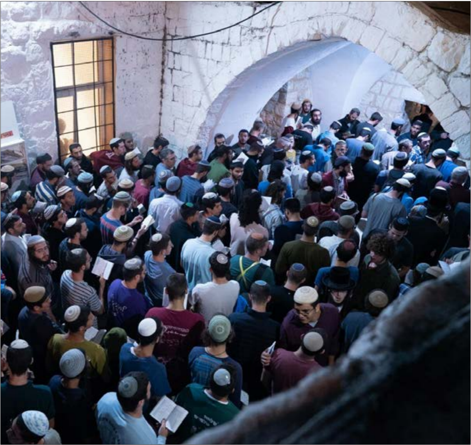
امتد الاستغلال السياسي لـالتوراة، ليطاول نحو 23 مقاما في الضفة

من أبرز العوامل التي تحول دون مقاومة فعّالة هناك، كما يرى مراقبون، تغير نظرة المجتمع الفلسطيني إلى هذه المقامات، فالنظرة السائدة في الماضي جنحت نحو «التصوف» وتقديس الأولياء «الصالحين»، ولذلك كانت هذه المقامات والقبور تحظى باهتمام مجتمعي ويتقرب إليها الناس ضمن