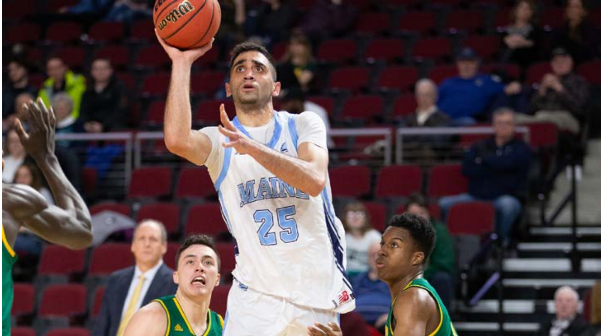
سكك الدرويش ما مصله 15.3 نقطة في المباراة الواحدة هذا الموسم (الرياضة)

وعلى رغم التركيز على مسيرة مميزة في الملاعب الأميركية، لا يسقط الكلام عن البدايات وعن لبنان