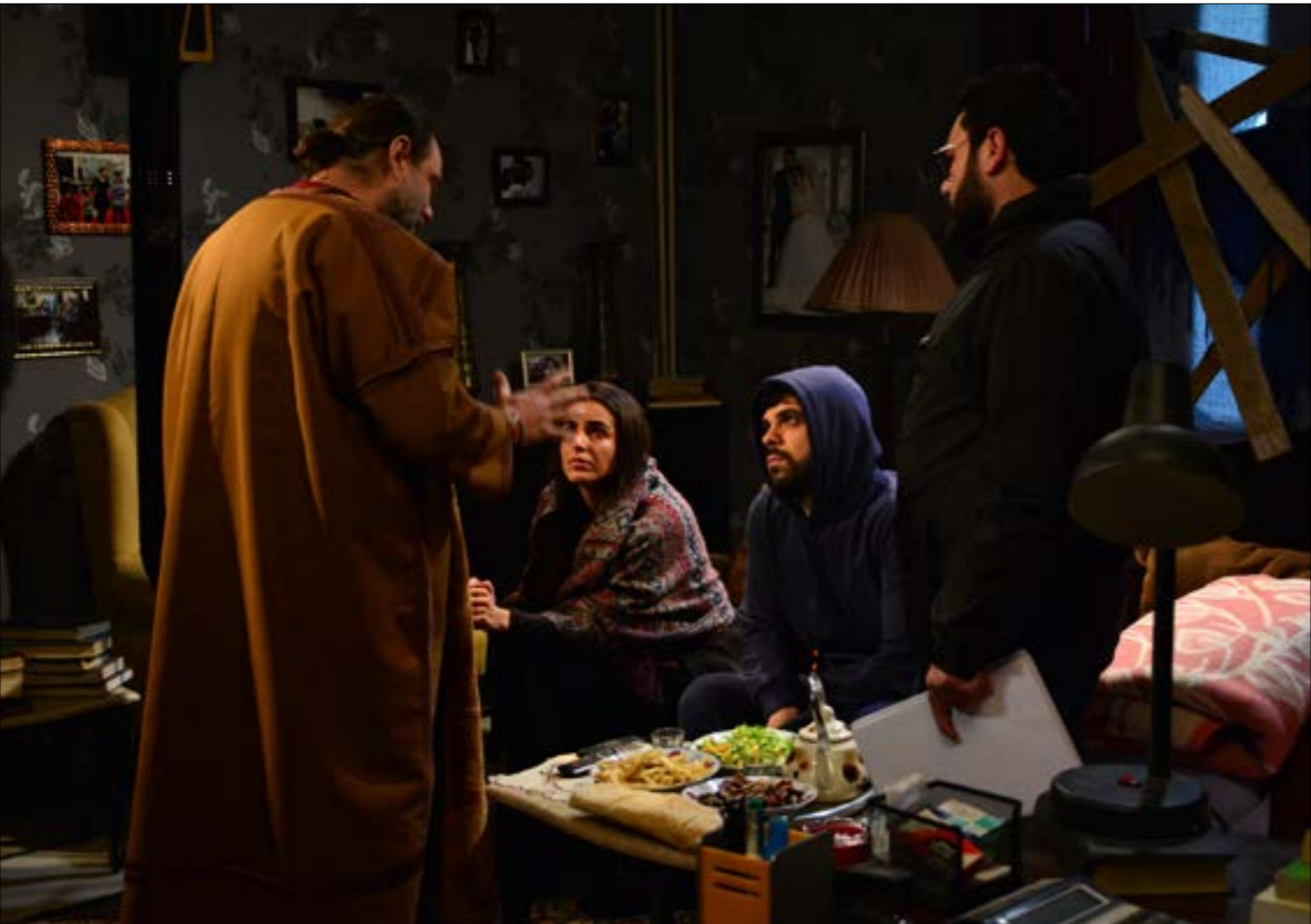
يلعب دوري البطولة السوري بزن الخليل واللبنانية ربي زعرور

يقول ساهر اسماعيل في حديثه مع «الأخبار»: «كتبت هذا السيناريو عام 2013 واستغرق الأمر قرابة 14 شهراً متواصلة. لا أعرِف إن كنت قادراً على استعادة السهرات المضيئة مع رجل وامرأة لم أطلق عليهما أسماء. لقد كانت الأحداث في البلاد تدخل عالمها الثالث. كتبت هذا الفيلم عن حمص التي كانت قد تقدمت في الجرح أكثر من دمشق التي كانت تدخل للمرة