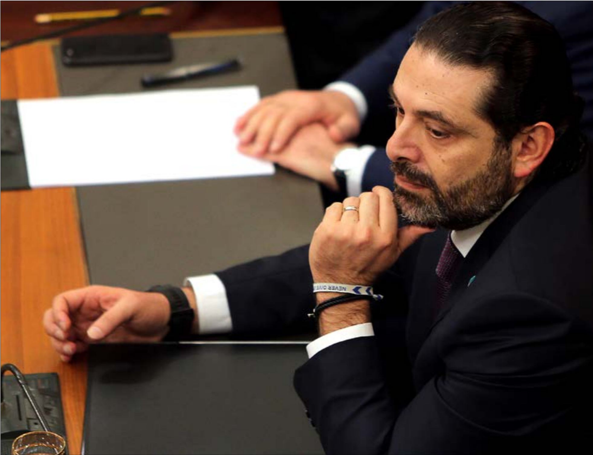
أغلب النواب يستغلون منبر مجلسهم لتسجيل مواقف، وكانهم من كوكب آخر (هيلم الموسوي)

الخامسة بعد جلسة استمرت أكثر من 8 ساعات... ختمها الحريري ردا على مداخلات النواب بالدفاع عن المصارف و«سيدر»