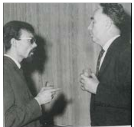
مع سعيد عقل