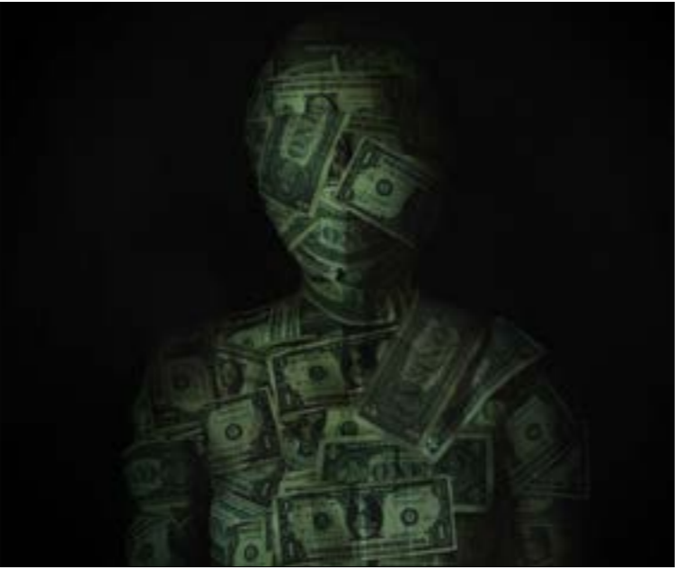
أحد المعوقات الضخمة أمام الحرية الاقتصادية في لبنان حسب التقرير هو الصبء الضريبي

وعلى مستوى منطقة الشرق الأوسط وشمال أفريقيا، حلّ لبنان في المرتبة 12 من أصل 14 دولة (من ضمنها