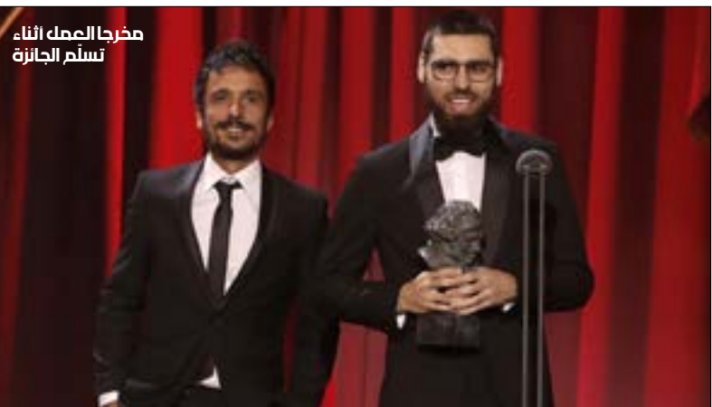
مخرجها الصمك أثناء تسلم الجائزة

توّج الفيلم الإسباني «غزة» (18 د) أوّل من أمس بجائزة «غويا» لعام 2019 (تنظيم الأكاديمية الإسبانية للفنون والعلوم السينمائية) عن فئة «أفضل فيلم وثائقي قصير» خلال الاحتفال الثالث والثلاثين الذي جرى في إشبيلية. «إلى أولئك الذين أسهموا في الحفاظ على استمرار كفاح الشعب الفلسطيني... إلى أولئك الذين ما زالوا على قيد الحياة وأولئك الذين رحلوا... وإلى كل من واجه الإرهاب الصهيوني». هكذا أعرب المخرج خوليو بيريث ديل كامبو عن سعادته بالفوز أثناء وجوده على المسرح برفقة شريكه في العمل كارليس بوبرمارتينيث لنيل من جهته، تطرّق كارليس إلى العقبان التي واجهها الشريط. بعد إهداء العمل إلى كل الذين أسهموا في