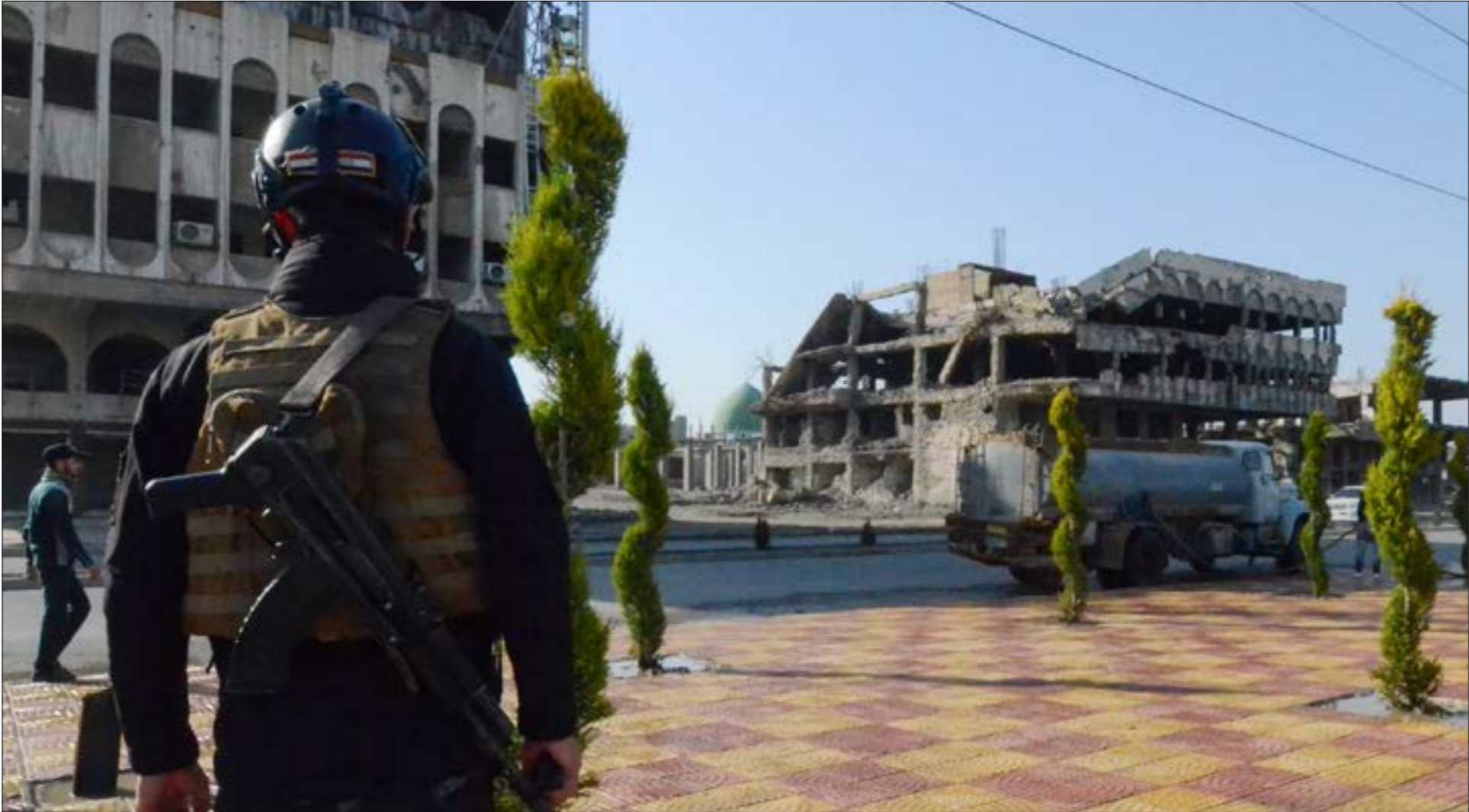
العراف، وبعد انتصاره على تنظيم «داعش»، لم يعد يحتاج إلى أي وجود أجنبي، مع تلوّم تشكيلاته العسكرية

الساعدي، كرز اسس دعوته، معتبراً إصدار القانون «ضرورة وطنية بعد تصريحات ترامب الأخيرة»، لأن الهدف منه «الحفاظ على السيادة الوطنية، التي تنتهك مراراً بسبب ممارسات القوات الأميركية ووجودها». أما «البناء»، وتحديدا «الفتح»، فليس بعيداً عن خطوة مماثلة، صمّارده، في حديثها إلى «الأخبار»، تؤكّد أن «أوابه يعدون قانوناً مماثلاً يتلاقى مع المقدم من قبل سائرون»، إن تنصّ