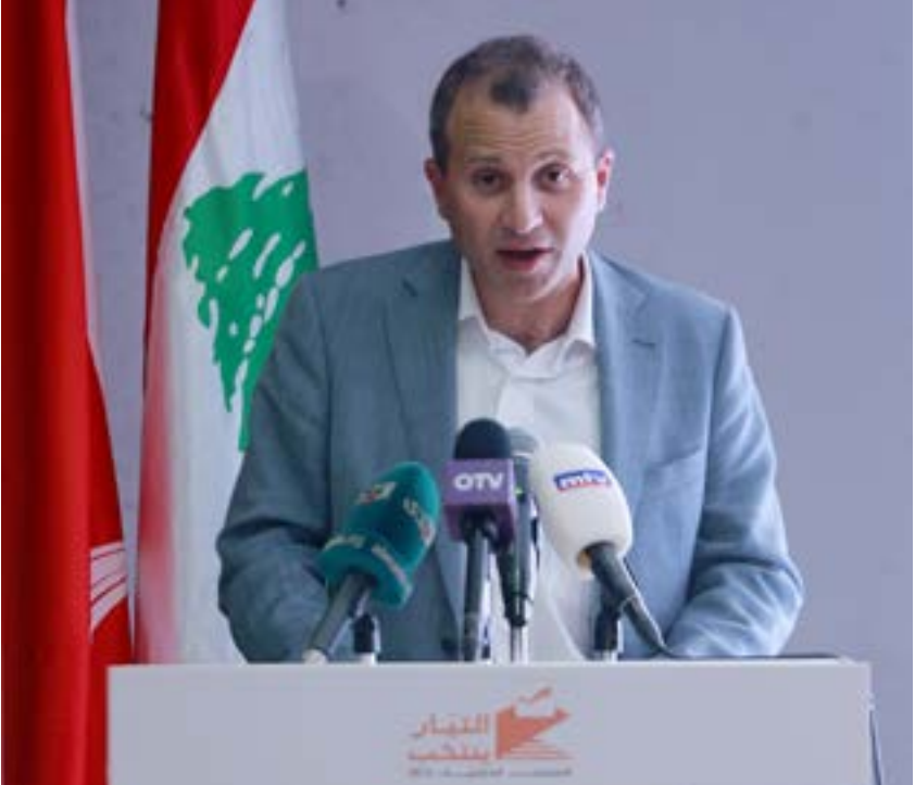
باسم فخهم بالمرحلة فيما محاربه لتوقع نتائج اتصالاته في غضون أيام

فيما تستكمل دوائر القصر الجمهوري في بعيداً إجراءات التحضير لـ«القمة العربية التنموية: الاقتصادية والاجتماعية»، التي تعقد في بيروت بين 16 و20 كانون الثاني الجاري، تخضع هذه القمة للردود من زاويتين؛ الأولى، مستوى الحضور العربي، وكيفية التعامل اللبناني مع مسألة دعوة سوريا للمشاركة. في الأولى، لم يتضح الأمر تماماً. الملك الأردني عبدالله اعتذر عن عدم الحضور، الرئيس المصري عبدالفتاح السيسي كان قد أكد حضوره شخصياً، لكن هذا الأمر لم يعد مؤكداً. يُضاف إلى ذلك أن السعودية لم تبلغ لبنان بعد بمستوى تمثيلها. وبحسب مصادر دبلوماسية، فإن كلًا من الإمارات والبحرين سلتزّمان بمستوى التمثيل السعودي، وعلى هذا الأساس، جرى التداول أمس بشأنعات تفيد بأن لبنان قد يطلب تأجيل القمة، لكن مصادر في وزارة الخارجية نفت ذلك بناتاً، علماً أن القصر الجمهوري وزّع أمس على وسائل الإعلام جدول أعمال القمة