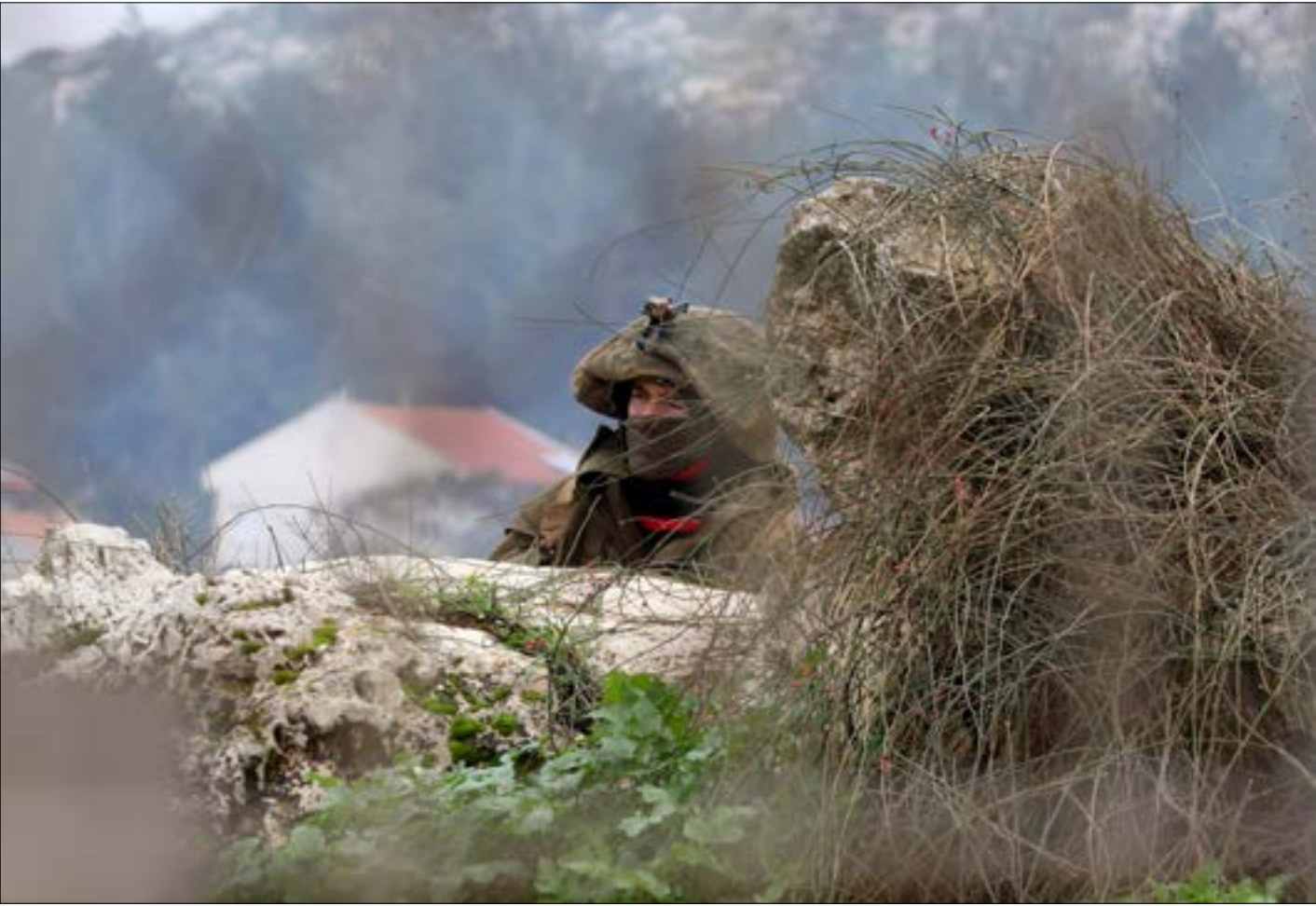
ما يلتمس إسرائيل من المعتداء هو خشيما من «الرد التناسي»، وما يمكن أن يعقبه من تحرج

يُريد العدو أن يعتدي على لبنان، ثم يريد من المعتدي عليه ألا يردّ، هروباً بذلك اسلوباً خرافياً للابتعاد عن الحرب. ربّما تكون الحافزية للحرب لدى إسرائيل زادت أخيراً، ففي الخطابات والبيانات، لكنها تدرك تماماً أن حزب الله لن يجارها بـ«ردّ شكلي»، على اعتداءاتها، كما أكد مرارة السيد حسن نصرالله، وبالتالي هي تخشى «الرد التناسي» وما بعده