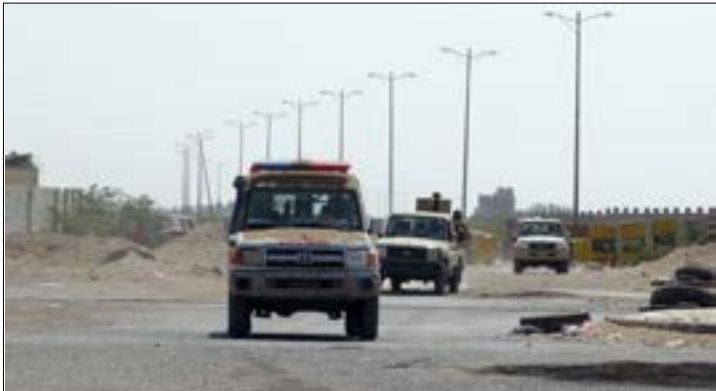
استخدمت الميليشيات المدعومة إماراتياً تعزيزات كبيرة إلى جنوب الخط الساحلي

وعلى النقيض مما يبدو خلافاً أميركياً ـ تركياياً، تؤكد المصادر نفسها وجود «تنسيق