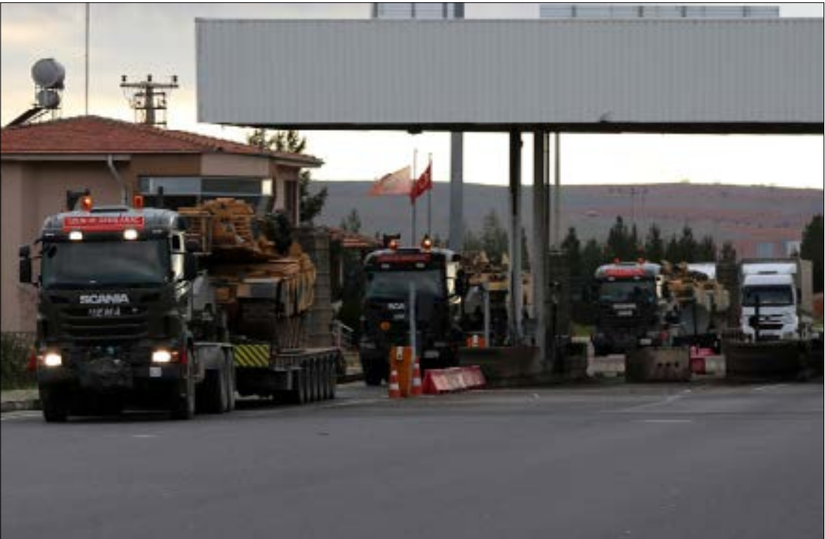
وصلت تعزيزات عسكرية تركية جديدة إلى ولاية شاليق ايروة (الناضوج)

حول نظامها القضائي تلك الشكوك، ولذا فهي أعلنت أن محامي الموقوفين حضروا الجلسة الأولى، و«نمّ» تمكيبهم من مهلة طلبوها للإجابة على ما ورد في لائحة الدعوى». وفق ما ورد في بيان النيابة العامة. كما أن هيئة حقوق الإنسان» التي أنشأها النظام السعودي كأداة لتبليل للعدالة المقترضة في الملكة، حضرت الجلسة هي الأخرى، وكان انطباعها ـ كما في كل مرة ـ أن «العدالة ستأخذ مجراها، وأن كل من شارك في هذه الجريمة