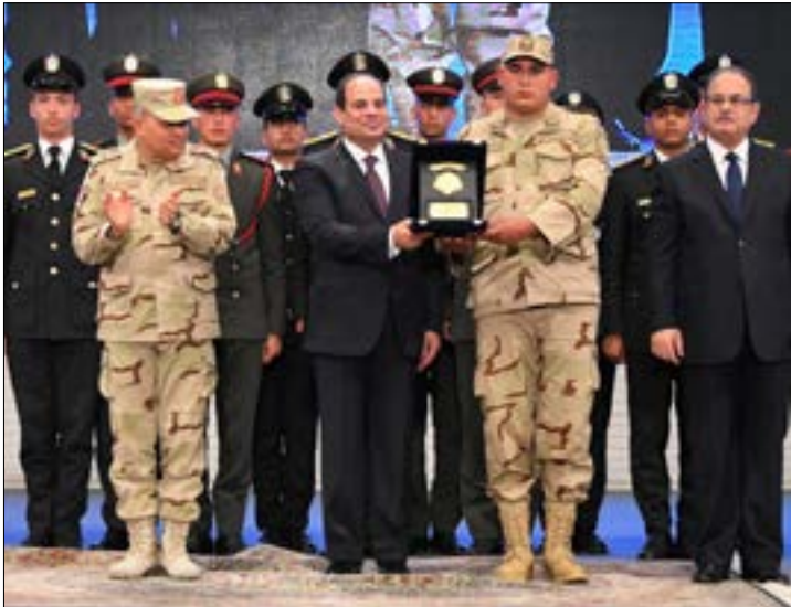
لا يريد الجيش تكرار تجربة مرسي ومحج، رئيس مدني غير محكوم بتوجهاته

عملاً في السلطة التنفيذية». وإن كان الهدف من الفكرة التي طرحت في عهد عبد الناصر للمرة الأولى مع احتفاظه بالسلطة، فإن الهدف هذه المرة هو تحصين الرئيس نفسه وقادة نظامه وتقليص صلاحيات الرئيس المقبل، ووضعه تحت قبضة الجيش طوال الوقت، قبضة تستجمل منه دمية بحركتها شركاء آخرون في الحكم لم يخترهم أو يمنحهم المواطنين أصواتهم في الانتخابات، على أن ما يحكى حالياً قد لا يتعدى «جنس النض».