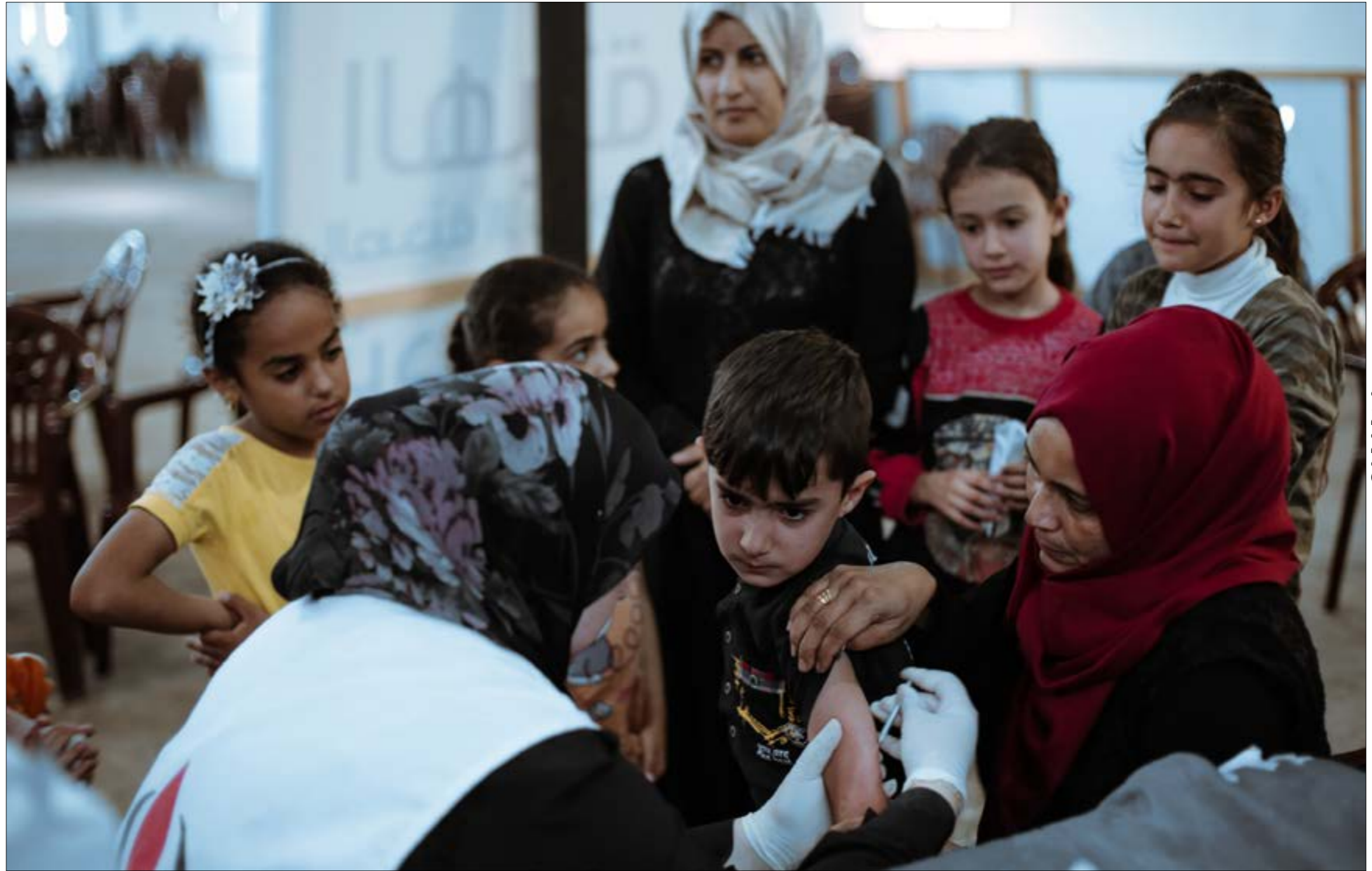
ابن عواصم التسرّب: نعد المراكز الطبية عند إصفاة التلقيح لدى الأهالي