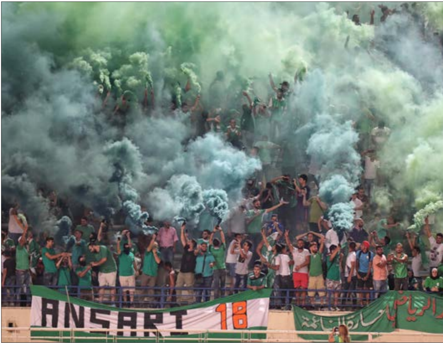
يهدف بحر لمنه الخيرة للمعيت محمديت (الرفيف، عدنان الحاج علي)