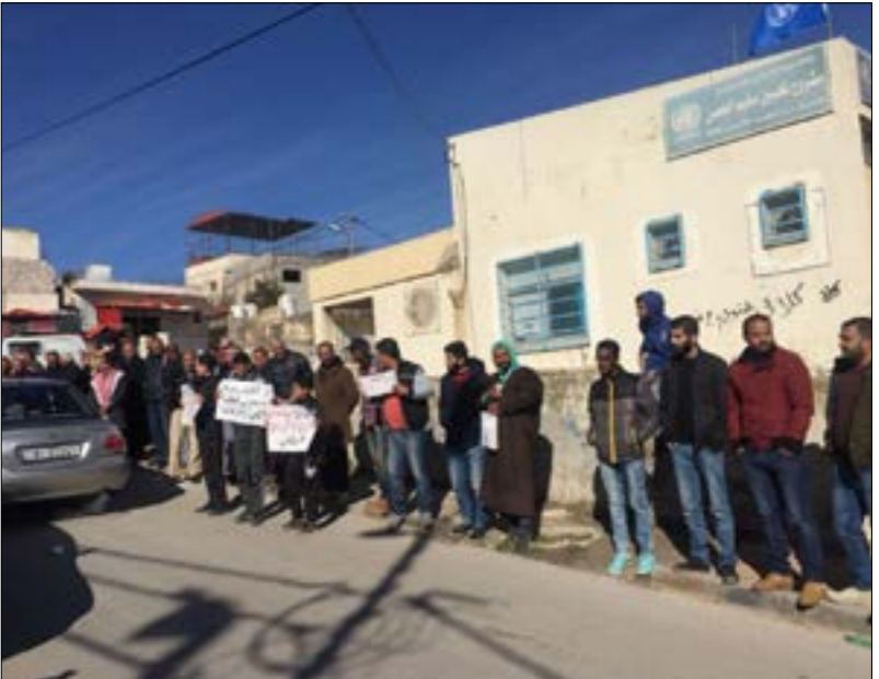
لا يمكن اخذ اي خطوة حتى لو كانت مطالب سلمية كمصادفة في هذه المرحلة