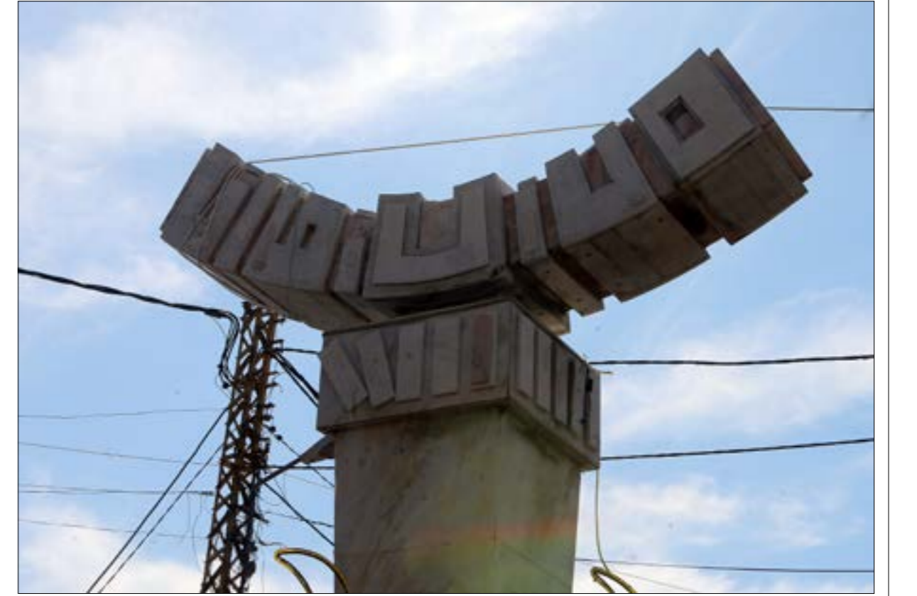
منحوتة «الاخوة» نافذة الصليب