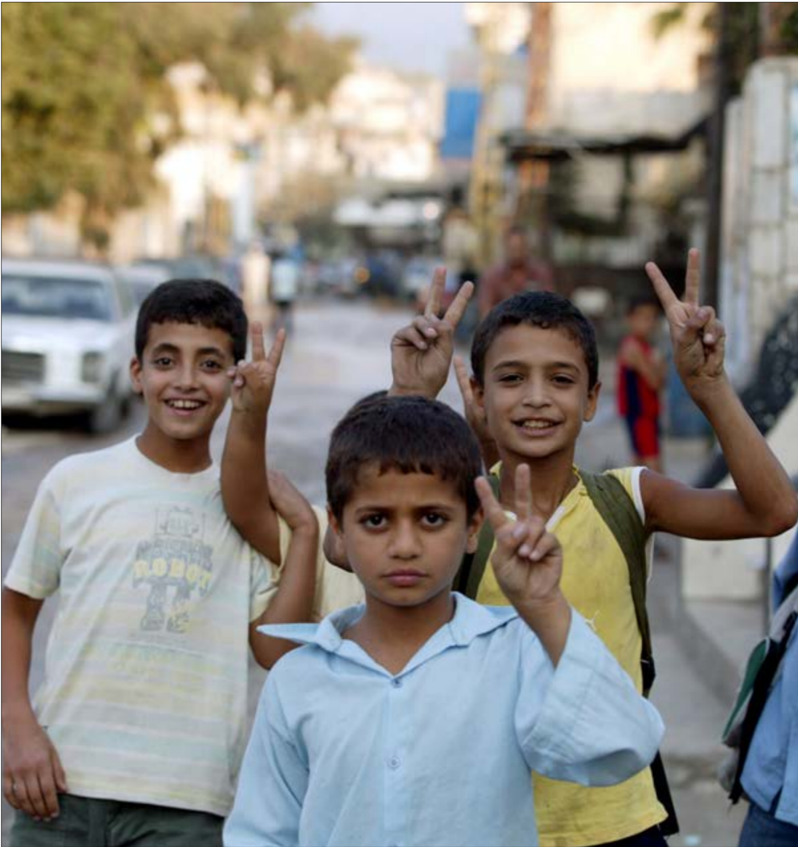
المرسولون الامنويات بعمليات عن سعي مطلوبين الى دخول المخيم

جلسة قبل نهاية العام. وأنت هذه المحاولة التي صوّرت بالإنقاذية تعويضاً عن مخرج كان قد طرحه النائب نواف الموسوي، في الجلسة الصباحية، دعا فيه إلى إدخال الاقتراح في البند 14 من جدول الأعمال المتعلقة بتعديل بنود في قانون الإجراءات الضريبية، إلا أن سحب رئيس الحكومة للمشروع (البند 14) حال دون تمرير الاقتراح وتعود مبررات العجلة في إقرار هذا القانون، الذي بدأ مستغرباً عدم وروده في جدول أعمال الجلسة التشريعية، إلى أن لبنان كان مهدداً بوضعه على اللائحة السوداء للدول غير المتعاونة في مسألة تبادل المعلومات الضريبية،