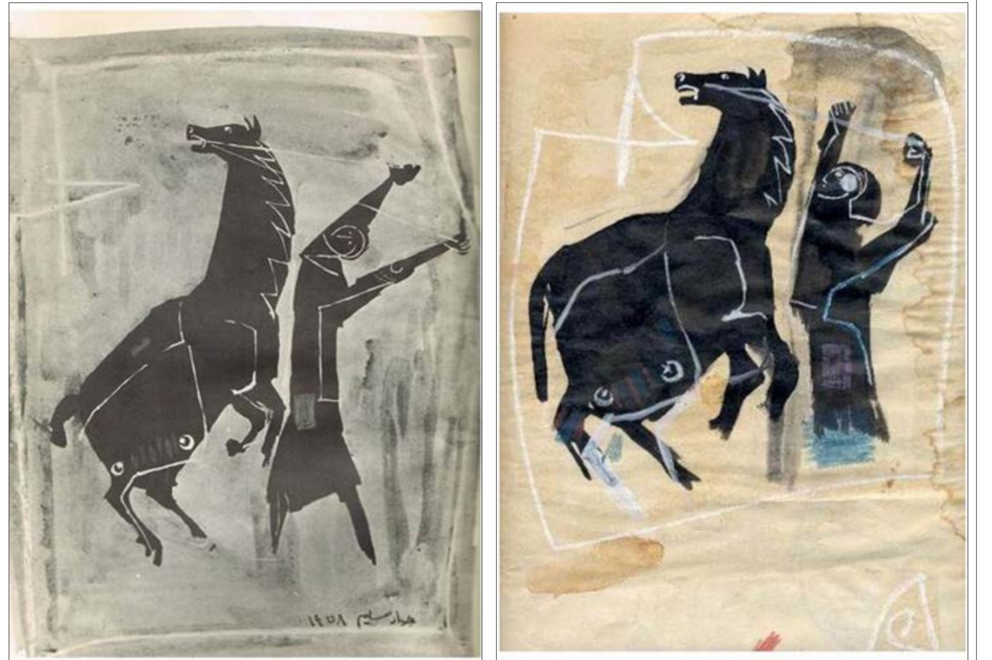
صورة تظهر العمل الأصلي (يسار) لجواد سليم، إلى جانب ذلك المزور