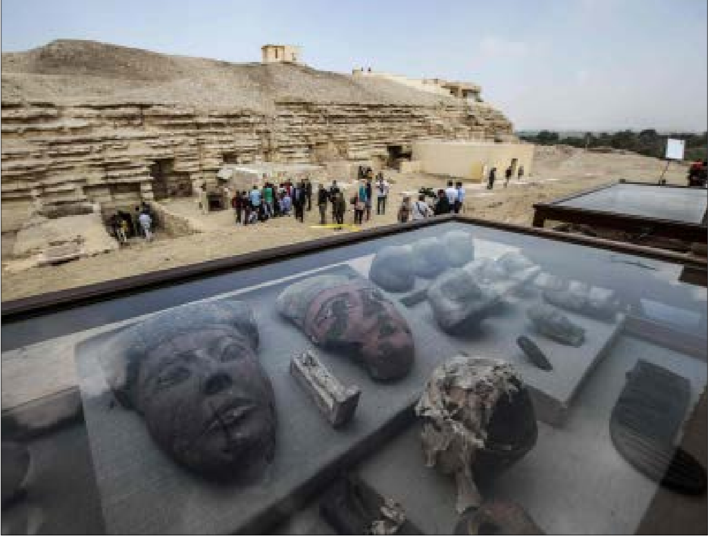
لتأخذ مصر روابطها التاريخية الحضارية وروابطها المحلصة-الآنية في الوقت نفسه

إنه العمل على إصمام مصر في دورة اقتصادية – إقليمية على البحر المتوسط، وربما عبر مشروع التحول إلى مركز إقليمي شبه دولي لوجسيتي لتداول الغاز، بالتشجيع وإعادة التصدير. ويتم ذلك عبر شبكة تعاون استراتيجي متوسطي تشمل قبرص وإسرائيل واليونان، وتمتد أذرعها إلى الضفة الأخرى للبحر ضمن مشروع أشمل للاتحاد من أجل المتوسط، وربما سعياً لامتداد أبعده من ذلك للمساهمة في إمداد أوروبا الغربية بالغاز. وتدخل مصر بذلك في سوق تنافسي صراو مع الغاز الروسي الممتد من السبل الشمالي، عبر الخليج، مروراً بالخط العربي عبر أوكرانيا، وصولاً إلى مشروع «السيبل الجنوبي» بالتعاون مع تركيا. وغير بعيد أيضاً مشاريع تجدير الغاز الإيراني