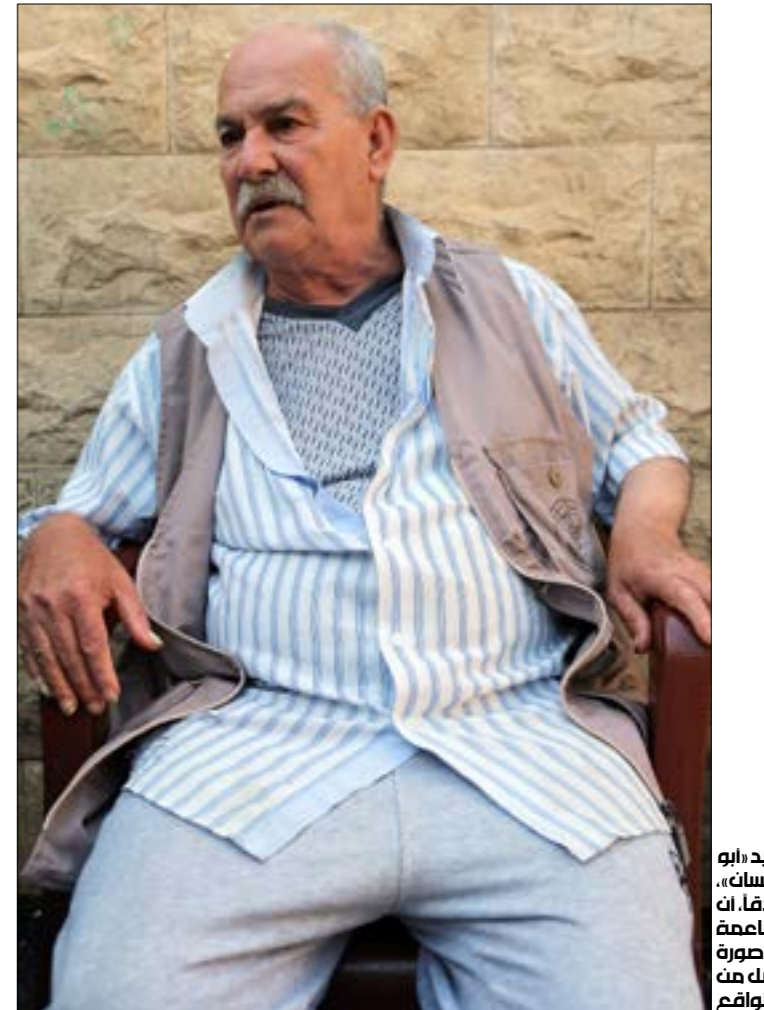
ربيد أبو غسان، صانعاً، ان رسم للناعمة وحارتها صورة اجتهت من الواقع