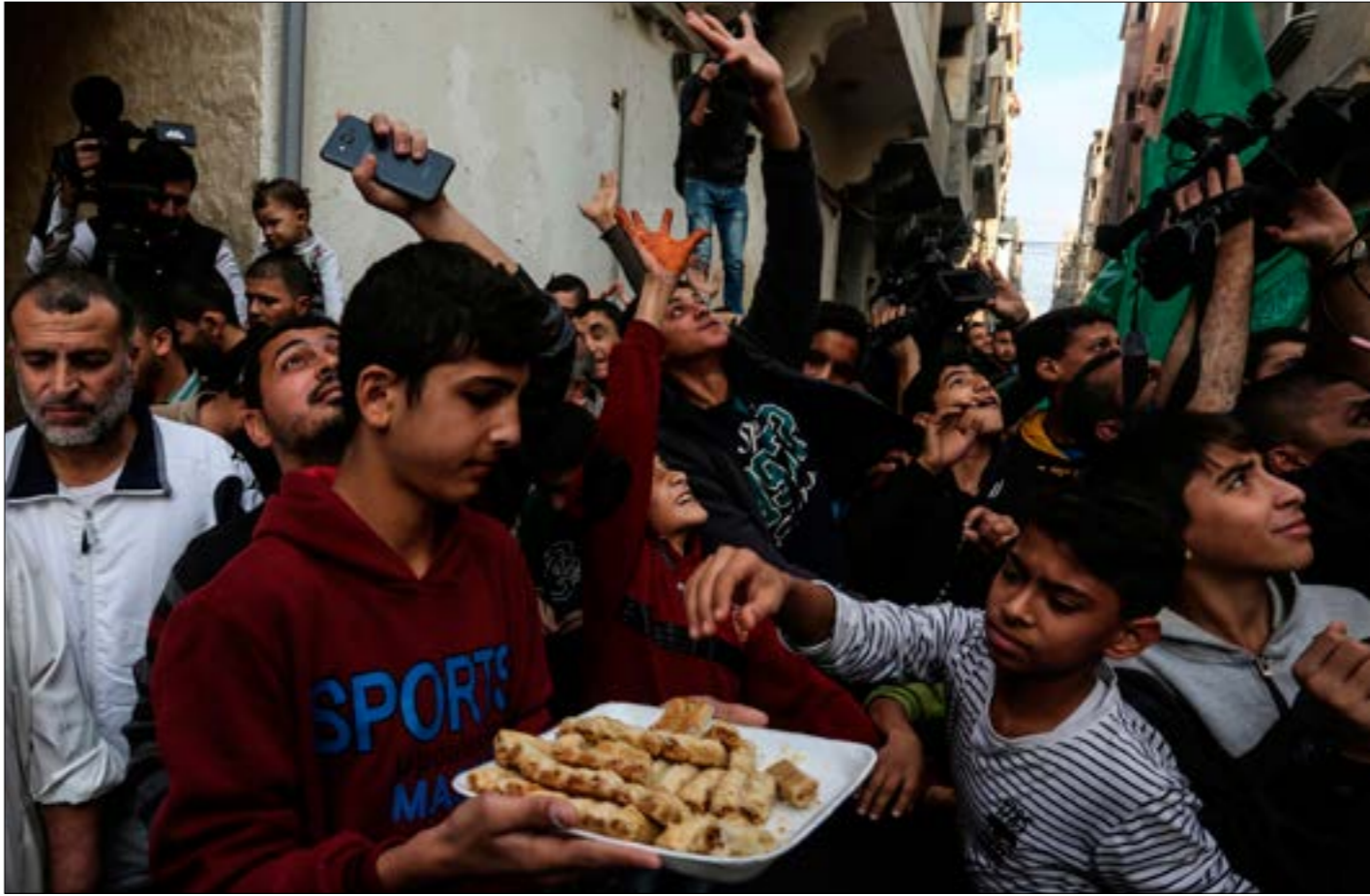
رات فصائل المقاومة في استقالة ليبرمان إتماما للنصر الذي تحقق

ولليوم الثاني على التوالي، تظاهر مئات الفلسطينيين احتفاء بما حققته غزّة خلال اليومين الماضيين، ووصلت مسيرة أمام منزل رئيس المكتب السياسي لـ«حماس»، إسمايل هنية، دعماً للمقاومة التي تلقاها عملاء الاحتلال في الشبان الحلوى في مناطق متفرقة