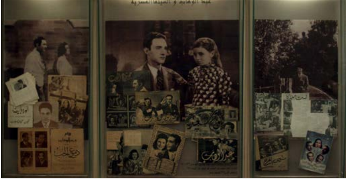
متحف عبد الوهاب في معهد الموسيقى العربية، القاهرة

إلى فيروز، رغم عدد أفلامها القليلة (ثلاثة أفلام) وخروجها عن الأجواء المصرية الغنائية. أما الجزء الأخير، فقد ذهب إلى توثيق بصري لأبرز وأهم الأفلام الغنائية وأفيشاتها، ولقطاتها. توقف المؤرخ عند عام 1960، لأن - بحسب رأيه - الأعمال المصرية الغنائية التي أتت بعد هذه المرحلة، لم يطرأ عليها أي تطور في الأنماط الغنائية السينمائية المذكورة آنفاً، ما خلا بعض الأعمال التي رافقت كلاً من عبد الحليم حافظ وصباح، تزامناً مع تطور شهده القطاع الموسيقي في التسعين، والتعبير الدرامي والتصوير الموسيقي، وإيضاً في التوزيع الأوركسترالي.