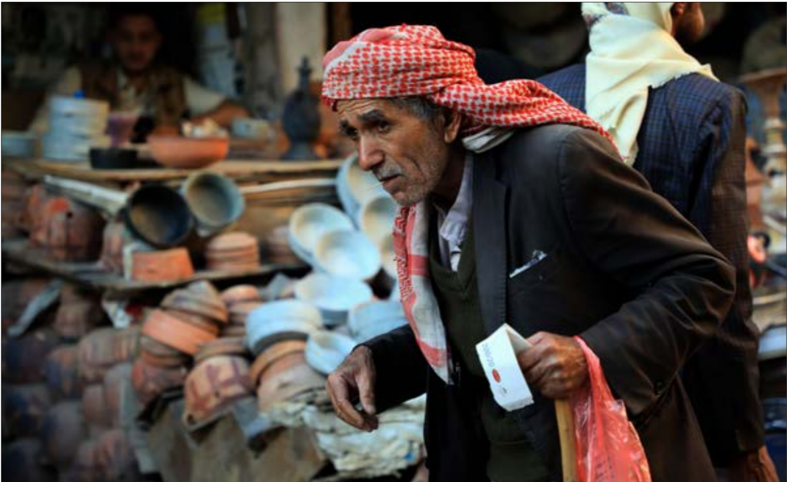
في أحد شوارع صنعاء القديمة أول من أمس (أف ب)

العرب تحت ذريعة مكافحة التهريب (علماً بأن القوات السعودية لم تعلن منذ ستة أشهر عن ضبط أي شحنة مخدرات في مناطق الساحل كافة)، وإدارة «التحالف» الأذن طرشاء لمطالب أبناء المحافظة، بل أبناءها بالاستمرار في الوجود قرب منطقة الأنفاق، التي سادتها أمس حالة توتر حتى ساعات المساء، وفي ظلّ إصرار «المهريين» على إفسال المشروع السعودي القاضي بمنح أنبوب نفطي عبر أراضيهم إلى بحر