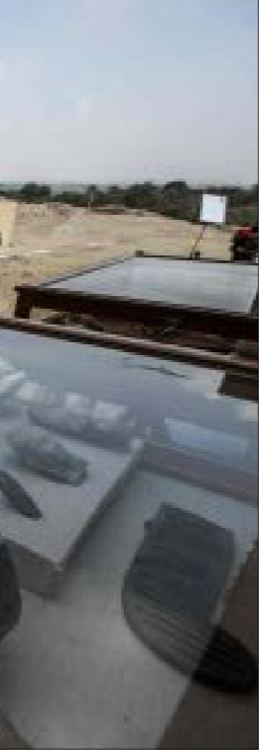
لتأخذ مصر روابطها التاريخية الحضارية وروابطها المحلصة-الآنية في الوقت نفسه (أ ف ب)

وإذ يعمل مركز الزلزال الجهوي المشتغل من الساحل العربي للخليج في الإقليم العربي-الأفريقي باتجاه محور الدائرة الأطلسي، أميركا في الذات، ليعكس تفاهما مامولاً لخلق منطقة نفوذ خليجية فرعية عند مداخل ومضائق الخليج، وعلى طول البحر الأحمر... تكون هذه المنطقة ذات المركز الزلزالي النوعي نُظْمِماً فرعياً Sub System ضمن المنظومة الأوسع التشمولة في الغرب الشمالي، الأميركي – الأوروبي بامتياز، ولو إلى حين. وإن الجائزة الكبرى في هذا الصراع الاستراتيجي المعبود والمُتَمَدِّ هي (اليمن) شمالاً وجنوباً، من أرخبيل سقطرى ومضيق باب المندب، إلى المكلا وعدن والمخا والحديدة، (عقدة المواصلات) في الإقليم العربي الأفريقي كله أو هي قطب للتحفاعات المستقبلية في العالم المتواصل الجديد، أو قطبان متقابلان: جاذب ومنجذب. هكذا نفهم ما يجري حثيثاً الآن من تبدل للمواقف، في سرعة سريعة، باتجاه السيطرة الشّامة على اليمن والململة، الخلفا الإريتيري-الأثيوبي (وهي خزان الماء المحتمل للشركاء) بعيداً عن مصر بمعنى ما - ومن ثم تصويب