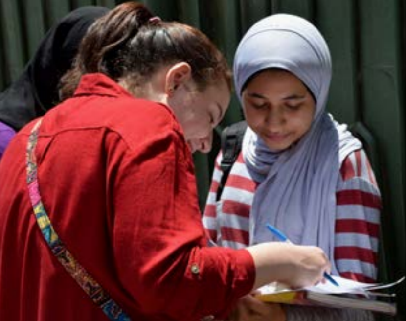
بعد الزيادة التي حوّلت قطاع الصحة إلى «استثمار، يأتي الدور على «التعليم» (أي يواي)

لتتحول إلى فصول دراسية. هكذا، تحولت «التربية والتعليم» التي يفترض أنها وزارة خدمية يسعى وزيرها إلى إقامة «وقف مصري لخدمة التعليم» إلى أداة استخمار كي تستطیع قبل نهاية الشهر الجاري سداد تكلفة رواتب الموظفين، فهي قد رفضت تعيين المعلمين مكتفية بتعاقدات موسمية، وحصلت على تعديلات على قانون التعليم لشروط تعيين المعلم المساعد، واختيار مديري وكلاء المدارس. واستخدمت تلك التعديلات خريجي كليات الخدمة الاجتماعية من الحصول على التأهيل التربوي كشرط للتعيين الذي صار لمدة عامين قابلة للتجديد بدلاً من التعيين مدى الحياة حتى بلوغ سن التقاعد (60 سنة)، بل اشترطت لاستمراره حتى التقاعد حصول المعلم المساعد على شهادة صلاحية من «الأكاديمية المهنية