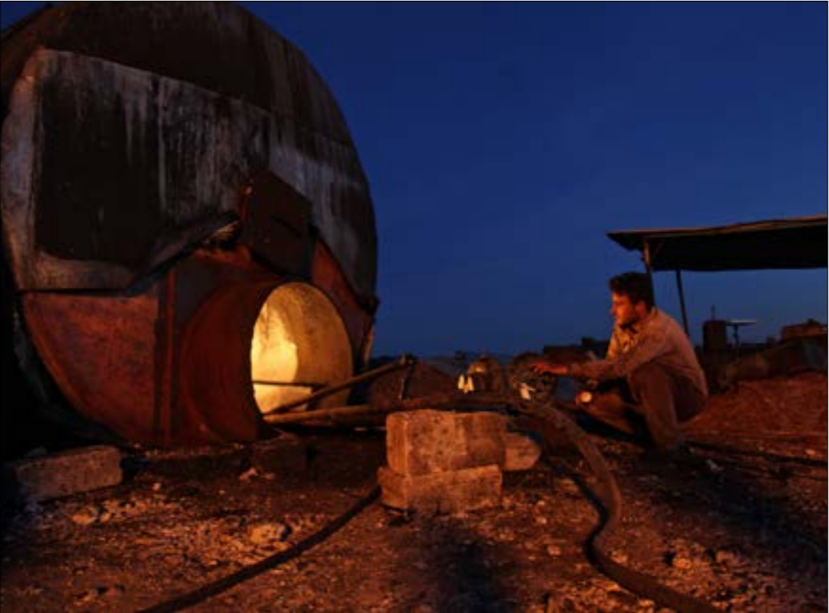
صب بِلدة زردنا في ريف ادلب

الميداني تحسباً لـ«حدوث شيء ما»، وعلاوة على جولات الكر والفر التي تشهدها «المناطق المنزوعة السلاح» في ريف حماة الشمالي، بين الجيش السوري من جهة والمجموعات المسلحة بمختلف انتماءاتها من جهة أخرى، تصاعدت أمس وتيرة الاشتباكات على غير جبهة بين الجيش السوري وتنظيم «داعش»، وكثّف الجيش عملياته ضدّ التنظيم المتطرّف في منطقة تلّول الصفا في يادية السويداء، فيما شنّ مسلحو التنظيم هجمات استهدفت مواقع الجيش في محيط قرية الدوير (ريف دير الزور الشرقي)، على صعيد آخر، استهدف طيران