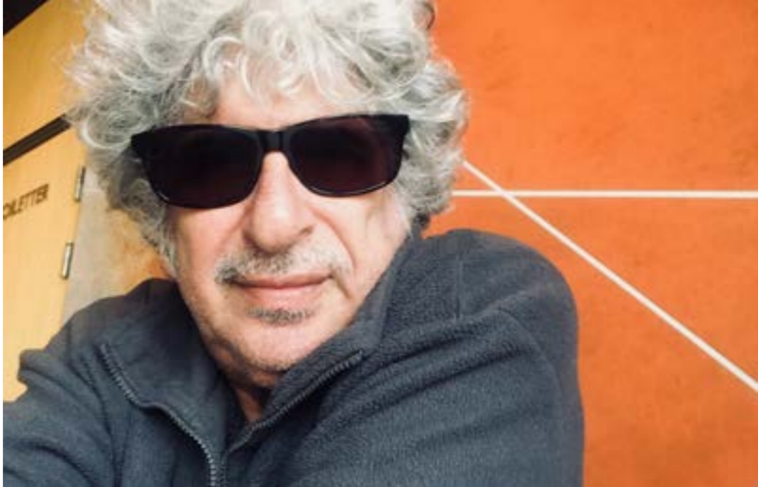
يحاور أسعد الجبوري، كلا من محمود درويش، وهر شاعر السياب، وسركون بولص، وسعيد عقل، وأنسي الحاج وغيرهم

شاعر». وكان من أبرز من حاورهم: المعري، والمختني، وعمر الخيام، وسيلفيك بلات، وأنا أخصاتوفاً، وفرناندو بيسوا، وفروغ فرخزاد، وإيف بونفوا، ومحمود درويش، وبندر شاكر السياب، وسركون بولص، وسعيد عقل، وأنسي الحاج، ونادية تويني، ومحمد الماغوط، وجمال الدين الرومي، وسان جون بيرس، وخلييل حاوي، في 13864 سؤالاً وجواباً. ويشير عقل العويط