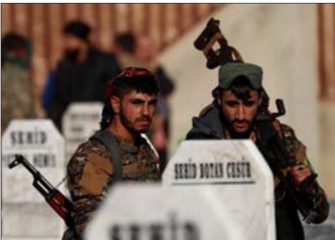
خلال تلبية احد مقاتلي «فسد» في المصالح اوبل تم امس (اف ب)

من دون تعليقات رسمية لاحقة من أنقرة أو واشنطن، رغم أن اردوغان كان قد صرح قبلاً بأن ملف شرق الفرات والدوريات الأميركية المرافقة له «وحدات حماية الشعب» الكردية، سيتمش مع ترامب، وشهد امس زيارة وفد عسكري وديبلوماسي من «التحالف» يضم مستشار وزارة الخارجية الأميركية وليام روباك، النفس وتركيز الجهود على محاربة مدينة منبج، حيث التقى أعضاء «القيادة العامة لمجلس منبج العسكري».