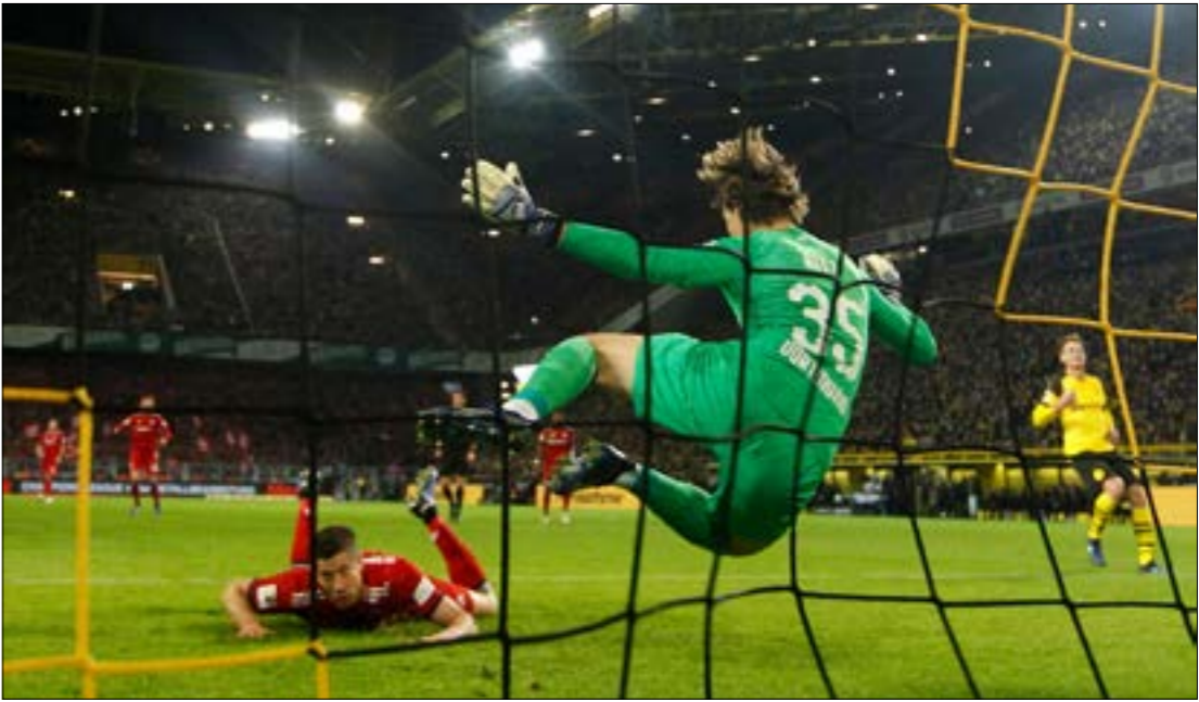
ينضخ الاتحاد الألماني تحت النار تجربة انكلترا (إينا فاستر- اصب)

القوانين تمنح الملكية الأجنبية لنواد محلية في أغلبية الدول لكن هذه القوانين غير موجودة في الدوري الألماني. حيث تلزم الأندية الألمانية بموجب قانون «1 + 50» المغفل من قبل رابطة كرة القدم الألمانية. بالاحتفاظ بقوة الأغلبية في حقوق التصويت. ينص قانون «1 + 50» على إلزام أي نادي كرة قدم ألماني الاحتفاظ بنسبة 50 في المئة من الأسهم في فريق كرة القدم المحترف. بالإضافة إلى حصة واحدة، وإتاليا منع أي مساهم أو كيان آخر من الحصول على حصة الأغلبية. تاريخياً، وبخلاف بقية الدوريات، كانت الفرق الألمانية منظمات غير ربحية تديرها جمعية الأعضاء، حيث كانت الملكية الخاصة محظورة من أي نوع كانت حتىّ 1998. في ذلك العام ظهر قانون «1 + 50» الذي ساهم بتفسير سبب انخفاض أسعار