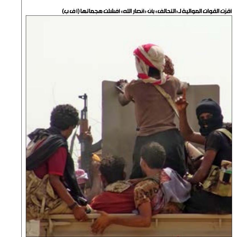
أفرت القوات الموالية له «التحالف»، بات «انصار الله» أفشله هجماتها (اف ب)