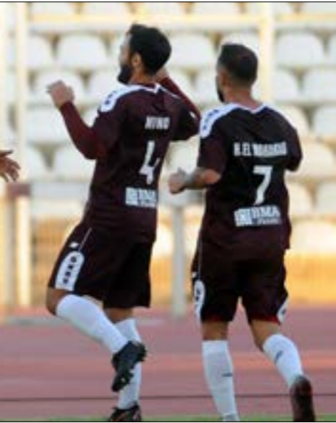
فاز النجمة 5 هـه 5 مباريات من 6 هدئاك (المدرب علي)

خمسة انتصارات في خمس مباريات، وتعادل وحيد من دون أي خسارة. هذا هو رصيد المدرب بوريس بونيك مع فريق النجمة حتى هذه اللحظة، مع إن الصربي لم يتذوّق طعم الخسارة، لكن رغم كل شيء طلعت في الأيام القليلة الماضية إلى العلن المطالبات بإقالته من منصبه، والسبب هو الأداء لا النتائج، الواقع أنه لا يختلف اثنان على أن أداء النجمة لم يكن الأفضل في المراحل الأولى من عمر البطولة، لكنه بالتأكيد حقق المطلوب بخصده الانتصار على الآخر. مسألة أبقت النار تحت الرماد حتى سقط بونيك وفريقه في فخ التعادل، فكانت المناسبة لمراجعة المدرب الصربي والعمل على مناقشته في الملاحظات وسؤاله عن استراتيجيته الجديدة المطلوبة. وحسب كثيرين، فإنه من الظلم انتقاد النجمة إلى حد كبير ومدربه أيضاً بسبب التعادل السلبلي في اللقاء، ولو أن أي كلام يجب أن يلخص الصعوبات التي عانتها الفريق، فهناك في ملعب