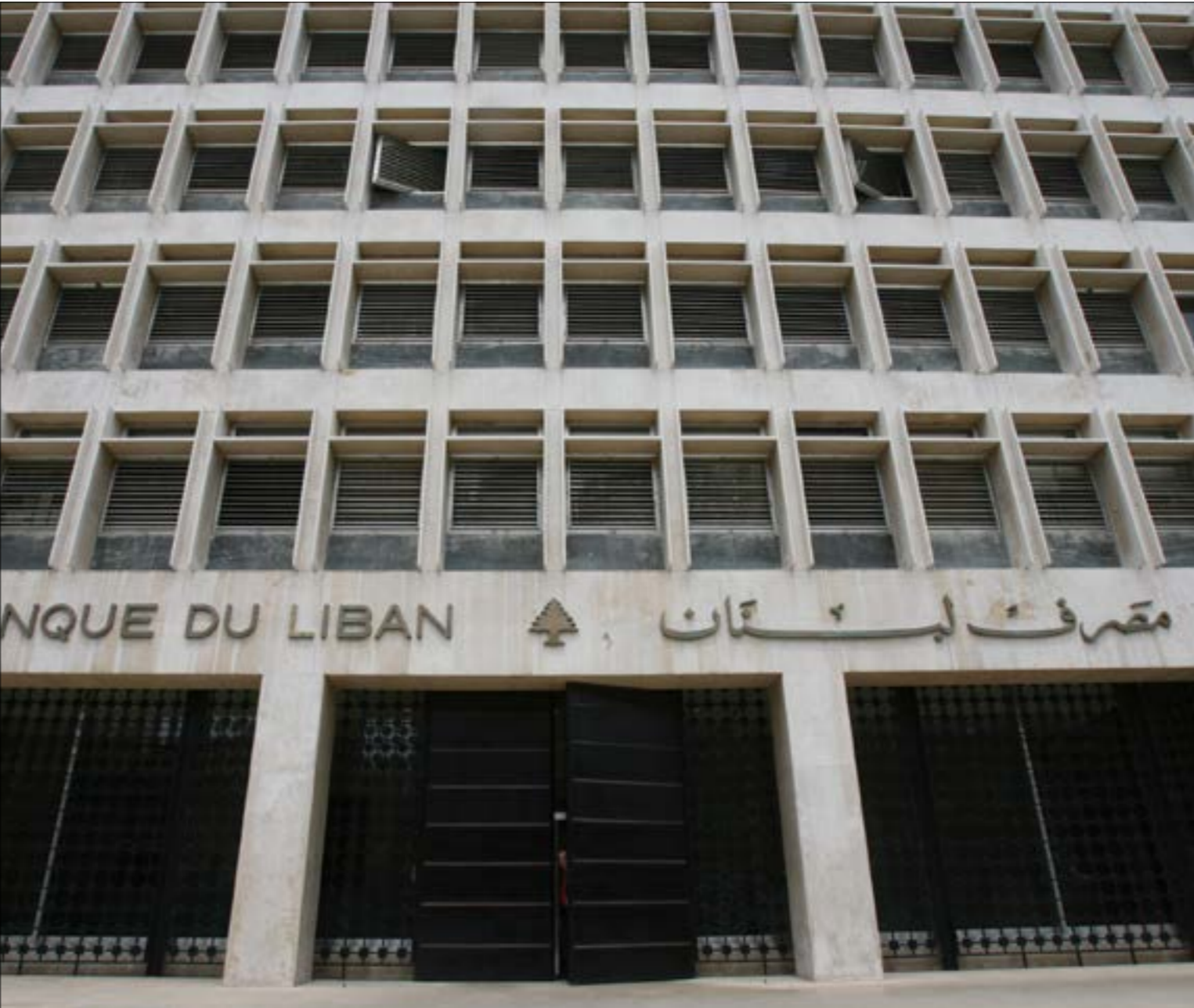
تغديرات صندوق النقد الدولي عن تراجع الاحتياطيات بنسبة 755 بحلوله 2022 مؤشر كارثي

هندسات مصرف لبنان وإجراءاته لم تتمكن من وقف نزف احتياطاته بالعملة الأجنبية. الهندسات بدأت صيف 2016 واستمرت بشروط مختلفة في السنوات اللاحقة، ثم جاءت الإجراءات التي تحدد سقفاً للتسليفات بالليرة يوازي 25% من مجموع الودائع المصرفية، والسماح بتغيير عملة القرض من الليرة إلى الدولار... كل ما يقوم به مصرف لبنان يندرج في إطار شراء الوقت