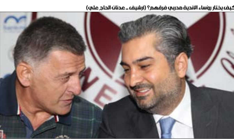
كيف يختار رؤساء الأندية مدربي فرمهم؟

رؤساء الأندية عدّوا الجماهير على أن يكونوا هم الواجهة لكل نجاح، وإخفاق أيضاً بطبيعة الحال، في حين أن مهامهم محصورة بإدارة النادي وتمثيله. لم يُذكر أن للرئيس مهمّة تقييم الجهاز الفني واللاعبين والمشاركة في التعاقدات. لكن رئيس النادي الليداني «بتاع كلّه»، يبدو مستغرباً حين يُعلن رئيس ناد إقالة المدرب وتعيين غيره. يستعمل «نون الجماعة» في كلماته للدلالة غالباً على أن القرار مشترك بينه وبين باقي الإداريين. على الرغم من أن كلمة الفصل