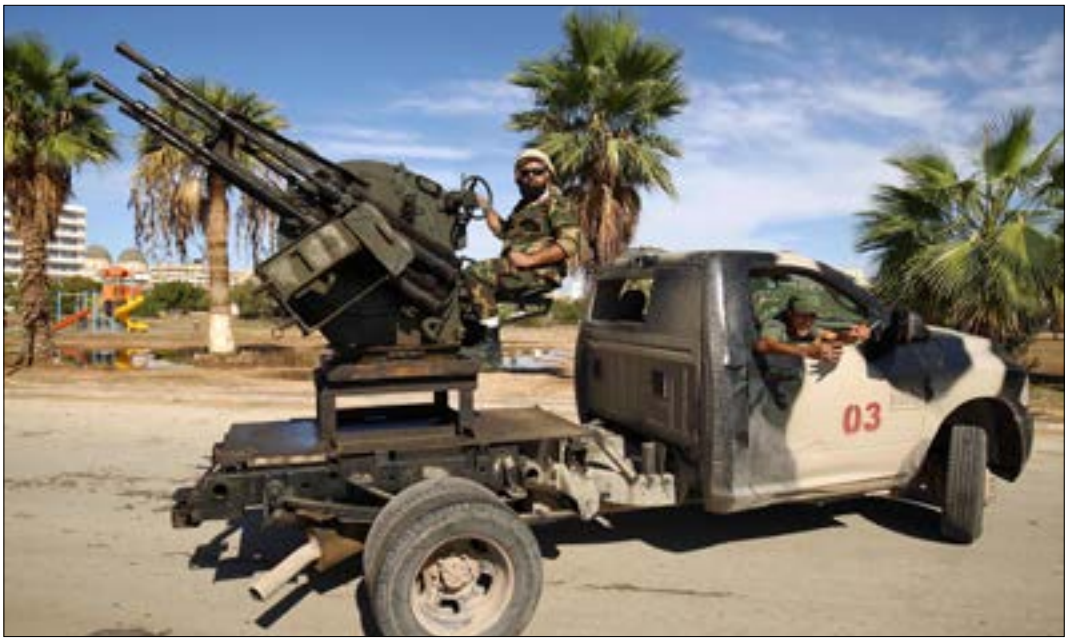
حرس السراج وحدات «المجلس الرئاسي»، في عملية الأمن، وكبار زوار الدولة

علاوة على ذلك، تستمر أعمال هدم الكلية العسكرية للجنات في طرابلس، التي كانت تتخذها كقبة «النواصي» مقرّاً لها. جاء ذلك بعد إصدار السراج مَهلة لإخلاء المكان.