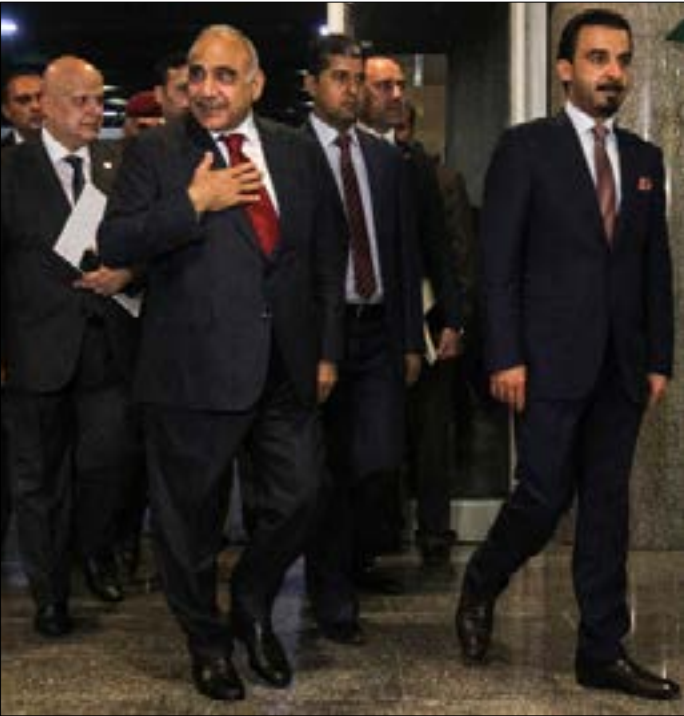
قدّم عبد المهدي تشكيلة حكومية من 21 وزيرا من اصل 22 (أف ب)

أعضاء البرلمان «تحلّل مسؤوليتهم في اختيار الأنسب من المرشحين لشغل الوزارات الحكومية».