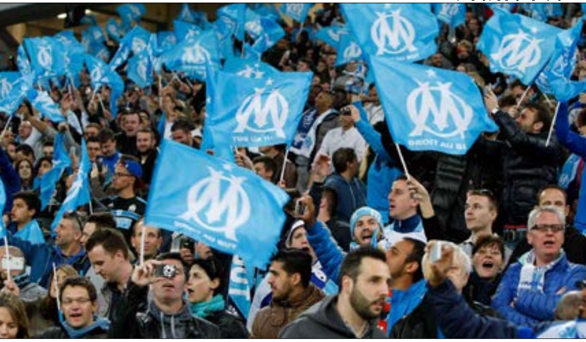
لمعة لوم في مارسيليا (أرشيف)

والشتائم، ولكنّه في الوقت عينه، كارثي. ويعيداً عن الأجزاء اليمينية، ونذهب إلى الملعب الذي يتميّز بتنوّع الثقافات: «الفيلودروم». تعتبر مدينة مارسيليا في جنوب فرنسا، من بين أكثر المدن التي استقبلت المهاجرين (من أفريقيا وغيرها من البلدان). تتميز جماهير الفريق الفرنسي العريق باختلاف ثقافتها، فتجد على المدرج ذاته كل شيء، ذلك رغم أن التفاوت الطبقي في مارسيليا صار واضحاً، وموسوليني الذي يمثل الصورة الأولى والأبرز للعنصرية اليمينية الإيطالي، والقصة ليست اعتباطية، إذ يرى عالم الاجتماع والخير في «المشجعين المتعصبين لكرة القدم الأوروبية»، سيباستيان لويس، أن مشجعي لانسويو الإيطالي، دائماً ما كانوا يعكسون جانباً واضحاً من «اليمين المتطرف».