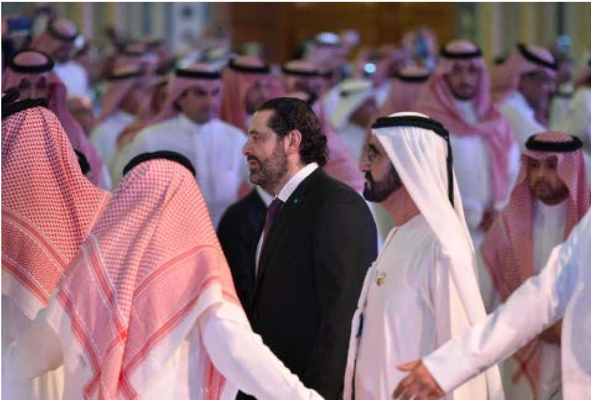
ترددات الحريري حسم قراره عدم تملك سنة 8 آذار في الحكومة

لم تكن الحكومة هي الحدث، امس، بالرغم من إعلان الرئيس سعد الحريري اقتراب موعد تشكيلها. كان الحدث في الرياض. هناك حيث جلس الحريري عن يمين ولي العهد المتهم بجريمة اغتياله جمال خاشقجي، يضحك معه على نكتة مستمدة من أيام احتجازه الطويلة، لكنها تطمنه الى انه لن يُخطف مجدداً