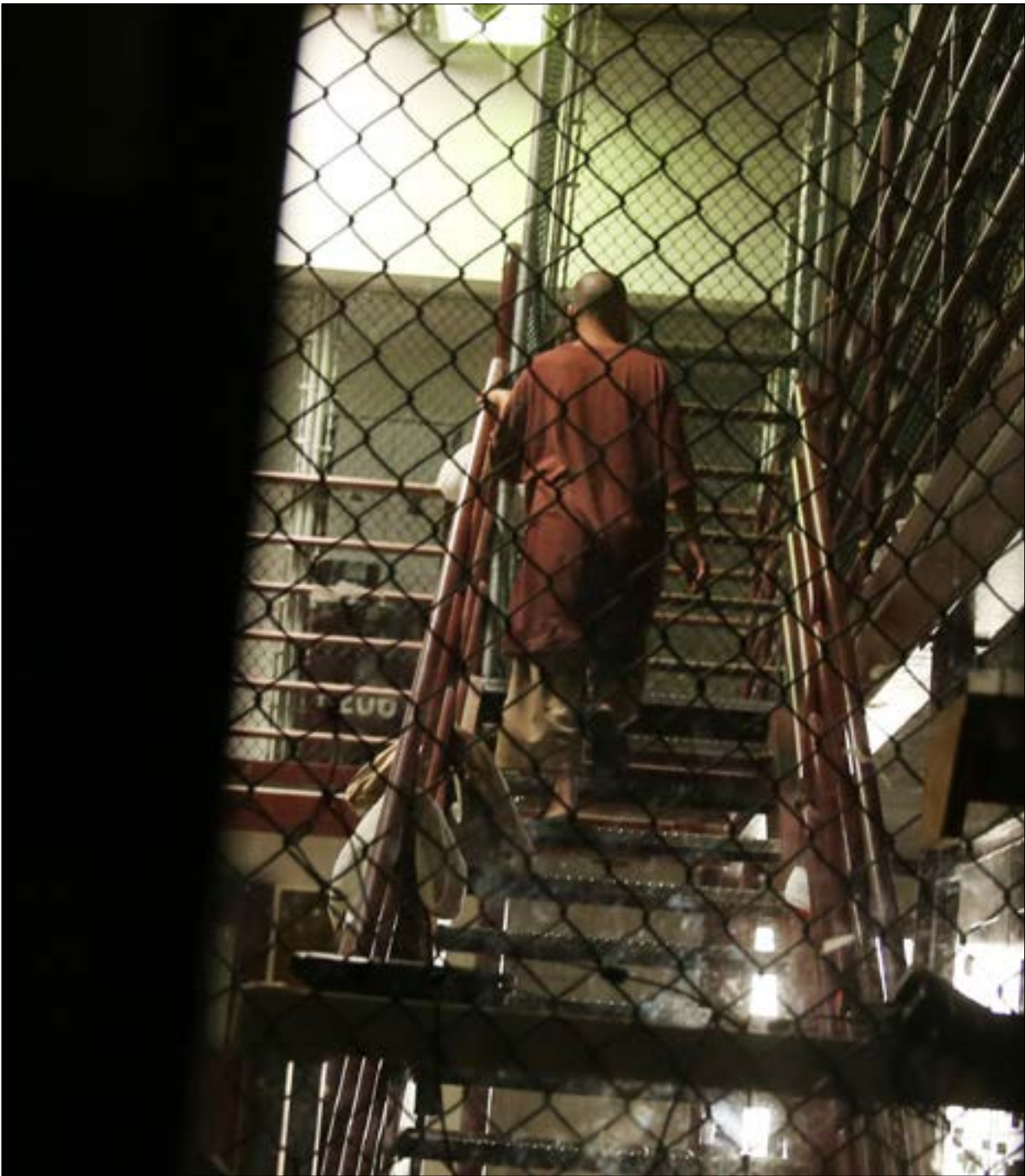
خدّفت فقرات من التقرير بطلب من وكالة الاستخبارات الأميركية (رشيّف)

شيئاً عن تلك الأسماء، لطم المحقق رأسه بعنف في الجدار لعدة مرّات إضافية. وخدّفت بعد ذلك فقرة من المحضر. «تجنّب للمحققين أنّ هذا الأسلوب ليس ناجحاً فانتقلوا إلى أسلوب الإغراق (water boarding)». خدّفت بعد ذلك فقرة واسعة من المحضر ورد بعدها أنّ الموقوف ترك مقيداً بينما غادر المحققون في الساعة 11:27 الغرفة. عادوا في الساعة 11:47 عارضين على النشيري فرصة جديدة للسداد بمعلومات منغ