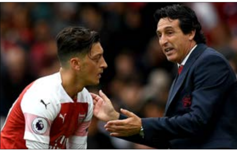
يقدم أرسنال كرة قدم جديدة (أرشيف)

مهجة كبيرة على عاتق الرجل المقال من تدريب باريس سان جيرمان الفرنسي. استهزل المدرب الإسباني مشواره باختبارين الإدارة، جاء أمام كل من مانشستر سيتي وتشيلسي، خسر أرسنال في المباراتين. البداية المتعذرة أوراك فينغر المبعثرة، فحل معضلة المهاجم الفرنسي الكسندر لاكاريتز والجماهير، ساد الشغور بأن إيمري هو الرجل الخاطيء. شعور سرعان ما تبدد بعد سلسلة الانتصارات التي حققها الكازن، والتي وصلت إلى عتبة الـ 10 انتصارات متتالية في إيمري لم يتوقف عند ذلك فحسب،