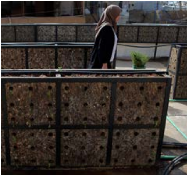
زراعة شتول على سطح مبنى «اوتروا» في برج البراجنة (هيلم الموسوي)

امرأة فلسطينية على إعداد طلبات طعام ومونة إلى المخيم وخارجه ويعود ريعها لدعم العاملات»، وتتابع «جمعيتنا كانت تابعة للاوتروا لكنها وفق استراتيجية الوكالة أصبحت مستقلة عنها، ولدينا 9 مراكز في المخيمات الفلسطينية. إذا نجح مشروع الحديقة سنفكر بتكراره على غير سطوح». تصرّ اللاجئات هنا على خلق حياة مختلفة، زاهية كالألوان التي يضح بها مبنى الوكالة من داخله، فيما تزداد الأزقة الضيقة خارجه قنامة ومعها صعوبة الظروف المعيشية لسكانها.