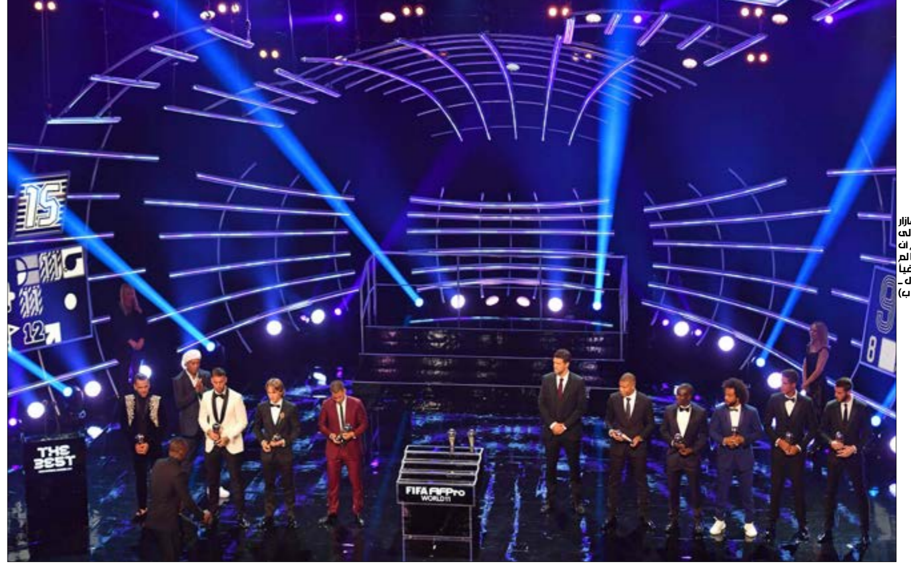
جاء هازار والفيس إلى الحفلة مع ابن فومها لم يكن متطابقا (بت ستسلك - افهيب)

كان الإنجاز العربي والأفريقي قاب قوسين أو أدنى من أن يتحقق، لكن الاتحاد الدولي لكرة القدم «فيفا» تزعجه الصورة، لا يطيف وجود محمد صلاح وويلو بوغابوسا ديرو هانيه وغيرهم في التشكيلة المثالية للموسم 2017/2018. قد تكون المسألة «خيارات» و«معايير»، لكن كيف يكون للمباغت أفضل ثلاثة، ثم لا يكون موجودا بين أفضل 11؟ يُقال: المصوتون يختلفون، ولكن ليس كل ما يقال صحيحا