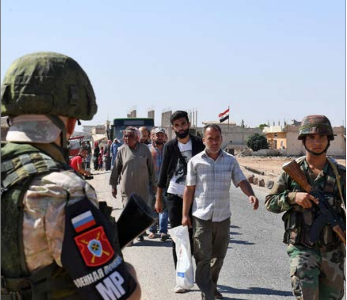
استقبال مدير ابو الزهور عددا من المدنيين المفارين لمنطق، سيطرة الفصائل المسلحة في ادلب

«ليس موجهاً ضد بلدان ثالثة، بل لضمان أمن القوات الروسية»، أفادت صحيفة «كوميرسانت» الروسية بأن المنظومة (عقب نشرها) سوف «تغطي مناطق الساحل السوري، إلى جانب المنطقة الحدودية مع لبنان والعراق وإسرائيل»، وأوضحت نقلاً عن مصدر مطلع،