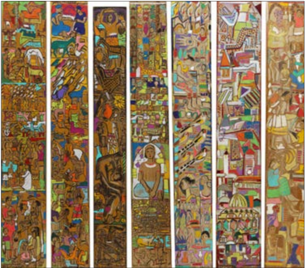
«العلاقات» (زيت على خشب، 8 × 230 × 38 سنتم _ 2018)