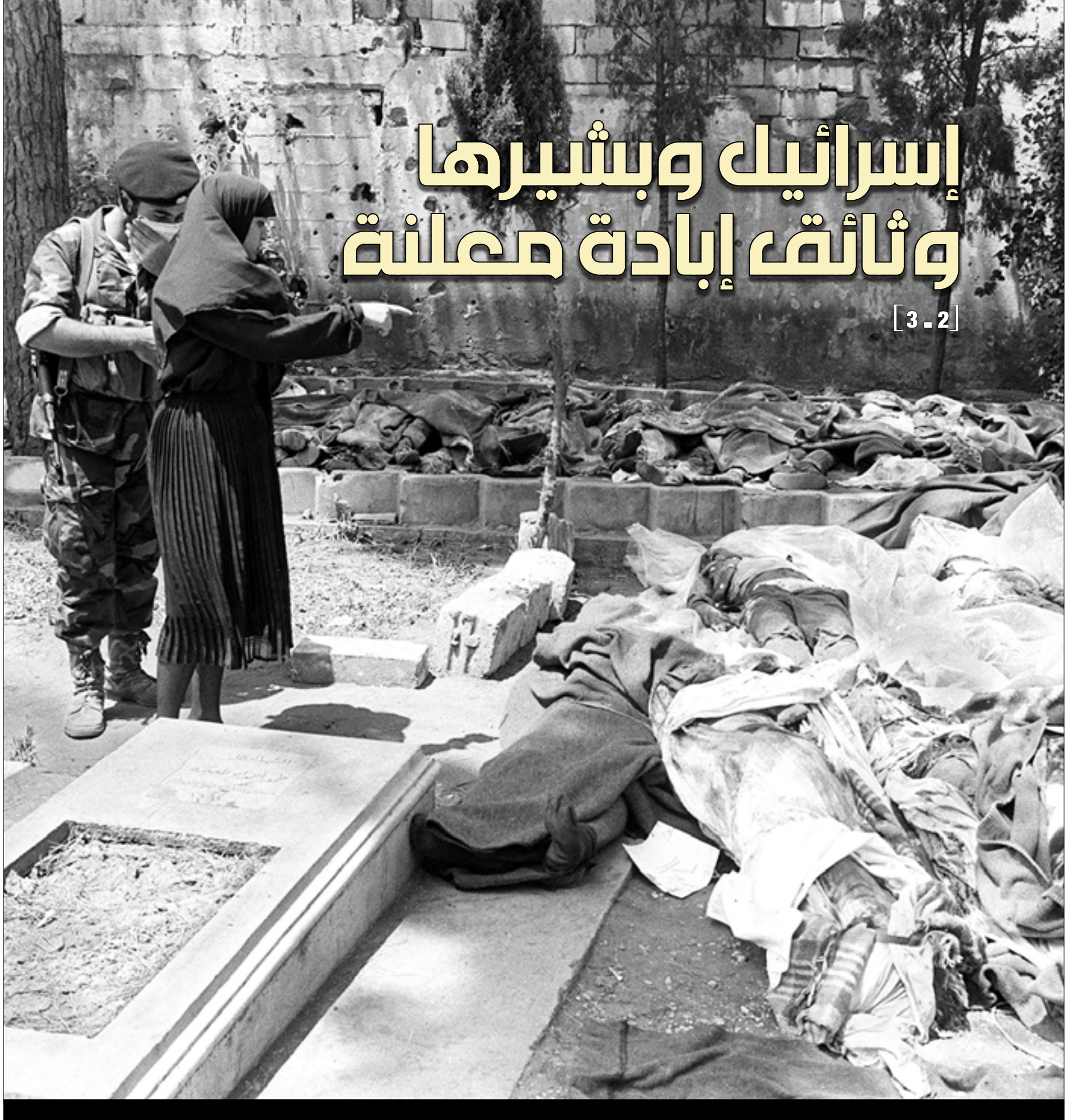
ابتداءً من اليوم، تنشر «الأخبار» وثائق إسرائيلية تكشف مضمون اجتماعات بيت قيادة العدو وبشير الحميك ومعاونيه، شهدت التحضير لجزيرة صبرا وشاتيلا عام 1982 (الغيب)