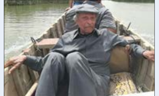
وَأثناءُ الشرارةِ الأولى للحربِ الأهليةِ في لبنان في روايته «الشيح»