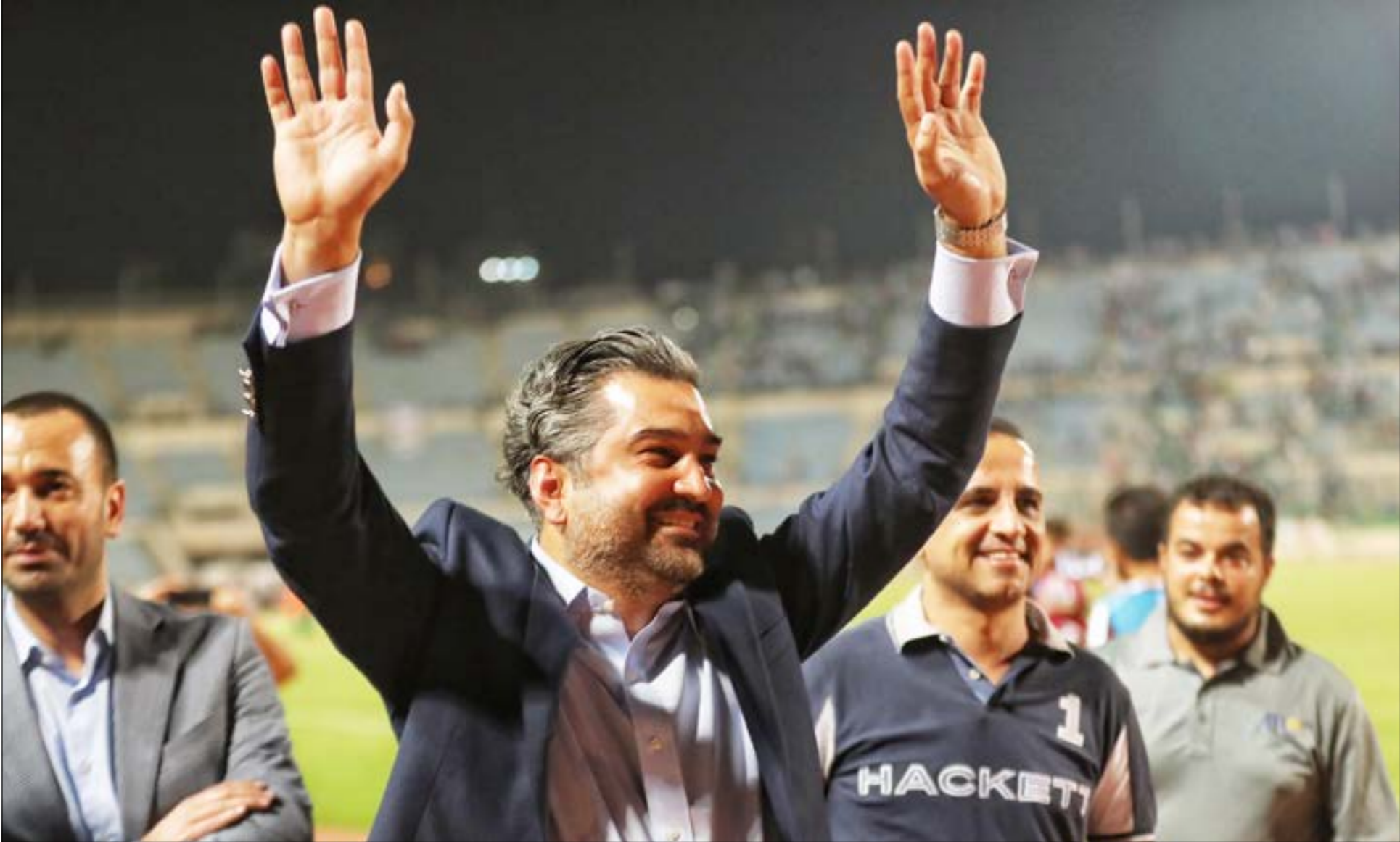
(مارك هاو ـ ا ف ب)

يستحقّ جمهور النجمة ظروفاً أفضل (أرشيف ـ عدنان الحاج علي)