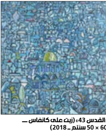
«القدس» 43 (زيت على كاتفاص _ 60 × 50 سنتم _ 2018)

رسمت العائلة المقدسة والهالة حول المرأة التي تشبه المرأة هذه هي القدس كما أراها». يأتي هنا السؤال بديها: لماذا القدس؟ لماذا في هذا التوقيت بالذات؟ «في القدس كل شيء القدس هي كنيسة المهد والمسجد الأقصى؛ لا يوجد في فلسطين شيء كالقدس. فالقدس بالنسبة إلى فلسطين كالإهرام بالنسبة إلى مصر، وبعلبك بالنسبة إلى لبنان. أما المدن الباقية فتصبح تفاصيل» أما بالنسبة إلى القدس في الماضي، وهناك لوحات أفضل منها. هذا تحد. أنا لست متوقفت؛ فيجب بسرعة وبدقة.» هل هناك موضوعٌ أهم منها؟» ولأن للقدس تلك المكانة التي يتحدث