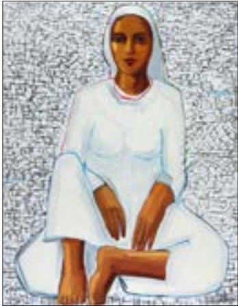
«القدس الزم» (زيت على كاتفاص _ 200 × 155 سنتم)

أنه كان يمتنى ذلك. كيف استطاع إذا أن يكون «دقيقاً» و«صادقاً» في رسم المدينة؟ أم أنه فضل أن يرسمها كما يتخيلها؟ يجيبنا: «كلا لا يمكنني ذلك (يقصد زيارة القدس). ليست كل الصور من بئات الخيال لكنني حاولت أن أرسم من خيالي ورؤيتي الوائني.