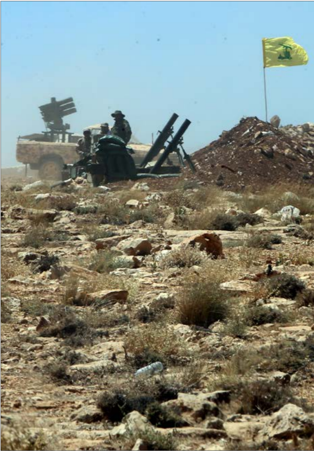
كل كلمة عن انتفاء الخطر بسبب المسألة بين ادلب وليس منطقتها ولا بحد الاستقرار

لكن إجراءات حزب الله من جهة، وتدابير القوى الأمنية، لا تمنع بطبيعة الحال تسلّل مسلحين، وإفادة من بعض الثغّر لإعادة إحياء مجموعات مسلحة وتزويدها بما تحتاج لتنفيذ عمليات إرهابية. وهنا تقع على عاتق الأجهزة الأمنية، في الداخل وعلى الحدود، مسؤولية رفع مستوى الاستعداد لمرحلة خطيرة ناتجة من تطورات ما بعد اتفاق سوتشي. وعلى هذه القاعدة تشكل الحدود الشمالية، تحدياً متواصلًا لمنع التسلل، خصوصاً أن هناك الكثير من المعابر غير الشرعية ومجموعات التهريب المتواصلة، فضلاً عن حركة داخل لبنان لتسهيل مرور المسلحين، الذين يتحولون مدنيين في لبنان، ويمكن تهينة بيئة ملائمة لتعليم فيه، وهذا يطرح مجدداً مصير البؤر الأمنية والتجمعات السورية التي سبق أن شهدت احتضاناً مماثلاً لهذه التنظيمات، وهل في قدرة الواقع الأمني اللبناني ضبط هذه التجمعات بدقة، خصوصاً أن المرحلة الفاصلة عن 15 تشرين