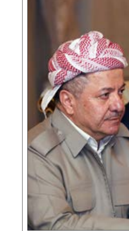
البرزاني، فئسر استقالوا نوح شيخا

من المقرر أن يلتقي نتنياهو في اليومين المقبلين،