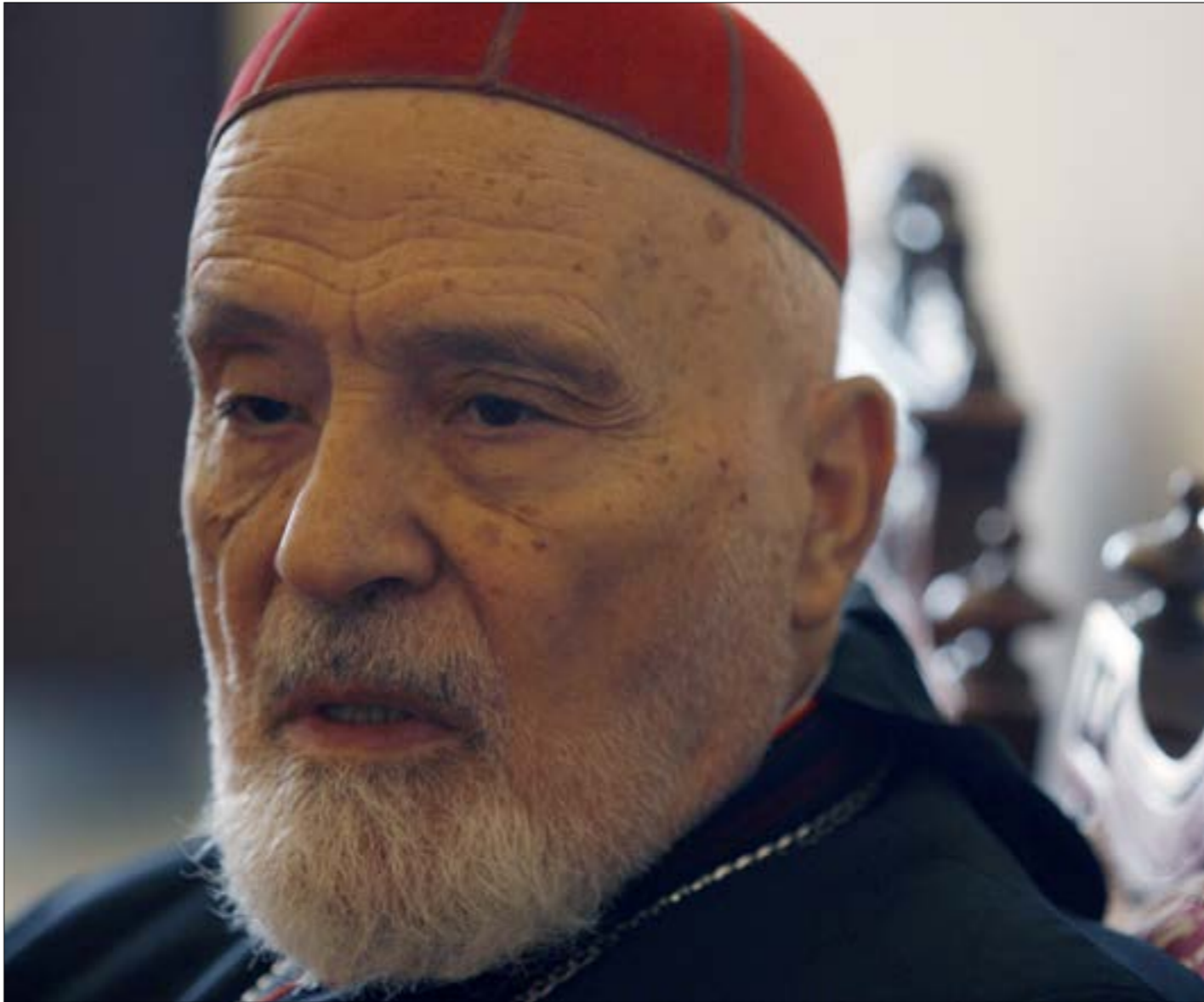
ابرن لقاء حصل مع الكنيسة، تحت العنوان نفسه، تمّ عام 1989، إيات حبرية البابا يوحنا بولس الثاني (هيلم الموسوي)