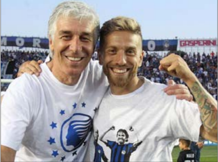
يلعب المدرب الإيطالي «الشّيب» بطريقة هجومية في أغلب المباريات (ارليف)

وهو لا يمتلك الأسماء الكبيرة في فريقة؟ الجواب ببساطة، «العقلية»، لا يمكن لأي مدرب في العالم أن يخرج من أفكاره مهما كانت الظروف، وأبرز دليل على ذلك ما حدث مع المدرب البرتغالي جوزيه مورينيو مع فريقة مانشيتر يونايتد، حيث استمر في تطبيق أفكاره «المنتهية الصلاحية» على الرغم من عدم إعطاء التّشخيص المرجوة. الأمر عينه لمدرّب إيطالي لم يضض على وجوده طويلاً في عالم التدريب، وهو مدرب ميلان جينارو غاتوزو، الذي ورغم أملائه أسماء أكبر وأفضل من التي بجورّة غاسبيريني، إلّا أنه مستمر بأفكاره الدفاعية» والتي لم تعدد جماهير ميلان على مشاهدتها. غاسبيريني حقق 4 نقاط من أصل 6 في بداية الدوري، ولكن مستوى أتلانتا خاصّة على ملعب كالاوليبيكو يشهد بموسم جيد لاتلانتا ومدربهم المتأخر.