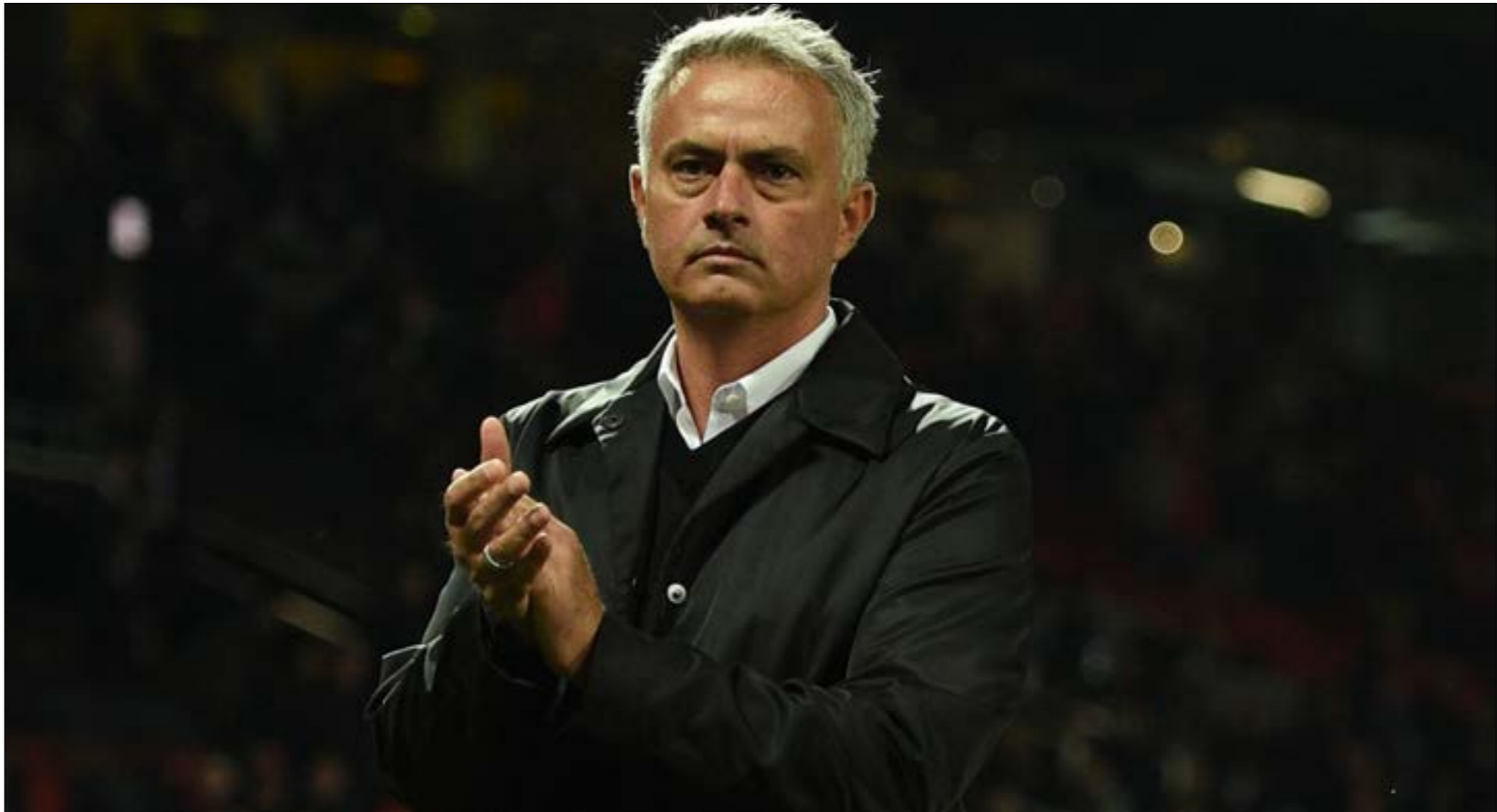
هك يعود مورينيو إلى إنجلترا