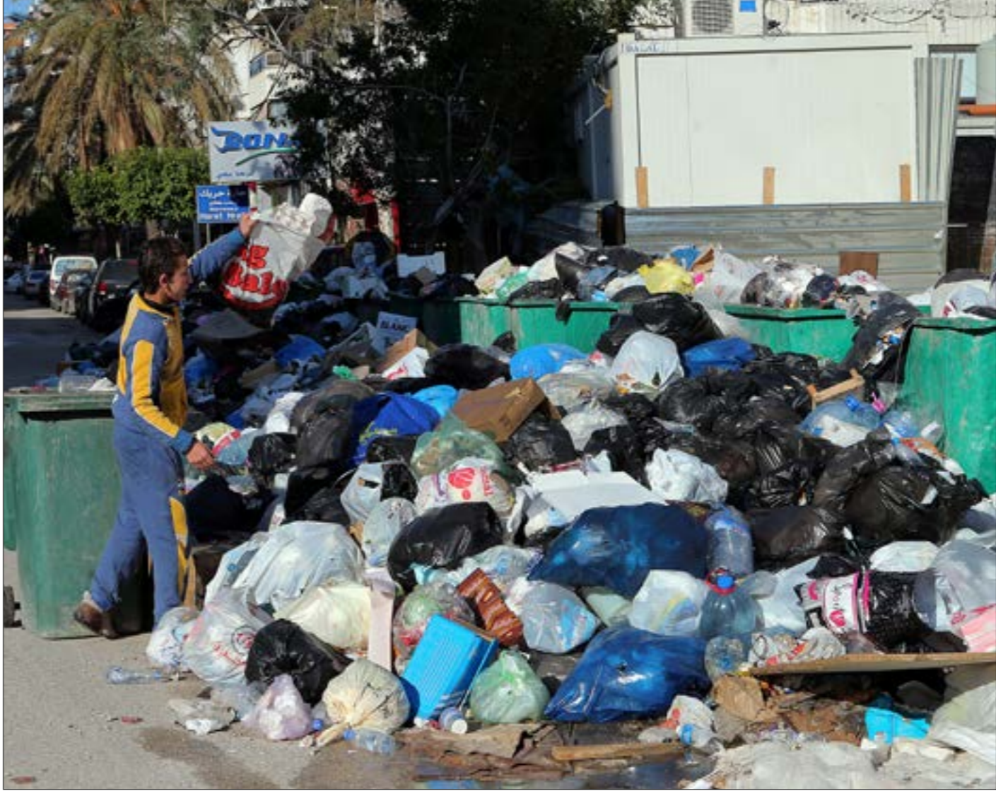
يفترض التعاطي الحكيم وضع سلم هرمي واقعي يتطابق مع تركيبة النفايات اللبنانية (يهم الموسوي)

نوع «عين الزرقا»، ما يضع العاصي على خطى الليطاني الذي رصدت الدولة، متأخرة جدا، مئات ملايين الدولارات لتخليّفه من التلوث. العقار الذي اختاره المجلس تابع لبلدة الفاكية ويضم مكبن لنفايات بسلدات الفاكية والعين ورأس بعلبك ومصبا للمياه المتدّلة التي تستخرج من الجور الصحية في البلدات الثلاث، ما يجعله واحداً من أبرز مصادر تلوث نهر العاصي بسبب تسرب عصارات النفايات والمياه المبتذلة التي ترمى فيه الى المياه الجوفية، فيما تحمل السيول الموسمية التي تضرب المنطقة النفايات الصلبة الى مجرى النهر. القرار اثار غضبا بين اهالي بلدة الهرمل المجاورة التي يجري العاصي في اراضيها، وتعتاش مئات من عائلاتها من تربية الاسماك والمرايق السياحية على