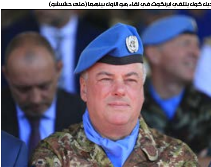
ديك كوك يلقي ابرنكوت في لقاء هو الأول بينهما (على حليشو)

الذي كان 'يرفض' ملاحقة حزب الله داخل القرى والبلدات والمناطق المدنية، في منطقة عمل وصلابية القوة في الجنوب اللبناني. وتضيف الصحيفة أن «اليونيفيل لم تنجح -ومن المشكوك فيه أنها حاولت- في منع سيطرة حزب