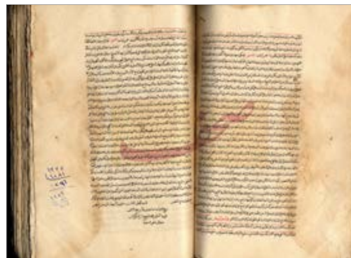
مخطوط مجمع البيان