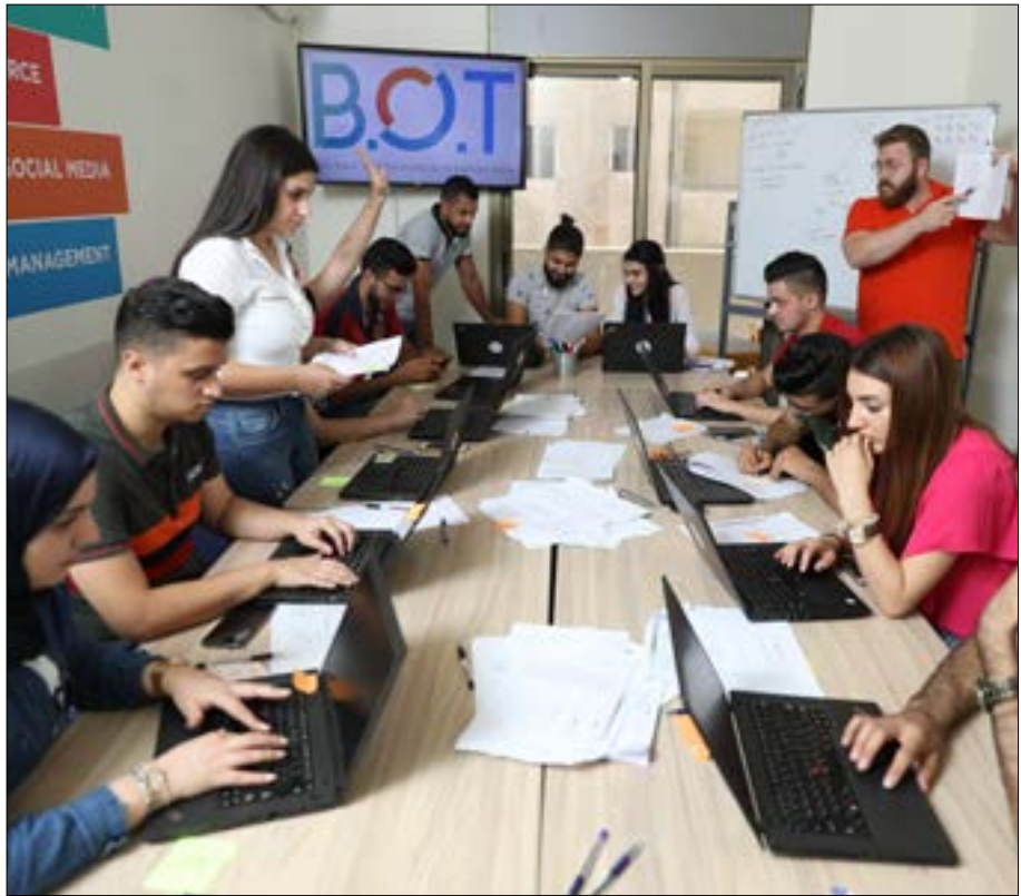
تنحصر فرص العمل التي توفرها المنصة في المجال الرقمي فحسب

34 مشروعاً في المجال الرقمي. نغّزها 100 شاب وشابة في مناطق مختلفة من لبنان خلال سبعة أشهر فقط. مدقّقت أرباحاً فاقت 57 ألف دولار، الخبر لاقت هذه الأرقام هي ثمرة منصة B. O. T، التي أنشأت بتعاون بيت منظمة الأمم المتحدة للطفولة (يونيسيف) وجمعية الفرص الرقمية في لبنان D. O. T، في خطوة تهدف إلى خلف فرص عمل للشباب في مجالات المشاريع الرقمية