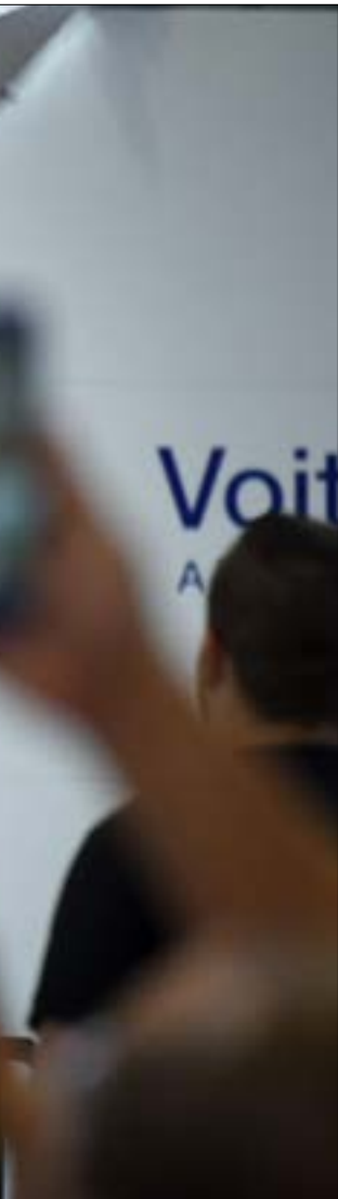
بنج 59 ربح اعماك صلبا إلى انقرة لإقامة شركات والبحث عن فرص استثمار جديدة (اف ب)

لتطوير حقل بارس الجنوبي في قسمة الإيرانية، أكبر حقل غاز في العالم، الشركة الفرنسية كانت أعلنت قبل أسابيع قرارها، تاركة إمكانية العودة عنه لما تفضي إليه اتصالات الحكومة الفرنسية مع واشنطن للاستحصال على العقوبات الأميركية. لكنّ تعنت الأميركيين في رفض إعطاء باريس أي استثناء، حثم على الشركة عدم المغامرة بمصرى استثماراتها الأميركية التي تبلغ ضعفي ثمن حصتها من «بارس» (10 مليارات دولار)، ومشاركة للكونسورتيوم.