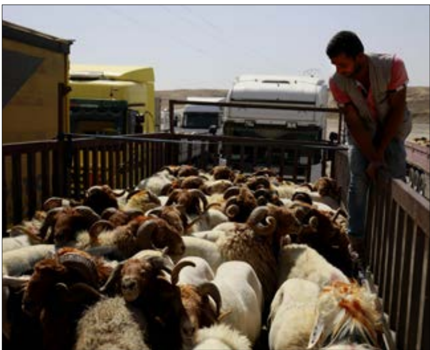
نظر اصحاب الميّد من سوريا إلى كردستان العراق عبر صبر سيمالكا الحدودي

لا يوجد ما يحتمل بوتفليقة على استعصام صلاحياته لأضعاف محيطه، فضلاً عن ذلك، لا توجد أي مؤشرات حالياً توجي أن ثمة خلافات بين قيادة الجيش والرئاسة، بل على العكس، يصير صالح في كل دخلائه على الشاء، على بوتفليقة. وفي دليل على ذلك، أخذت القرارات الأخيرة للرئيس عبد العزيز بوتفليقة، إقالة ضباط كبار في الجيش، منحى سياسياً بامتياز عند أغلب الفرمات، إذ رحلت مباشرة إلى دور معين لمصلحة التغيير في البلاد.