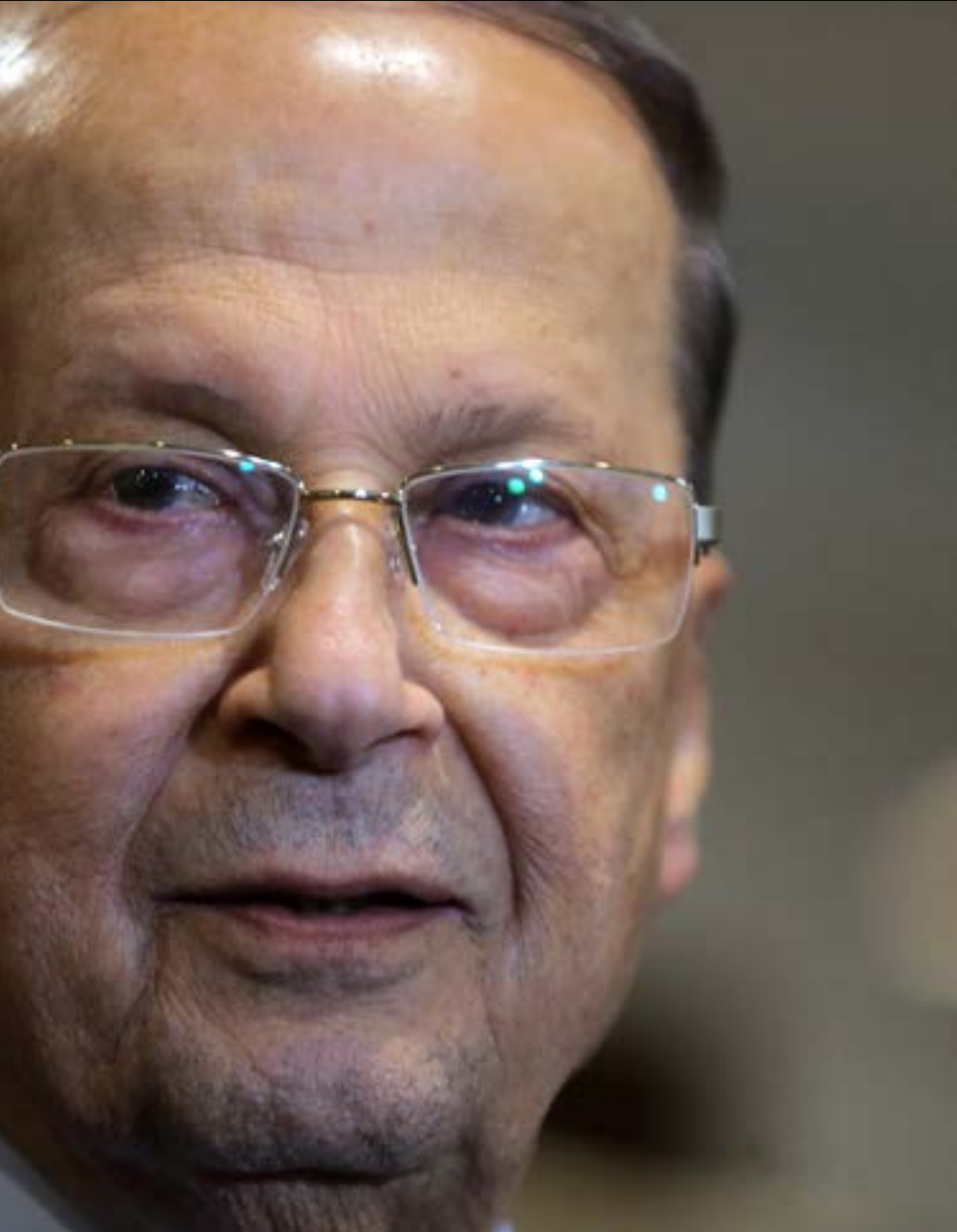
عون ليس طرفاً في مفاوضات التاليف وقصر بعيدا ليس حائط حيكه (ميلام الموسوي)

1 . ما يقوله عون أن «المهلة ليست مفتوحة، وليس لأي أحد ان يضع الجبل برمتهأ رهينة عنده ويعطلها». لذلك يضيف: «سانتخلر حتى الأول من أيلول فقط. بعد ذلك سنتكلم. نعم سنتكلم». يرغب بذلك أن يبحار الحكومة النور ومباشرتها أعمالها قبل نذاهي إلى نيويورك في النصف الثاني من أيلول، للمشاركة في أعمال الدورة السنوية للجمعية العمومية للأمم المتحدة، ويلقي كلمتين في افتتاح أعمالها وفي تكريم ذكرى الرئيس نيلسون مانديلا. ينتقل من بعدها إلى بلجيكا للتحدث أمام البرلمان الأوروبي. يعتقد رئيس الجمهورية أن الملف الرئيسي الذي يتوخى حمله إلى هناك هو ملف النازحين