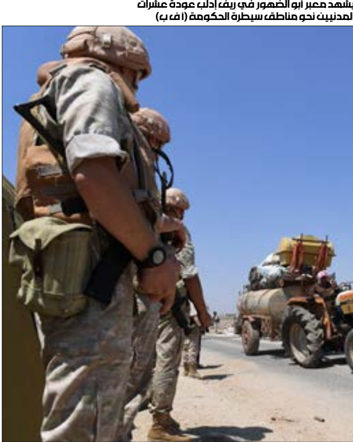
يسلمه ممر أبو الظهور في ريف إدلب عودة لطلاب المدنيين نحو مناطق سيطرة الحكومة

والمانيا وتركيا، التي أعلنت الأخيرة أنها ستستضيفها قريباً. إن لفتنا إلى أن التواصل مستمر مع ألمانيا وفرنسا، بشكل منتظم، لكن «تنظيم هذه القمة لا يعتمد علينا، واعتقد أن الجانب التركي لم يتفق بوضوح مع الشركاء الأوروبيين» حولها. وفي المقابل، أشار المتحدث باسم الحكومة الألمانية، شتيفان زايبيرت،