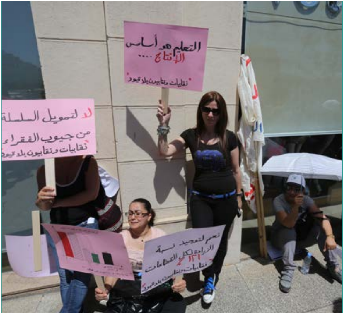
صرفت المدارس هذا العام عدداً غير مسبق من المعلمين تجاوز الـ 400 (أرشيف)

مرة جديدة، تأتي حكايات الصرف من المدارس الخاصة بلا أسماء وتجهيل الفاعل فنقابة المعلمين لم تكشف، كما كان منتظراً أمس، هوية المدارس التي صرفت هذا العام عدداً غير مسبق من المعلمين تجاوز الـ 400، وذلك تفادياً لدعاوى الفدح والهدم، إلا أنها واكبت، كما قال رئيسها رودولف عبيد، ما استطاعت من حالات الصرف التي وردت إليها بدقة، بما يحفظ حقوق المعلمين، إن عبر التسويات مع إدارات المدارس أو من خلال اللجوء إلى القضاء، «ومن بين هؤلاء من أخذوا تعويضاتهم، وهناك العشرات الذين استغنوا