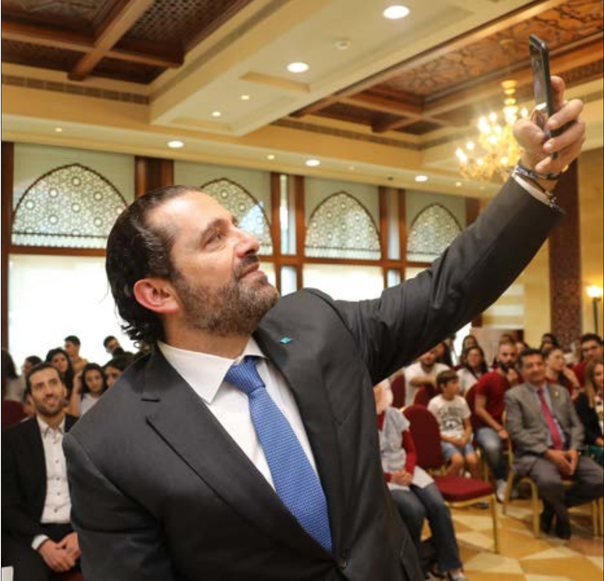
إدارا العهد لتلكا حكمة، هليدور الزوايا ولا فليينظر المجمع كلمة السر الخارجية (دالاني ونهرا)

تصلياً من معركة العدد. لأن القوات لن تراجع عن السيادة، وإذا قبلت بارع حقائب من دون السيادة، فإنها لن تقبل باقل من وزارات كبرى كالأشغال والتربية والصحة. لكن يبدو أن حزب الله يطالب بالصحة، كحقيبة خدمانية أولى، خلافاً لما جرت عليه العادة في الحكومات السابقة، ويطلب بها جنبلاط أيضاً، ما يعني أن الكناش انتقل إلى المستوى الثاني من عقد التاليف قبل حسم الأعداد. حريصاً على تشكيل الحكومة،