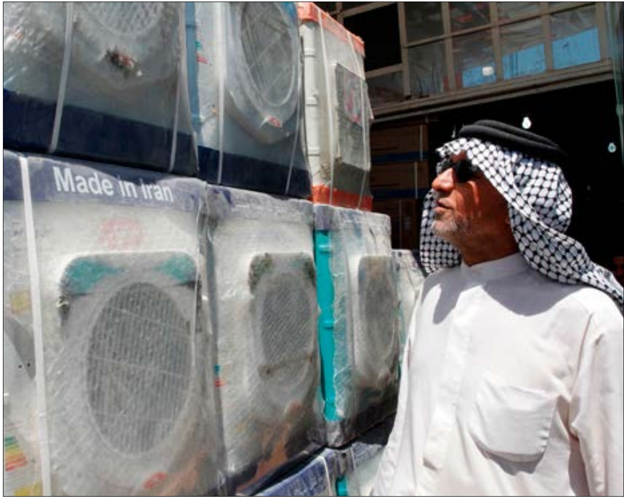
يؤكّد اقتصاديون أن المرافع سيماني اضطرار بالغة جزء العقوبات ضد إيران

الفرصة للتشاور مع شخصيات إمنية اجتماعية وسياسية، تمتلك معرفة فريدة حول المجتمع اليمني»، وجنّد مندوب المنظمة الدولية القول إن «التوصل إلى تسوية سياسية عن طريق الحوار الشامل بين اليمنيين هو السبيل الوحيد لإنهاء النزاع». ومن غير المعلوم ما إذا كان هذا الاجتماع سيشكل عاملاً مساعداً في إنجاح المفاوضات المقبلة في جنيف، خصوصاً أن التجارب السابقة القائمة على توسيع دائرة المشاركة في الحوار لتشمل وجوهاً من خارج الطرفين الرئيسيين في الصراع («انصار الله» و«الشريعة») وكذلك الاستئناس بآراء شخصيات أكاديمية وثقافية وصحافية في كيفية «استئناف العملية السياسية»، لا تدعت على التقاؤل بخطوات كهذه. لكن، إلى الآن، لا يبدو أن ثمة قراراً لدى «التحالف» والقوى الموالية له بمواكبة جهود المبعوث الأممي بقرار ميداني يخفّض حدّة التوتر، ويلجأ إلى القتل والتصعيد. إذ لا تزال الميليشيات المدعومة إماراتياً تحاول تحقيق منجز في محافظة الحديدة، على رغم أن عملياتها انخفضت وتيرتها في شكل ملحوظ خلال الأيام القليلة الماضية، بعد تلقيها ضربة وصفت بأنها الأكبر منذ انطلاق المعركة في