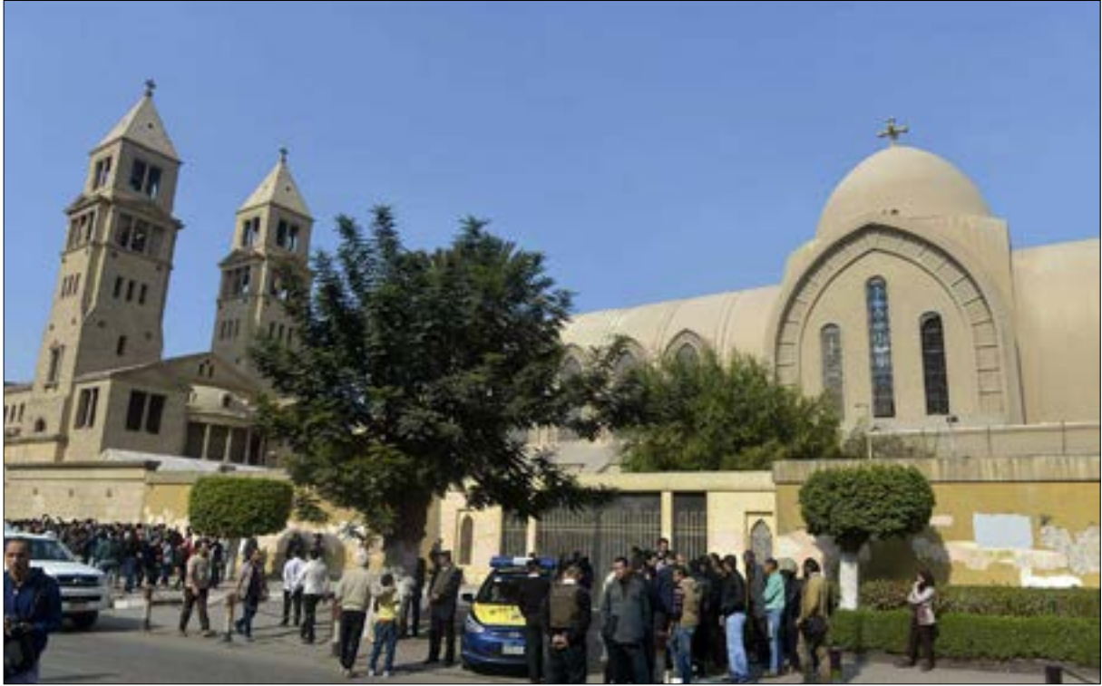
شكل إعلان مقتل الأنبا إيفانجيوس بداية لخروج صرعات كنسية تاريخية إله الملت

منمطف تاريخي تمر به الكنيسة المصرية. الانقسامات التاريخية راح ضحيتها أحد رجال الدين دخله دير ابو مقار ومحاولات «البابا» لاحتواء الموقف لا تزال حته الآن ناجحة في التعامل مع ما حدث. ليضعه السؤال حول إمكانات نجاح «تورته» المرتبطة داخل الكنيسة