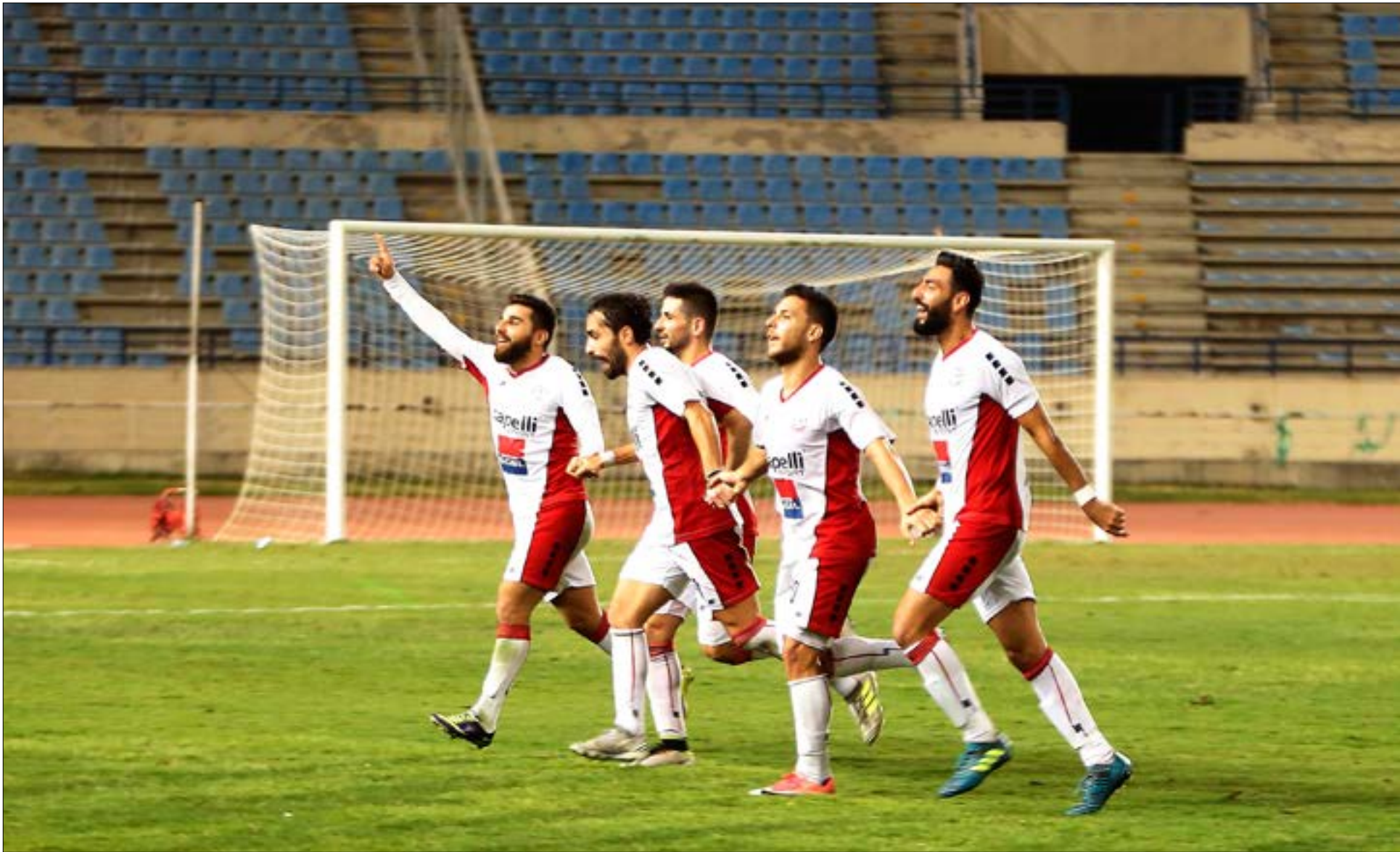
فريق السلام أختلف عن نسخة الموسم الماضي (أريليف - مروان بو حيدر)

مشكلت الإدارة لا تصنع المدرب الجديد كلياً (معدن الحاج علي)