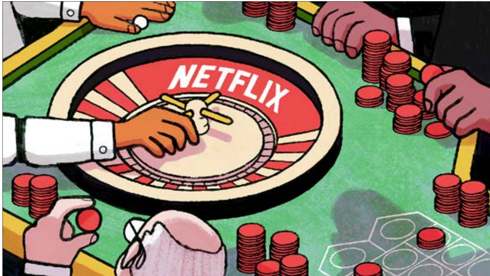
جوس هولتاني - الولايات المتحدة

حققت الشبكة الامبركية الرائدة في مجال إنتاج المحتوى الترفيهي وبنّته نجاحاً منقطع النظير خلال السنوات القليلة الماضية. إلا أنه حان الوقت لتستيفيك، من سكرة التفوق، وتواجه التحديات التي تهدّد بقاءها على العرش