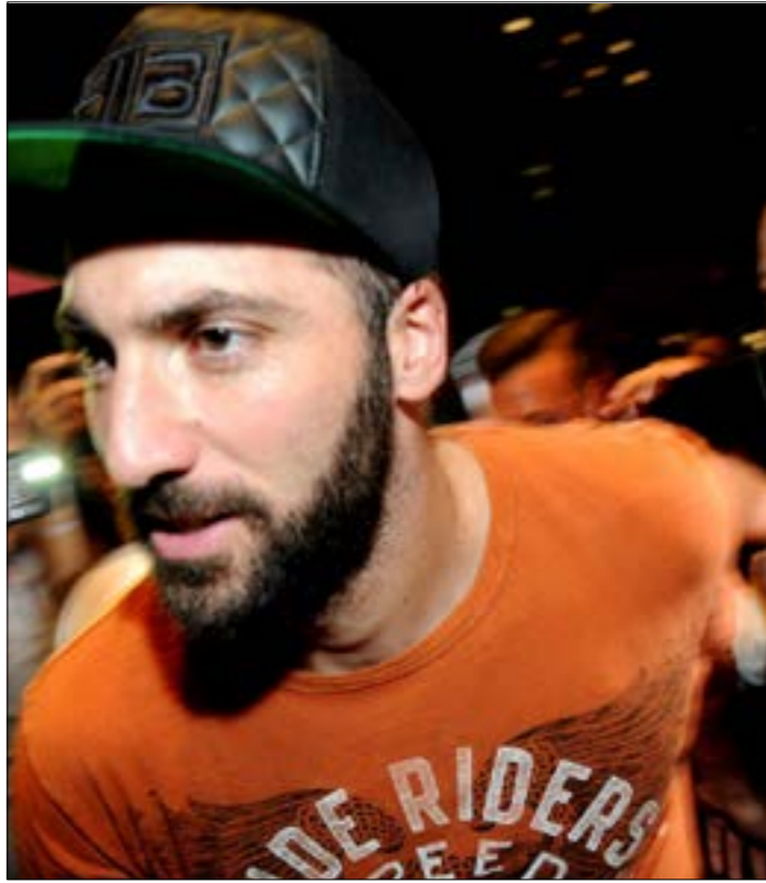
هيوغوايت فور وصوله إلى ميلان

وصل المهاجم الدولي الأرجنتيني غوزالو هيوغواين ليل أمس الأربعاء (2 أب/اغسطس) إلى ميلانو تمهيداً للانضمام إلى نادي ميلان الإيطالي، في خطوة تمهيدية لصفقة تبادل تشمل عودة المدافع الإيطالي ليوناردو بونوتشي إلى يوفنتوس، إضافة إلى انتقال مواطنه ماتيا كالدرّا إلى ميلان أيضاً.