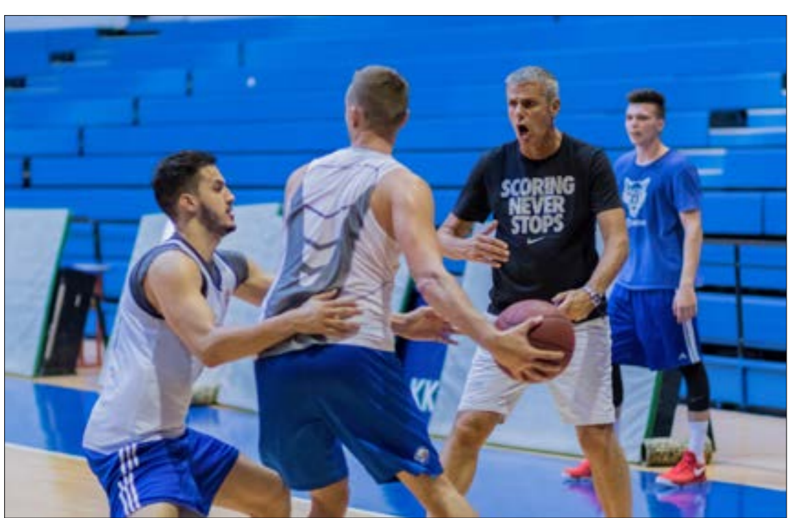
رحيل سابا وقدم سوبوتيتش يبقى حتى اللحظة في إطار حديث المكاتب

والسلوبه الدفاعي المحكم. وفي حال تمّ الاستغناء عن خدمات سابا، فإنّ الاسم الأقرب المتوقع أن يترأس الجهاز الفني للمنتخب الأول هو مدرب نادي الرياضي بيروت السابق اليوناني .المونتينيغري سلوبودان سوبوتيتش المعروف بـ«بيكسي»، ويعتبر سوبوتيتش من أهم المدربين في الوقت الحالي في بلدان منطقة حوض المتوسط، نتيجة الخبرة الكبيرة التي يمتلكها. وكان سوبوتيتش قد درب نادي الرياضي بيروت بين عامي 2012 و2016 وحقق معه عدداً من البطولات المحلية الآسيوية، كما كان له الفضل بزرع بذرة اللعب المنظم المعروف بـ«كرة السلة الأوروبية» في لبنان، وهي كرة السلة الحديثة التي تعتمد على الخطط والتكتيك العالي. وياعتراف عدد كبير من خبراء كرة السلة المحليين، فإن إنجازات الرياضي خلال الموسم الماضي وفوزه في بطولة آسيا هو نتاج لما زرعه المدرب اليوناني في نادي المنارة، دون الانقاص من الجهد الكبير للمدرب أحمد فزّان. واكتسب «بيكسي» خبرة الطويلة من الملاعب الأوروبية، إذ بدأ مسيرته التدريبية في عام 1994 مع إيراكليس اليوناني، وأشرف على أندية كبيرة في أوروبا مثل باناثيناكوس