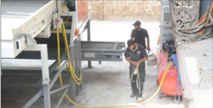
الدراسة التي أقيم المعمل استناداً إليها نسفت من أساسها (الخباز)

للمعامل بالتعاون مع البلديات، وتحسين نوعية النفايات التي تصل إلى المنشأة عبر ضمان عدم دخول النفايات الصناعية والإلكترونية إلى المرفق». وبالنسبة للمعمل والعوادم. عدا عن ثغرة الفرز من المصدر، ظهرت ثغرات عدة خلال التشغيل من اكتشاف الباحة المخصصة لتسيخ المواد العضوية ما تسبب بروائح كريهة وصلت إلى البلدات المحيطة حتى اشتكى الأهالي. فقامت القوى الأمنية بإقفاله بالتعاون مع اتحاد البلديات لإخضاعه لورشة توسعة وتطوير. الورشة انطلقت قبل أشهر بتمويل من البنك الدولي. واستهدمت البيات فرز وتسيخ حديثة وسقفت الباحة المخصصة للتسيخ.