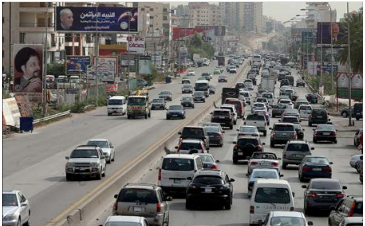
حنته حله أزمة السير صار هنت تاليف الحكومة (مبلغ الموسوي)

لا تزك المراوحة الحكومية على حالها. لكن العلاقات الاقتصادية والمالية تكثر ويزداد الاهتراء الداخلي يوماً بعد آخر من دون أن يكون للقوى السياسية أي حاضم للإسرام في عملية التاليف