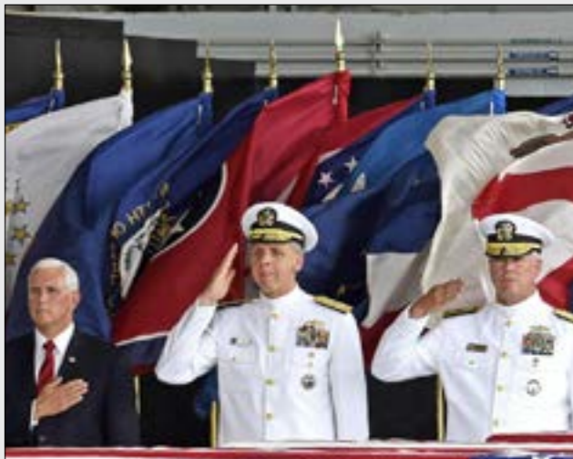
اعتراف بنس وصول الرفات إلى هاواي دليلاً على نجاح قصة تراهب وكيم (في يمين)