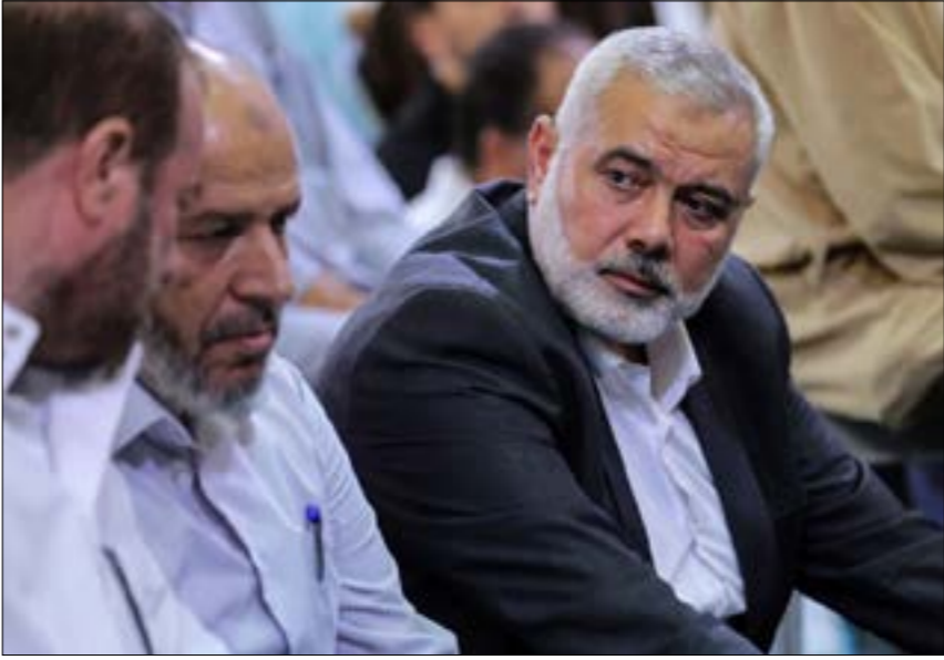
اعضاء اللجنة القطرية للتفاوض مع حماس في غزة.

في محاولة لتهدئة التوتر مع حماس، في وقت تشهد فيه قوات الاحتلال الإسرائيلي في القطاع، عمليات عسكرية جديدة، في محاولة لتجديدها، في ظل استمرار العمليات العسكرية في قطاع غزة، ما دفع حماس إلى إعلان عزمها التفاوض مع الاحتلال الإسرائيلي، في ظل استمرار عملياتها العسكرية في القطاع.