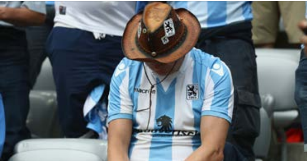
لاعب من فريق ميونخ 1860

والكأس الالمانيّة مرّتين. هذا وقد مرّ على الفريق الكخبر من الأسماء الألامعة، وكان أيقونة الكرة الالمانية فرانتس بيكنباور قريباً جداً من التّوّيق مع النّادى في 1958، إلاّ أنّ خطة انتقال ابن الـ 13 عاماً تبدّت وقتها بعد أن تمّ صفعه على وجهه من لاعب في الفريق. هبط النّادى للمرّة الأولى من البوندسليغا عام 1970، ثمّ عوقب