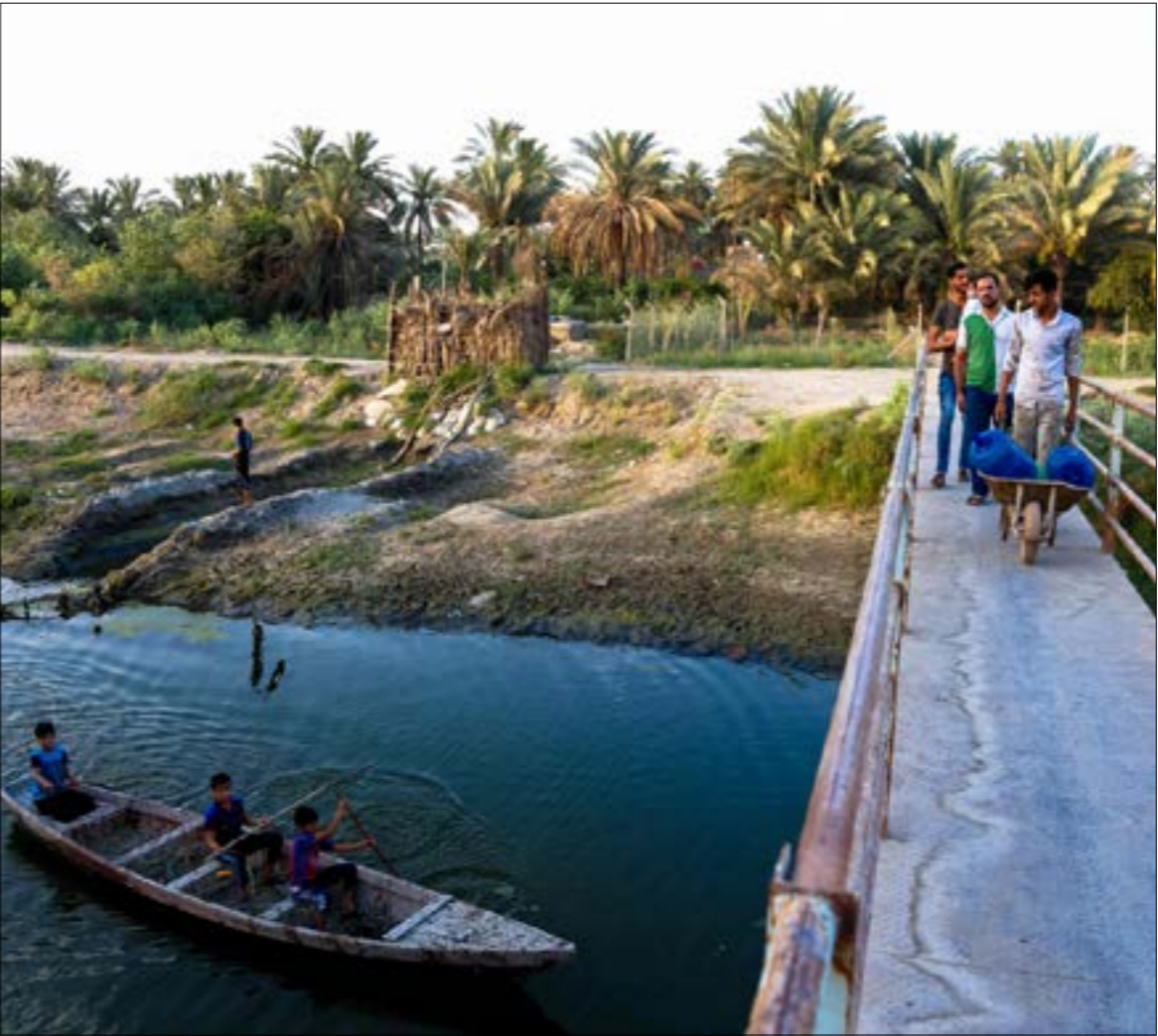
يهدّد الجفاف مناطق زراعة الارز، ومن بينها منطقة المشايخ في محافظة النجف