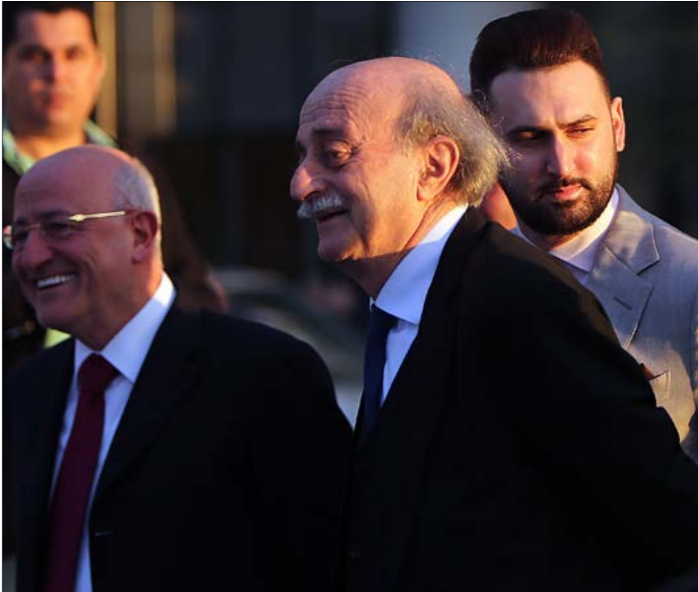
جنبلاط أكثر المستفيد من الائتلاف مع العهد للّد العصب (هيلم الموسوي)

لم تنتج الاتصالات السياسية المتسارعة خلال اليومين الماضيين اي تطوّر على صعيد الإسراع في تشكيل الحكومة. حتى اللقاء المرتقب اليوم بين الرئيس ميشال عون ورئيس الحزب الاشتراكي وليد جنبلاط، هن المرجح ان يبقى في إطار الشكل، مع تمسك جنبلاط بالحصة الدرزية كاملة، في إطار سعيه إلى الاحتفاظ بـ«فيتو» ميثاقى في مجلس الوزراء