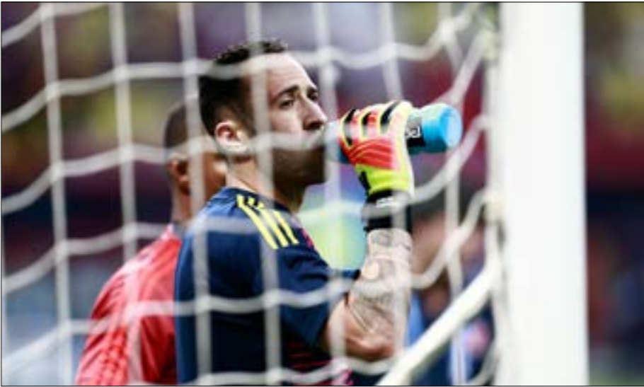
حاول أوسينا استرجاع ذكريات هيغيتا (بجانب كرميتا)

الإصابة، وقدم المدافعان مينا وسانتشين شوطا كانا فيه في قمة تركيزهما. أخرج الحكم أول بطاقة في اللقاء، بالدقيقة الواحدة والأربعين على كولومبيا بعد احتكاك بين باريوس وجوردان هندرسون أثناء الوقوف في حائط الصّد، في لقطة أظهرت حجم التوتر بين الخصمين، ولم تكن تلك اللقطة الوحيدة التي تحدث فيها المناوشة. اختصرت كولومبيا الشوط الأول بنجاح تراجعها للخلف وحرمان الإنكليز التسجيل وخلق الفرص، إذ نجحوا في إغلاق المساحات التي يفضلها لاعبو إنكلترا، لكنهم فشلوا في اللعب على المرتدات والكرات الطويلة، أما المنتخب الإنكليزي، فافتنى بمحاولة خجولة لم تحدث أي تغيير في النتيجة. وكان جون ستونز (المدافع) أفضل اللاعبين في هذا الشوط الأول بنسبة 100% (36 تمريرة)، فيما كان رامديل فالكاو قائد كولومبيا أقل من لمس الكرة (مرتين فقط). لم تتغير الأمور كثيراً في بداية الشوط الثاني،