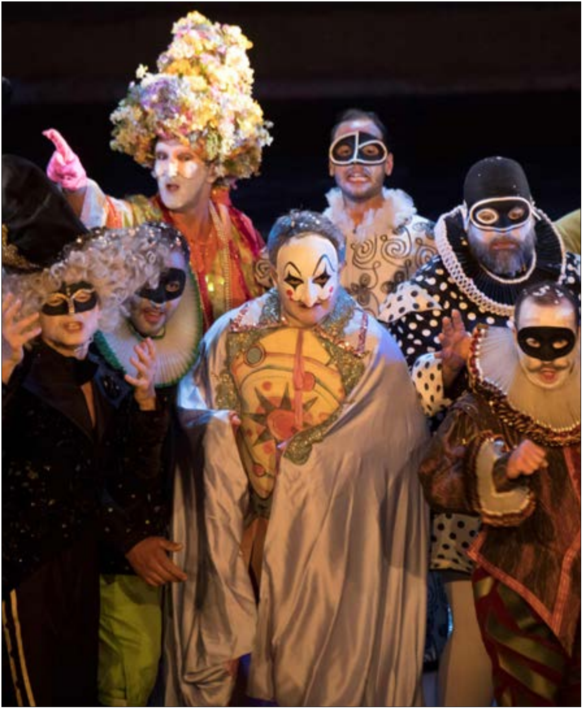
مغنون يقدمون اوبرا الرغو بواتو «ميفيستو» (إخراج جان لوي غريندا) ضمن «كوريجي دورانج» مهرجان الاوبرا الشهير المقام حالياً في الجنوب الفرنسي. الحدث السنوي مخصص للاوبرا وللمختلف اشكال الفنون الغنائية والسفوفونية (برتران لانغلو)