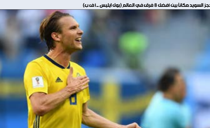
حجز السويد مكاناً بين أفضل 8 فرق في العالم