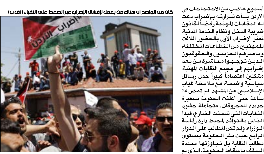
كان من الواضح ان هناك من يهمل لأشغال الإضراب عبر الضغط على النقباء

تفاوتت ردود الفعل على تسمية رئيس حكومة جديد، بين من اكتفى بإسقاط الحكومة وشعر بالرضى وكان «الحفلة انتهت»، وبين من يريد تجريب الرئيس الجديد قبل الحكم عليه، وبين من رأى الخفأفاً على إرادة الشارع بتسمية أحد الوزراء السابقين لمنصب الرئيس الجديد. مقال «إعطاء الحكومة الجديدة فرصة»، تردد بين إعلاميين وكُتّاب ومؤثرّين، على مواقع التواصل الاجتماعي، وهذا انعكس انخفاضاً في نسبة الحضور في الشارع، عقب تأكيد تكليف عمر الرزاز، قذره رئيس مجلس النواب عاطف الطراونة بنحو 60 في المئة، وترافق ذلك مع أبناء متضاربة بخصوص تنفيذ النقابات إضرابها المقرر الثاني، انتهت أخيراً بإعلان مجلس النقباء الإضراب من الخامسة من صباح أمس الأربعاء، وحتى الواحدة ظهراً، ليلقي بعدها رئيس مجلس النقباء على العيوس، كلمته. كان من الواضح أن هناك من يعمل لإفشال الإضراب، وبأن هناك ضغوطات على النقباء، تمت ترجمتها بخسريبات عن تعليق الإضراب مما انعكس على أعداد الحاضرين أمس، وعلى مدى الالتزام بالإضراب بين القطاعات التي أعلنت مشاركتها في الإضراب الأول. انتظر عدد كبير من المحتجين تحدى رئيس مجلس النقباء الذي تحدث عن الاحتجاجات في المملكة وحثًا المظاهرين والأمن، وكافة القوى التي ساندت الإضراب. كلام العيوس تناول نقاطاً عدة، منها رفض القوانين من مرجعيات خارجية، ويقصد ربط قانون الضريبة بصندوق النقد الدولي، كما انتقد الفساد الذي وصفه بأنه أصبح «مؤسسياً»، وأكد ضرورة استعادة ثروات الوطن التي تمت خصصتها. العيوس لم يفته