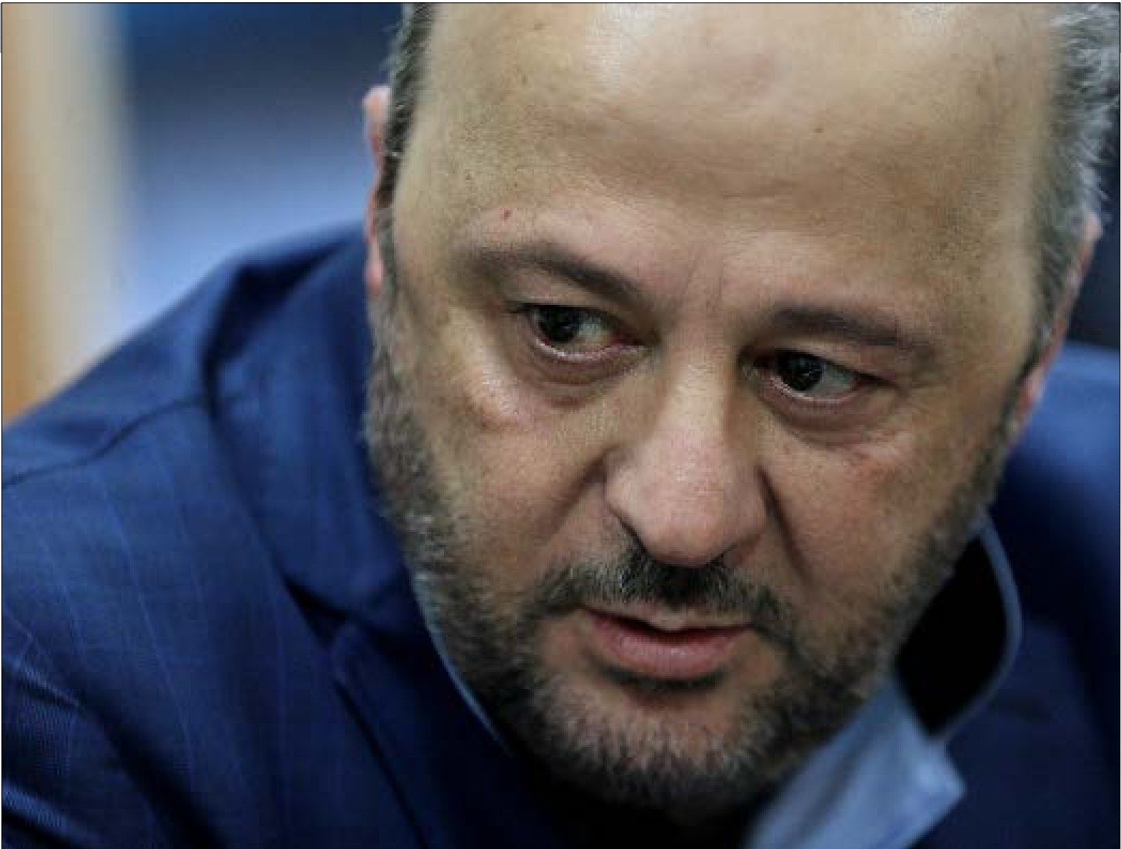
رياشي، بري ولجنة الاعلام والاتصالات، اكلت من حصنهما (هيلم الموسوي) في المشاريع التي تحطّمها

واجه رياشسي، خلال ولايته، «قُلة دراية» جزء كبير من القوى السياسية، بأهمية تحصين قطاع الإعلام والصحافة. وغياب الحد الأدنى من الحس بالمسؤولية تجاه المؤسسات الإعلامية والإعلاميين. «نُقدّم المشاريع التي فشلنا في إقرارها هذا إذا ما افترضنا عدم وجود «نُبات خبيثة»، تستهدف تدمير القطاع الاعلامي في لبنان، وإبقاء خاضعاً عم بقدر أفضهم ليش ما مرق»، تحبب رياشي، مُضيفاً أنّ الدولة «لم تُنظّم، منذ سنوات، عملية استيفاء الرسوم.