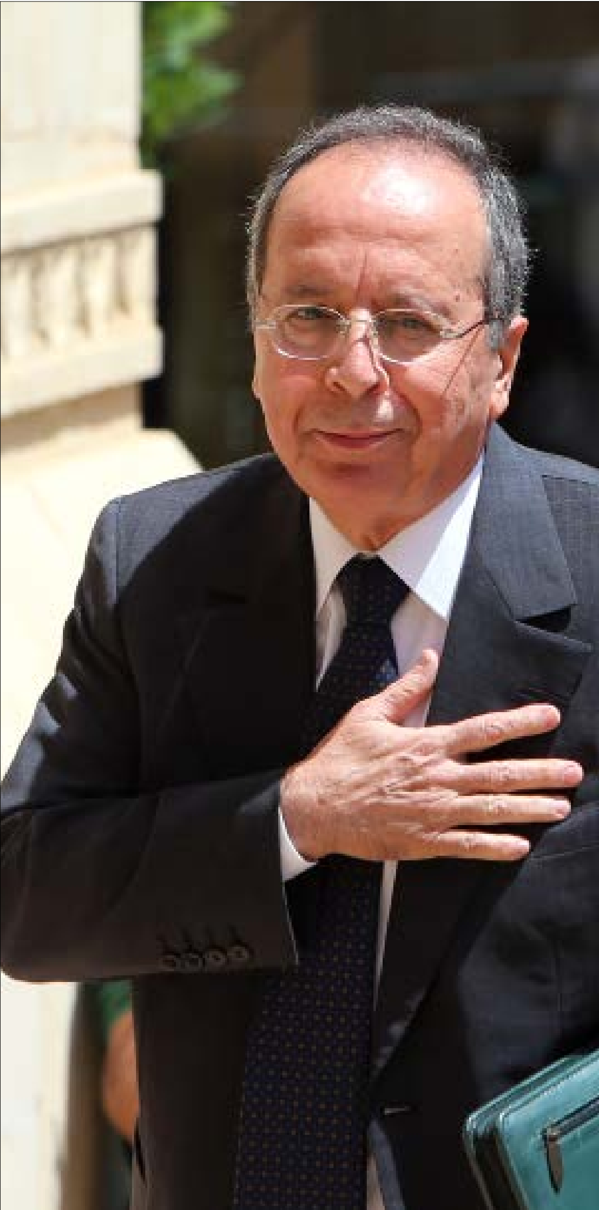
ذكّر الشاهد بتصرف وزير الخارجية الإسرائيلي: نحن كما وراء إصدار القرار 1559 (هيلم الموسوي)

منذ زمن لم يعد أحد يكتفر، في لبنان، لما ستصدره هذه المحكمة من أحكام، جاء في فصلها الأخير ضابط، ين رموز الحقبة السورية في لبنان، ليُشهد فيها وينجح في السيّد ووجده مقتنعاً أنّ سوريا تقف وراء ما حصل. ذلك القاضي ديفيد ري، الذي يراس الجلسة، أنّ يُخبر