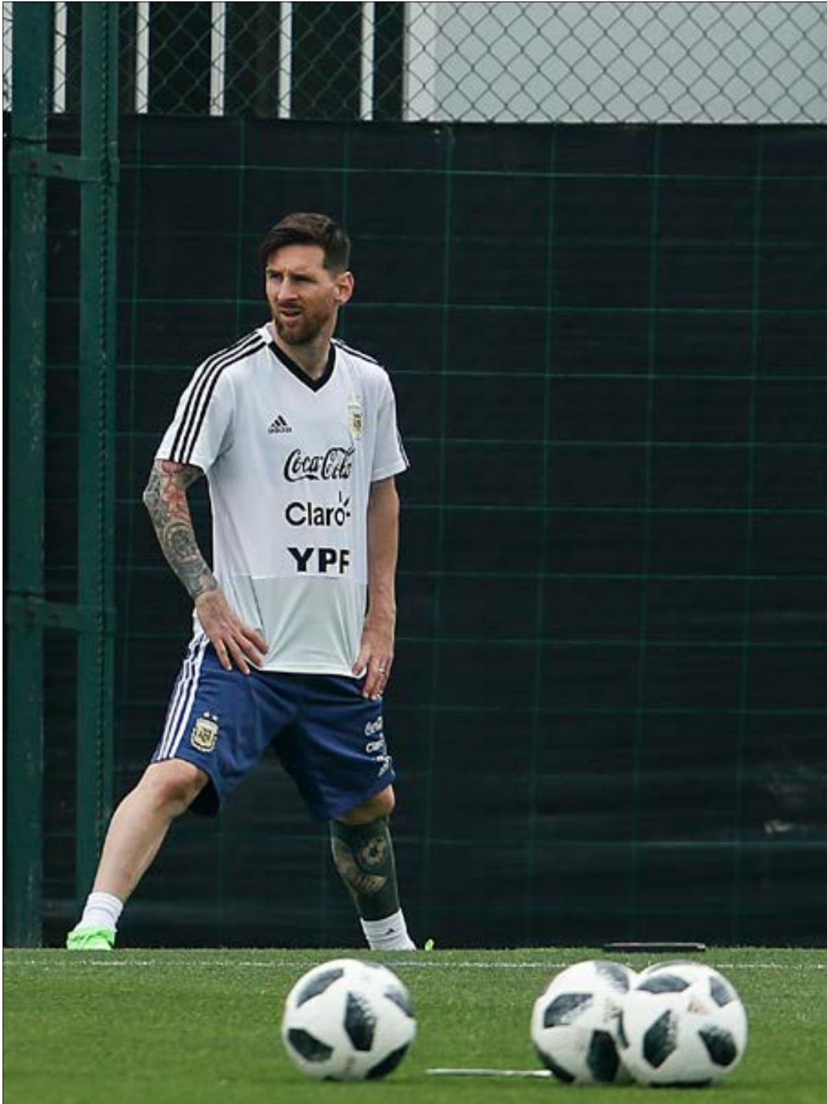
ليونيل ميسي لعب دوراً كبيراً في إلغاء المباراة

في إطار ردود الفعل الإسرائيلية، أفاد الموقع الإلكتروني لصحيفة «يديعوت أحرنوت» العبرية، نقلاً عن صحف أرجنتينية، بأن المباراة الغيت «بسبب ضغوط سياسية (لم توضحها)»، مشيرة إلى احتمال إجراء المباراة في مكان محايد لاحقاً، من دون تحديد موعد، واعتبرت الصحيفة أن حركة مقاطعة إسرائيل وسحب الاستثمارات منها وفرض العقوبات عليها (BDS) «حققت نصراً كبيراً على إسرائيل». من جانب آخر، ذكرت صحيفة «معاريف» الإسرائيلية أن لاعبي المنتخب الأرجنتيني ميسي وخافيير ماسكيرونو، هما اللذان ضغطا من أجل إلغاء المباراة مع إسرائيل. وأشارت إلى أن اللاعبين طلبا من قادة المنتخب عدم المخاطرة بسبب الضغوط السياسية التي مورست على المنتخب لإلغاء المباراة. ونسبت «معاريف» هذه الأنباء إلى قناة «فوكس سبورت» الأميركية. الإعلان عن إلغاء المباراة دفع بمنات الفلسطينيين في قطاع غزة للاحتفال، بينما أصدر الاتحاد الفلسطيني لكرة القدم بياناً في رام الله في الضفة الغربية المحتلة، شكر فيه ميسي وزملاءه «الذين رفضوا أن يكونوا جسراً لتحقيق مآرب غير رياضية»، وقال رئيس الاتحاد، جبريل الرجوب، إن «إرادة القيم والأخلاق ورسالة الرياضة انتصرت اليوم، وتم رفع البطاقة الحمراء، بوجه إسرائيل بإلغاء هذه المباراة». بدوره، رحبت حركة مقاطعة إسرائيل (BDS) بالقرار الأرجنتيني، وفي تغريدة على حسابها في موقع «تويتر» رحبت بـ«خبر إلغاء مباراة كرة القدم الودية لمنتخب الأرجنتين استجابة للضغوطات التي أطلقتها نشطاء لإلغاء المباراة، التي تعمل على تبييض الجرائم الإسرائيلية».