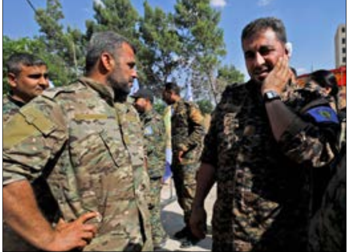
اكد «مجلس هنج العسكري» انه لنقى ضمانات من «التحالف الدولي» (ف ر ب)

وفي المقابل، تناقل عدد من وسائل الإعلام التركية تفاصيل حول «اتفاق مننج» من مصادر محلية