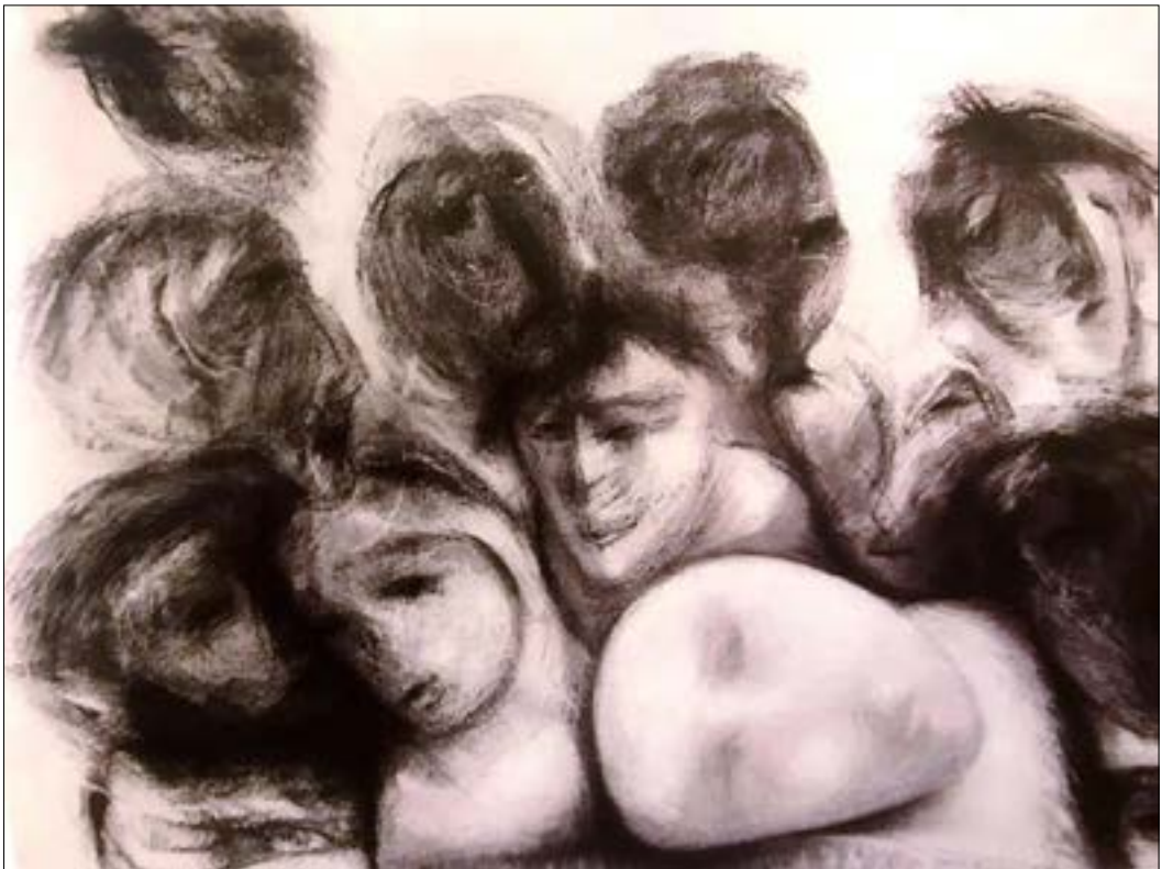
من وجه عنوان (صحن على ورق - 47* 67 سنتم)