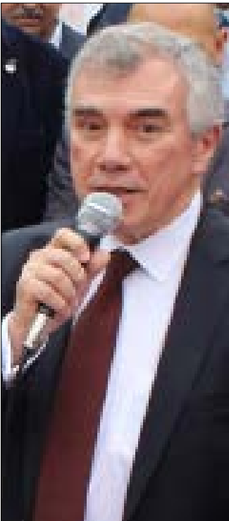
اتفاح 5 + 1، مع إيران كان الاضخ (من اليمين)

إن أزمة العلاقة مع «الناتو» قد نتفأقم، لأن ما بعد التطهير الذي يقوده إردوغان، يستند إلى إعادة بناء الجيش وهيكلته بالتحالف مع كتلة من الحرس القديم، من الضباط القوميين