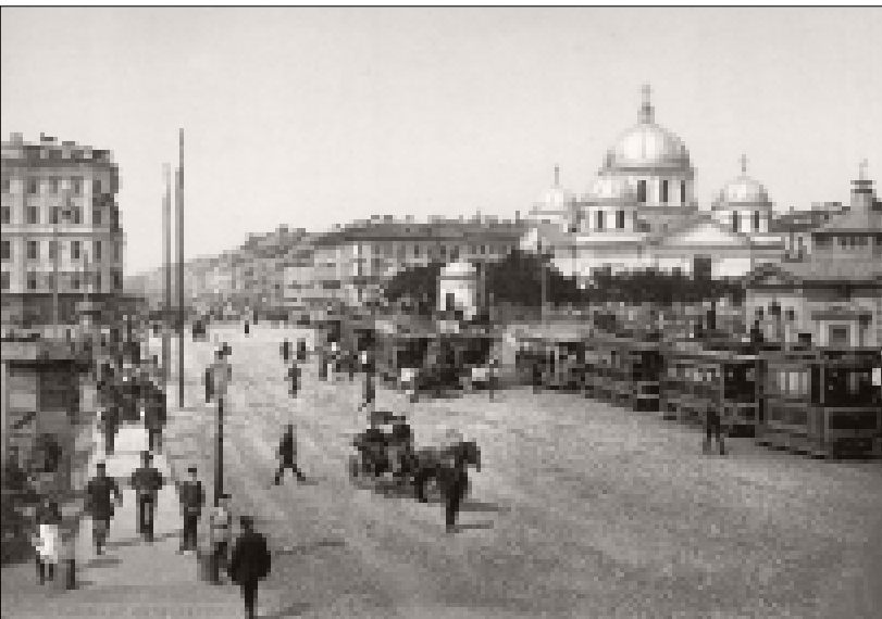
منذ القرن 19ا على الأقل خاصة النخبة القومية في روسيا ناقشا غنيا حول هوية البلاد

عليهم. وسيخاخر استقلال روسيا بزعامة موسكو الكامل مئة عام أخرى. استمر الكيان المغولي على الأرض الروسية حتى زحف إيفان الرهيب على خانات التتر وأخذ كارازن عام 1552م وإستراخان بعاصمتها ساراي 1566م. وسيتم لاحقاً القضاء على أراي الإمارات الربدية وهي خانة القرم عام 1783م، بعد مذبحة رهيبة.