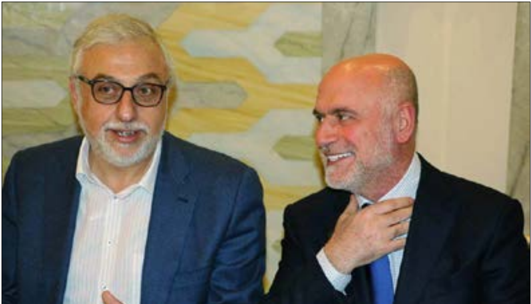
هناك ثلاث ماكينات لـ «المستقبل»، في الضنية، وإل يوجدان تنسيف بينما (الوكالة الوطنية)

الفاضل» في ال1958، بوجه الأعاوات. هذه الصورة التي اطلقها مرشد الصمد (والد جهاد الصمد) ومحمد خضر (والد أحمد فنتق)، وانتخبا بفصلها ناخبين، «الفاضل» تحوّل إلى «هو الأقوي في الضنية»، لماذا التبار والآن هو زمن الأحفاد (سامي). أما الفاضل، فبعد أن خسر أملاكه بسبب