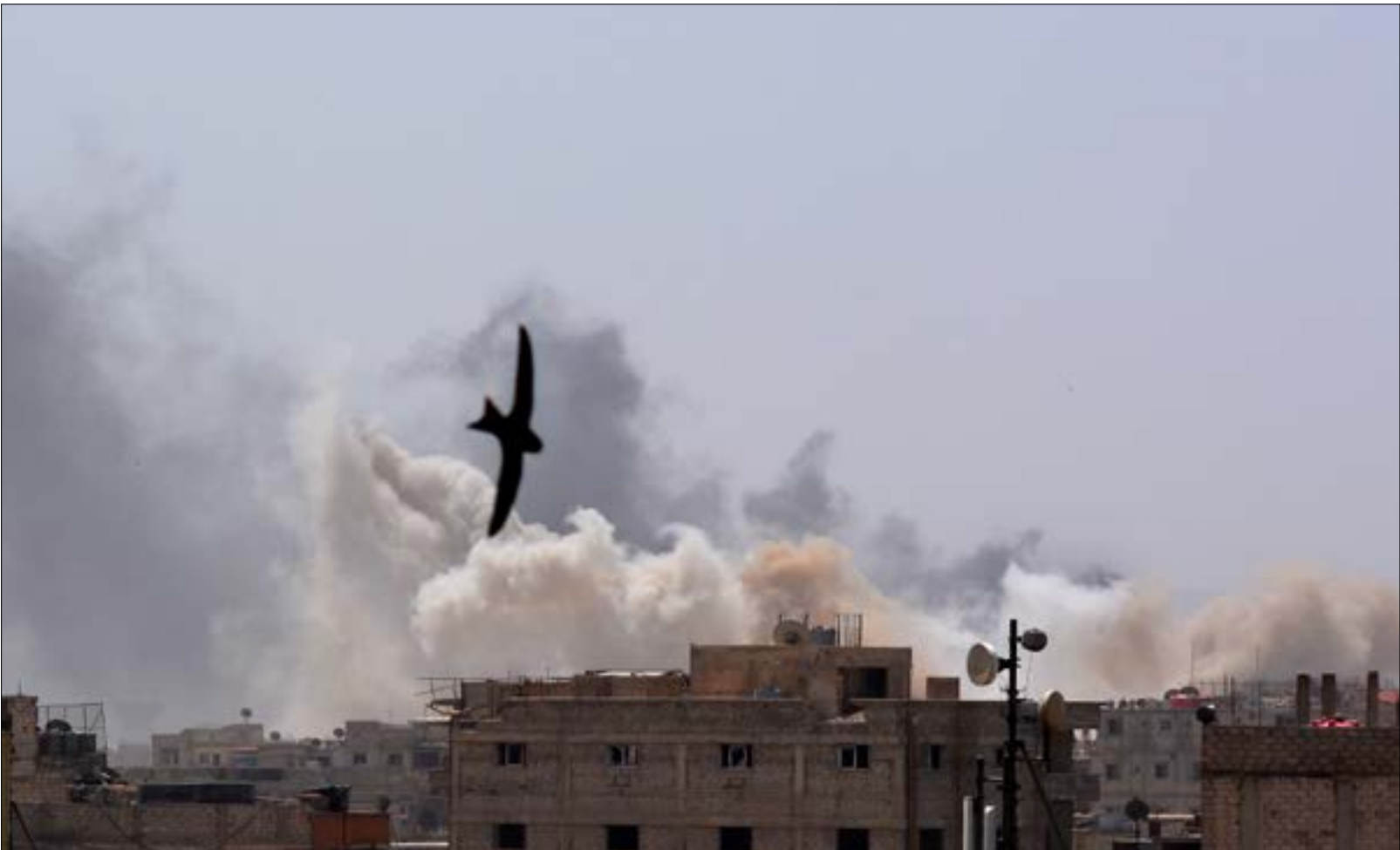
تواصلت العمليات العسكرية في محيط مخيم البرموك والحجر الأسود جنوب دمشق

أمس أي معلومات، غير أن تصريحات وزير الخارجية الفرنسي جان إيف لودريان، الذي يفترض أن يحضر الاجتماع، أكدت أن الاجتماع مناسبة جديدة للتحشيد ضد روسيا في