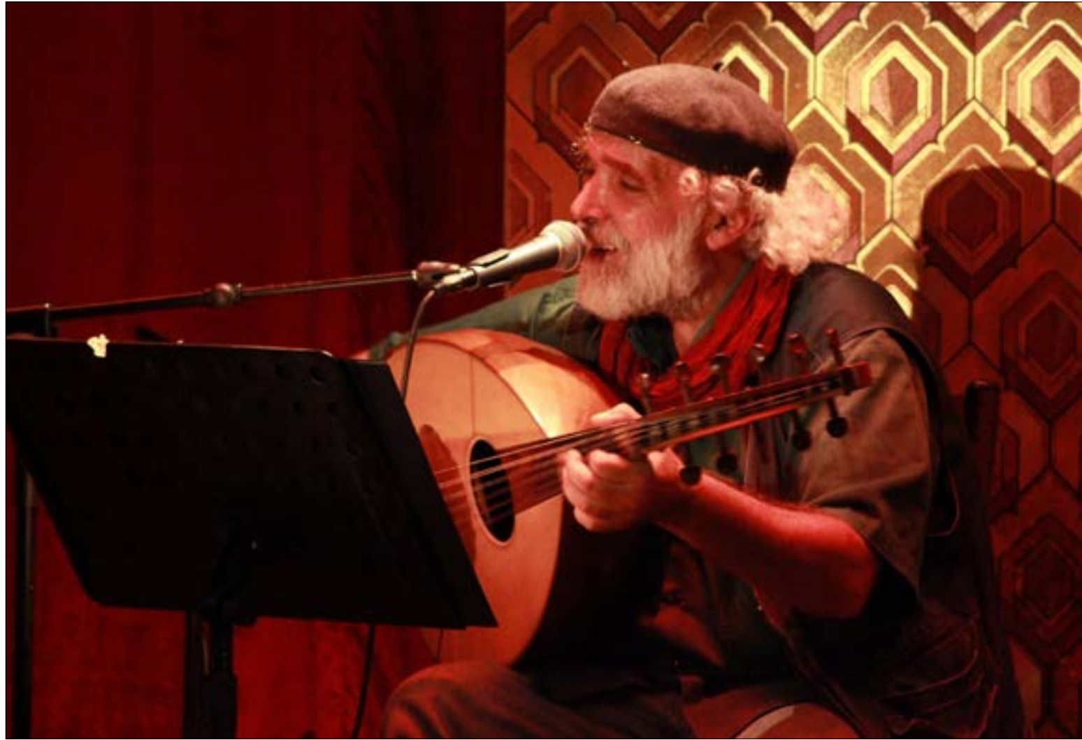
يؤدّي من جديد «برضو خود وعلو البارق»،

لا شيء تَصيّر في الفئات اللبنانية الملنزم بقضايا البسطاء والأطفال كما القضية الفلسطينية والمقاومة. الأحد يطلّ في أمسية موسيقية شعبية مع فرقته «الرخالة» التي قدّم معها العديد من الحفلات في العقود الأخيرة