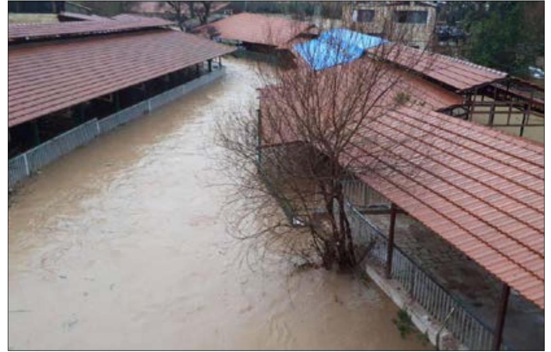
العمود بإقامة سدود صغيرة تخفّف قوة السيلك الذي يجتاح مرافق العاصي لم تخفّف (الأخبار)

منذ 2006، ينتظر مرّبو أسماك الترويت في الهرمك، تعويضاتهم عن خسائر السيلك الذي ضرب نهر العاصي في ذلك العام. الوعود والإقتراحات بإقامة سدود وبرك هائلة لتخفيف اندفاع السيول وتقليل أضرارها تسكّن في ادراج الوزارات والادارات، وهدهم مرّبو الأسماك واصحاب المشاريع السياحية على العاصي يتحملون الخسائر، تلو الخسائر، على وقع مشاريع يعلن عنها اعلاميا فقط