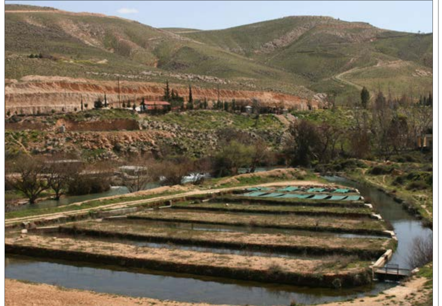
نحو 200 مسمكة كبيرة ومتوسطة وصغيرة على نهر العاصي تفنّد الى التنظيم (الأخبار)

ومنذ سنوات طويلة، يطالب مرّبو الترويت في الهرمك عيّا بإنشاء سدود صغيرة أو برك مائية لدرء مخاطر السيول الربيعية والخريفية التي تتوالى من جرود راس بعلبك والفاكهة والقاع في السلسلة الشرقية ومن وادي قعرا في السلسلة الغربية، وتحوالى معها الخسائر، فيما تغيب تعويضات