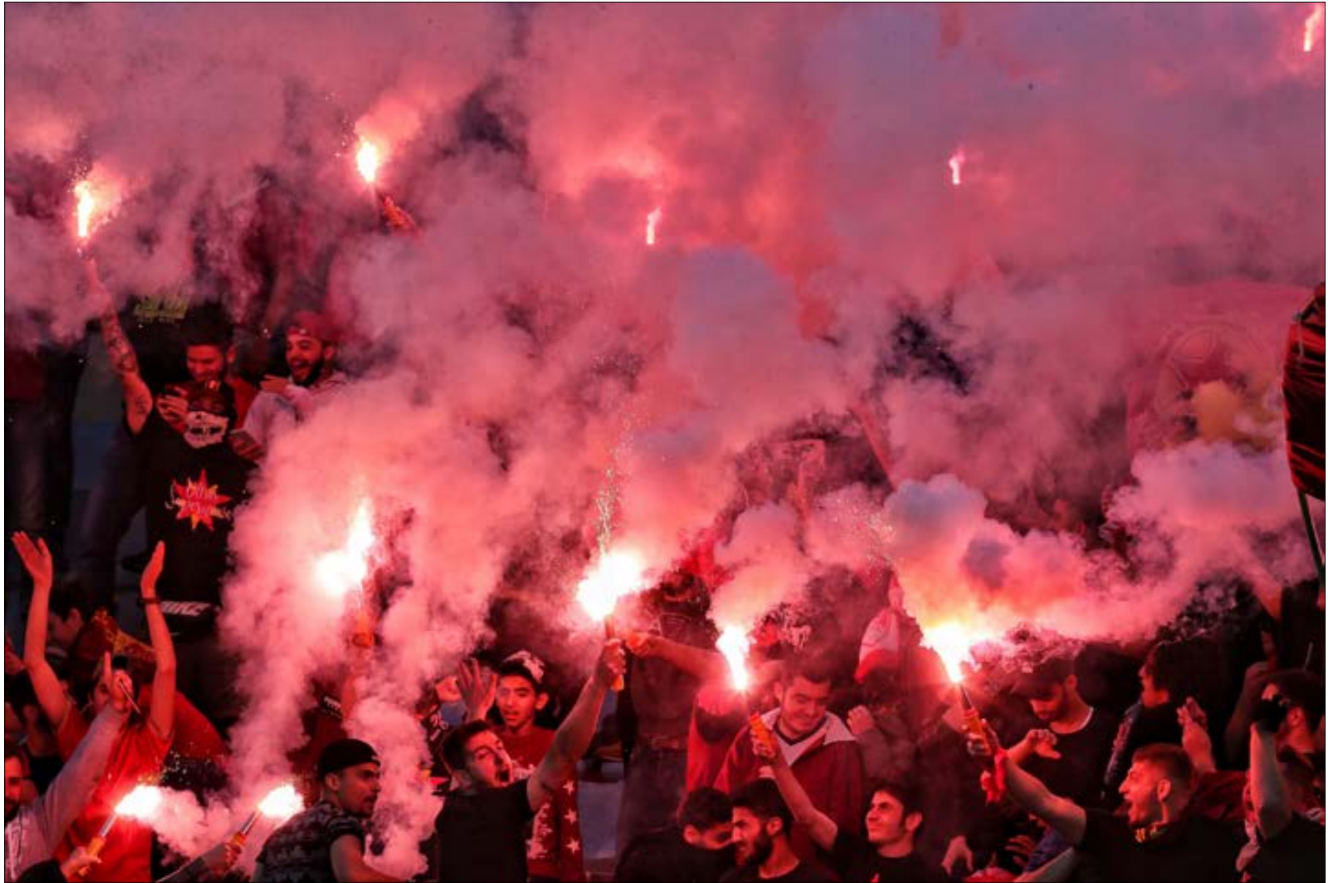
القرار اصبح لدى القوى الامنية (معدّات الحاج علي)

بحضور الجمهور حتى توالت السيناريوهات التي تخفّد عدم إمكانية حضور الجمهور لأسباب عدة: