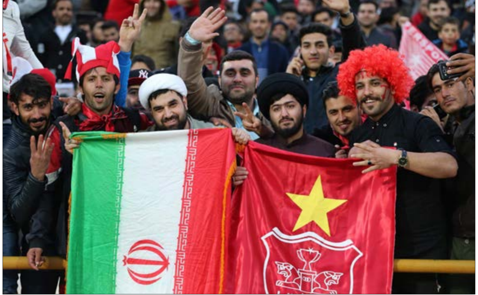
تصدر بيرسيبوليس الإيراني برصيد 13 نقطة مقابل 12 للسد القطري الذي حل ثانيا بقيادة الإسباني المخضرم ميرنانديز

12 نقطة. وانجز العين «مهمة» بلوغ الدور المقبل بفوزه على الريان بأهداف المصري حسن الشحات (11) وعمر عبد الرحمن (55) والسويدي ماركوس بيرغ ثاني هدافي البطولة القطري بهدف لسببستان سوريا (85). الريان فشل للمرة الثامنة (مجموع مشاركاته في المسابقة) في تخطي الدور الأول. علماً بأن فريق الحدرن الدنماركي مايلك لاوروب خاض المباراة في غياب هدفه المغربي عبد الرزاق حمد الله المصاب. أما عن المصري حسن الشحات، فهو يقدم أداءً لافتاً، إذ لعب مع العين 13 مباراة في مختلف البطولات سجل خلالها 10 أهداف وصنع 12 هدفاً. وانضم الشحات إلى صفوف العين في كانون الثاني/يناير الماضي قادماً من مصر للقفازة. وقال المصري، «إن فريقه استحق الفوز على الريان القطري 4/1 وحصد بطاقة التاهل رسمياً إلى دور ال16 لدوري أبطال آسيا». مضيفاً «أنه وزملاءه كانت لديهم ثقة كبيرة بتحقيق الفوز رغم أن المباراة كانت