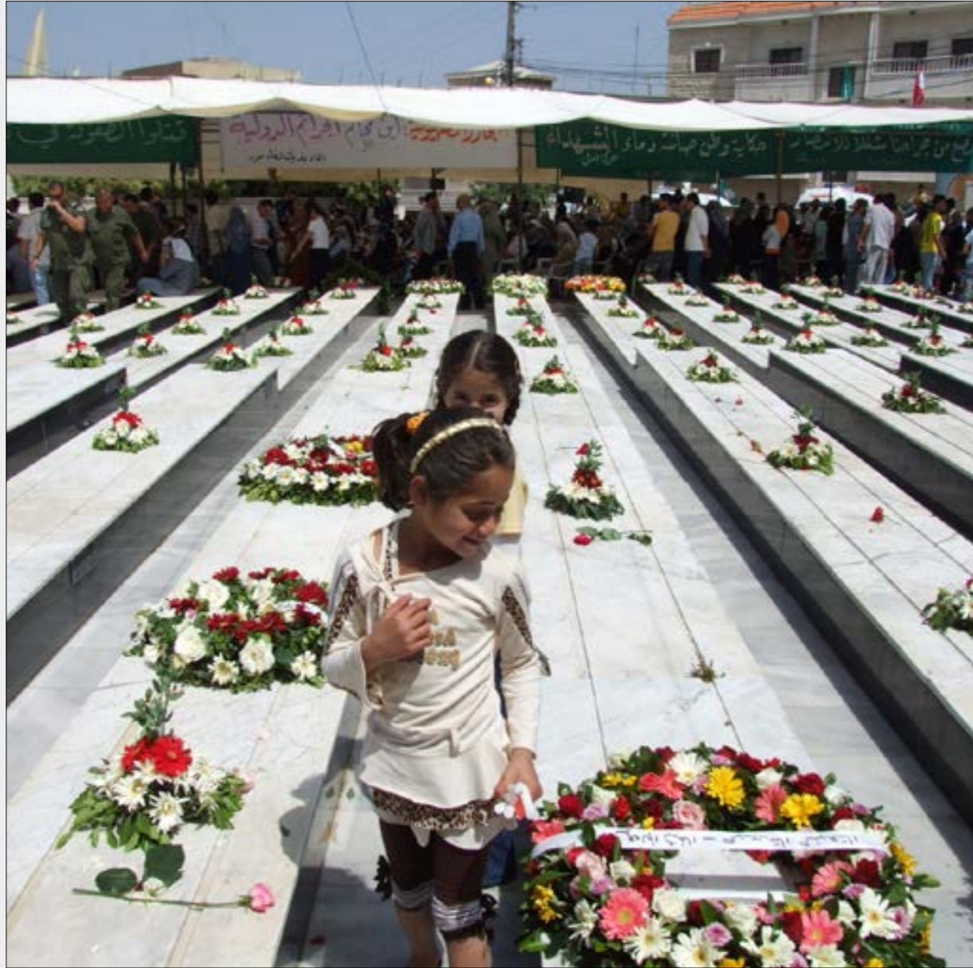
مجزرة قانا 22 عاماً... التمييز مستمر