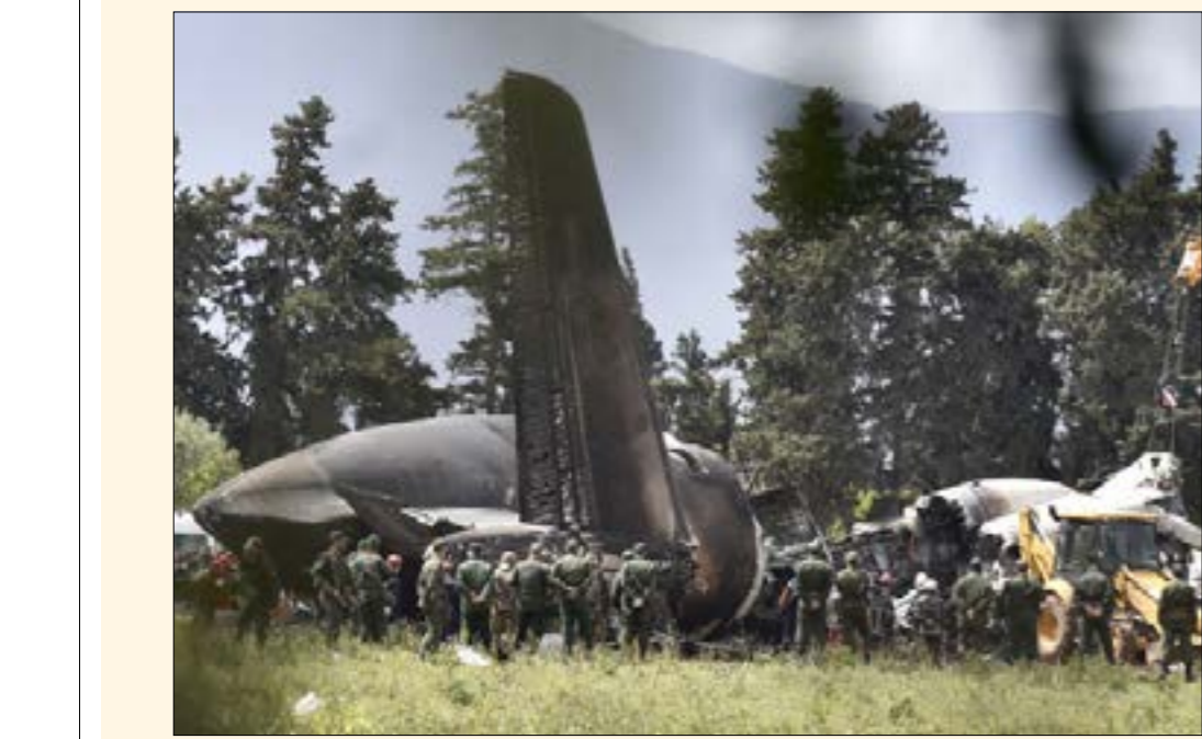
(ا ف ب)