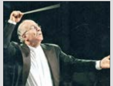
NDU - ذوق مصعب، مسرح البطربوك الماروني الكاردينال مار بشارة بطرس الراعي، الثامنة والنصف مساءً غد.

ينظم المعهد العالي للموسيقى (الكونسرفتوار) والجامعة الانطونية، أمسية موسيقية، بالتعاون مع جامعة الولاية والمركز الثقافي الايطالي، في الـ