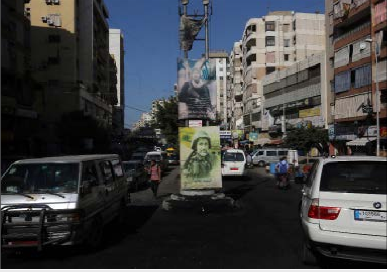
تفرع من «الموقف»، زواريب يظف عليها اسم «شوارم»