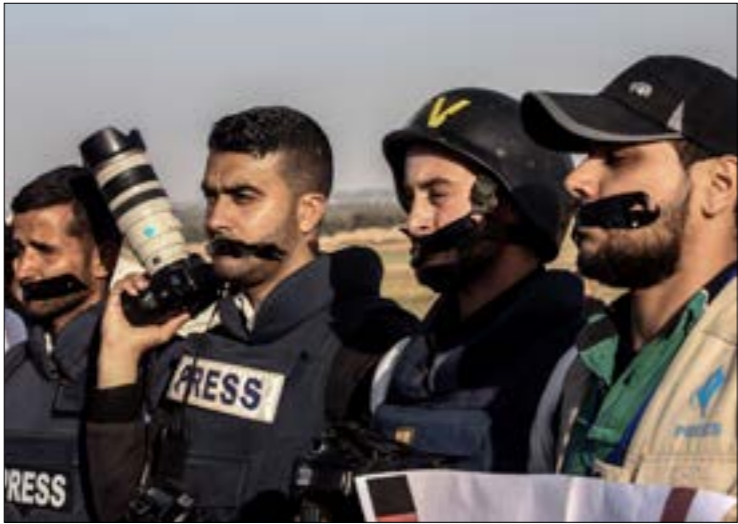
شخه العام الماضي، 530 انتهاكا بحق الصحفيين، منها 376 تفهما المدعو، و154q ببد السلطة وحماس، (أ ف ب)

النجاح» الإخباري يعيد نشر تغريدات المؤلفين مرفقا بمواد هجومية ضد حركة «حماس». علماً أن المركز الإغلامي يتبع الجامعة التي لا يزال رئيسها هو رامي الحمدالله نفسه، إذ كان اشتراطه أن يحل في منصب رئاسة الوزراء، على أن يبقى منصبه في رئاسة الجامعة معقفاً، ويتوب عنه قائم بالأعمال إلى حين عودته. في المقابل، تصر نقابة الصحفيين على