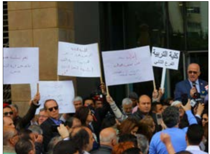
أوصى المتقاعدون الأساتذة والطلاب بعدم إقتحام المرشدين الذين لايعمونه الجامعة

الذين هم في الخدمة حالياً يفقد ب 386 مليار ليرة لإستثمار سنوي بمعدل 6,5% و 1145 مليار ليرة لبنانية لإستثمار معدله 8%». حنأ أوضح أن الفرضيات للحسابات هي عدد الأساتذة المتفرغين وفي الملك 1800 أستاذ، وهناك إقحطاع شهري 6% من رواتب الأساتذة. في حين أن المردود الإستمثاري في المؤسسات المحلية والدولية يراوح بين 7% و11%