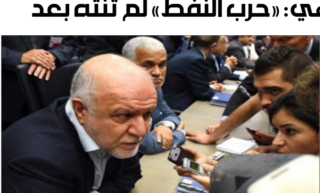
إعلان وزير الطاقة الإيراني رض بلاده عن اسعار النفط

وفي حين ادعى المالكي أن طائرة «قاصف 1» ذات «خصائص ومواصفات إيرانية»، أكد مساعد المتحدث باسم قوات الجيش واللجان