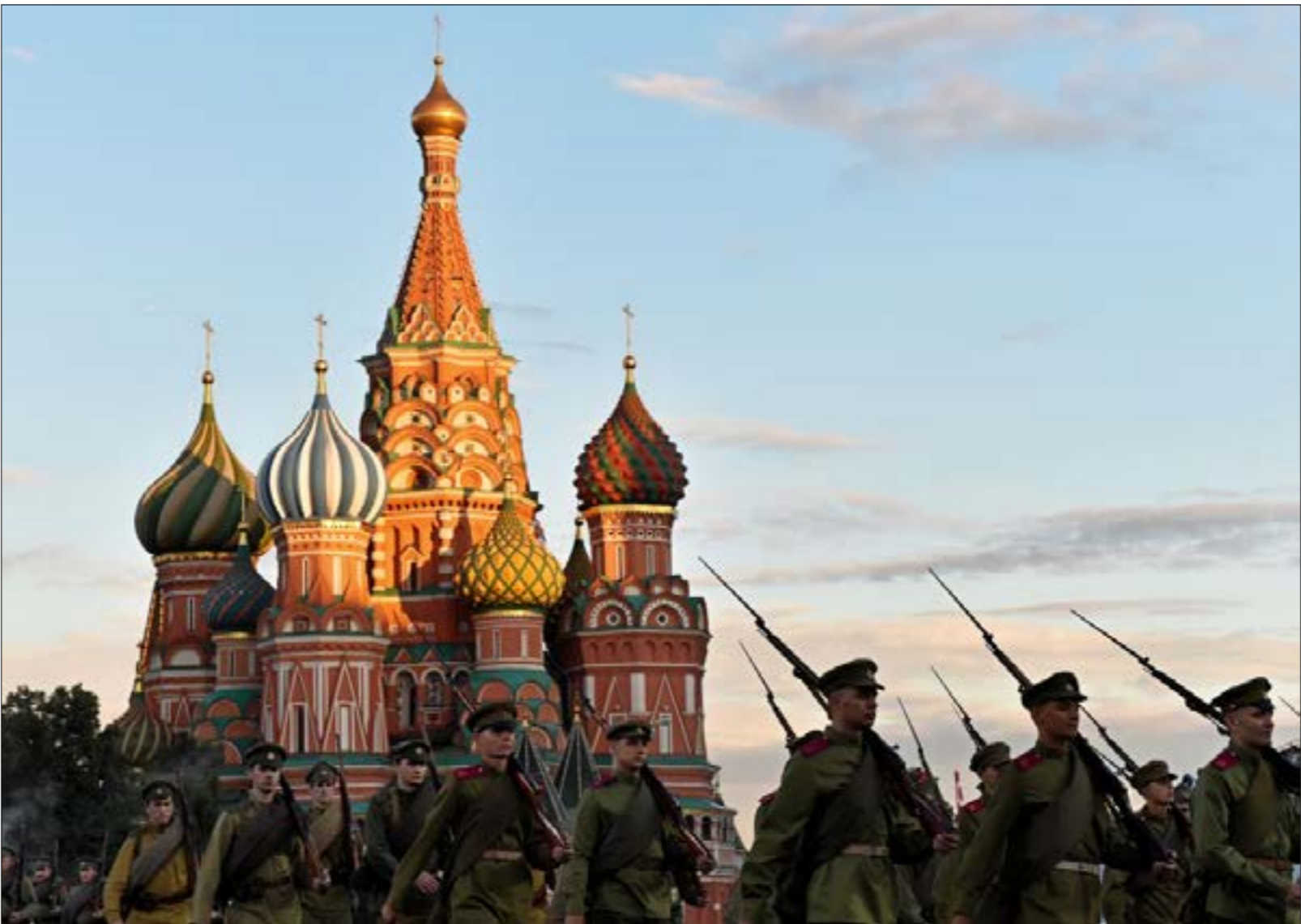
الزهاب المستعربي من الروس منفضّل نتيجة التمويه المستمر (كبيرك كودراماستيف)

أجدد حلقة من هذا المسلسل الغربي الطويل عُرضت فصولها الشهر الماضي في مدينة سالزبري البريطانية، حيث تحوّلت جريمة تسميم الجاسوس الروسي السابق سيرغي سكريبال وابتغته إلى «هجوم عسكري روسي» على أراضي المملكة المتحدة، وفق رئيسة الوزراء البريطانية تيريزا ماي، التي اضافت النهوض الروسي، لأنهم يخافون أيضا أنّ «الروس سبق أن استخدموا غازات الأعصاب في هجمات على الأراضي الأوروبية». كنوع من الاستهزاء والازدراء والتحدى، في حديث إلى «الأخبار»، يستغرب الخبير البريطاني في شؤون