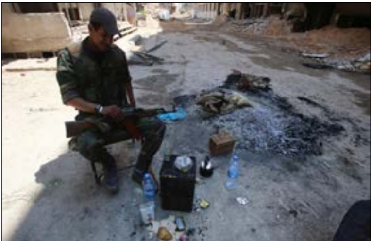
اكدت طهران انها ستقف مع حلفاء ضد ابي عدوان اجنبي (ا ف ب)

ليرة صاخبة على صعيد التصريحات مزّت من جونت أنّ تنظّر ابي مفاعيلك «عملية» حتّى وقت متأخر من فجر اليوم. ترامب هدد موسكو بالصواريخ الذكيّة مستعرضاً «اساطيله» وطائراته فيما كانت موسكو ترسل الاشارات بعتة ويسرّ باهالك تصف مكتوفة الابدح