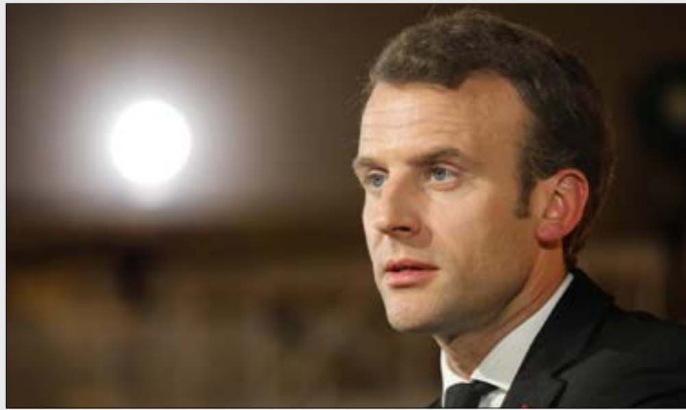
تحدث كتاب «الفر الفرنسي»، عن ظاهرة «الموتى الحياء الكاثوليك»