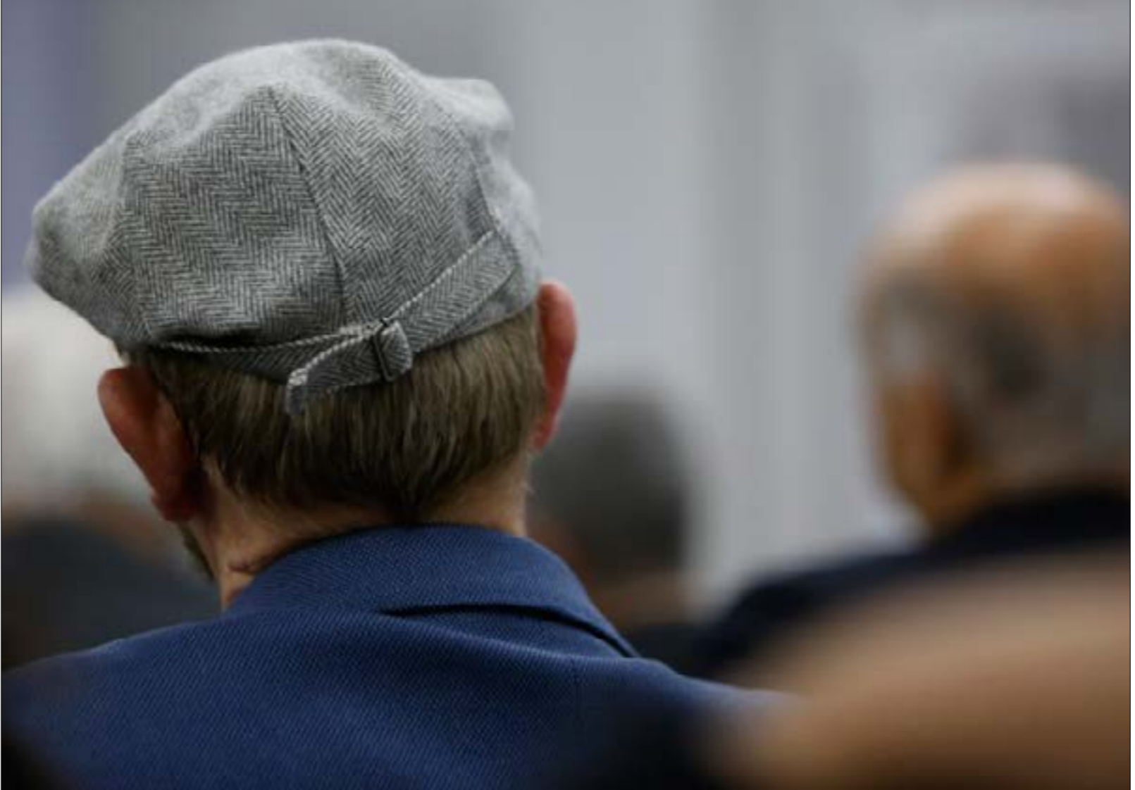
عدد العمليات في لبنان لا يتعداه الف عملية مقابل 2000 في تركيا سنويا

اعلام حزبية تنتشر بكثافة على أسطح البيوت والشرفات والمحال، مختبر بلافتة ملونة للتحاليل الطبية، يطل على شارع يعوم بالمجازي والقمامة، هناك أيضاً محمص، أمامها موقف لسيارات النقل العمومي، تحمل الناس إلى خارج الحي، خصوصاً طلاب الجامعات (عدا الجامعة اللبنانية طبعاً، التي يذهب إليها طلابها سيراً على الأقدام)، الكثير من «الغافات» بلوحات بيضاء، والقليل من الناس يكترون. الدراجات النارية مركونة على جوانب الطرقات، وفي وسطها أحياناً «خيمة اكسبريس» شهيرة في آخر الموقف تحولت - بعد حملة إزالة المخالفات قبل شهر - إلى موقف للسيارات المركونة بطريقة تجعل كل من يراها يتمنى لو أن خيمة اكسبريس بغيت مكانها. يلت الخنز وجود عدد من العاملات المنزليات الأجنبية يجلس مع ربات المنازل وهم يحملن أكياس الخضار وأدوات التنظيف و«كباشا أخرى كثيرة، إذ من المفترض أن سكان تلك المنطقة من «غير المسيوعين»، لافتات كثيرة، كتبت نخط اليد، لحال «برسم البعبع أو الإبراج»، لعدم قدرة أصحابها على تسديد إيجاراتها التي تصل إلى حدود 2000 دولار»