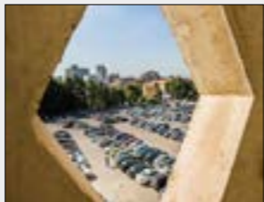
بيروت متحف الفن في المدارس الرسمية

يوضع غداً حجر الأساس لمركز الأم والطفل في بلدة دورس (بعلبك)، بالتعاون مع بلدية دورس ومؤسسة «فونداشيون ميريوي» وإدارة موناكو ووزارة الصحة ومؤسسة عامل المركز الجديد ستتولى مؤسسة «عامل» إدارته وينضم إلى مراكزها المنتشرة في عرسال، العين، شمسطار، كامد اللوز ومشغرة، وعباداتها النقالة التي تتحول في أكثر المناطق تهميشاً لا يصلح الرعاية إلى السكان والنازحين السوريين غير القادرين على اللجوء إلى المراكز المذكورة وهو سيكون متخصصاً برعاية الأم والطفل، من الناحية الصحية بشكل أساسي بالتوازي مع التوعية ومشاريع التنمية وتمكين المرأة وحماية الطفل.