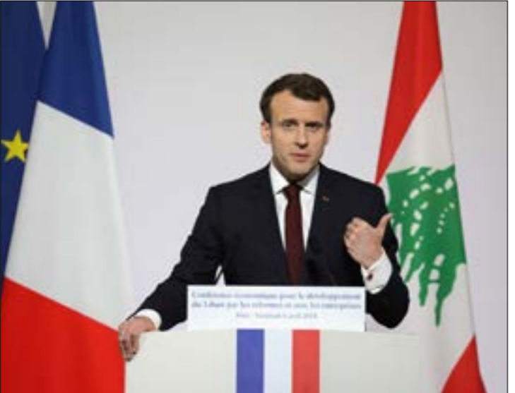
مها أبرز شروط «سيدر»: تعزيز دور المجلس الأعلى للمخصّصة

إنقاذ القطاع يبدأ بمعالجة مشاكله العالقة، ومنها الخلاف على معمل دير عمار، وتأهيل معمل الذوق بعد سقوط مشروع تأهيل معمل الجية، إيجاد حل لوصلة المنصورية المتفجرة منذ سنوات، وكذلك معالجة أوضاع مؤسسة كهرباء لبنان المالية والإدارية والتقنية. وقبل هذا ذوي الدخل المحدود، والغاء بدل التأجيل المعمول به حالياً بشكل مخالف للقانون تشمل رسم العداد وبدل التأهيل وسعر مبيع الطاقة).