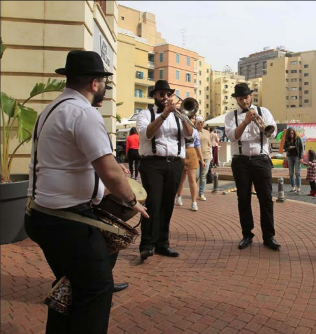
Le Marché Saifi موعدهم الترفيه

البالغ نحو 90 ألف ليرة لبنانية بنحو 14 ألفاً، فيما يبلغ عدد المُستفيدين الإجمالي من الصندوق نحو 30 ألفاً (المنتسب وعائلته والأفراد المحسوبين عليه). وفق أبو ناصيف، غالبية المُستفيدين من الضمان الاختياري هم من الفئات العمرية التي تُرتب أكلاًفاً طبية أكثر من غيرها، «وليست من الفئة الشبابية التي كان يستهدفها الصندوق منذ نشأته».