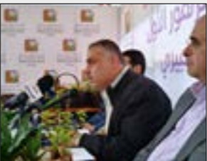
معرض الزهور الاول في الصيربي

للمرة الرابعة على التوالي، يستضيف الصيغى فيلادج، السبت المقبل، النسخة الرابعة من فعاليات سوق الصيغى (Le Marché Saifi). من العاشرة صباحاً وحتى السابعة مساءً، سيكون الحي وزواره على موعد مع نشاطات ثقافية وفنية وترفيهية وحرفية وعروض موسيقية وراقصة وورش عمل وأنشطة للأولاد.