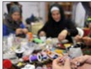
مركز لرعاية الام والطفل في دورس