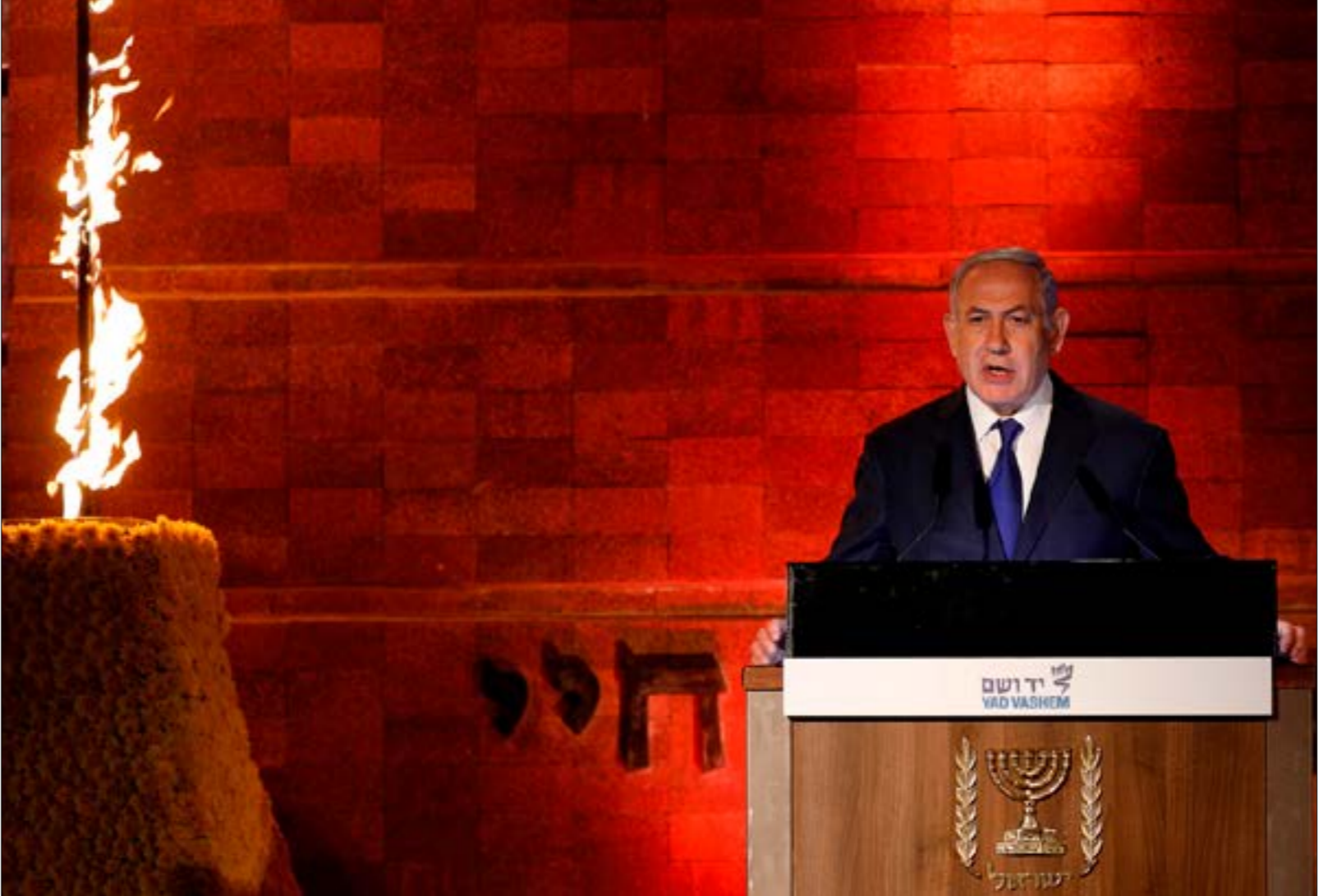
طلبه لنيهاه من وزرائه، وقف التعليقات على الحدّث المتسارعة، (أ ف ب)

شريعة استخدام سلاح كيميائي، يعد تهديداً خطيراً وحقيقياً لإسرائيل. وعليه، فإن إسرائيل على استعداد لمواجهة مباشرة مع روسيا». في السياق نفسه، تجاوز رئيس شعبة الاستخبارات العسكرية الإسرائيلية السابق، رئيس مركز أبحاث الأمن القومي الحالي اللواء عاموس يدلين، المواجهة الدبلوماسية مع الروس، ليمنح إلى إمكان المواجهة