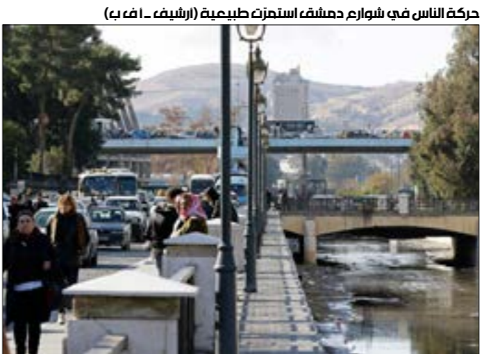
حركة الناس في شوارع حلبشقة استمرت طبيعية