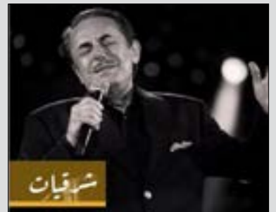
الراحل ملحم بركات، الساعة 6:30 مساءً، اليوم، في مركز الصغدني الثقافي - طرابلس. الدعوة عامة.

في إطار أمسيات الموسيقى الكلاسيكية في برنامج «شوقيات»، دعت مؤسسة الصغدني الثقافية، إلى الإضماع إلى الدكتور سعيد الولي ونخبة من الفنانين والعازقين في تقديم تحية إلى الموسيقار