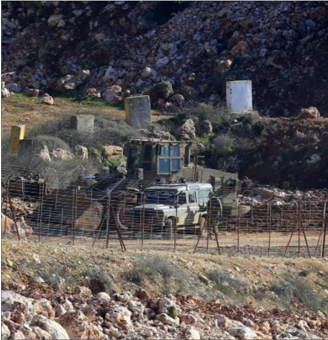
تل أبيب تتذبذب بين حدّي التوثب الكلامي والانكباح العملياني (علي حشيشو)

في اجتثاث محور المقاومة، أو على الأقل إشغال حزب الله واستنزافه بما يؤدي إلى إضعافه ويسمح للإسرائيلي بإطلاق يده. لكن ما فاقم من مازق المؤسسة الإسرائيلية، بشقيها السياسي والأمني، أن هذا الفشل اقترن أيضاً بتطور قدرات حزب الله وتراكم خبراته بما يعزز قدراته الدفاعية والردعية في مواجهة أي خيارات عدوانية يمكن أن تدرسها القيادة الإسرائيلية لتحقيق أطماعها في لبنان والمنطقة.