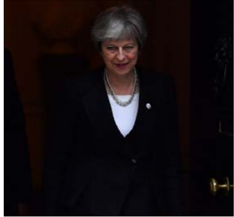
عريضة تطالب تيريزا ماي بسحب الدعوة التي وجهتها إلى ابن سلمان

وسط حملة واسعة تقودها جمعيات ومنظمات حقوقية، وإلى جانبها أعضاء في مجلس العموم البريطاني، أفادت بعض الأنباء عن تأجيل زيارة ولي العهد السعودي، محمد بن سلمان، التي