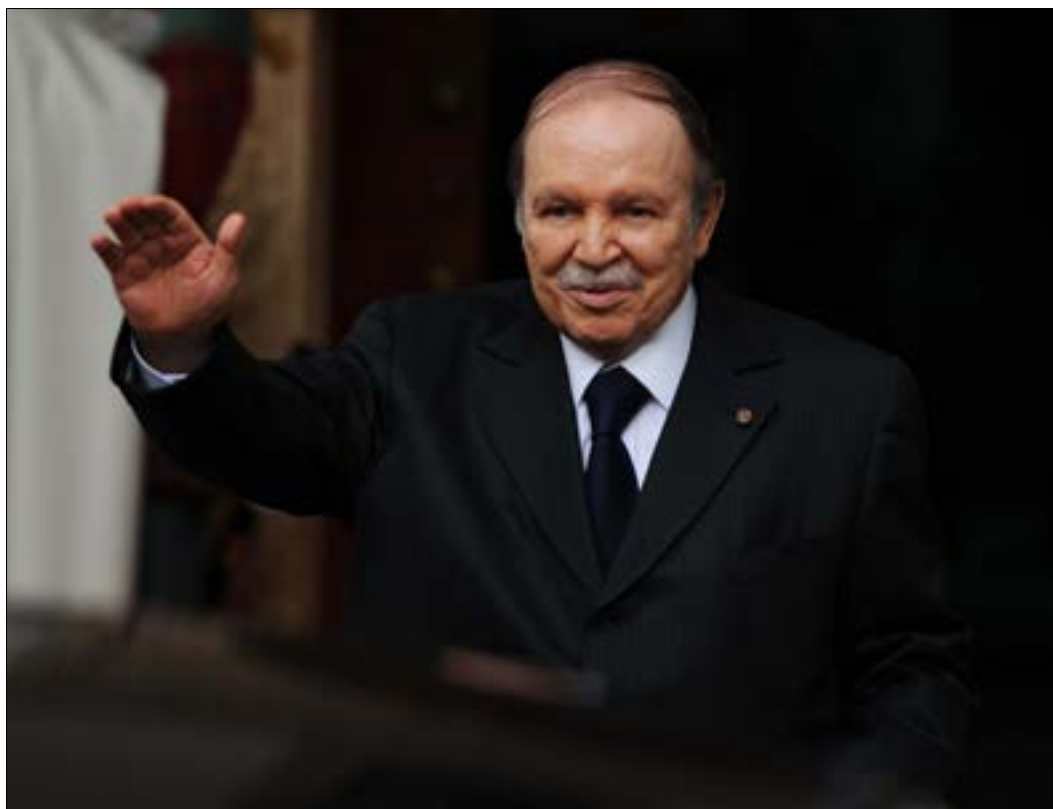
يرى البعض أن ما يحدث هو مجرد اجتهاد للشخصيات السياسية

انطلقت عملية حشد التأييد لاستمرار الرئيس عبد العزيز بوتفليقة، في منصب الرئاسة، وذلك من قبل أنصاره وداعميه في حزب «جبهة التحرير الوطني». وفي هذا الصدد، كان قد أعلن قبل نحو شهر تشكيل «التنسيقية الوطنية لمساندة العهدة الخامسة»، وهو كيان سياسي أطلقه النائب المثير للجدل بهاء الدين طليبة، الذي كان وراء نفس المبادرة