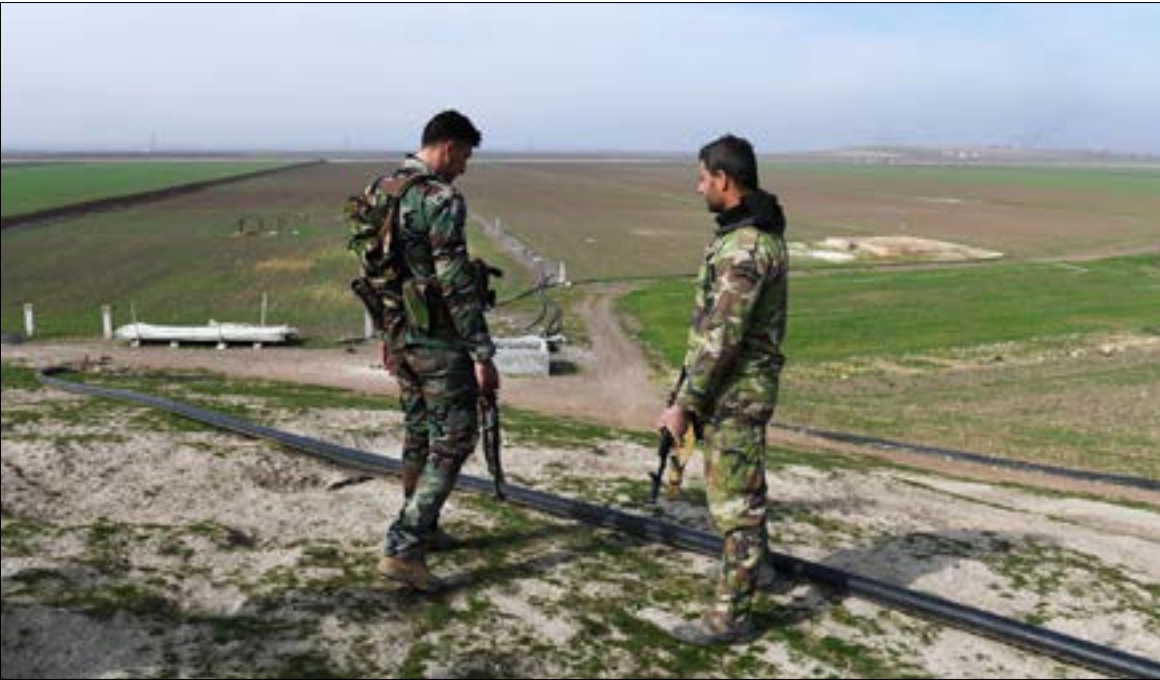
صدّ الجيش هجوماً على محور شمال غرب أبو الزهور

صدّ الجيش السوري هجوماً معاكساً للفصائل التي تقودها «هيئة تحرير الشام» شمال غرب أبو الزهور، فيما وسّعت عملياته في ريف حماة الشمالي الشرقي، في تحرك يستهدف خنق مسلحي «داعش» داخل الجيب المحاصر هناك، وبالتوازي، خسرت أنقرة أكبر عدد من عسكريها خلال اليومين الماضيين، منذ بداية عدوانها على عفرين