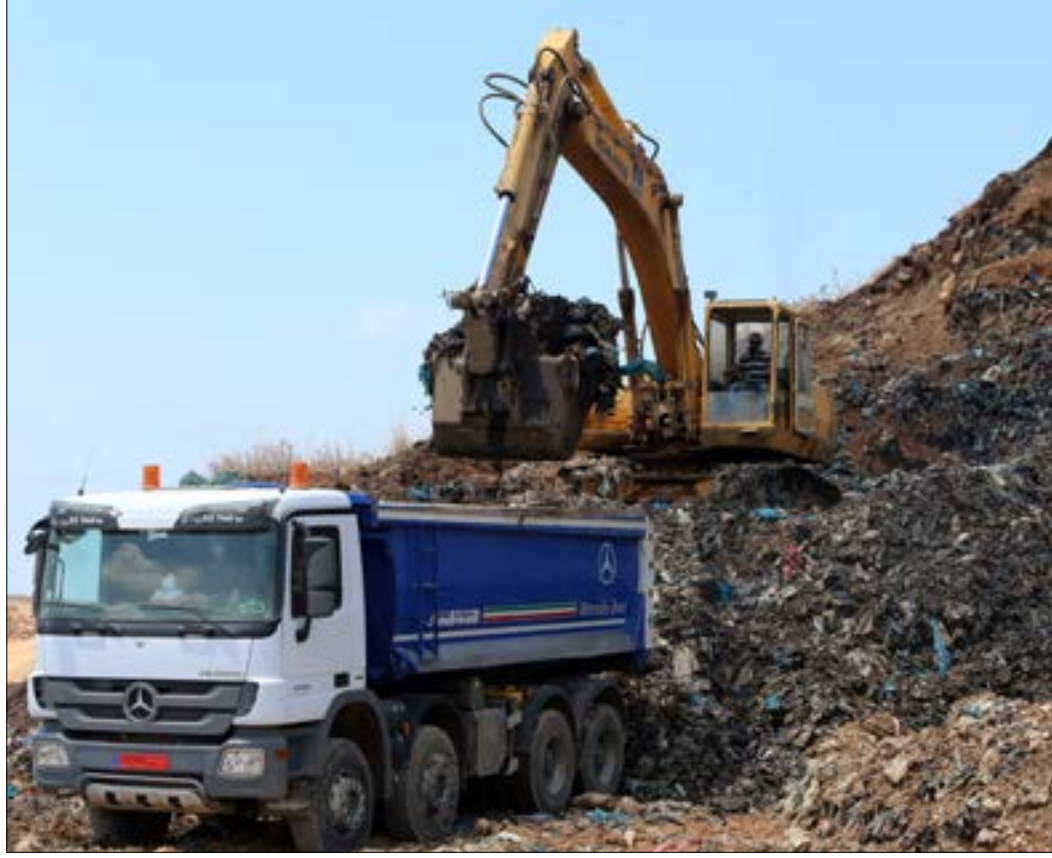
حرف النفايات يزيد خطر الإصابة بعشرات المرات (هيثم الموسوي)

ويطالب المعترضون بإستحداث مستديرة عند مدخل البلدة الشرقي، أو إنشاء جسر فوق الأوتوستراد يمكن السيارات التي تعبر المسلك الشرقي من الدخول الى البلدة، علماً أن هناك فتحة استحدثت على بعد 500 متر، بالقرب من مدخل ثكنة أبلح، يمكن للسيارات النفاذ منها الى المسلك الغربي. إلا أن المعترضين يتذرعون بخطر حوادث الاصطدام مع الآليات العسكرية التي تستخدم هذه الفتحة. وهم، لهذه الغاية، وجهوا كتباً الى كل من البلدية ومحافظ البقاع ووزارة الأشغال ومجلس الإنماء والإعمار، والتقوا رئيس الجمهورية العماد ميشال عون الذي كلف أحد المهندسين متابعة الموضوع مع مجلس الإنماء والإعمار، الا أن «كل هذه الجهود ذهبت سدى، نظراً للتكاليف الكبيرة لإقامة جسر أو إستحداث مستديرة مقابل المدخل الرئيسي»، بحسب سماحة. من جهته، يؤكد رئيس بلدية أبلح روبير سمعان وقوفه، «من الناحية العاطفية»، الى جانب مطالب بعض أهالي البلدة، «لكن العاطفة شيء ومراعاة السلامة المرورية شيء آخر. ولا أرى صعوبة في أن يتحمل البعض قطع مسافة قصيرة والإلتفاف للوصول الى داخل البلدة». ولفت الى أنه بعد مراجعة المعنيين، خلصت المشاورات الى ضرورة الإلتزام بالمواصفات الدولية المتعلقة بتنفيذ مشاريع الطرقات الرئيسية، وأن الآراء جاءت متطابقة للاحية التقليل من عدد الفتحات بغرض التخفيف من الحوادث، متمنياً على أهالي البلدة وضع المصلحة العامة فوق كل إعتبار.