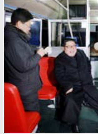
صورة غير مؤرخة للزعيم الكوري الشمالي، نشرتها امس وكالة الأنباء الرسمية (أ ف ب)

أعلنت الحكومة في كوريا الجنوبية أن مسؤولاً كورياً شمالياً رفيعاً يتولى منصباً فخرياً سيتوجه إلى سيول يوم الجمعة المقبل، في زيارة تستمر ثلاثة أيام وترتبط بالألعاب الأولمبية الشتوية التي ستجري في الجنوب في بيونغ تشانغ. والمسؤول هو رئيس «الجمعية الشعبية العليا» كيم يونغ نام. ووفق وزارة إعادة التوحيد الكورية الجنوبية، سيرافق كيم يونغ نام ثلاثة مسؤولين سياسيين آخرين، وفريق دعم من 18 شخصاً، فيما لم توضح الوزارة ما إذا كان سيحضر حفل افتتاح الأولمبياد الذي يبدأ يوم وصوله.