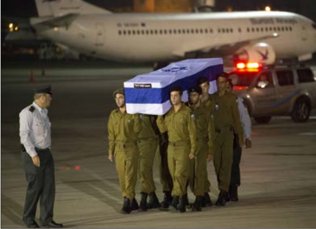
رضخ الاتحاد الأوروبي عام 2013 للضغوط الإسرائيلية والأميركية وتصنيف «الجنح العسكري لحزب الله» منظمة إرهابية

كانت المزاعم بزلوم حزب الله في هجوم بالمتفجرات وقع في بلغاريا عام 2012 أحد أبرز أسباب تصنيف الاتحاد الأوروبي الجناح العسكري في حزب الله منظمة إرهابية عام 2013. لكن الادعاء البلغاري قرّر أخيراً عدم توجيه اتهامات إلى الحزب وعدم تصنيف الهجوم الذي استهدف سياحاً إسرائيليين إرهابياً. إلا يكشف ذلك تفوق الاعتبارات السياسية الأوروبية على أي مسار قضائي صحيح ولا يعبر بوضوح عن تراجع مصداقية الاتحاد الأوروبي تجاه المقاومة في لبنان؟