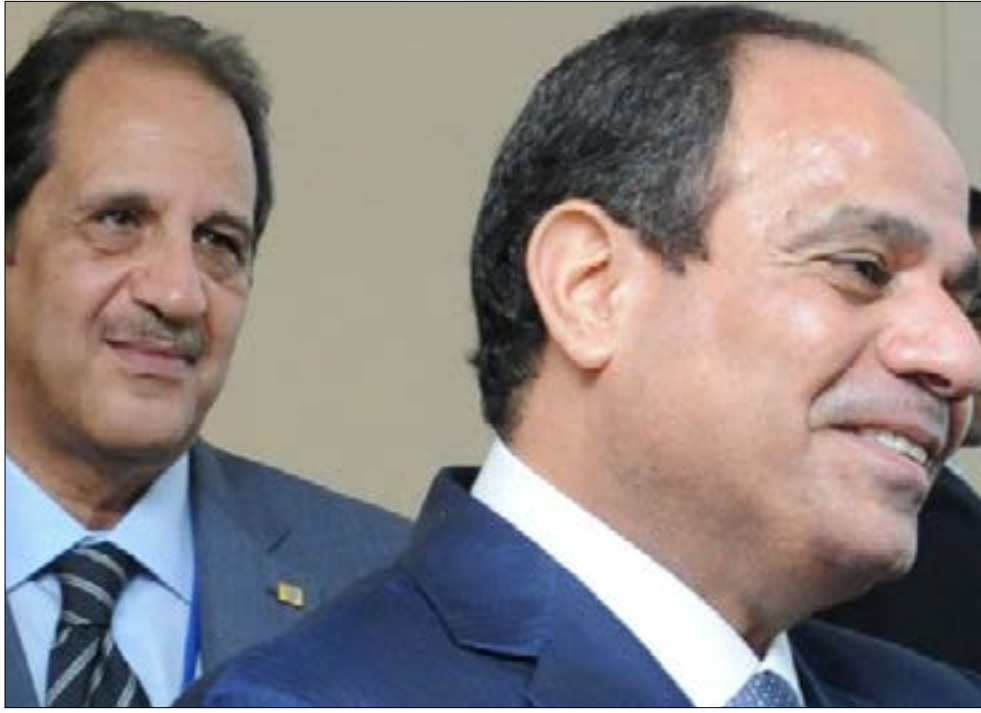
يؤمن الرجل بالإعلام في مصر بات الإعلام له تأثير كبير في توجيه الرأي العام