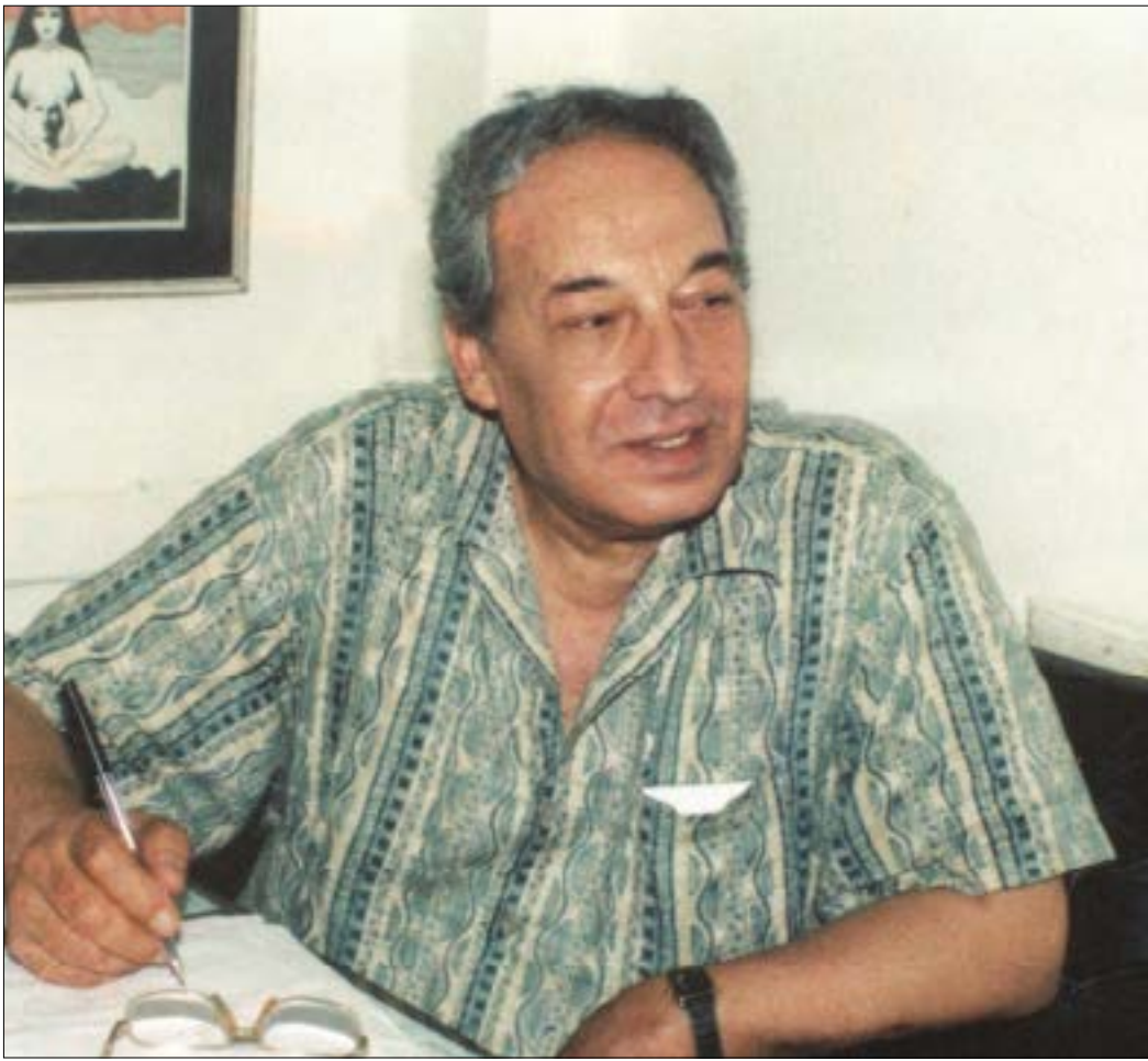
حملت أفلام مهمة توقيعه ككاتب سيناريو

رحل صبري موسى، تاركاً رواية مخطوطة بعنوان «فنجان قهوة قبل النوم»، كان قد أعلنها في فترة مرضه. قال إنها «مزيج من روح السيرة الذاتية وسيرة جبل عبر تأملتي للحياة وعلاقتي الإنسانية فيها. ما أنجزته من الكتابة في روايات، فهي أيضاً تتضمن تأملتي لنصف القرن الأخير، وتجاربي فيه مع الآخرين وما حدث في مصر، وأنا ليس من طبيعتي إنجاز أعمال ملحمية، بل إنني فضلت أن أترك العنان لتداعياتي»... فهل نشهد صدوراً قريباً؟