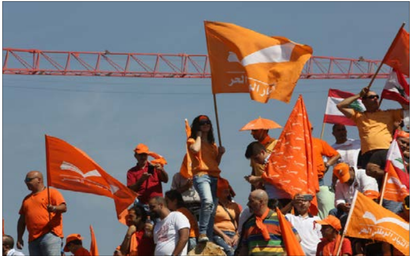
تقول مصادر «التيار»، إن الضرر سيكون كبيراً في حال عدم تبني مرشح من الجرد