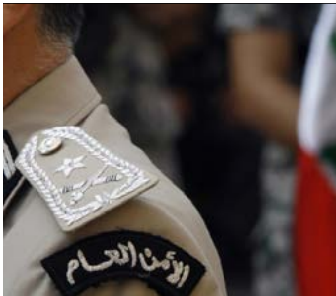
مرجع رسمي في الأمن العام: نتمنى لو لدينا جزء يسير من هذه القدرات

من صور الممارك في سوريا إلى» المحادثات الهاتفية الخاصة، وكلمات السر والصور، وصولاً إلى حفلات أعياد ميلاد الأطفال». هي البيانات التي زعمت شركة ومنظمة أميركيات أن الامن العام اللبناني يمتلكها نتيجة عملية تجسس ضخمة على اللبنانيين و21 دولة أخرى يقدر أنها بدأت منذ عام 2012! التقرير الذي صدر أمس عن ومنظمة الحدود Lookout شركة الإلكترونية، يزعم كشف واحدة من أكبر عمليات التجسس السيبراني على مقياس عالمي مصدرها مبنى المديرية العامة للأمن العام في بيروت