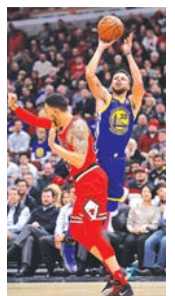
كوري مسجداً نحو سلة شيكاغو

وفي ظل غياب كاوهي لينارد المصاب بعضلات فخذ، تحظى سان