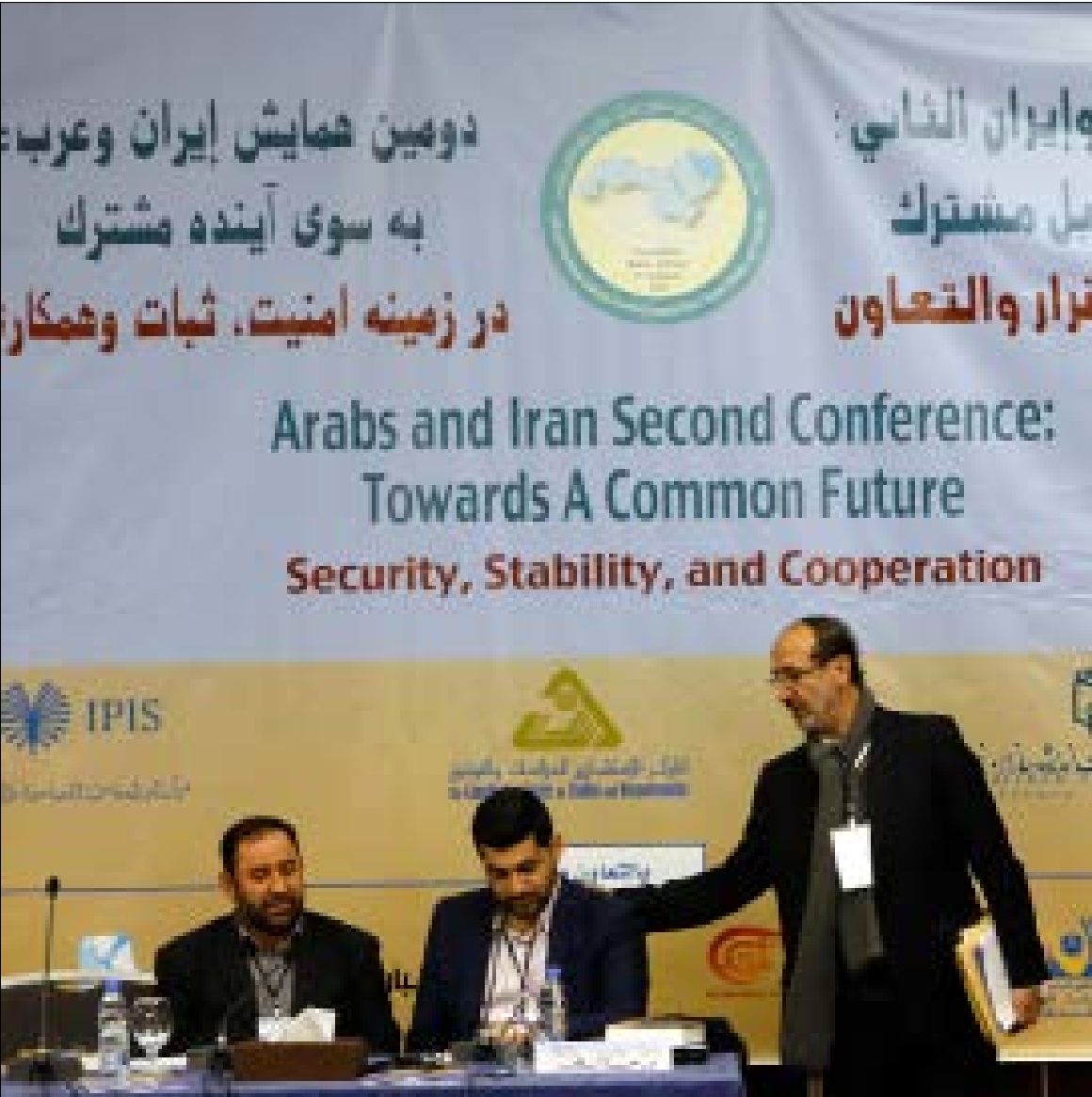
يأتي المؤتمر في ظل متغيرات يعتقد المنظمون أن بإمكانها الإسهام في تضييق الشرخ العربي - الإيراني (مروان طحطح)

في محاولة لمقاربة تلك الإشكاليات، وإيجاد أجوبة على الأسئلة المتكاثرة بشأن الدور الإيراني في المنطقة، وإجراء تدرب عقلي على كيفية مواجهة الهواجس التي يجد العرب أنفسهم إزاءها مجدداً، انعقد خلال اليومين الماضيين في بيروت مؤتمر بعنوان «العرب وإيران: نحو مستقبل مشترك - الأمن والاستقرار والتعاون». المؤتمر الذي نظمه «المركز الاستشاري للدراسات والتوثيق» بمعهد «انديشه سازان نور» الإيراني، و«مركز الدراسات السياسية والدولية» التابع لوزارة الخارجية الإيرانية، عُقد النسخة الثانية من مؤتمر مماثل تم تنظيمه في حزيران/ يونيو 2016 في بيروت أيضاً. ما يميز النسخة الجديدة، لناحية الشكل، أنها ضمت دائرة أوسع من أصحاب الرأي والباحثين والشخصيات الأكاديمية، وهذا ما يعده المنظمون علامة إيجابية،