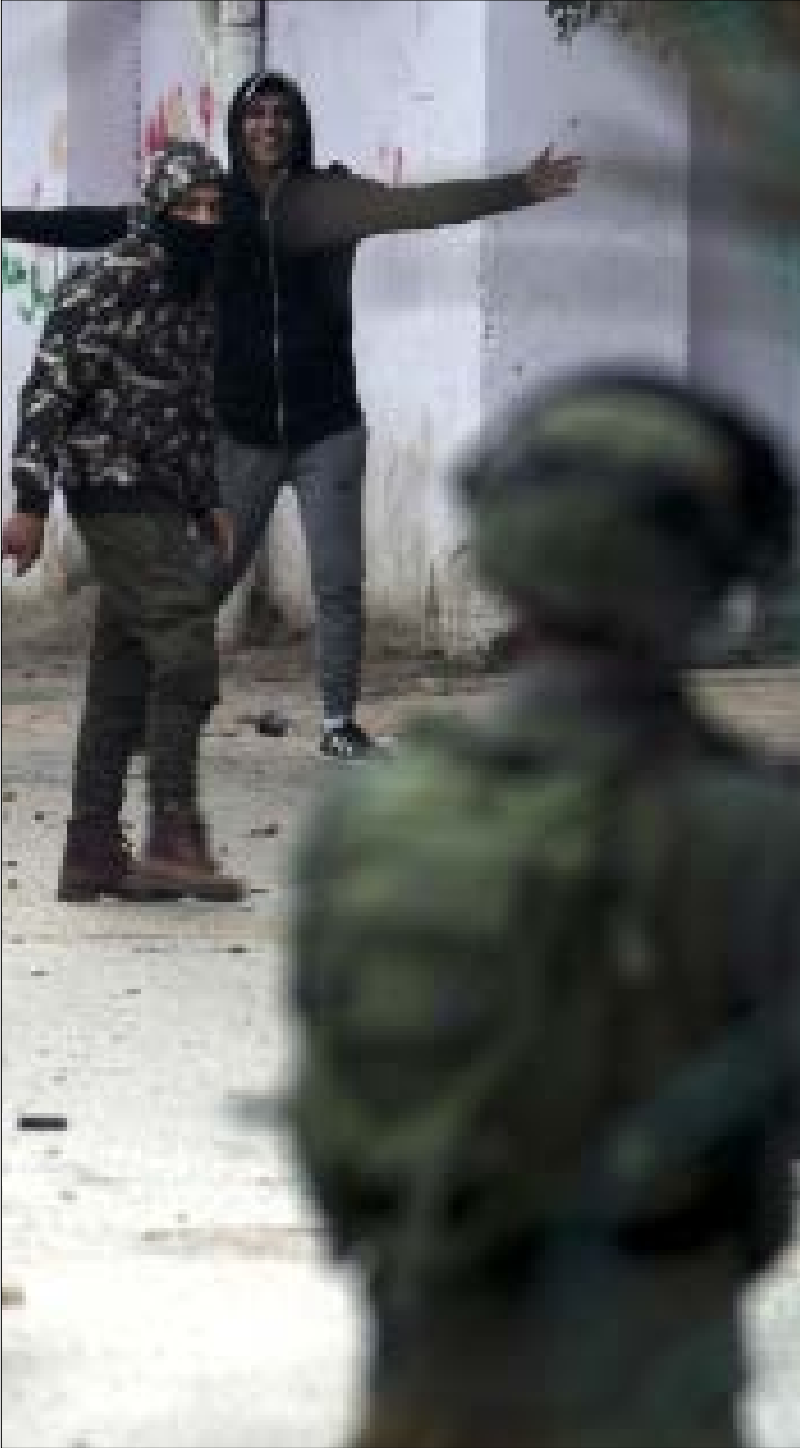
قال العدو إنه انسحب صباحاً حتى لا تلوث المدينة ولا يصبح عرضة للاستهداف (أ ف ب)