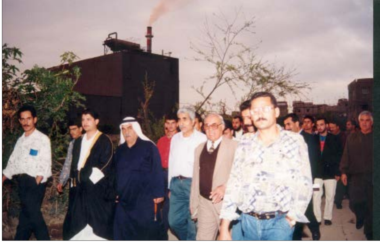
محرقة العمروسيه قبيل احراقها العام 1997 (حبيب معلوف)

لحين إقرار مشروع قانون الإدارة المتكاملة للنفايات الصلبة، والذي يلحظ إنشاء هيئة وطنية لإدارة هذا القطاع تحت وصاية وزير البيئة،