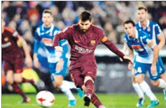
ميسي مسجداً ركلة الجزاء

12 متابعه، ليحقق كليبرز فوزه السادس توالياً ويعود إلى المركز السادس في المنطقة الغربية.