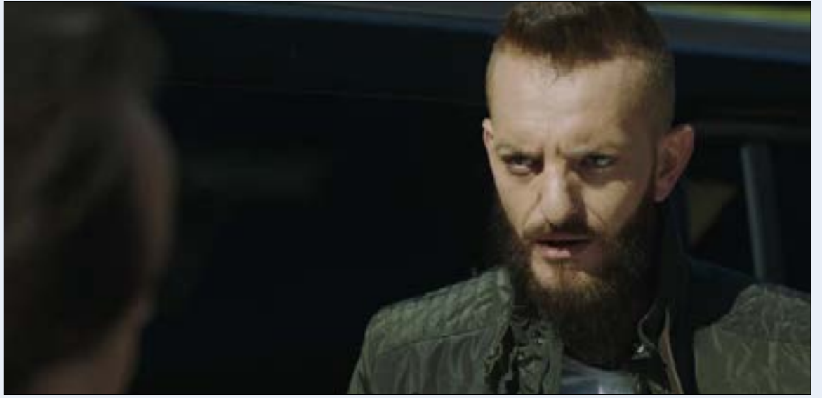
لعم نجم اويس مخللاتي بشخصية صخر