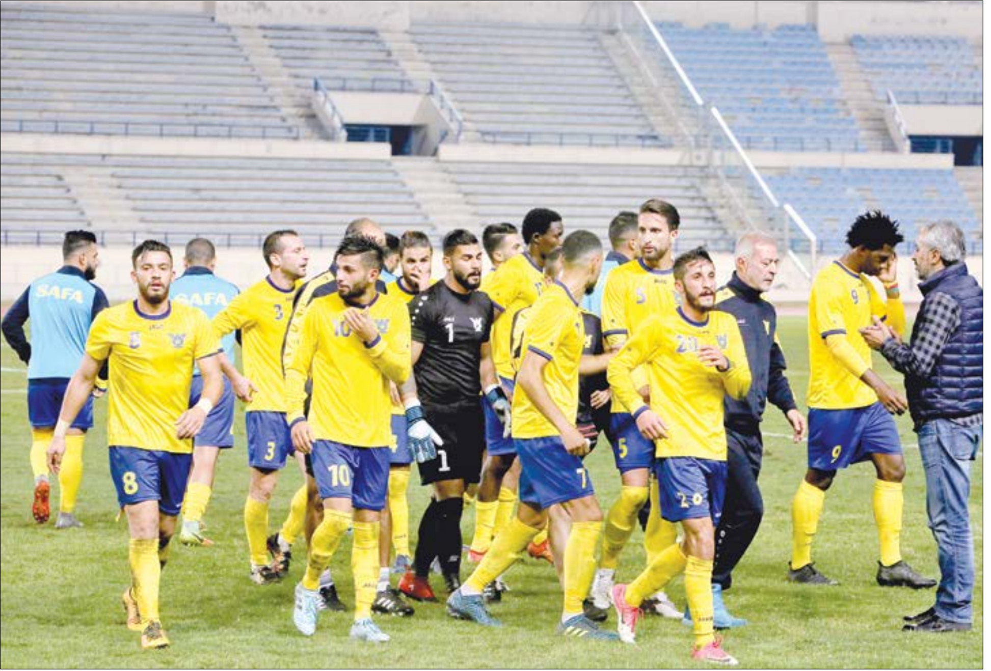
يؤكد القيمون على النادي ان الصفاء بالف خير رغم كل ما يقال