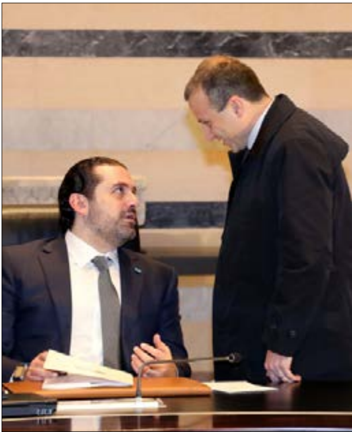
فهم الحريري من الاتصالات الليلية أن البند 24 سيفجر خلافاً كبيراً

مصادر وزارية في التيار الوطني الحر أن «البنود التي تخص وزارة الزراعة ملفات غير مكتملة وتحتاج إلى دراسة». وجاء موقف الوزير مروان حمادة، الذي أكد أنه حضر ليتضامن مع موقف وزراء حركة أمل في ما خص مسألة تعديل قانون الانتخاب، وأنه سيقاطع جلسات الحكومة بسبب