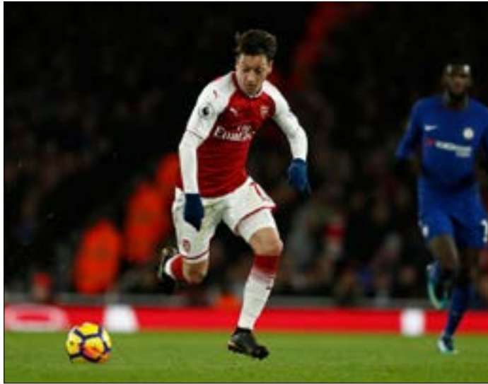
ينتظر «اليوفي» تصير الانتقال المحتمل لوزيل إلى يونايتد

بعد طي صفحة انتقال النجم البرازيلي فيليبي كوتينييو من ليفربول الإنكليزي إلى برشلونة الإسباني، تتجه الأنظار إلى نجم آخر هو الألماني مسعود أوزيل الذي بدوره قد يغادر آرسنال.