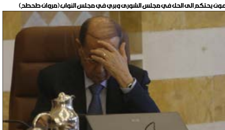
عون يحتكم الى الحل في مجلس الشورى وبري في مجلس النواب

ما بين الرئيسين اتهامات ضمنية متبادلة بمخالفة الدستور وتكريس اعراف