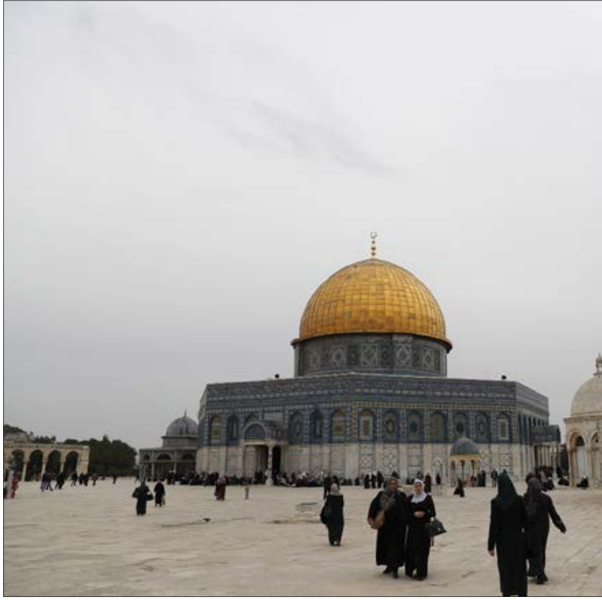
القدس اليوم هي الوجه السافرة للنظام العالمي الراهن

ومن نافل القول إنه لا بد من العمل على تفكيك الألغام العقديّة والفكرية بين السنّة والشيعة، وذلك بإعادة إنتاج الفكر الإسلامي، وغربلة التراث لدى الفريقين من كل ما علق به لأسباب متنوّعة، جُلها تاريخي، حتى لا نتحمّل في كل مرحلة من تاريخ الأمة نتيجة الغفرات التي ينفذ من