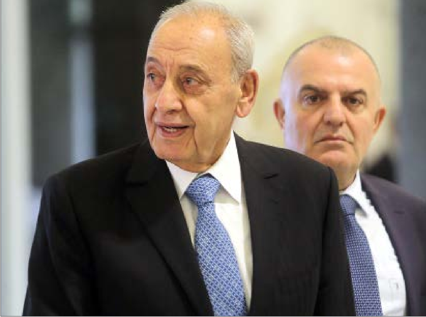
لا تستبعد مصادر التيار الموني أن يستمر الخلاف مع بري حتى الانتخابات (هيثم الموسوي)

بعد تنسيق «حسدا» عليه خلال أزمة استقالة الرئيس سعد الحريري، نشب خلاف بين الرئيس ميشال عون ورئيس المجلس النيابي نبيه بري، على خلفية مرسوم ترقية ضباط «دورة عون». خلاف يستمر مع مرور الأسابيع، وتتعدك أمامه كل مبادرات الحل