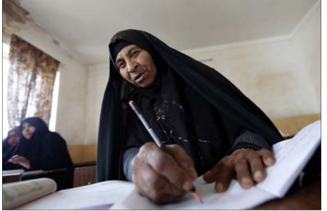
مف برنامج حكومي لدعم الأمية لدى البالغين، في مدينة النجف

على الأغلب، هذا النقاش سيستمر ومن المحتمل أن لا يكون له نتائج فورية. لكن سياسات إدارة ترامب والأزمات التي تنجم عنها من جهة والحضور المتزايد لروسيا والصين على المستوى الدولي من جهة أخرى سيعزّز وجهة نظر الداعين إلى سياسة أوروبية أكثر استقلالية وإلى بناء شراكات جديدة على حساب الشراكة الحصرية عبر الأطلسي التي فرضتها سياقات دولية تغيرت بشكل كبير. وانطلاقاً من هذه الخلفية، يكتسب كلام المستشار الألمانية أنجيلا ميركل عن نهاية الزمن الذي كان بإمكان ألمانيا خلاله الاعتماد «لدرجة كبيرة» على الآخرين معنى مختلفاً. كريستيان هوفمان في Der Spiegel ترى أنه اعلان عن «نهاية تحالف مع الولايات المتحدة ضمن أمن ألمانيا لأكثر من نصف قرن وأعاد صياغة سياستها وقيمها».