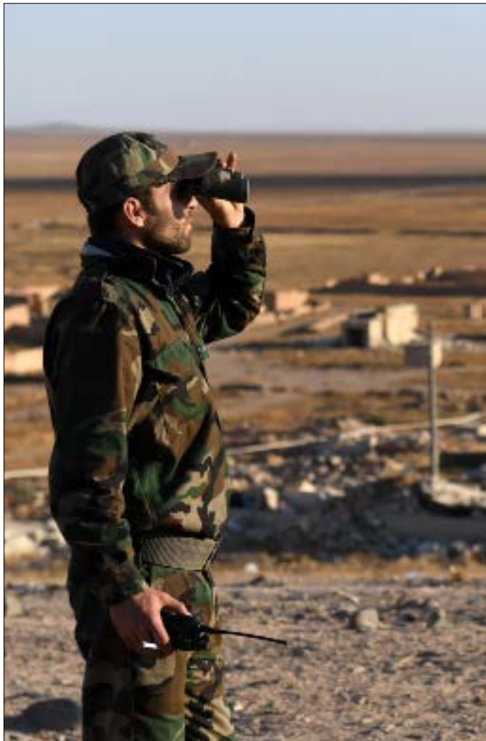
يفرض البحث عن هكك واشنطن من الإعراب» نفسه على قراءة المشهد في ادلب