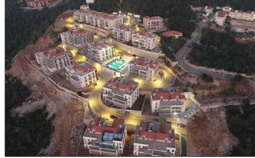
غياب الخدمات العامة يميز الإقبال على هذه المجمعات