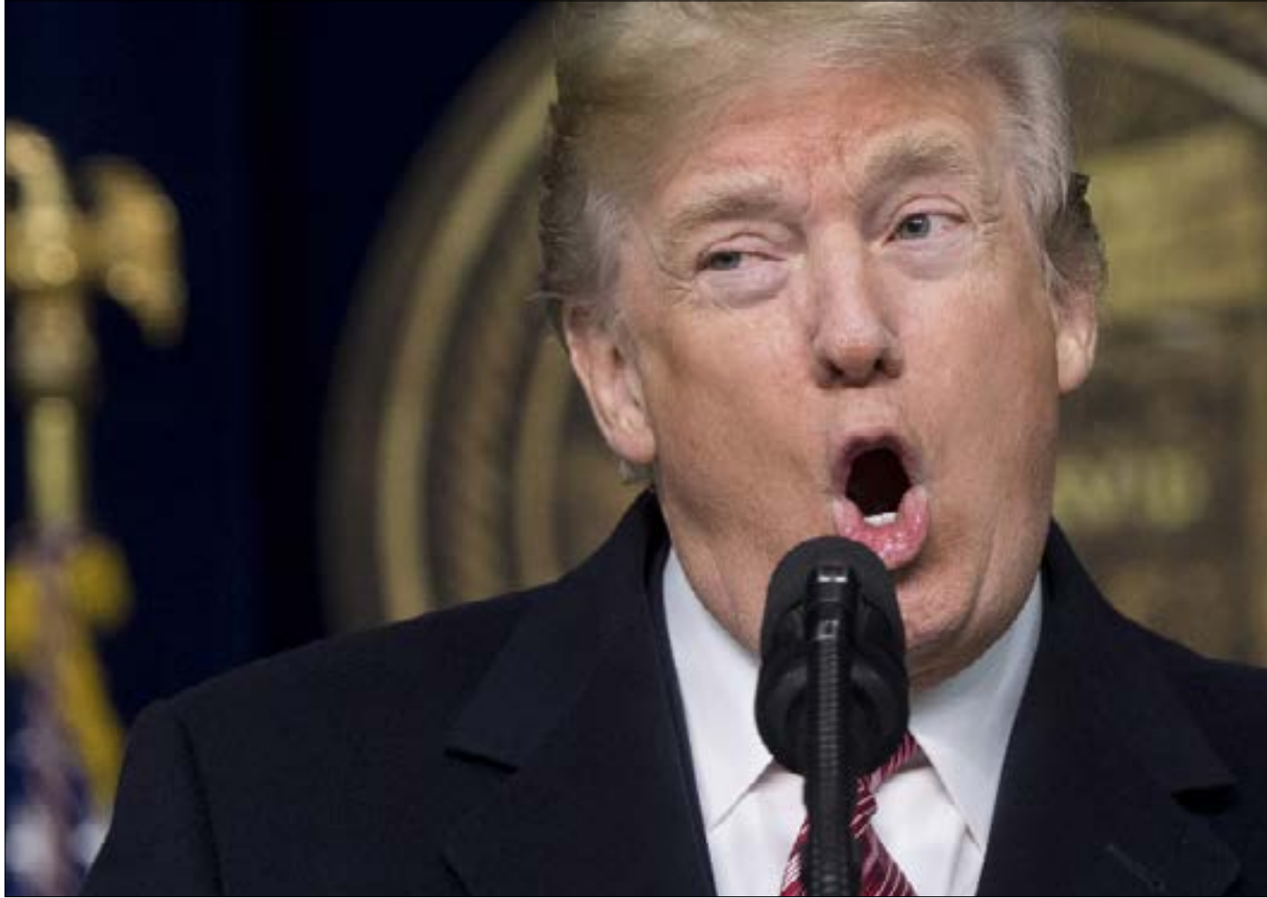
منم احدا من لمس فرشاة أسنانه بسبب تخوفه الدائم من تسميمه

تبدأ الحكاية منذ الأيام الأولى لانطلاق حملة دونالد ترامب للرئاسة، عندما طلب من الرئيس التنفيذي السابق لشبكة «فوكس نيوز» (الذي استقال من منصبه إثر اتهامات عدة بالتحرش الجنسي) رودجر إيلز، إدارة حملته الانتخابية، وهو طلب رفضه إيلز معتبراً، بحسب الكتاب، أن ترامب «غير منضبط، ولا يمكنه الانضمام إلى أي منظمة ولا التزام أي برنامج أو مبدأ. إنه نائر بلا قضية». ويتابع الكاتب أن هدف ترامب من الترشح لم يكن الفوز في البداية، فهو قد أسر إلى أحد مساعديه، سام نونبرغ، عند بداية الحملة، بأنه يريد من الحملة أن تجعله «الرجل الأكثر شهرة في العالم» لتكريس «علامته التجارية» وفتح فرص تجارية جديدة، عملاً بنصيحة رودجر إيلز: «إذا أردت العمل في مجال التلفزيون بنجاح، فترشح أولاً للرئاسة». ولعل الدليل على ذلك تمنع ترامب عن استثمار ماله الخاص في الحملة، بحسب الكتاب، وتقديمه 10 ملايين دولار فقط بعد الضغوط شرط استعادتها لاحقاً بعد توفير التمويل الإضافي. ومن الأمور اللافتة التي يكشف الكتاب بعضاً من خلفياتها، علاقة ترامب بالإعلام وأسلوبه الحاد في انتقاد الصحفيين الذين يخالفونه الرأي. فمدير حملته ومستشاره السابق ستيف بانون يقول، بحسب الكتاب، إن ترامب، خلافاً لما يظهر، كان يتوق بشدة إلى أن يتقبله الإعلام، ولكنه ليس من النوع الذي يلتزم خطاباً معذراً له، ف«عقله لا يعمل بهذه الطريقة». ويضيف بانون أن ترامب «لم يكن يوماً ليفهم الأمور على حقيقتها، كذلك فإنه لا يعترف أبداً بأخطائه»، وتلك ليست من الصفات التي تحبب الصحفيين بك عموماً. ويورد الكاتب في هذا السياق حديثاً هاتفياً جرى بين ترامب والإعلامي جو سكاربورو،