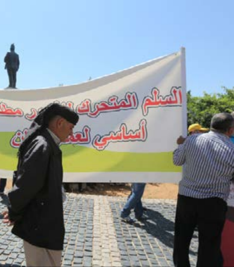
يرى الموظفون أن التعميم ينتهك حقوقهم كانوا مكرسة في قانون السلسلة الصادر عام 1998

من المؤسسات العامة غير الخاضعة لقانون العمل والمصالح المستقلة والمستشفيات الحكومية (...). والمصادقة على السلاسل المقترحة التي تقدّمت بها هذه المؤسسات والمصالح، من جهة أخرى، يقول مصدر إداري مُطلع، إن المادة 17 من القانون حصرت تحويل السلسلة