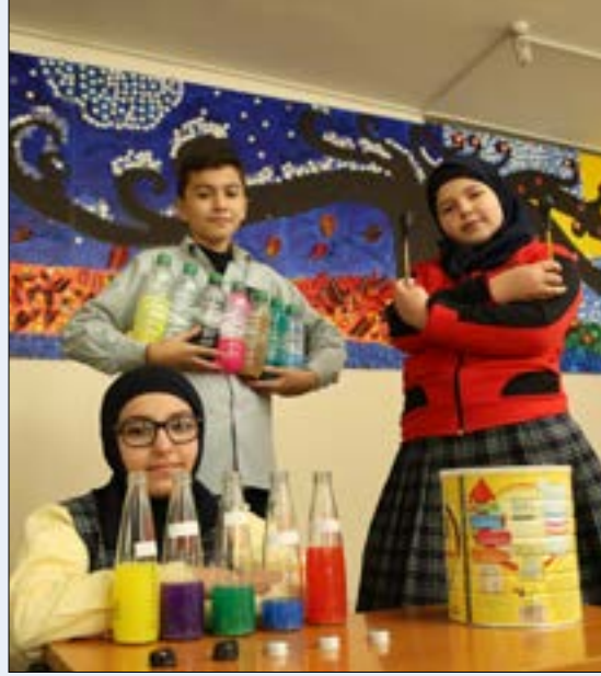
ثلاثة تلامذة خلال الإعداد لجدارياتهم