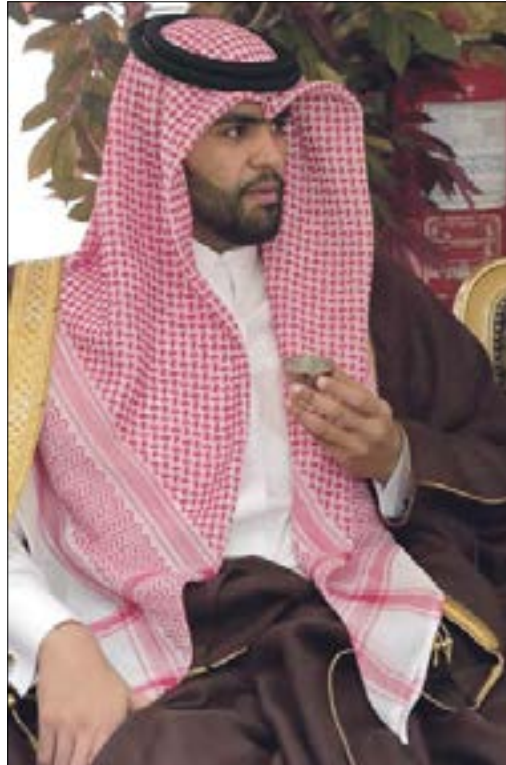
سلطان بن سحيم آل ثاني

مع دخول الأزمة الخليجية شهرها السادس من دون أي بوادر للحل، توجّ «اليوم الوطني» لقطر، أمس، مساراً تصاعيداً ممتداً منذ بدء الحملة الرباعية في الخامس من حزيران الماضي، وقطع السعودية والإمارات والبحرين ومصر ودول أخرى علاقاتها الدبلوماسية مع قطر، وإغلاق كافة المنافذ الجوية والبرية والبحرية معها.