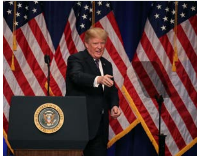
لم تنظر، الوثيقة التي تغير المناخ بوصفه تهديدا

● تعزيز النفوذ الأميركي، عبر التركيز على «نهج جديد للتنمية» التي يمكن أن تبني «شراكات مع دول متشابهة التفكير، لتعزيز اقتصادات السوق الحرة، ونمو القطاع الخاص، والاستقرار السياسي، والسلام». وتركز الوثيقة على الاقتصاد كقضية أمنية قومية، ويجري تنسيقه في جميع أقسام الاستراتيجية، مع الإشارة إلى «التهدد الخطير للملكية الفكرية» الذي تشكله الصين. وقال أحد المسؤولين: «إننا ننظر إلى الإجراءات التي يتعين اتخاذها لحماية قاعدة الأمن الصناعي». وأشار إلى أن شعار «أميركا أولاً» لا يعني أميركا وحدها. وهو ما روج له بنسبة مستشار الأمن القومي هيربرت ماكاستر، في «منتدى ريغان للدفاع»، في وقت سابق من هذا الشهر. بل إن الوثيقة تؤكد الحاجة إلى اتفاقيات تجارية عادلة ومتوازنة بين الولايات المتحدة وشركائها في الخارج. وتدعو أجزاء أخرى منها إلى تحديث حلف شمال الأطلسي والأمم المتحدة، تماشياً مع النداءات السابقة من ترامب.