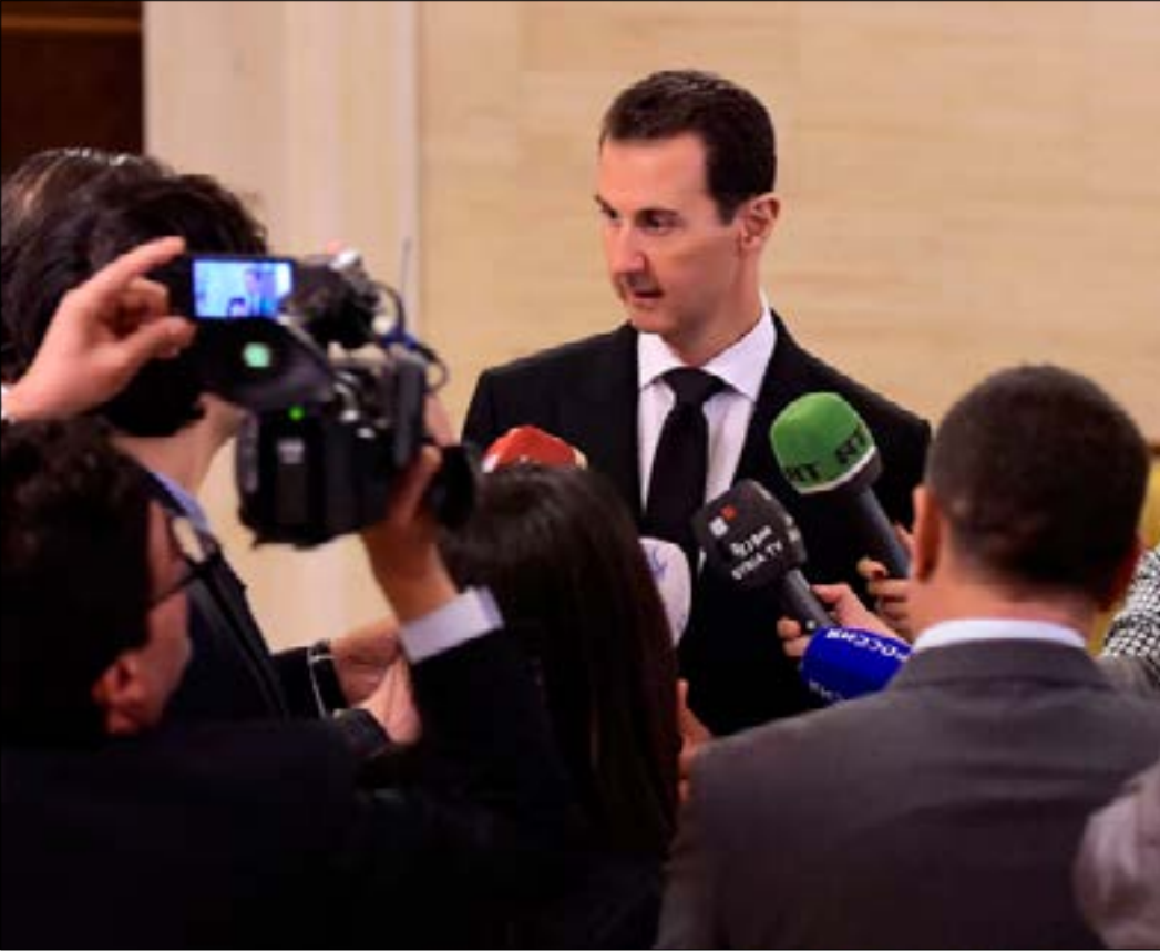
هاجم الأسد فرنسا بوصفها «الداعم الأول للإرهاب» في بلاده

واسع، كما في الجانبين السياسي والعسكري. وبرغم ما تحمله الزيارة من أهمية على مستقبل الدولة السورية واقتصادها، ركز الأسد في مؤتمره الصحافي على تحديات راهنة، لا تزال تفاصلها تشكل أولوية لدمشق. ومن أبرز النقاط التي طرحها الأسد في مؤتمر صحافي قصير عقب اللقاء، عدم انتهاء الحرب على الإرهاب بالقضاء على المراكز الرئيسية لتنظيم «داعش». وذكر بشكل واضح أن بلاده لن تعتبر أن انتصارها قد تم من دون «القضاء على جبهة النصرة، وغيرها من التنظيمات الإرهابية تحت مسميات مختلفة». ويأتي كلام الأسد تكريماً لما عمله الوفد الحكومي إلى محادثات جنيف، عن استمرار أولوية مكافحة الإرهاب على حساب نقاش الدستور والانتخابات. وفي مقابل عدم تفاعل دمشق الإيجابي مع الوسيط الأممي في جنيف خلال الجولة الماضية، حمل كلام الأسد ترحيباً بنقاش ملفات الدستور والانتخابات، مبرراً الاختلاف في النظرتين بـ«نوعية الأشخاص أو الجهات المشاركة» في المؤتمرين. وأضاف القول: «وضعنا محاور واضحة لها علاقة بموضوع الدستور، لها علاقة بما يأتي بعد الدستور من انتخابات وغيرها، هناك حديث عن دور الأمم المتحدة وهناك عدة محاور مرتبطة بهذا المؤتمر». وحول مشاركة الأمم المتحدة في الإشراف على أي انتخابات لاحقة، اعتبر أنه «عندما يكون هناك تعديل دستوري، من الطبيعي أن تكون هناك انتخابات مبنية على الدستور... ونحن لا نقلق من أي دور للأمم المتحدة، ونستطيع القول إننا نرحب بأي دور للأمم المتحدة بشرط