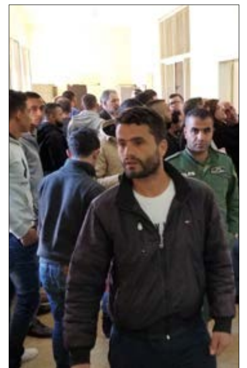
مراجعون ومحامون في محكمة حلبا (الانبار)

الممر الضيق المؤدي إلى غرف محكمة حلبا أشبه ببرج بابل حيث تختلط أصوات المعترضين على تأجيل الجلسات، وهو يعكس صورة الدوائر الحكومية في محافظة عكار التي تفتقر إلى قصر عدل خاص بها. في محكمة حلبا، مئات المراجعين وعشرات المحامين يُحشرون في الممر الضيق، وفي الغرف الخمس