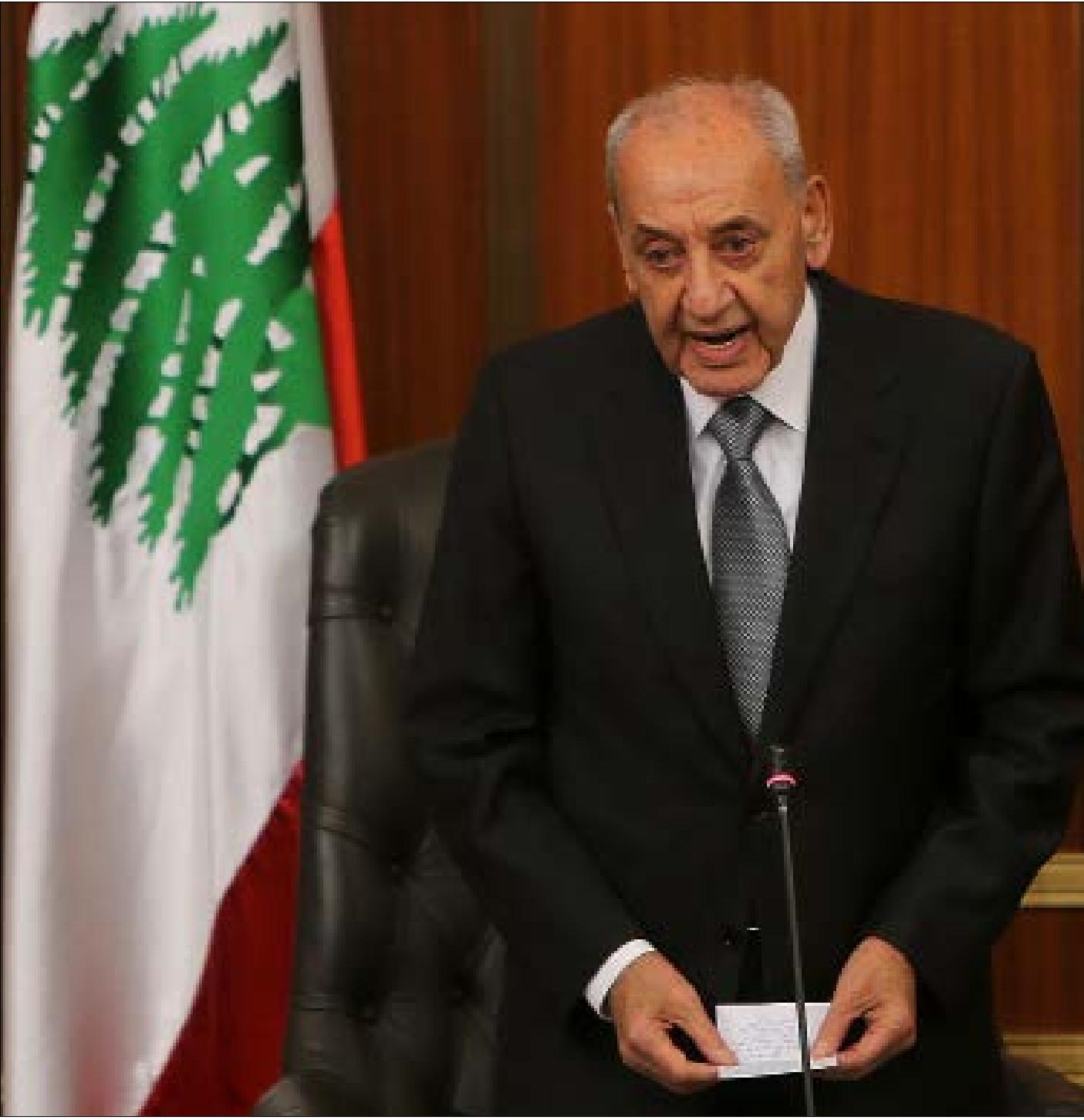
تقول مصادر بري إن توقيع مرسوم ترقية «دورة عون» هو بخطورة أزمة الحريري (هيلم الموسوي)

حاول رئيس الحكومة سعد الحريري احتواء الأزمة مع رئيس مجلس النواب نبيه بري، التي نشبت على خلفية توقيع مرسوم منح «أقدمية» لضباط «دورة عون» في الجيش، من دون توقيع وزير المال على المرسوم. وطلب الحريري «التريث» في نشر المرسوم. إلا أن عين التينة التي تراقب الموضوع بكثير من الحذر، تؤكد أنها لن تسمح لهذا المشروع بأن يمر