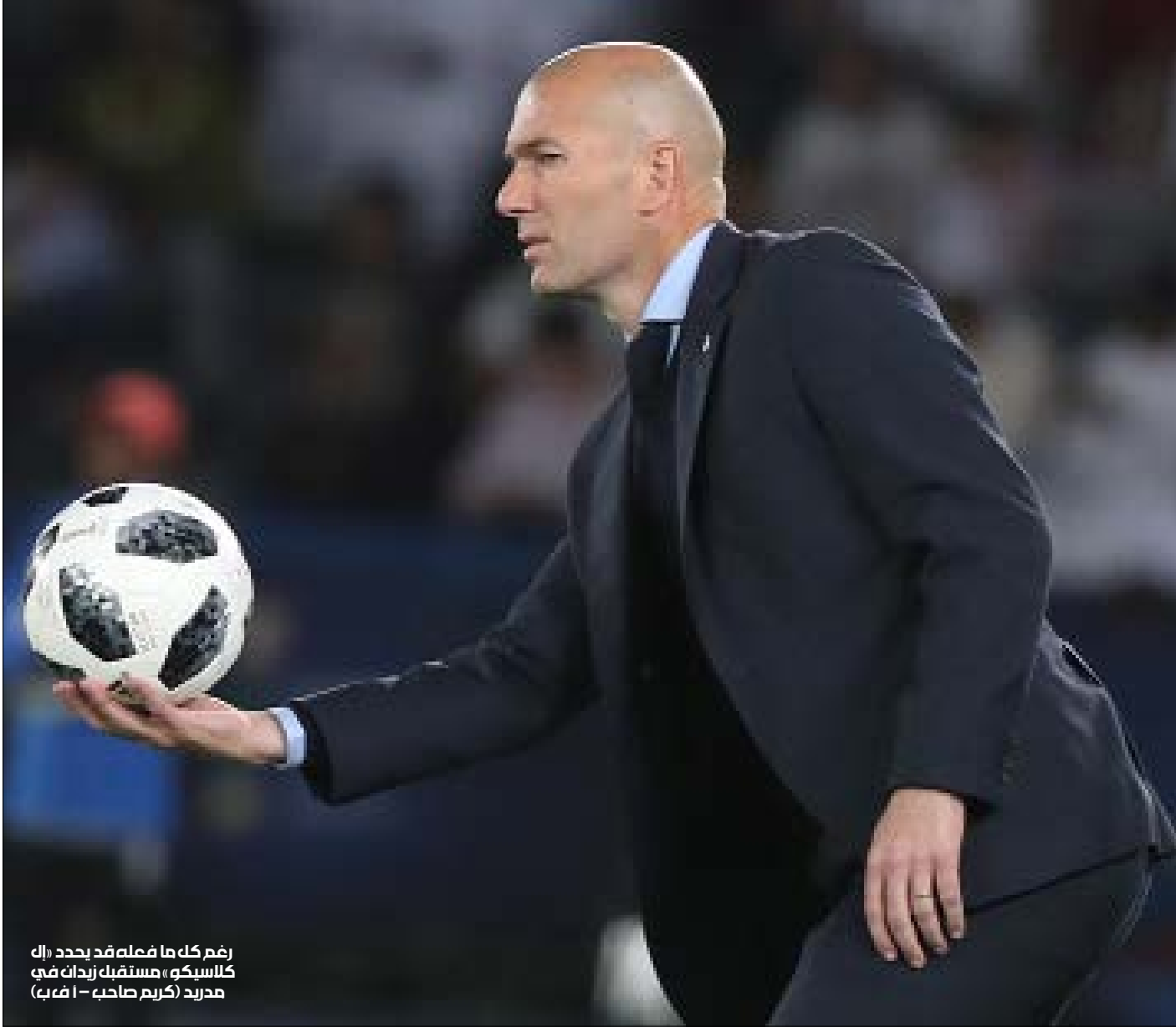
رغم كل ما فعله قد يحدد «إل كلاسيكو» مستقبل زيدان في مدريد

هو أسبوع «إل كلاسيكو»، المباراة التي ستقام في نهاية الأسبوع بدأ الحديث عنها. وسط عناوين كثيرة ستطبع لقاء قطبي كرة القدم الإسبانية، عناوين ستكون مفصلة في تحديد شكل الدوري بعد نهاية الدقائق الـ 90. لا يكفد قد تحدد مستقبل البعض