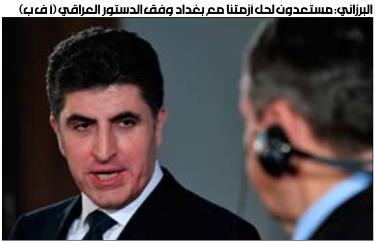
البرزاني: مستعدون لحل أزمنا مع بغداد وفقاً للدستور العراقي

ترجم موظفو القطاع العام في «إقليم كردستان» أمس، تحذيرات «حركة التغيير» الأسبوع الماضي، والداعية إلى التظاهر والاحتجاج ضد حكومة نجرقان البرزاني، لأسباب هالية، في وقت يبحث فيه الأخير، من برلين، «وساطة» أوروبية جديدة لحل الأزمة القائمة مع بغداد