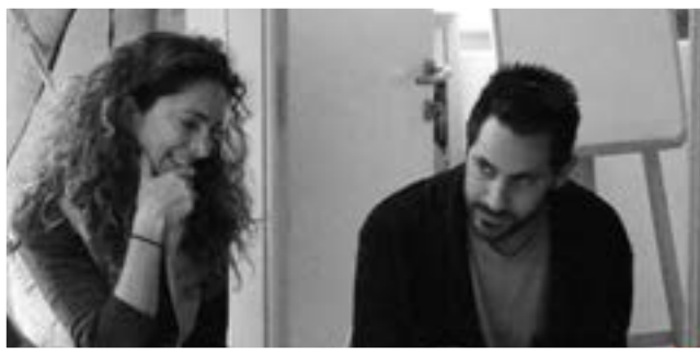
فرقة الفنانين والممثلين المشاركين في المشروع