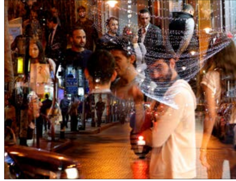
الكثير من المتفجيت والقليل من المتسوقين (هيلم الموسوي)