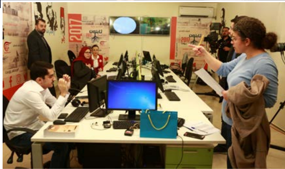
قسم الويب في المحطة

احتفالية «ثابتون» بدءاً من الثامنة صباحاً على شاشة «الميادين»