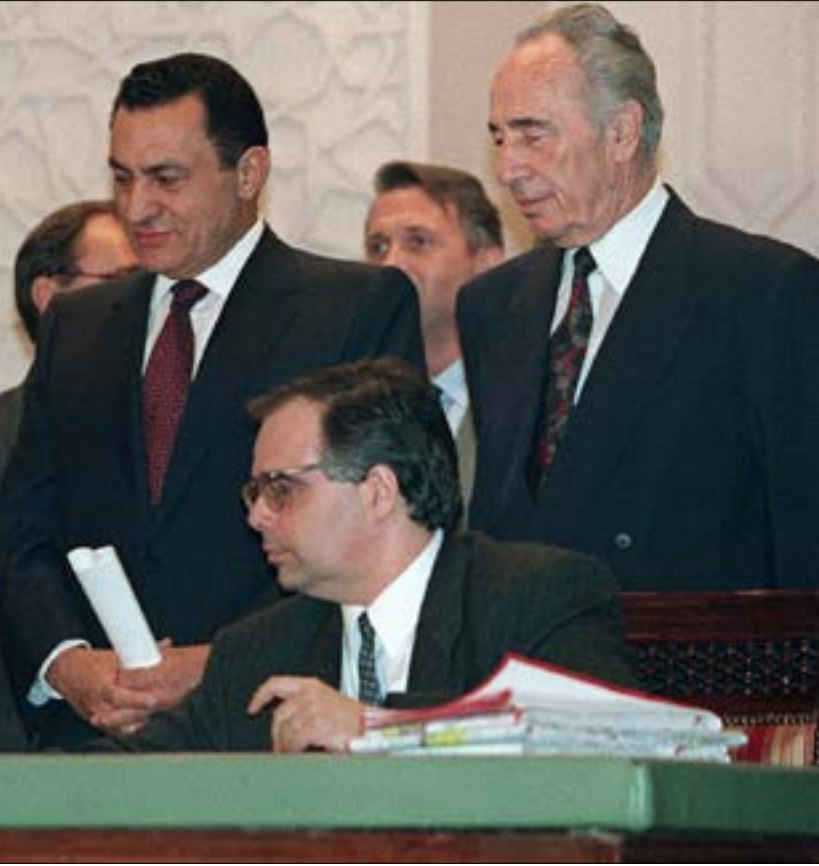
عرفات لم يوقع كل اوراق الاتفاق، كما يجب ان يفعل

من الاتفاق كله، فاستشاط غضباً. ومضى رئيس الوزراء الإسرائيلي نحو الرئيس المصري يشكو إليه ما يحصل غاضباً، ويشير له بيديه إلى أنه لا يقبل بما يجري. وظهر مبارك، أمام الجمهور الذي تغص به القاعة، وكأنه يحاول استرضاء رابين. ثم تكلم حسني مبارك مع عرفات، أمراً إياه بأن يوقع على ما اتفقوا عليه، لكن الأخير أخذ يجادل بأن الاتفاقية لم تحسم بعد في أمر الخرائط. وتدخل بيريز لإقناع عرفات بأن يوقع، لكي تمضي الاحتفالية على خير، غير أن عرفات لم يكن يصغي إلى أحد. ظل عابس الوجه، ويابس الرأس. وأصبح الموقف محرراً جداً أمام الحاضرين. ولم يفلح كريستوفر ولا كوزيريف في تليين موقف الزعيم الفلسطيني. وسرى التوتر بين الجميع فوق خشبات المسرح، والجمهور ينظر إلى هذا العرض العجيب بفضول. وحاول وزير الخارجية الأميركي أن ينقذ الموقف، فأخذ الميكروفون، وبدأ يلقي خطبة عن «الخمام والسلام والوثام والانسجام»،