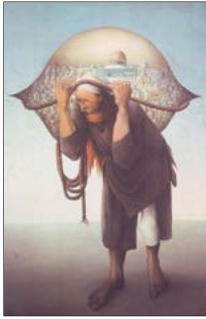
لوحة «جبك المحاكم» للتشكيلي الفلسطيني سليمان منصور (1947)

والقدس والقدس من كل حال وحين والي كل حال وحين والي أيد الأبدين أمين.