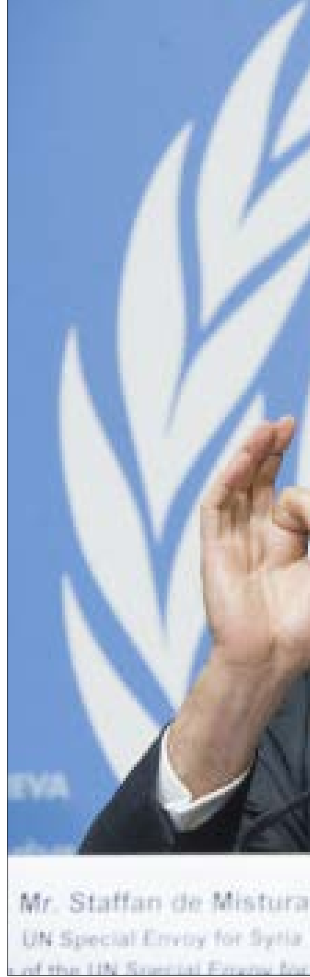
Mr. Staffan de Mistura UN Special Envoy for Syria

في الرابع من الشهر الجاري، أعلن مصدر في الرئاسة اليمنية المقيمة في الرياض، أن هادي «أصدر توجيهات إلى نائبه الفريق علي محسن الأحمر، المتواجد في مارب، بسرعة تقدّم الوحدات العسكرية للجيش الوطني والمقاومة الشعبية نحو العاصمة صنعاء». غير أن أيّ تقدّم على هذا الخط لم يُلاحظ حتى الساعة. في المقابل، نشطت «المقاومة الجنوبية»، المدعومة من الإمارات، على خط الساحل الغربي