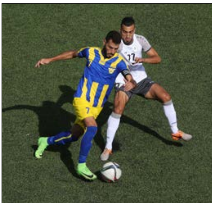
يطلق الصفاء اليوم السباق إلى الصدارة مع ختام مرحلة الذهاب في الدوري

على الصعيد الأجنبي، لكن الأنظار ستنتج بداية إلى مباراة اليوم لمعرفة إذا ما كان الصفاء سيتخطى تعادل الأسبوع الماضي مع النبي كرامي البلدي في طرابلس.