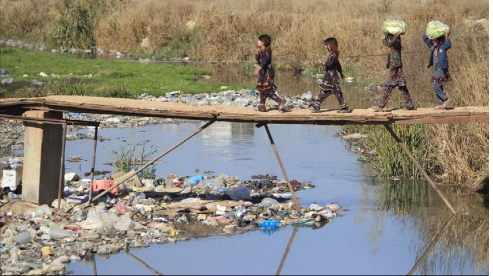
إصابة جديدة بالسرطان تسجل بشكل شبه أسبوعي بين أبناء البقاع (علي حشيشو)