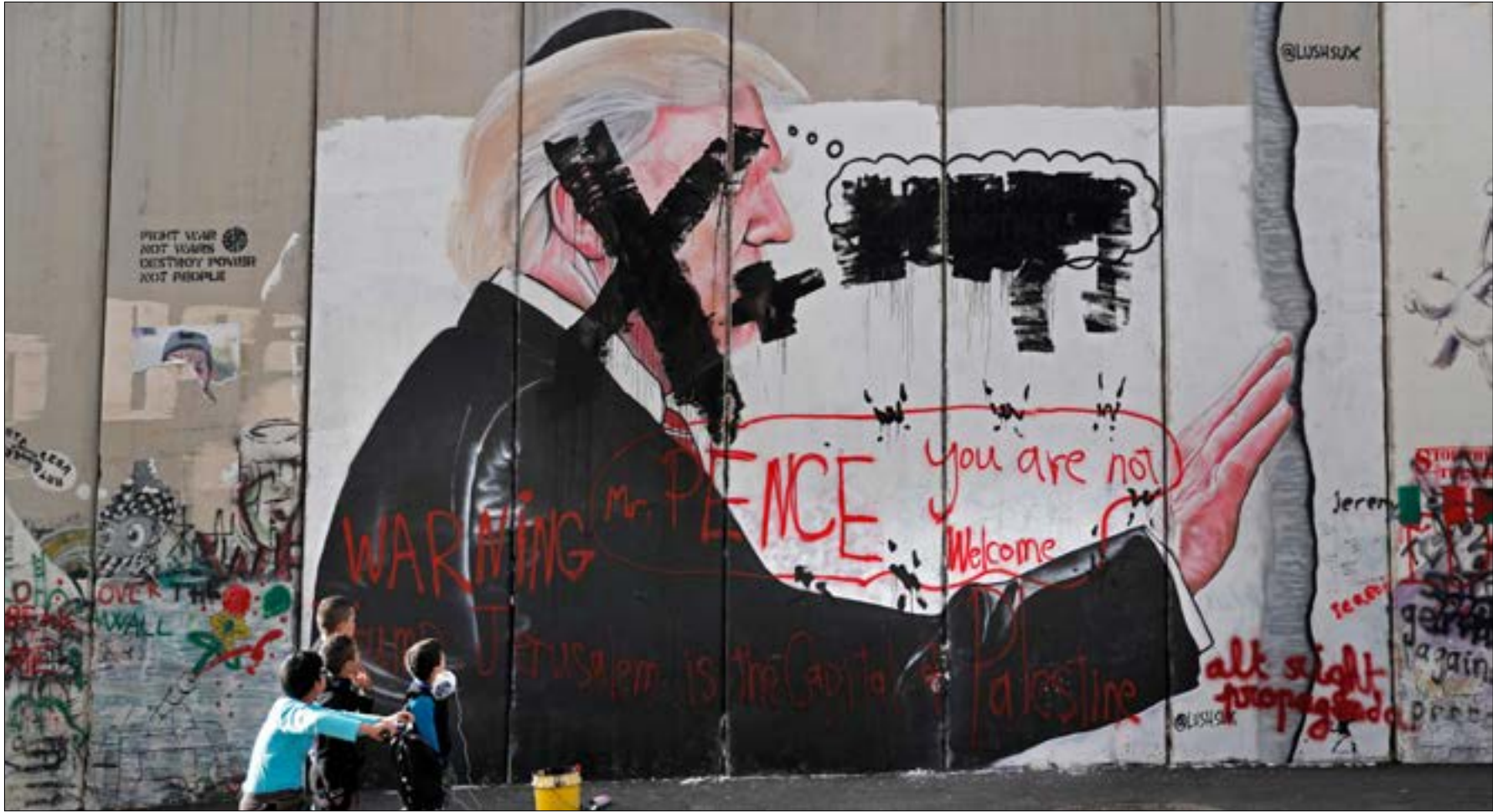
المشهد في الضفة أخذ في التصاعد، وقد يصل ذروته اليوم (أضرب)

وعد بلفور الجديد لم تظهر تبعاته السلبية كلها بعد، خاصة على صعيد ما ينتظر مدينة القدس المحتلة، وكذلك سكانها الفلسطينيين في بلدتها القديمة وأحيائها العربية وضواحيها، ولا ما قد يتبعه من قوانين إسرائيلية يهودي الكنيست أن يقرها استناداً إلى المستجد الأخير، وستمس حياة هؤلاء وبجانهم حياة أكثر من مليون ونصف مليون فلسطيني يعيشون في الأراضي المحتلة عام 1948. يرى هؤلاء أن تركهم وحيدين هذه المرة ليس كك مرة، فما يحاك قد يخرجهم من دائرة المواجهة، ويحول حياتهم إلى جحيم خالص، أو ربما يجدون أنفسهم قانونياً مواطنين إسرائيليين، أو على عاتق سلطة فلسطينية ضعيفة لا تسمن ولا تغني من جوع، أو حتى «بلا قيد»