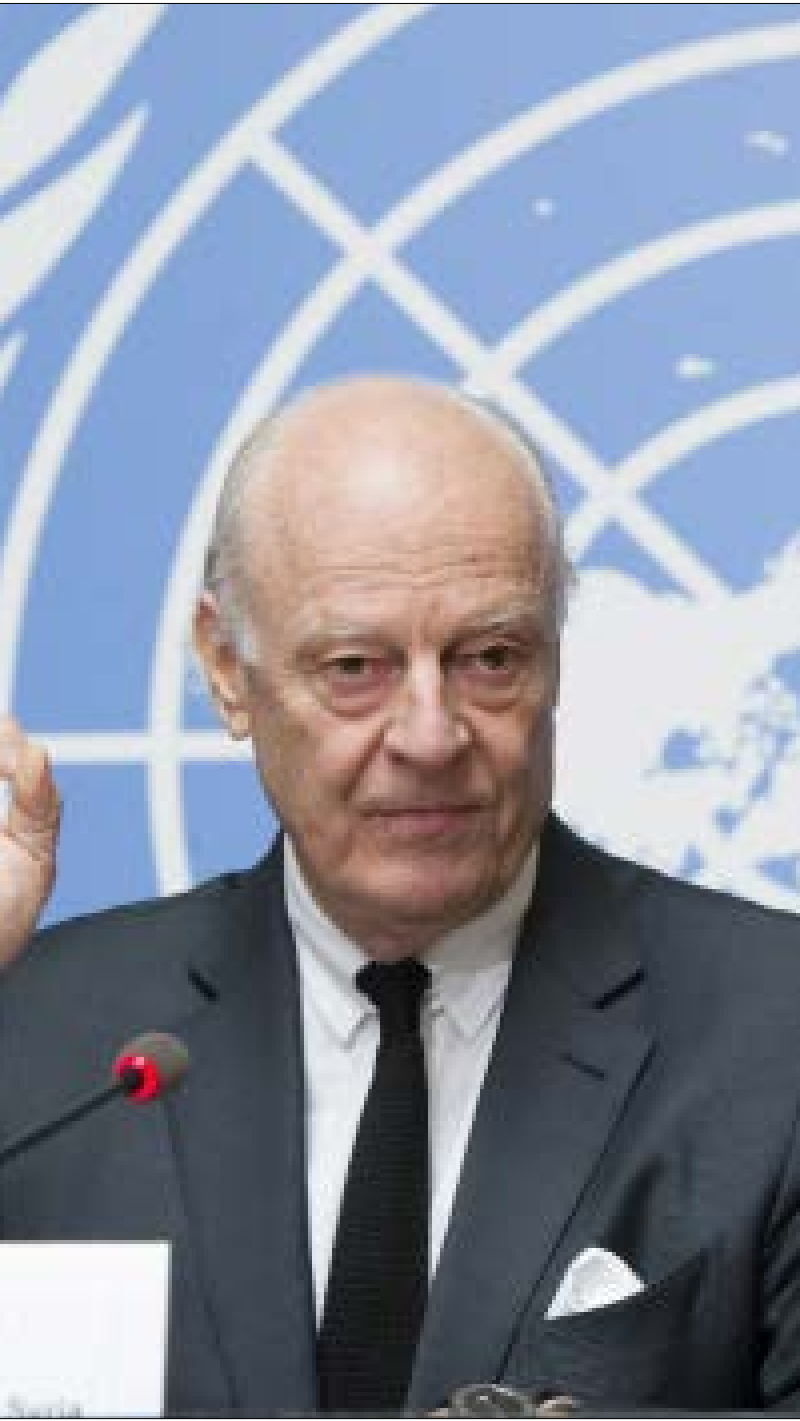
دي ميستورا: هزيمة الإرهاب تتطلب عملية سياسية ذات مصداقية

ستيفاني ويليامز، ونائب مساعد وزير الخارجية، ديفيد ساترفيلد، إلى جانب مبعوثين من ألمانيا وبريطانيا وفرنسا. وفي السياق نفسه، قال عضو وفد المعارضة - رفض الكشف عن اسمه - لوكالة «فرانس برس»، إن «معظم الدبلوماسيين الذين زارونا يكررون الدعوة ذاتها: عليكم التحلي بالواقعية إذا كنتم تريدون تسوية النزاع». وأضاف القول: «يريدون منا تجميد مطلب تنحي الأسد، وليس التحلي عنه تماماً». ويقول الوسطاء