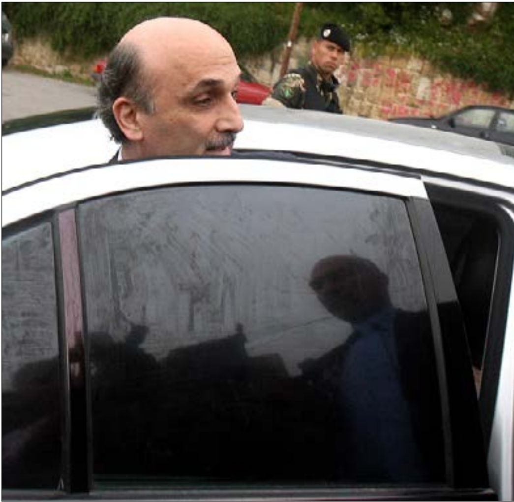
جمع: عزله القوات ليس مزحة (هيثم الموسوي)

وحول تحديد القوات موقفها من سحب وزرائها أو بقائهم في الحكومة، قال جمع إن «هذا شأن يعنيننا وحدنا. حينما نلاحظ أن أياً من قناعاتنا لا يترجم في الحكومة، نتخذ القرار المناسب. لكن الغمز واللمز طوال الفترة الماضية في هذا الموضوع شأن غير مقبول، وعزل القوات ليس مزحة. لا أحد يعزلها سوى جمهورها وقاعدتها الشعبية».