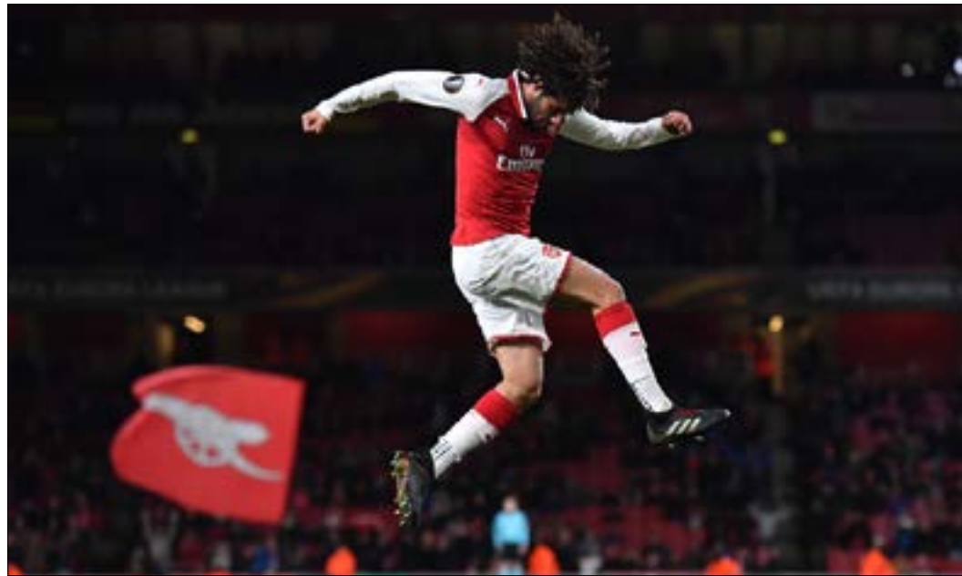
النبي محتفلاً بهدفه لارساك

وفي المجموعة الأولى، حسم أستانا الكازاخستاني تأهله بعد فوزه على مضيفه سلافيا براغ التشيكي 0-1.