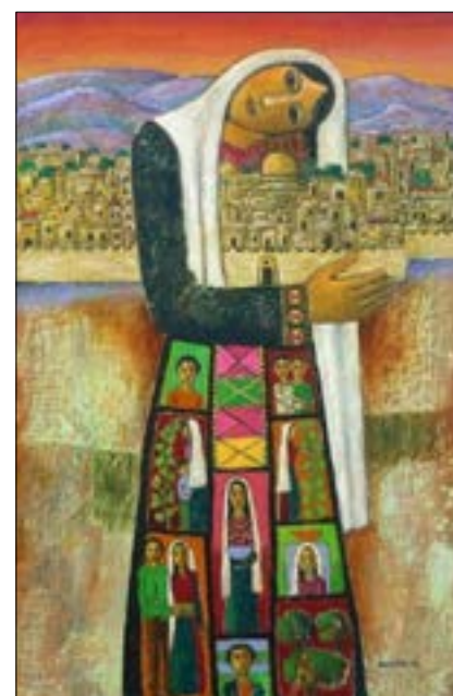
لوحة للتشكيلي الفلسطيني نبيك الصائبي (1943)