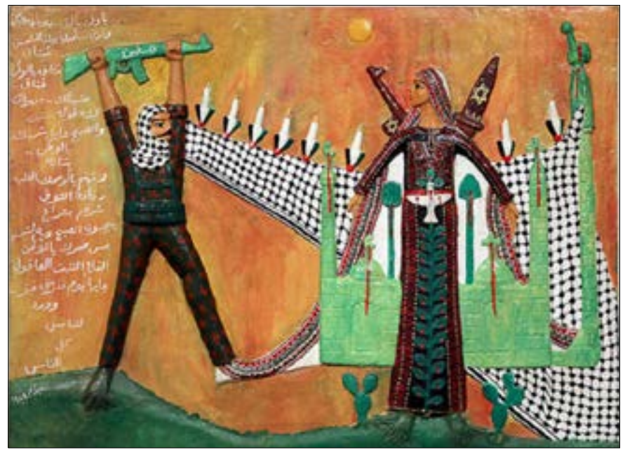
«يا وطن يا ليل» لصيد الحي مسلم

تاج الشوك فوق جبينه وفوق كتفه الصليب دلوقت يا قدس ابنك زي المسيح غريب خانوه نفس اليهود ابنك يا قدس زي المسيح لازم يعود على أرضها.