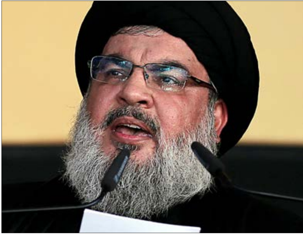
نصرالله: العدوان الأميركي السافر على القدس يرتب على الجميع مسؤوليات (هيثم الموسوي)

ترامب وإدارته يندمان ويُجمدان مفاعيل القرار». وحث الحكومات والدول العربية على «وقف القتال والصراعات الداخلية، والبحث عن معالجات سياسية» لأن «مقدساتكم وقدسكم وقضيتكم المركزية في خطر شديد». أما في لبنان، «فنحن جميعاً معنيون بمواكبة الحدث التاريخي، وبالإقبال بالفعاليات التي تعبّر عن الاحتجاج والتضامن»، داعياً إلى تظاهرة شعبية تُجرى «يوم الاثنين، في الضاحية الجنوبية، تحت عنوان الدفاع عن القدس والمقدسات والتضامن بهذه الجسارة والعنجهية الأميركية». وفي الختام، ذكر نصرالله أنه «لدينا القدرة على تحويل التهديد إلى فرصة، والخطر إلى انجاز. كل ما قام به العدو، سابقاً، كان مجرد أعمال حمقاء تنقلب عليه وتؤدي إلى غير أهدافها، بفعل الصبر والثبات وعدم الخيانة. ما قام به ترامب تهديد كبير، يستطيع الفلسطينيون وكل شرفاء العالم أن يحولوه إلى أعظم فرصة».