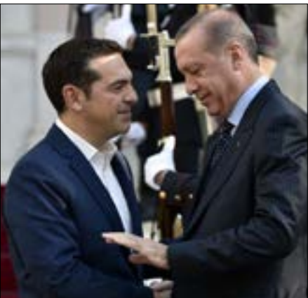
فك تسبيراس إن اليونان وتركيا اتفقتا على بدء إجراءات لبناء الثقة

مراجعة ولا إلى تحديث». وشدد على أن المعاهدات قابلة «للتفسير وليس للمراجعة بحسب القانون». وفي هذا الإطار، أثار الرئيس التركي مسألة «عدم انتخاب مفت عام لمسلمي غربي تراقيا»، وهي منطقة يونانية فيها أقلية تركية، وهو بند نص عليه اتفاقية لوزان. ورأى أن