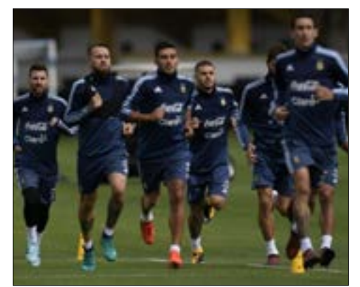
لاعبو الأرجنتين في حصة تدريبية لمواجهة البيرو

وتتصدر البرازيل الترتيب برصيد 37 نقطة وضمنت بطاقة التأهل المباشر الأولى، فيما تتصارع سبعة منتخبات هي: الأوروغواي (27 نقطة)، كولومبيا (26)، البيرو