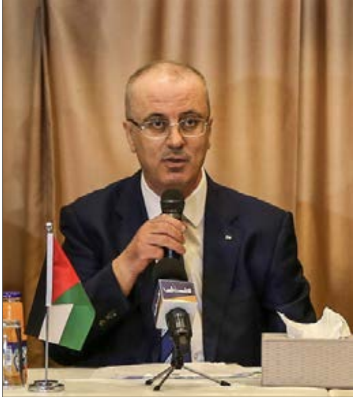
ينتظر الفريزون رفع الحمدا لله تقريرا إلى عباس لرفع العقوبات عن القطاع

شارفت الزيارة «الاستكشافية» لرئيس حكومة «الوفاء الوطني»، لقطاع غزة على الانتهاء. كل الملفات الخلافية أُجّلت لمناقشتها مطلع الأسبوع المقبل في القاهرة. ملف سلاح المقاومة مثلاً، حلّه مستورد... اعتماد نموذج «حزب الله»