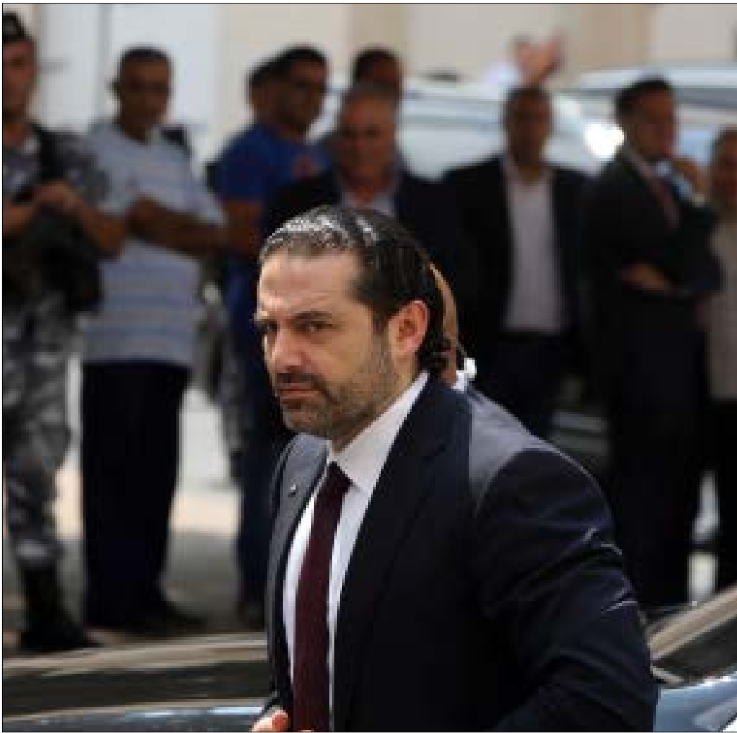
هل يحاول «المستقبل» كسب الوقت لتحسين ظروفه قبل الانتخابات؟

وفيما يعترض القواتيون وغيرهم على التشكيلات القضائية، تنسحب اعتراضات القوات على العرقلة التي يتعرض لها ملفاً تلفزيونياً لبناني والوكالة الوطنية للإعلام. إذ يبدي وزير الإعلام ملحم رياشي استياءه الشديد من الوضع الذي وصل إليه تلفزيون لبنان وتأخر تعيين إدارة جديدة له. وبحسب ما علمت «الأخبار»، فإن رياشي ينوي إثارة الموضوع مع رئيس الجمهورية، لكون التلفزيون في حاجة ماسة إلى تعيين مجلس إدارة جديد، خصوصاً أن الرواتب والمساعدات العائلية متوقفة منذ أشهر عن الموظفين، ولم يعد واراداً تأجيل هذا الملف. علماً بأن اقتراح تعيين مجلس الإدارة الجديد، موجود في أدراج الأمانة العامة لمجلس الوزراء منذ أكثر من شهرين، وغالبية القوى السياسية ممثلة فيه. (الأخبار)