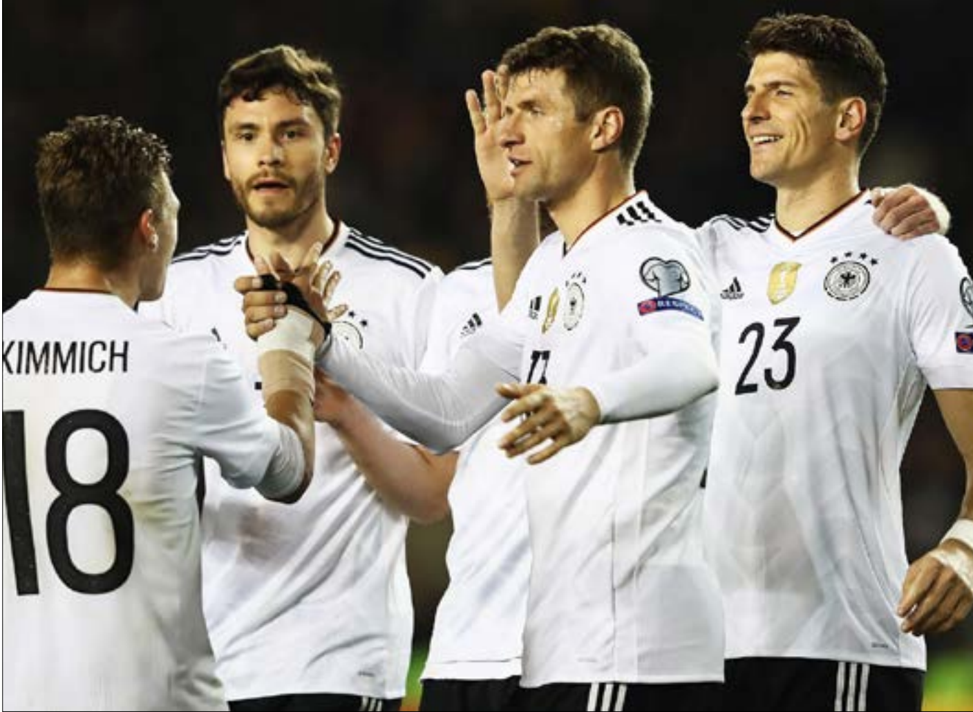
قلق لدى الألمان من تأثر المنتخب الوطني بما يعيشه بايرن ميونيخ وجوهه حالياً (أرشيف)

صحيح أن ألمانيا تحتاج إلى نقطة واحدة من مبارياتها أمام أيرلندا الشمالية الليلة لتؤمن عبورها إلى هونديال 2018. لكن النظرة البعيدة للألمان مصبوغة بالقلق، أما السبب فهو الخوف من استمرار أو تفاقم الأزمة التي يمر بها بايرن ميونيخ