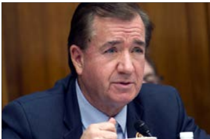
رويس «وائق» بمرور القانون في مجلس النواب بفرعيه الجمهوري والديمقراطي

اللبنانية ميشال عون»، بحسب ما أوضحت «فورين بوليسي». وتابع رويس: «هذا أحد أكبر الشكوك التي تساورني حول لبنان!». من جهة أخرى، أشار المقال إلى «المخاوف المتزايدة التي نقلها المشرّعون الأميركيون في السنوات الأخيرة حول تعاون مرمّوم بين الجيش اللبناني وحزب الله». وكانت الصحافة الإسرائيلية قد كشفت الأسبوع الماضي أن «لجنة العلاقات العامة الأميركية الإسرائيلية» (إيباك) وضعت على رأس أولوياتها لعام 2017 «إقرار قوانين تزيد العقوبات على حزب الله».