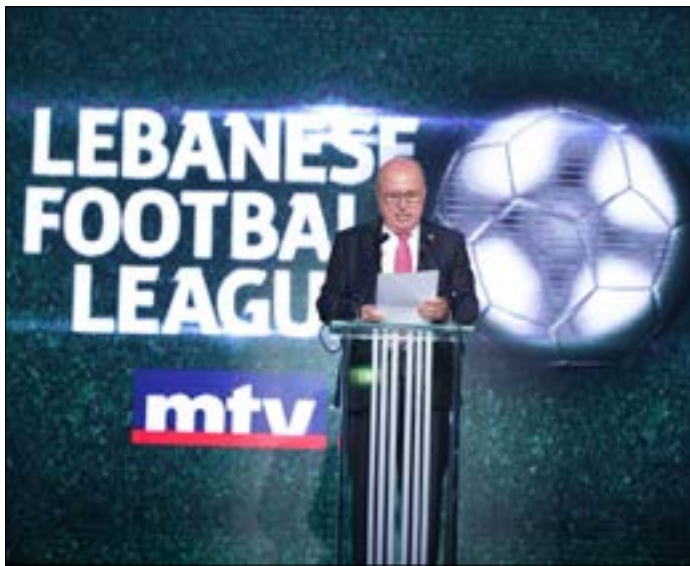
توقع حيدر ان يكون الموسم المقبل تنافسيا نظرا الى الاستعدادات المهمة التي تجريها الاندية

اللبناني لكرة القدم السيد هاشم حيدر وأعضاء الاتحاد، عضو لجنة الشباب والرياضة النائب سيمون ابي رميا، رئيس اللجنة الاولمبية