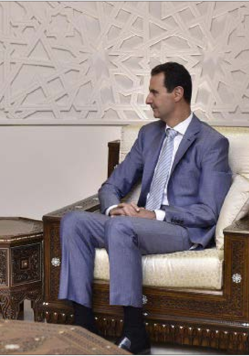
حك وزير الدفاع الروسي في زيارته غير المعلنه رسالة من بوتين إلى الأسد

بينما تنشط التحضيرات لانعقاد جولة محادثات أستانا المقبلة، وسط تفاوتك تركي - روسي مشترك، تتسارع عمليات الجيش السوري وحلفائه في محيط دير الزور الشرقي، فيما يبدو أنه تمهيد لعبور النهر شمال بلدة الجفرة. ويبدو تحرك الجيش استباقاً لوصول «قوات سوريا الديمقراطية» التي واصلت الزحف نحو أطراف المدينة الشمالية