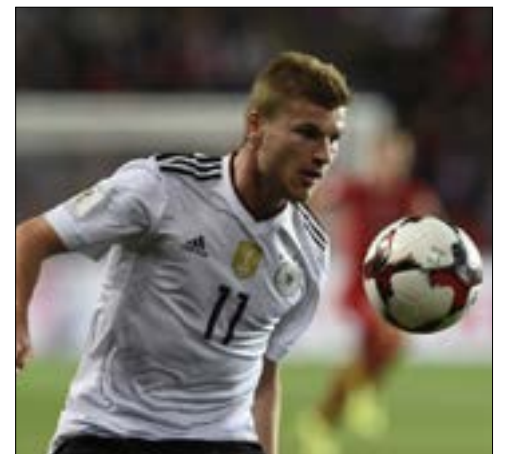
تابع ريال مدريد في مباراة ألمانيا والنرويج

للتعاقد مع البرازيلي فيليبي كوتينيو من ليفربول والأرجنتيني أنخل دي ماريا من باريس سان جيرمان الفرنسي، وهذا ما فشل النادي الكاتالوني في إتمامه في النهاية.