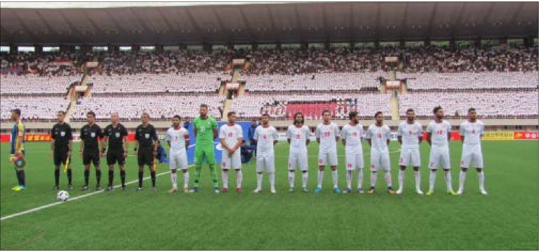
المنتخب اللبناني قبيل بدء المباراة على أرض ملعب كيم إيك سونغ في بيونغ يانغ

أبرز دليل على هذا التردّي تعليق مشجعي نادي النجمة على حادثة البطاقة الحمراء في بيونغ يانغ، إذ كتب القيثمون على صفحة «مشجعي نادي النجمة» على «فيسبوك» تعليقا شرحوا فيه ما ارتكبه صبرا وختموه بعبارة «كبير يا ماهر... مين كوريا الشمالية ومين رئيسها؟!»، إنه المنطق الكارثي نفسه الذي يحكم لبنان، وتصرفات بعض اللبنانيين منذ عشرات السنين، والذي حوّل مجتمعنا إلى غابة كبيرة ترفض الخضوع لأية قوانين، وتتخطى كل الخطوط الأخلاقية الحمراء.