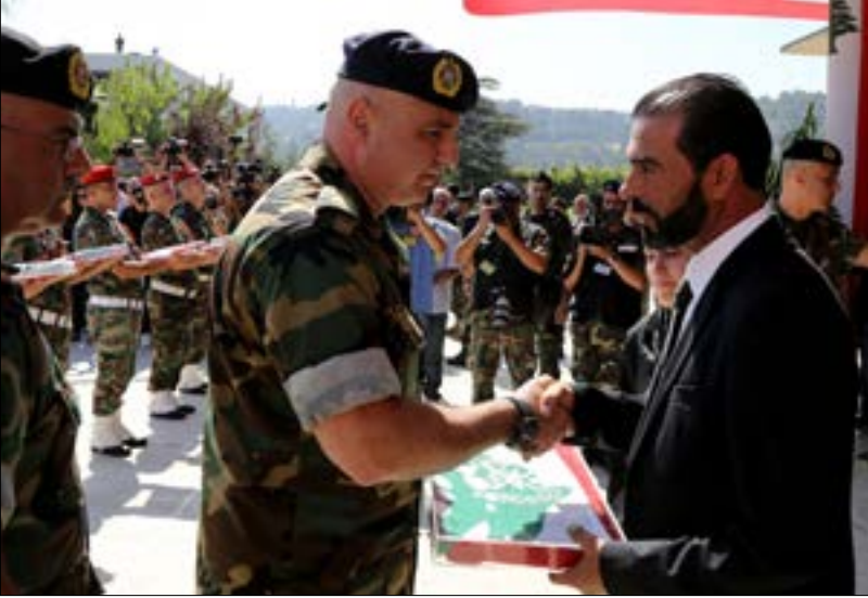
الإصرار على التحقيق، بعكس حرص الجيش على إجراء مراجعة داخلية فعلية

لا تنتهي تداعيات استشهاده العسكريين مع فتح تحقيق داخل الجيش فقط. فالأسئلة مطروحة عن تحجيد السياسيين والمسؤولين كافة عن هذا الملف، وحصر التحقيق بالجيش دون سواه، ما يعرض المؤسسة العسكرية لسابقة.