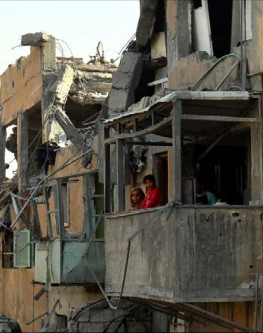
في الحقيقة، كانت الأزمة السورية منذ بدايتها متصلة بأزمة المنطقة

إسرائيل ودول الخليج، قبل التعامل مع حل الموضوع الفلسطيني! بزعم أن ذلك سيشكل الطريق الأفضل لتحقيق السلام! في أجواء هذا الطرح التسويي الجديد، بدأ أن رئيس الوزراء الإسرائيلي بنيامين نتنياهو قد أصبح رجل القرار في المنطقة بلا منازع! ولم يقتصر تعامله على هذا الأساس مع الأطراف والقوى الإقليمية، بل تعداه إلى التعامل مع الدول العظمى... وبشكل محدد مع البيت الأبيض والكرملين، والجميع يذكر استخفافه بالرئيس الأميركي السابق باراك أوباما، في الفترة الأخيرة من ولايته وسعيه لتأليب الكونغرس عليه، وكذلك محاولاته الإيحاء بأنه قد أصبح صاحب القرار في موسكو!