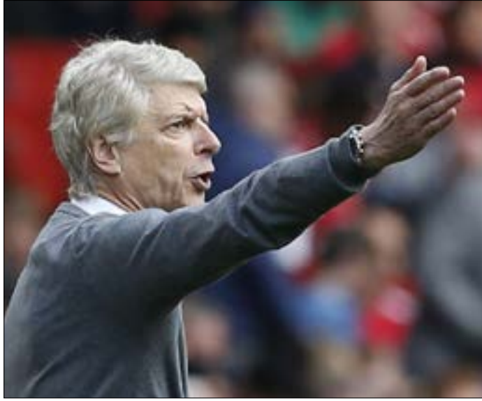
عرض يونايتد على فينغر تدريبه قبل 15 عاماً

كان من الممكن أن لا يكتفي المدرب الفرنسي أرسين فينغر بالإشراف على فريقه الحالي أرسنال في تجربته الإنكليزية المستمرة منذ 1996 لو وافق قبل 15 عاماً على عرض مانشستر يونايتد لتدريبه، بحسب ما ذكرت صحف إنكليزية. ونقلت الصحف عن فينغر قوله في السيرة الذاتية لمارتن إدواردز، رئيس يونايتد السابق بين 1980 و2002: «لم أذهب لأنني كنت سعيداً جداً هنا (في أرسنال). أكثر الأشخاص كانوا يشعرون بالسعادة بوجودي، لقد كنت سعيداً جداً هنا».