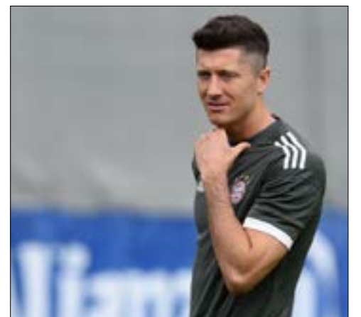
انتقد ليفاندوفسكي سياسة التعاقبات في بايرن (أف ب)

كذلك، يواجه بايرن أزمة ثانية تتعلق بنجمه الدولي توماس مولر الذي لم يستبعد ترك فريقه كما حصل مع زميله السابق باستيان شفابنشتايفر بقوله لمجلة «كيكر»: «عندما نرى أن لاعباً مثل شفابنشتايفر كان هنا لأكثر من عشر سنوات وغادر، فإن الأمر يمكن أن يحصل معي أيضاً». ولم يتأخر رد رومينغيه على مولر، وأكد أمس أيضاً: «حتى اللاعبون الذين لهم رمزية لا يضمنون اللعب». من جانبه، اعتبر بول برايتنر نجم بايرن السابق أن العملاق البافاري تحت إشراف المدرب الإيطالي تراجع خطوة على الأقل إلى الوراء.