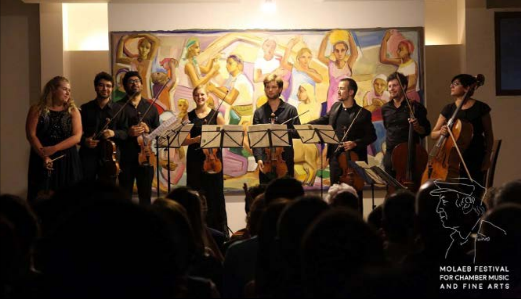
من دورة العام الماضي

MOLAEB FESTIVAL FOR CHAMBER MUSIC AND FINE ARTS