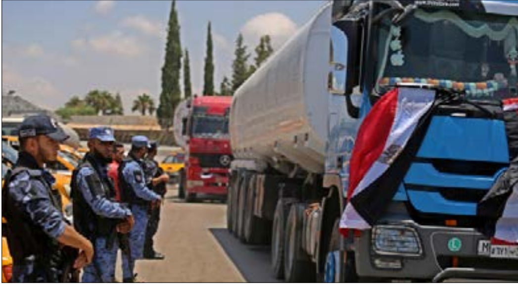
اسهم الجيش المصري في تأمين عودة الحجاج إلى غزة أمس

وفيما كان عدد من المسلحين يضربون طوقاً لمنع وصول الإمدادات، دُمر المهاجمون مدرعتين وأشعلوا النيران فيهما، كما استولوا على سيارة دفع رباعي. وطوال 45 دقيقة، لم تصل أي تعزيزات أمنية، كذلك فإن المسلحين زرعوا عبوات في الطريق أدت إلى منع وصول سيارات الإسعاف التي تعرضت هي الأخرى للاستهداف، بل إن المسلحين استهدفوا سيارتي إسعاف من الدفعة الأولى التي وصلت