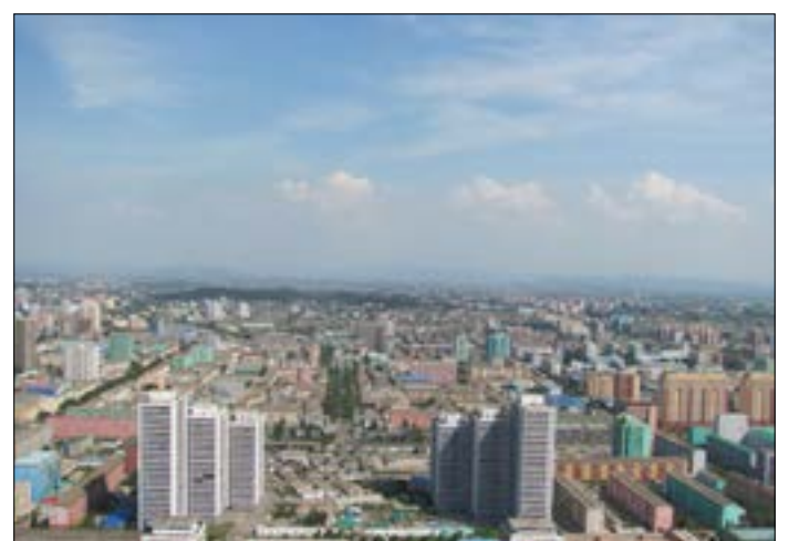
مشهد للمدينة من برج زوتشي

خلال إقامتي في العاصمة الكورية، التقطت 166 صورة في الكاميرا، طلب مرافق الكوري الذي يهتم بالبعثة اللبنانية أن يرى بعضاً منها، وقام بمحو صورتين فقط مع شرح للسبب: إحداهما ألغيت لأن إطارها مائل وذلك أثر على شكل صورة وجه الرئيس الكوري الراحل والأخرى لأنها أظهرت أحد الشعارات المكتوبة على الجدران بطريقة مبتورة ما انتقص من معناه. الشعار، بالمناسبة، يقول «كلما اشتدت الأزمات... تقدّمنا بخط مستقيم».