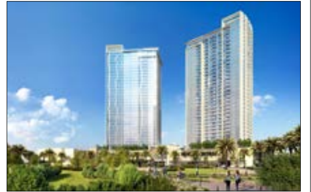
تبلغ كلفة المشروع 326 مليون دولار

في خطوة لافتة وفريدة من نوعها على مستوى العالم شهدت دبي إطلاق مشروع عقاري ضخم (أستون بلازا) بقيمة 326 مليون دولار يتميز بكونه يتيح شراء الشقق باستخدام عملة «البيتكوين» الرقمية.