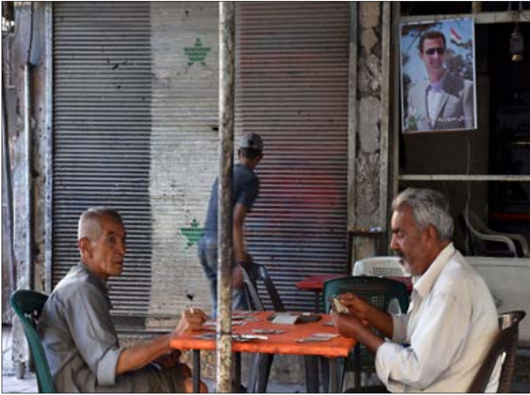
داخل أحد أحياء مدينة دير الزور أول من أمس

تقدمها في محيط المنطقة الصناعية، ووصلت إلى «الواء 113 - دفاع جوي»، لتكون على بعد 6 كيلومترات فقط من ضفة الفرات المقابلة لأحياء دير الزور. وشهد أمس هجوماً مضاداً للتنظيم على الطرف الشرقي للمدينة الصناعية في محيط «دوار 10 كيلومتر» على الطريق الرئيسي بين دير الزور والحسكة. ومن المتوقع أن تستكمل «قسد» تحركها نحو أطراف المدينة بشكل سريع، لتتمكن بذلك من إتمام عزل تنظيم «داعش» في