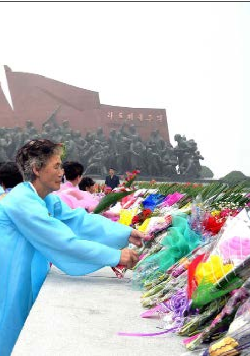
في ذكرى تأسيس الجمهورية... زهور على ضريح الرئيس المؤسس

المدينة الراقدة بين نهريين جميلة وهادئة وفيها حركة بشرية دائمة خلال النهار، الجو ملوّث بسبب دخان المصانع القريبة لكن كثرة الشجر لا تشعرك بثقل الهواء. أكثر ما يلفت النظر بداية هو تلك المباني الملوّنة بالأخضر والزهري والأصفر والأزرق أشبه بقطع «البيغو» ضخمة، شعور طفولي جميل في عاصمة نووية. الأرصفة الواسعة تتضمن خط دراجات هوائية لا يهدأ، عدد قليل جداً من المارة يتكلمون في هواتفهم الخلوية ويحدث ذلك بالأغلب في محيط محطة القطر. هكذا يستعيد زائر بيونغ يانغ متعة رؤية وجوه المارة وملامحهم