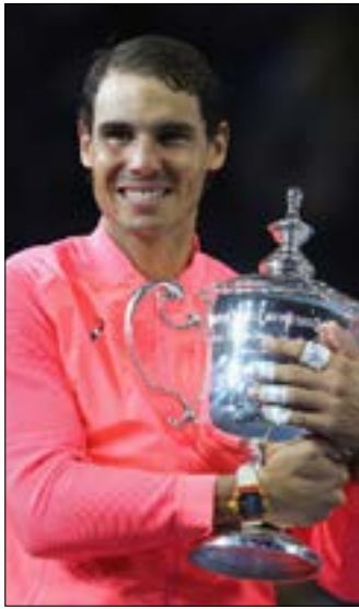
نادال مع كأس البطولة الأميركية

لنادال الذي فاز على الإسباني في نهائي أستراليا، بينما ظفر «رافا» بلقب «رولان غاروس». وكان الإسباني سعيداً بإحرازه هذا اللقب الذي تزامن أيضاً مع عودته في 21 آب إلى صدارة تصنيف المحترفين للمرة الأولى منذ تموز 2014، وهو قال بعد تتويجه: «أضيت أسبوعين مميزين جداً بالنسبة إليّ. ما حصل هذا العام لا يصدق، ولا سيما بعد مواسم عدة عانيت فيها من إصابات خطيرة وتراجع مستواي».