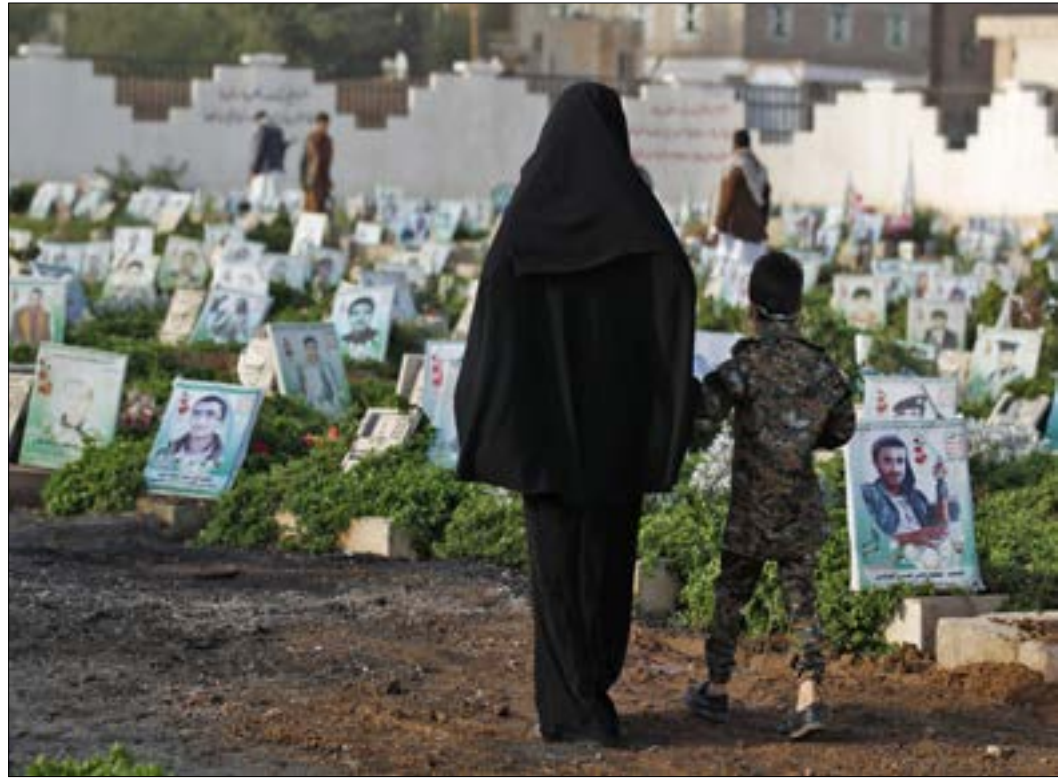
يستعد الطرفان لإقامة فعاليات متقاربة زمنياً خلال الشهر الجاري

الأخير لـ«المؤتمر» في ميدان السبعين، أن الرئيس السابق والمحيطين به استشعروا خطورة التصعيد ضد «أنصار الله» التي باتت لها اليد الطولى في المجالين العسكري والأمني، خصوصاً في صنعاء، إلا أنه من غير المعلوم، إلى الآن، ما ستؤول إليه تقديرات اللجنة العامة لـ«المؤتمر» التي وضعت في حالة انعقاد دائم، إذا ما تراءى لصالح أن الطرف بات مناسباً لفرض عرى الشراكة مع «أنصار الله». هذا الاحتمال بالذات هو ما تتحسب له الحركة، التي تقول مصادر إنها وصلت إلى اقتناع بأن