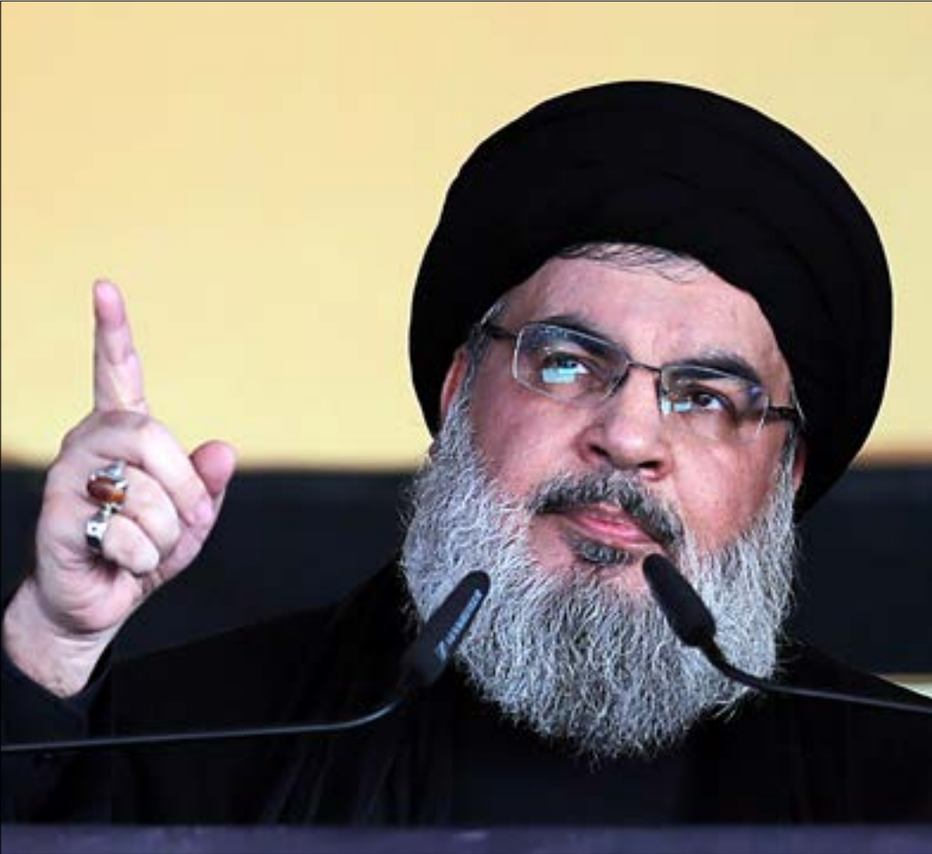
البعض في لبنان لن يرضى مهما فعلنا، فليشربوا مليون محيط

محيط... والمهزوم والمكسور يمكنه أن يرفع صوته قليلاً». وشدّد نصرالله على أهمية إحياء ذكرى عاشوراء كمناسبة «استنهاضية» وعلى ضرورة حضور المجالس مع مراعاة المحيط، داعياً قراء العزاء إلى تجاهل «الأمر الخاطئة» و«تجنب المبالغات»، و«عدم طرح مواضيع ذات إشكاليات