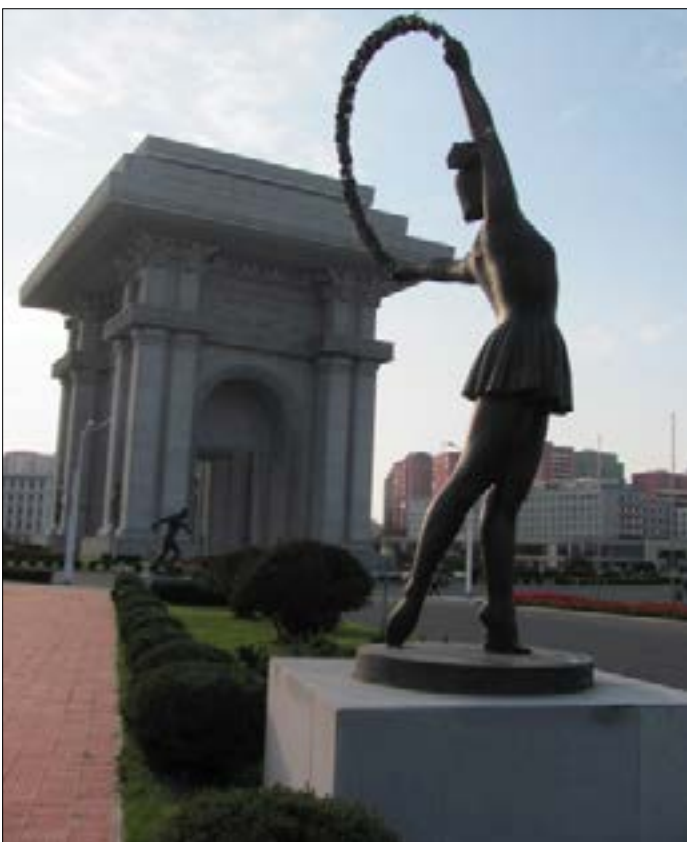
من مدخل الملعب الرياضي قرب قوس النصر

زهرة المانيوليا هي الرمز الوطني للبلاد، وفي المدينة حدائق عامة تمتلئ بها، زهرة الأوركيد الوردية اللون رمز لمؤسس الدولة كيم إيل سونغ، والحمراء لكيم جونج إيل والد الرئيس الحالي. في الأحياء السكنية، حدائق عامة