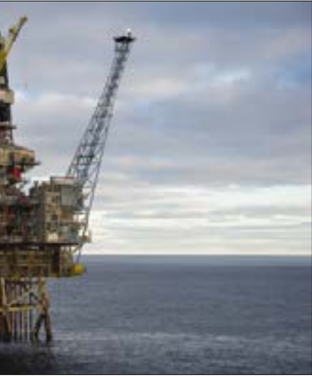
سيبك لبنان في المرتبة 30 عالمياً في إنتاج الغاز

عالمياً (من بين 102 دولة منتجة للنفط)، وفي المرتبة الـ 13 إقليمياً وفق قائمة CIA.