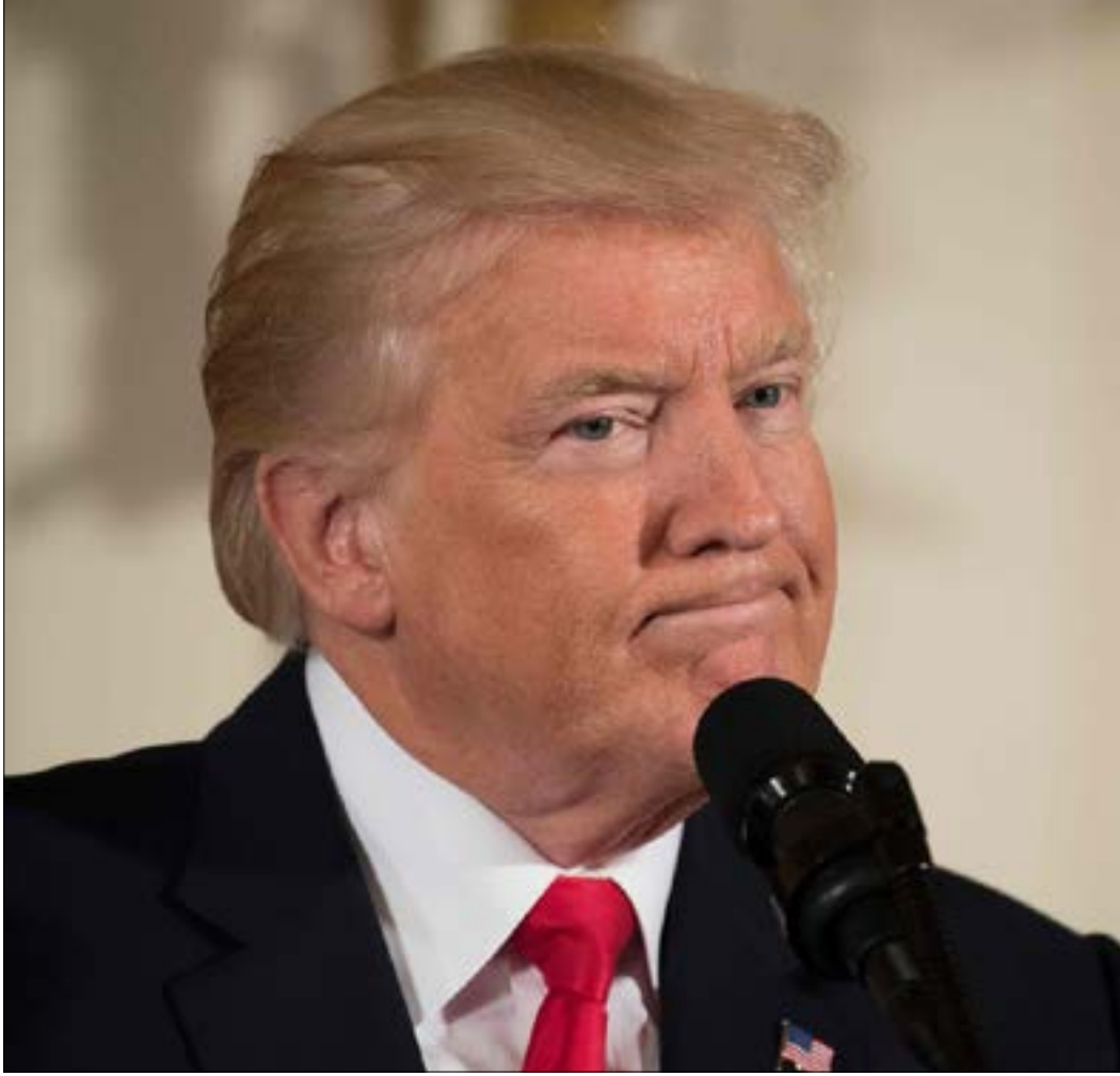
موقف ترامب بعد استقباله الحريري صاحته السفارة الأميركية في بيروت

بها طويلاً لم تُنتج سوى المزيد من التغطية لعمل حزب الله. حتى إن عجلات العمل الحكومي تدور ببطء شديد، فلا تستطيع أن تستر، ما تعتقده السعودية، «العورات» السياسية. لذلك، «انخفض منسوب الحماسة السعودية لتقديم الدعم المادي لحلفائها اللبنانيين، من أجل مساعدتهم على الفوز في الانتخابات المقبلة». فهل يتأزّم الوضع إلى درجة فرط التحالف الحكومي؟ البعض يؤكد ذلك، فيما المصادر التي تتواصل مع الدبلوماسية السعودية ترى أن «أجراس إنهاء حكومة سعد الحريري لم تُدق بعد». مقابل هذه الأجواء، هناك رأي آخر تُعبّر عنه جهات مُطلعة وعلى