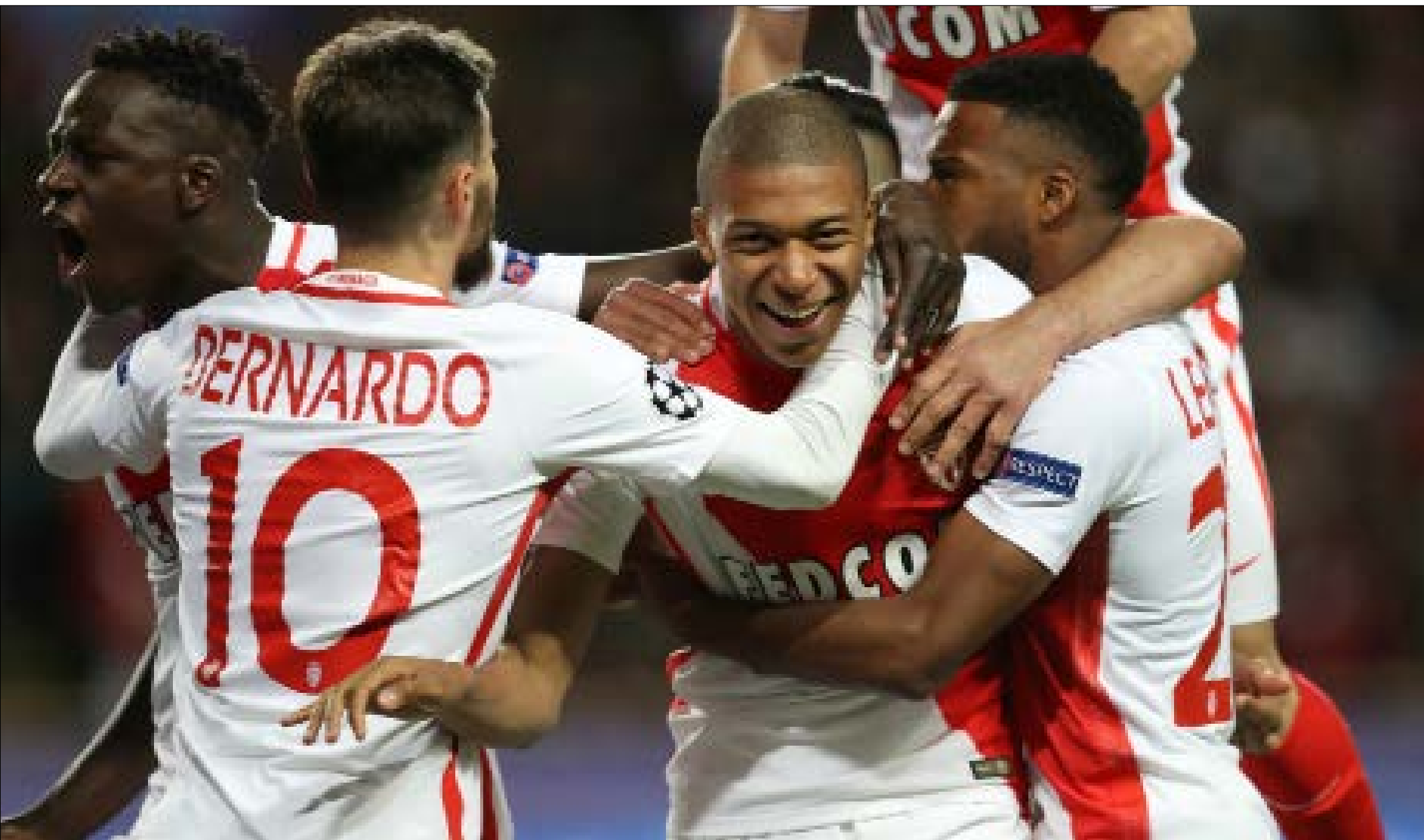
بام موناكو العديد من اللاعبين الموهبتين ومن المحتمل ان يخسر أبرزهم مبابي (اليسيف)

لا يعتبر هذا إجراءً طارئاً تتخذه الإدارة من أجل تعويض رحيل