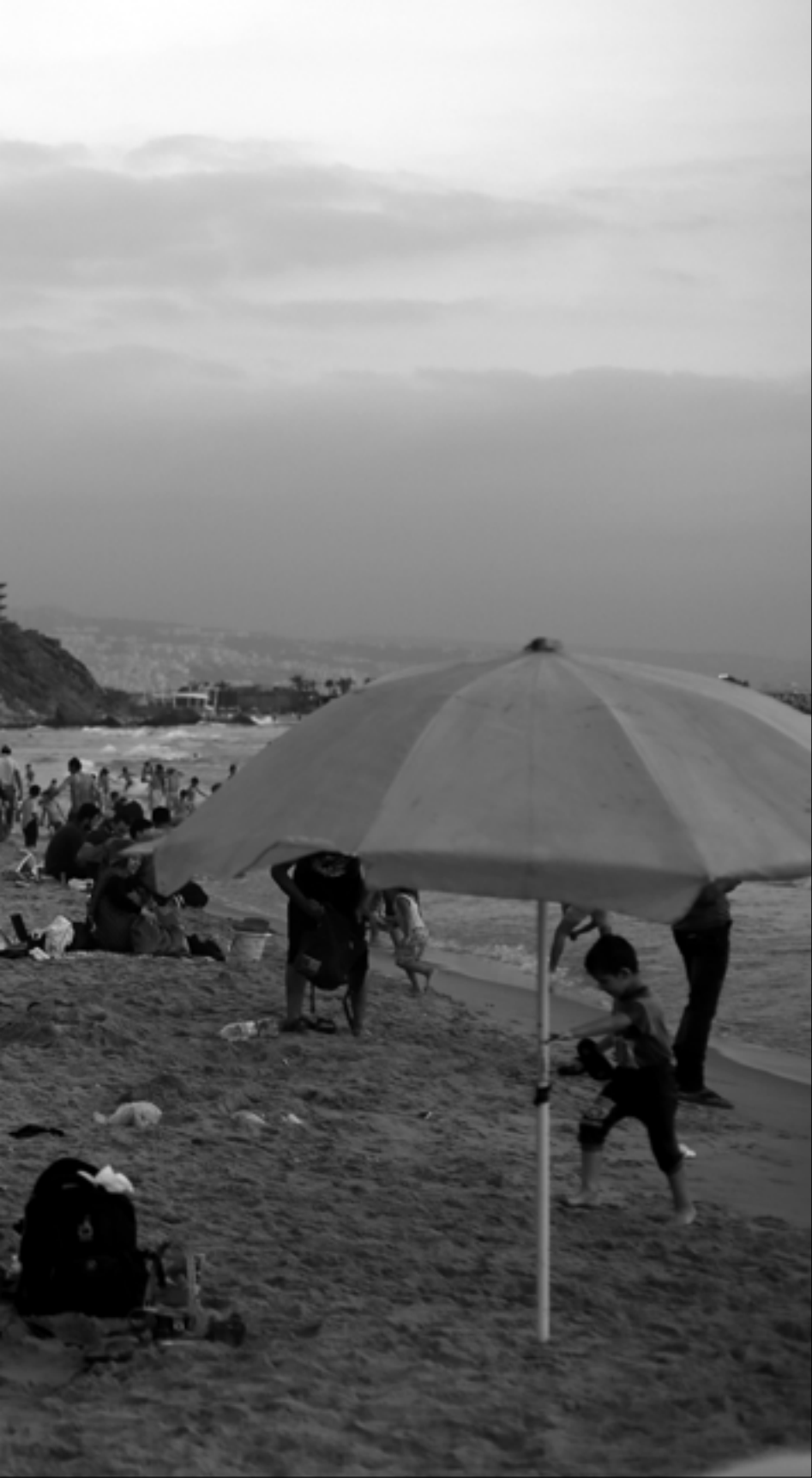
لم يُعرف ما إذا كان دفع الغرامات سيكون مرة واحدة أو سنوياً (مروان طحطم)

أما الشق الثاني، فهو يتعلّق بتحديد نسب المضاعفة التي لم تتجاوز الـ 4% كحد أقصى. تُظهر الجداول أن نسب المضاعفة على الشطوط تراوحت بين 1% و3,5% فقط، فيما يقول المحامي خَطّار إن النسبة القانونية الأدنى للإيجار وفقاً للعرف المعتمد لدى الدولة هي 6%. يُعطي خَطّار مثلاً عن كيفية احتساب غرامات المخالفين، وفق المنصوص عليه، في منطقة الجناح. يقول إن اعتماد نسبة المضاعفة الـ 1% لنحو 2000 متر من الأملاك العمومية البحرية كفيل بأن يجعل البديل السنوي للإشغال لا يتجاوز 18 مليون ليرة سنوياً، أمّا إذا اعتمدت نسبة الـ 6% فإن البديل سيتجاوز الـ 100 مليون