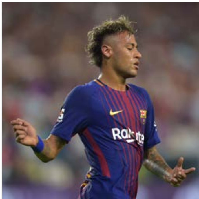
اعلن «يويفا»، انه سينتدح في الجدك الدائر حول رحيل نيمار (أف ب)

اللقب المحلي قبل موسمين، تُوجّ به في الموسم الأخير. كذلك وصل إلى نصف نهائي دوري أبطال أوروبا، ليخسر أمام يوفنتوس الإيطالي. خطته عكس الفرق الأخرى نجحت، وكان من المتوقع أن يبقى الفريق متأبراً على خطاه بصفقات قوية. لكن ما يجري الآن يُعدّ داخل أروقة النادي، وخارجه المعلن إلى الملا، خطوة إلى الخلف، وتراجع للهروب من إكمال المنافسة، أقله أوروبا. كانت الأسلحة المادية، التي زادت من حدة المنافسة والإثارة في «ليغ 1»، فعالة، وجذبت عدداً من اللاعبين إلى الدوري الفرنسي. اليوم لا يتصرف موناكو على هذا الأساس، رغم أن الدوري المحلي ما زال يجذب عدداً من النجوم، على رأسهم نجم برشلونة البرازيلي نيمار الذي يشغل قدمه المحتمل إلى سان جيرمان الجميع. طبعاً لن يعود موناكو إلى فترته السيئة جداً قبل بضعة أعوام حين سقط إلى مصاف أندية دوري الدرجة الثانية في فرنسا، لكنه سيأخذ وقته من جديد للاستمرار في الصراع على المراكز الأولى.