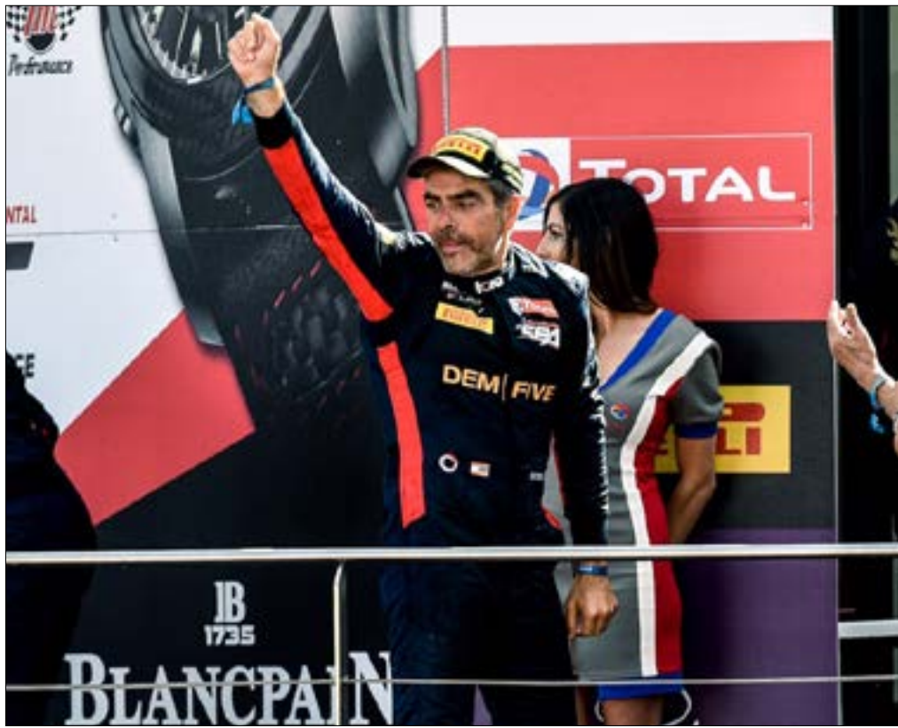
ديميرجيان يحتفل على منصة التتويج

سيوزر رئيس الاتحاد الروسي لألعاب القوى ديميتري شلياختين لندن في وقت لاحق من الأسبوع الحالي ليتحدث إلى مسؤولي الاتحاد الدولي للعبة، في محاولة لإنهاء الإيقاف الدولي المفروض على بلاده. وسيحدث المسؤول الروسي أمام الجمعية العمومية للاتحاد الدولي لألعاب القوى في لندن الخميس المقبل قبل يوم واحد من انطلاق بطولة العالم. ولا يزال الاتحاد الروسي لألعاب القوى موقوفاً بسبب تقرير للوكالة العالمية لمكافحة المنشطات صدر عام 2015 زعم وجود برنامج منشطات ترعاه الدولة في مجال الرياضة، وهو ما نفاه الكرملين. وقال فيتالي موتكو نائب رئيس الوزراء الروسي في الأسبوع الماضي إنه لا يتوقع رفع الإيقاف عن اتحاد بلاده خلال الجمعية العمومية في لندن رغم الموافقة على مشاركة 19 رياضياً روسياً في بطولة العالم كمستقلين.