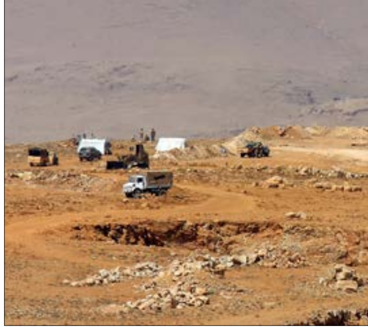
بلا تنسيق مع سوريا لم يكن في الامكان تطبيق اتفاق وقف حرب الجرد

سياسياً، أبلغ رئيس الجمهورية العماد ميشال عون زواره، يوم أمس، أنه سيجري مع رئيس الحكومة والوزراء في الجلسة التي يعقدها مجلس الوزراء يوم غد «تقييماً للواقع الذي استجد بعد إقرار مجلس النواب سلسلة الرتب والرواتب والأحكام الضريبية الجديدة، وذلك في ضوء ردود الفعل المتفاوتة التي برزت على مختلف الصعد». وأشار الى أن «ثمة ملاحظات طرحت في أكثر من قطاع لا بد من درستها بروية ومسؤولية وبعيداً عن المزاييدات السياسية والإعلامية». مجدداً التأكيد أن «إقرار الموازنة خطوة ضرورية، على مجلس النواب إنجازها في أسرع وقت بهدف انتظام الوضع المالي وتحديد واردات الدولة وما يترتب عليها من نفقات». فيما علق رئيس الحكومة سعد الحريري عقب زيارته الرئيس عون رداً على سؤال حول موقفه من البدائل من بعض الضرائب لتمويل السلسلة التي قدمها حزب الكتائب الى الرئيس، بالقول: «لا مشكلة لدي إزاء من يملك بدائل فعلية وليست وهمية لتمويل السلسلة، أما القول عن وجود فساد وهدر بالمليارات فهو يدخل في إطار الكلام فقط (...) إن سلسلة الرتب والرواتب بكل إصلاحاتها وضرائبها نوقشت منذ ثلاث سنوات، وكل الأفرقاء السياسيين وافقوا عليها، بمن فيهم حزب الكتائب، وعلينا بالتالي أخذ الموضوع بالاعتبار». ورأى الحريري أن «الاعتراض أمر جيد، ولكن ما أتمناه أن تكون المعارضة بناءة لمصلحة البلد. وما يهمني هو عدم الاستدانة وتراكم ديون لأموال لا يمكن الاستثمار فيها لمصلحة لبنان». أما بشأن الغطاء الرسمي للقتال ضد «داعش»، فقال الحريري إن «الجيش يحظى دائماً بتغطية شاملة لكل عملياته العسكرية، وهذا الأمر أساسي (...) وعندما تحين الساعة الصفر، سيكون الجيش منتصراً، فالحكومة وكل القوى السياسية تقف الى جانبه».