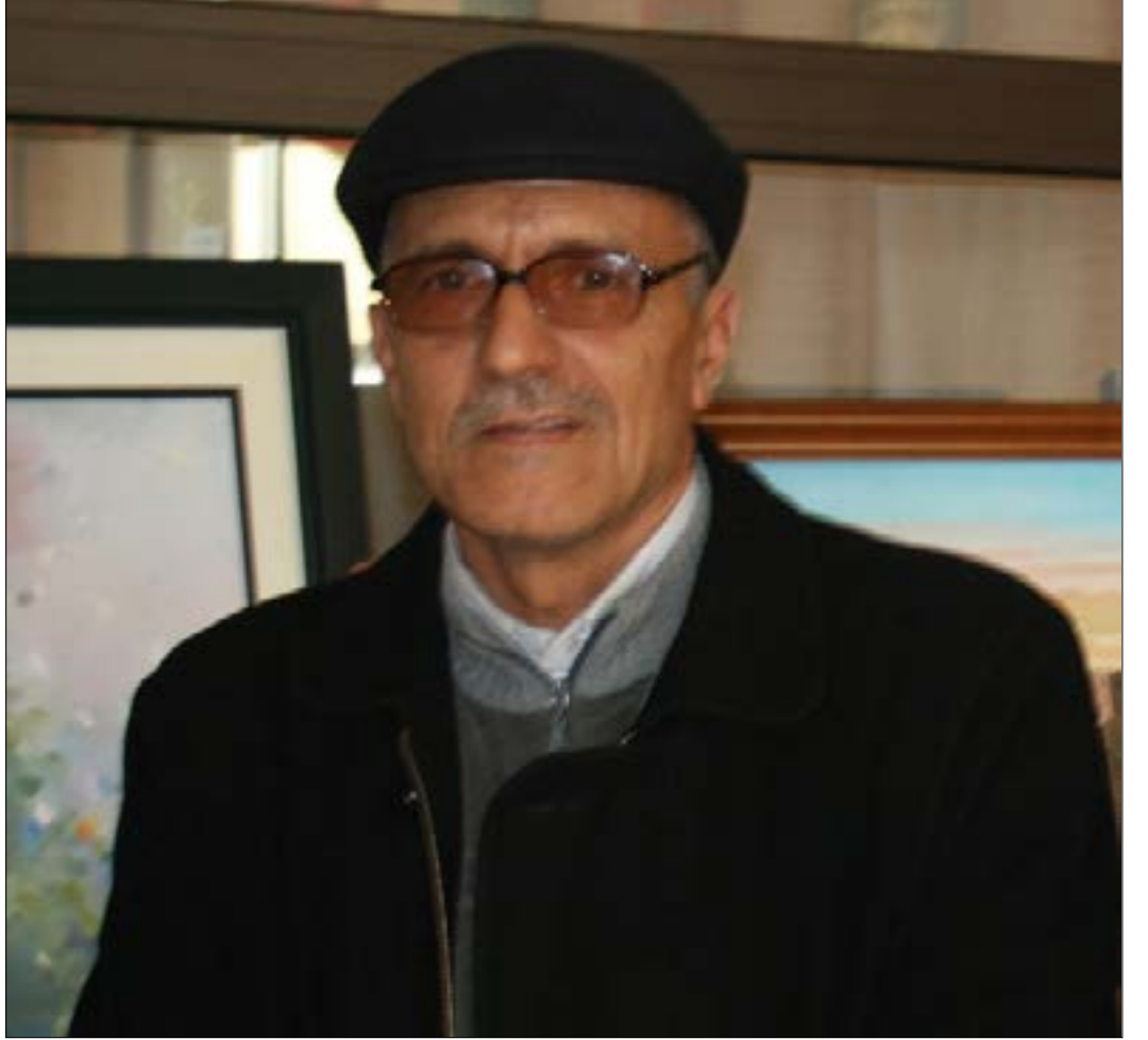
ماجس الأسلوب وشكل الكتابة شغلاه لفترة طويلة

غياب منذ وصوله إلى أرض الكتابة، أمت بمقولة كافكا: «كلّ ما ليس أدباً يقلق راحتي». وهكذا عاش حياته، بعيداً عن صخب الحياة الثقافية، وقريباً إلى أقصى حدّ ممكن من نفسه ومن نصّه!