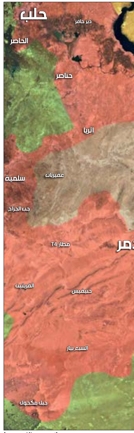
(تصميم ستان عيسى)

لـ«قوات التحالف الدولي»، حيث لعب انخفاض فرص الانسحاب نحو دير الزور دوراً أساسياً في استماتة مسلحي «داعش» داخل الرقة. وتتوافق مسارات العمليات العسكرية حتى الآن مع ما أوردته «الأخبار» في منتصف حزيران الماضي، ويبرز الجيش وحلفاؤه حرصاً على حساب الخطوات وتنويع وسائل التقدم وفقاً لما تفرضه معطيات كل محور على حدة، من دون إغفال انعكاساته على بقية المحاور. وتأسيساً على ذلك، يمكن فهم قيام الجيش باقتحام بعض المناطق، وتفضيله الالتفاف على مناطق أخرى وفرض أطواق تعزل مسلحي التنظيم المتطرف عن احتمالات التأثير في المعارك التالية. ومن المنتظر أن يتحوّل جبل بشري الاستراتيجي إلى واحد من أوضح الأمثلة على عمليات الالتفاف والعزل، بعد أن تقدمت القوات السورية أخيراً إلى تخومه، مع ما يعنيه هذا من انعكاسات متوخّاة على مسار معارك السخنة، كما على التقدم في ريف دير الزور الغربي. في الوقت نفسه، تبرز معطيات متداخلة في ريف دير الزور الجنوبي الشرقي، وعلى وجه الخصوص ما يتعلق بمدينة البوكمال الحدودية التي تحوّلت في الشهور الماضية إلى واحدة من الملاذات الأخيرة لتنظيم «داعش» في الشرق السوري (تنافسها في ذلك مدينة الميادين، الواقعة أيضاً في ريف دير الزور الجنوبي الشرقي). وعلى رأس المعطيات المذكورة يأتي حرص الأميركي على الحضور حتى الآن في أجواء البوكمال، كما في أجواء الميادين. وفي خلال الأيام الأخيرة، كثفت طائرات «التحالف الدولي» استهداف البوكمال، في مؤشر واضح على أن اللاعب الأميركي لم يُسلم حتى الآن بأن المنطقة باتت منطقة عمليات جوية روسية. ومن شأن هذا التفصيل أن يعرقل