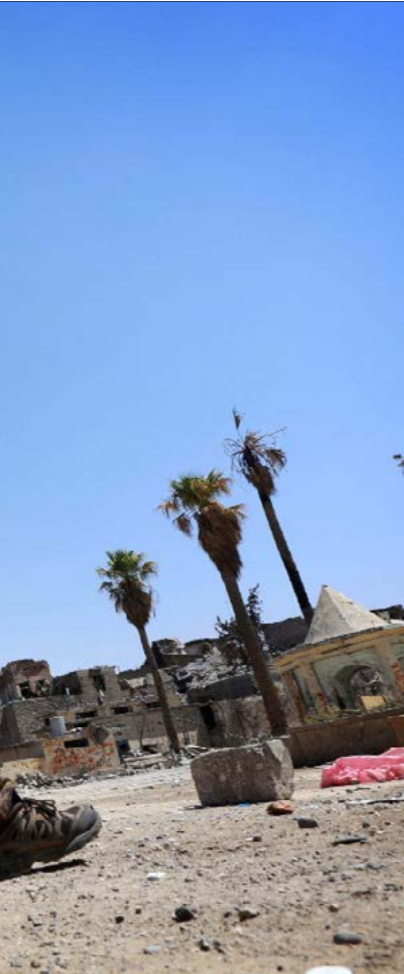
ستظهر محاولات سعودية لاستقطاب الوجوه السامية إلى التخليص من طابعها الإسلامي وتشجيع مناوغيها

خلال تواصلنا مع دبلوماسي فلسطيني عمل في السفارة الفلسطينية سابقاً لدى الرياض، قال إن «هناك معلومة لا يمكن تجاوزها في الدبلوماسية الفلسطينية المعمول بها منذ زمن: يُمنع انتقاد السعودية مهما كانت الأسباب». وأضاف: «الذي انتقل إلى أوروبا بعد التقاعد، أن طلبات تجديد أوراق السفر والجوازات والوثائق المصرية والأردنية (للاجئين الفلسطينيين) ازدادت قبل رحيلي،