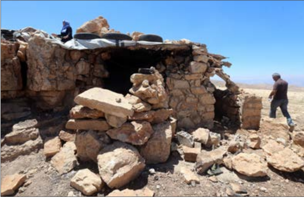
يقدر الجيش عدد مسلحي «داعش» بـ 700 يتركزون في أكثر من 32 موقعا (هيلم الموسوي)

فيما يستعد الجيش اللبناني لخوض معركة تحرير جرد القام ورأس بعلبك من إرهابيي «داعش» خلال الأيام المقبلة، بدأت انعكاسات معركة الجرد التي خاضتها المقاومة وأدت إلى استسلام «النصرة» توتّي ثمارها، مع انتهاء المرحلة الأولى من التسوية وتبادل الجثامين، أمس، واكتمال التحضيرات اللوجستية للمرحلة الثانية اليوم