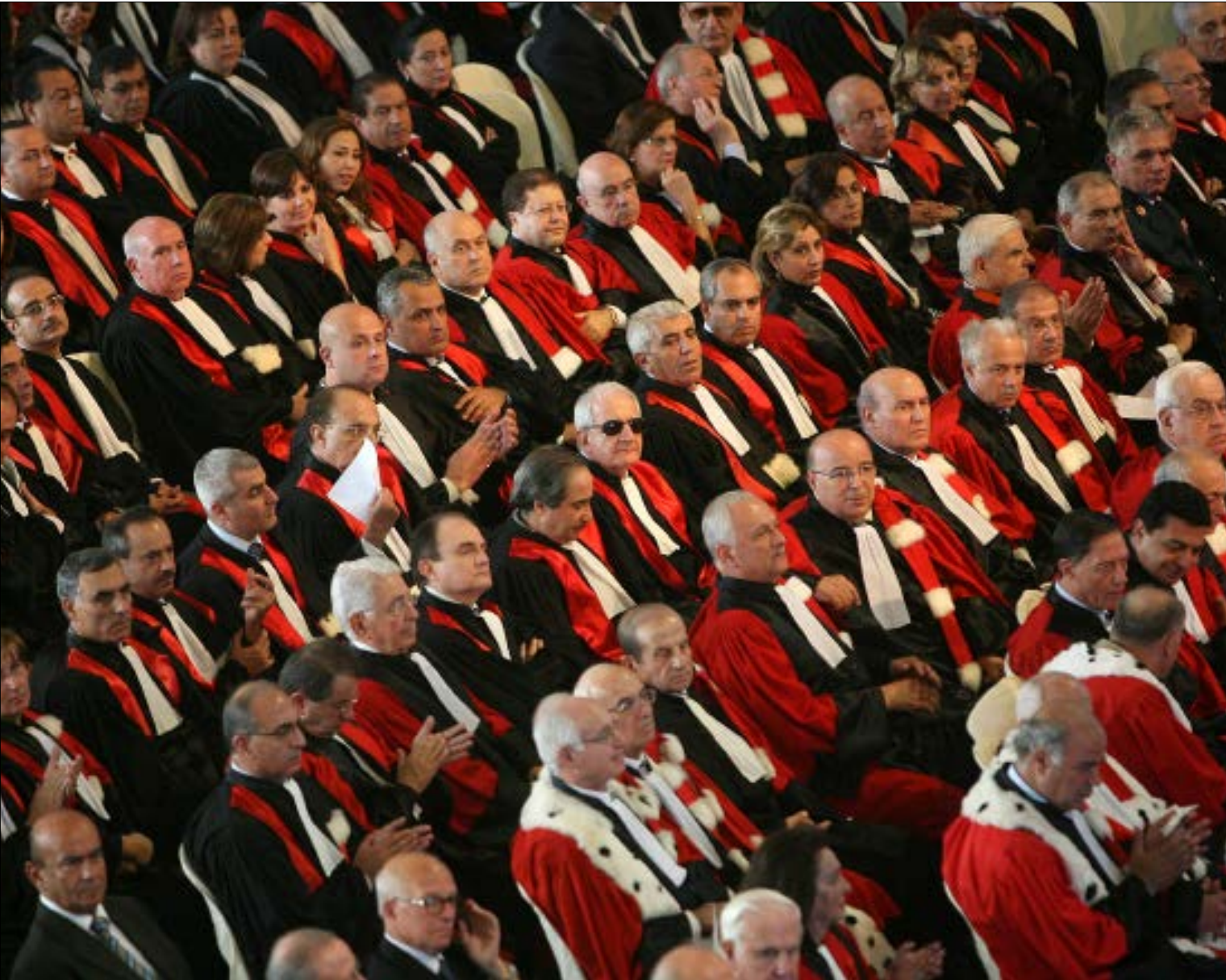
بزى طلب إلى وفد المجلس الحصول على ضوء أخضر من الحكومة للسبر بتعديل القانون