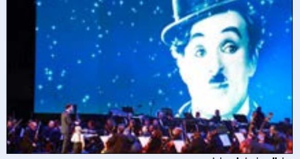
من العرض اول من امس