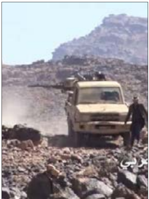
سيكون لسقوط معسكر الجابري تداعيات على سير المعارك لمصلحة صماء

ليس النهج الأفضل، واستفاد منه (القاعدة) بالحد الأقصى». وأضاف أن سيطرة (القاعدة) على إدلب «سوف تناقش مع الجانب التركي. وكما فعلنا في بعض المناطق وتمكّننا من إغلاق الحدود، نحتاج إلى شيء مشابه في إدلب». إلى ذلك، اعترضت وزارة الخارجية التركية في بيان للمتحدث باسمها، حسين مفتي أوغلو، على تصريح مأكغورك، مجددة تأكيدها أن الدعم الأميركي لمنظمة «إرهابية» مثل «حزب الاتحاد الديمقراطي» لا يمكن تبريره بأي سبب. ولفت البيان إلى أن السفارة التركية في واشنطن ستوصل الاعتراض بشكل رسمي إلى السلطات الأميركية هناك. (الأخبار)