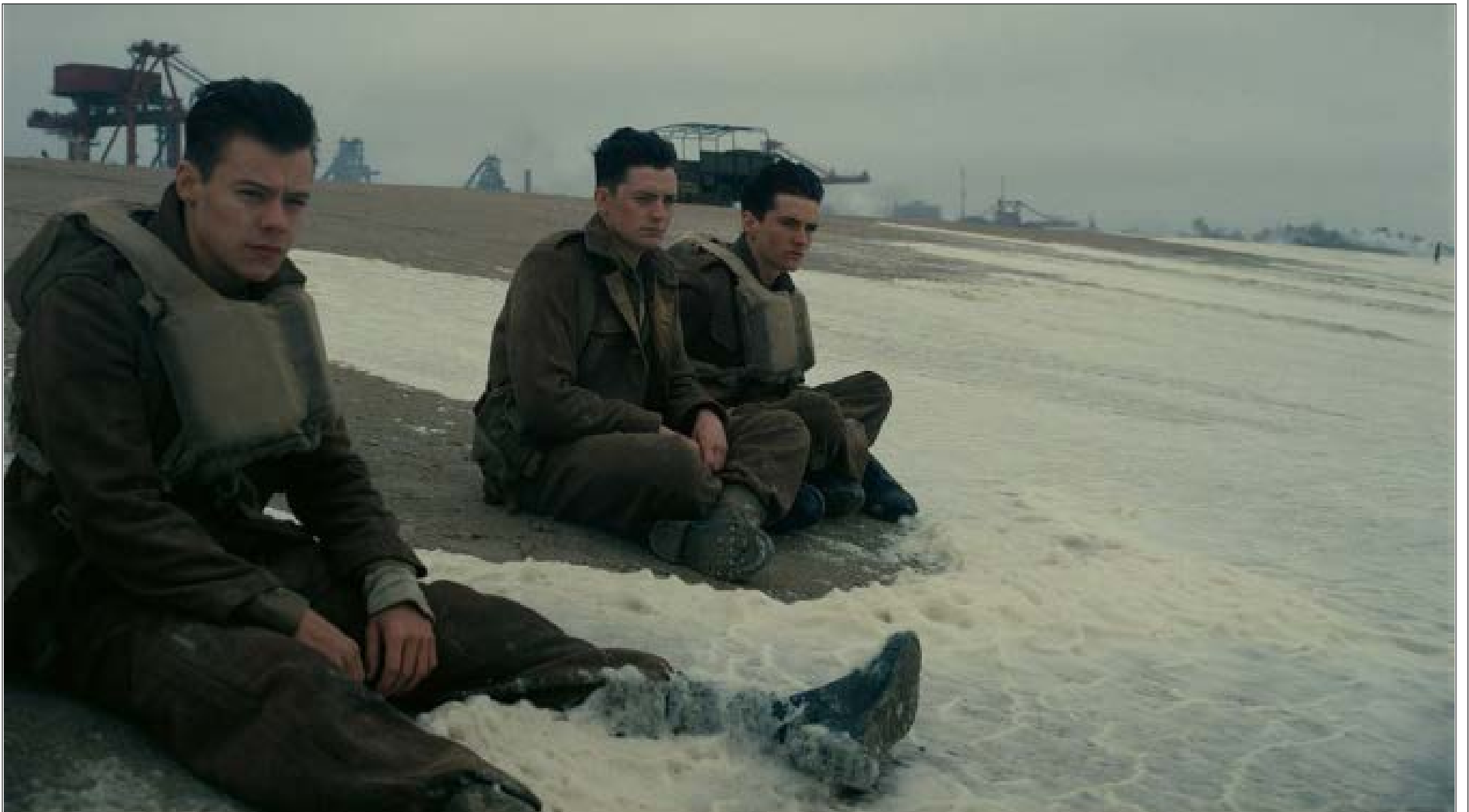
الفيلم دون شك حليف موضوعي ثمين في جعبة الانفصاليين الإنكليز

Dunkirk: صالات «أمبير»، «غراند سينما»، «فوكس»، «بلانيت» lb.cineklik.com/movie/Dunkirk