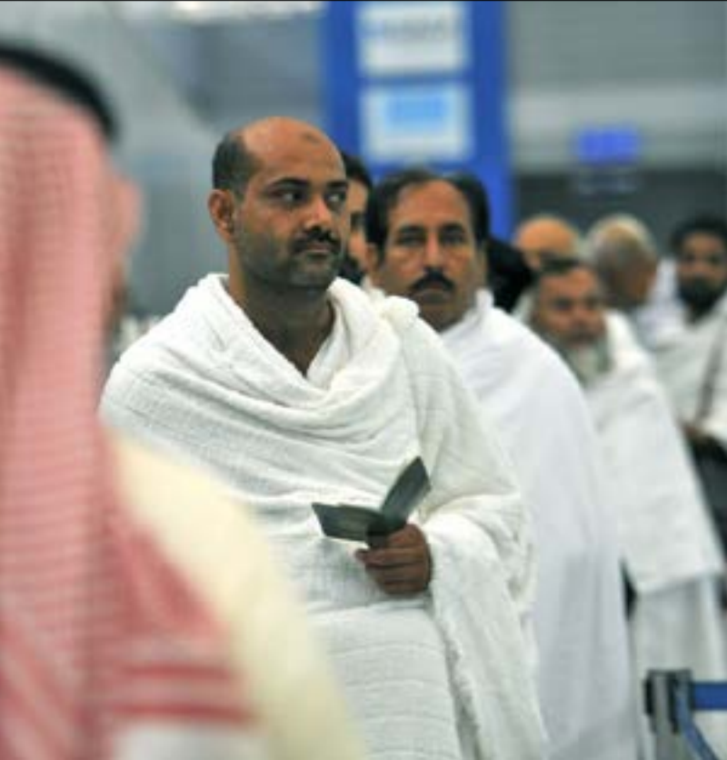
وزارة الأوقاف القطرية: وزارة الحج السعودية امتنعت عن التواصل لتأمين سلامة الحجاج

الرياض تحتفظ بـ«حق الرد»! تصريح الجبير الناري أتى رداً على بيان لـ«اللجنة الوطنية لحقوق الإنسان» التابعة للحكومة القطرية، قال إن اللجنة بصدد تقديم شكوى إلى منظمة «اليونسكو» إلى جانب «خطوات واسعة في إطار تدويل منع مواطني ومقومي دولة قطر من أداء مناسك الحج في كافة المحافل الدولية المختصة». وأشار البيان إلى أن اللجنة خاطبت المقرر الخاص للأمم المتحدة المعني بحرية الدين والعقيدة، مبدية قلقها الشديد إزاء «تسييس الشعائر الدينية واستخدامها لتحقيق مكاسب سياسية».