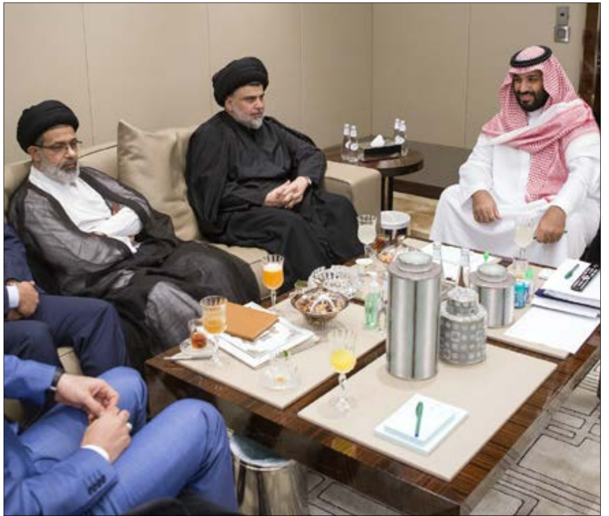
حَل الصدر ضيفاً على وليّ العهد السعودي محمد بن سلمان

ومن المرجح أن يناقش الصدر مع المسؤولين السعوديين القانون الانتخابي، بعدما أبرم تحالفاً مع إيباد علاوي - المقرب من الرياض - للانتخابية الصغرى؛ وهو ما يريده الرجلان لتحقيق أكبر عدد من المقاعد، عدا عن أن الصدر بدأ بالبحث جدياً عن مصدر لتمويل مشروعه، وهو أمر سيلقى صداه في المملكة التي لن تحبس جهداً عن «رجل شيعي» يحظى بحضور قوي في الشارع العراقي، هدفه كسر «الشوكة» الإيرانية، «أبن النجف» يتلاقى بقوة مع المشروع السعودي: إيران بلا عراق... وبلا «حشد شعبي».