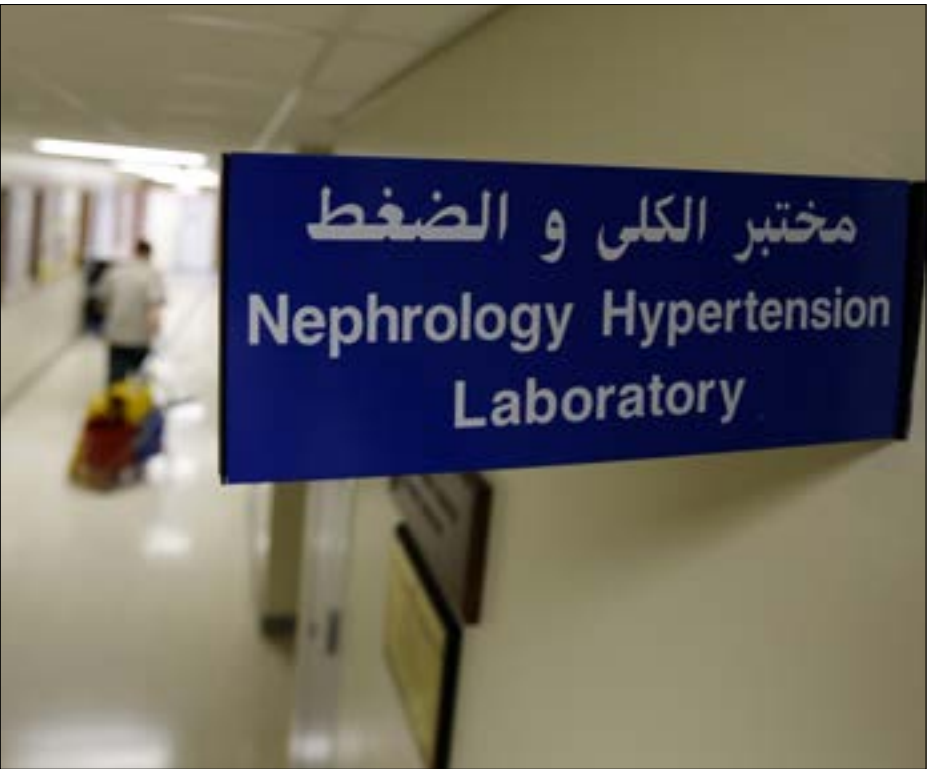
أفرضت الحكومات اللبنانية في ترخيص المستشفيات في مناطق يوجد فيها فائض

وفي تدني كفاءات الأطباء الجدد المتقدمين لفحص الكولوكيوم. ذلك أن كثيرين من المتقدمين تخرجوا من معاهد في أوروبا الشرقية هي دون المستوى المطلوب، وهم لا يتقنون اللغات الفرنسية والإنكليزية والألمانية، ما يجعل تطبيق البروتوكولات المعنية بجودة العناية الصحية أمراً صعباً. سألت زميلي على مقاعد الدراسة، نقيب الأطباء السابق في بيروت، عن جدوى انتشار المستشفيات الصغيرة في بيروت، فقال: «لا جدوى منها. وأغلب الرخص الممنوحة أعطيت بسبب ضغوط سياسية ووطنية، ولغرض تجاري. هذه الضغوط السياسية والوطنية نراها أيضاً قد أدت إلى الترخيص لأطباء لا يملكون الكفاءات العلمية اللازمة لممارسة العمل الطبي. فهناك إفراط في منح الإجازات الطبية: فمن طبيب واحد لكل 1000 مواطن لبناني عام