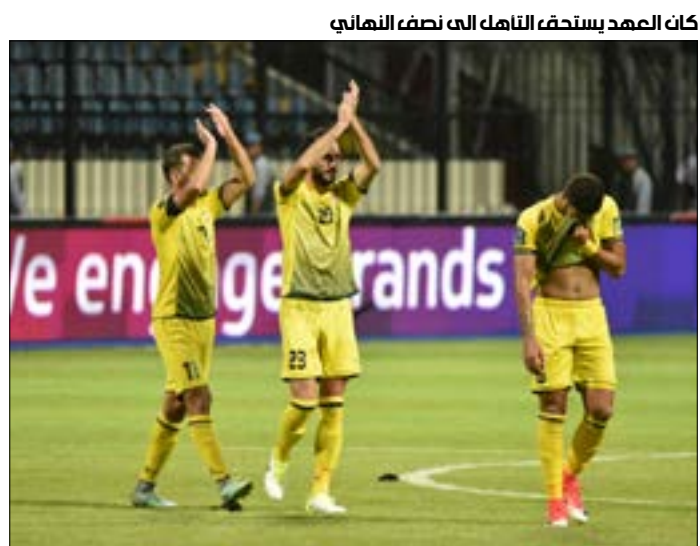
كان العهد يستحق التأهل إلى نصف النهائي