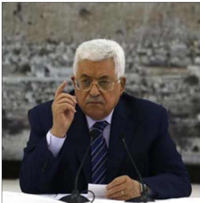
أية تهديد للسلطة الفلسطينية يشكّل تهديداً لإسرائيل

تقر القناة بأن أبو مازن رئيس بلا شعبية جماهيرية في الضفة الغربية، وهو يحكم فيها بقوة الأجهزة الأمنية وبغطاء أمني إسرائيلي، وعلى هذه الخلفية، تشير القناة بصورة غير مباشرة، إلى أن الوريث سينجح فقط إذا حظي بهذين العاملين الرئيسيين... وبمعنى إعادة إنتاج أبو مازن آخر، في مرحلة ما بعد عباس، هو السيناريو شبه الوحيد، الملائم للمصالح الإسرائيلية.