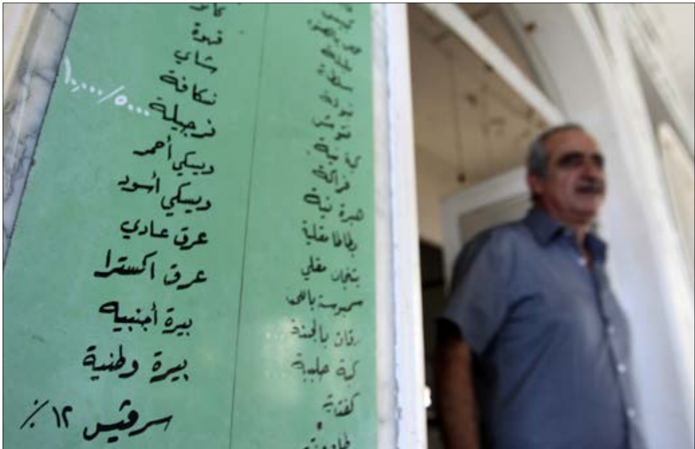
لائحة الطعام في «بلاج ومطعم خيزران الكبير»