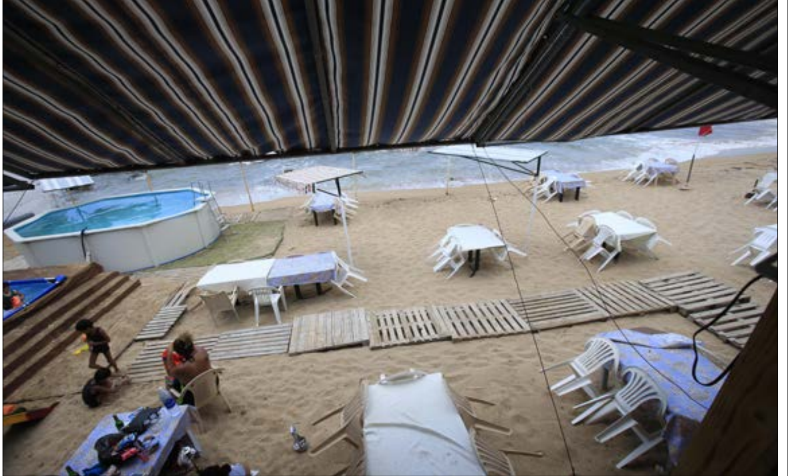
اوتوستراد الجنوب قصى في خيزران على ما لم تقض عليه الحروب

وفي لأثحة عوامل الجذب لقصص خيزران، صيد العصفير في بساتين أنصارية والسكسية. الصيادون «البيارتة» كانوا يصطحبون عائلاتهم ليمضوا نهارهم على الشاطئ، وكانت للسياح العرب حصة أيضاً، إذ كانوا يقصدون شاطئ خيزران من أماكن اصطيفهم في بحدون وعاليه. ما قبل نكبة فلسطين عام 1948 وما بعدها من