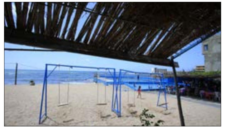
ما انتهى إليه «بقوّة خيزران»

مع الإجتياح الإسرائيلي عام 1982، تعرض المطعم للتخريب وسرقت محتوياته، وأهمها «البوم» صور يوثق أبرز الولايم والشخصيات التي زارته.