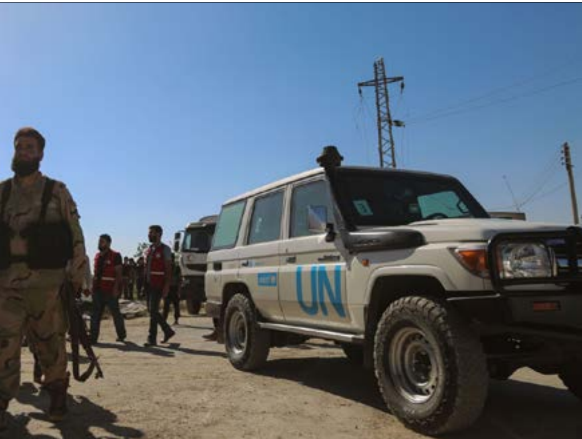
مسلحون بجانب قافلة مساعدات أممية دخلت أمس إلى بلدة النشابية في الغوطة الشرقية (أف ب)

شهدت عمليات الجيش وحلفائه ضد تنظيم «داعش»، خلال اليومين الماضيين، زخماً عسكرياً كبيراً، من محيط بلدة السخنة حتى الوادي الجنوبي لنهر الفرات، مروراً بمناطق سيطرة التنظيم في ريف حماة وحمص الشرقي، في محيط بلدة عقربيات، التحرك على محور السخنة وضع القوات على أطراف البلدة