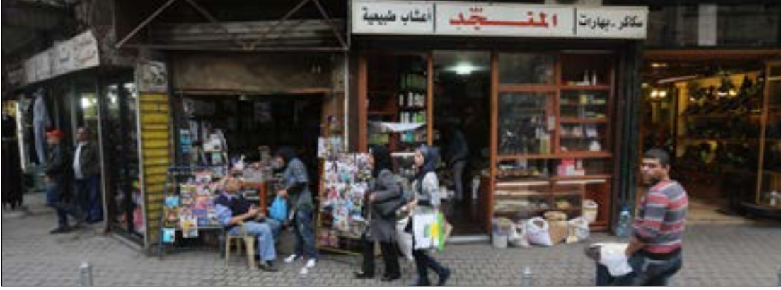
تراجع التأييد لجهود النازحين السوريين على خلفية الازمات الاقتصادية والاجتماعية المرتبطة بوجودهم