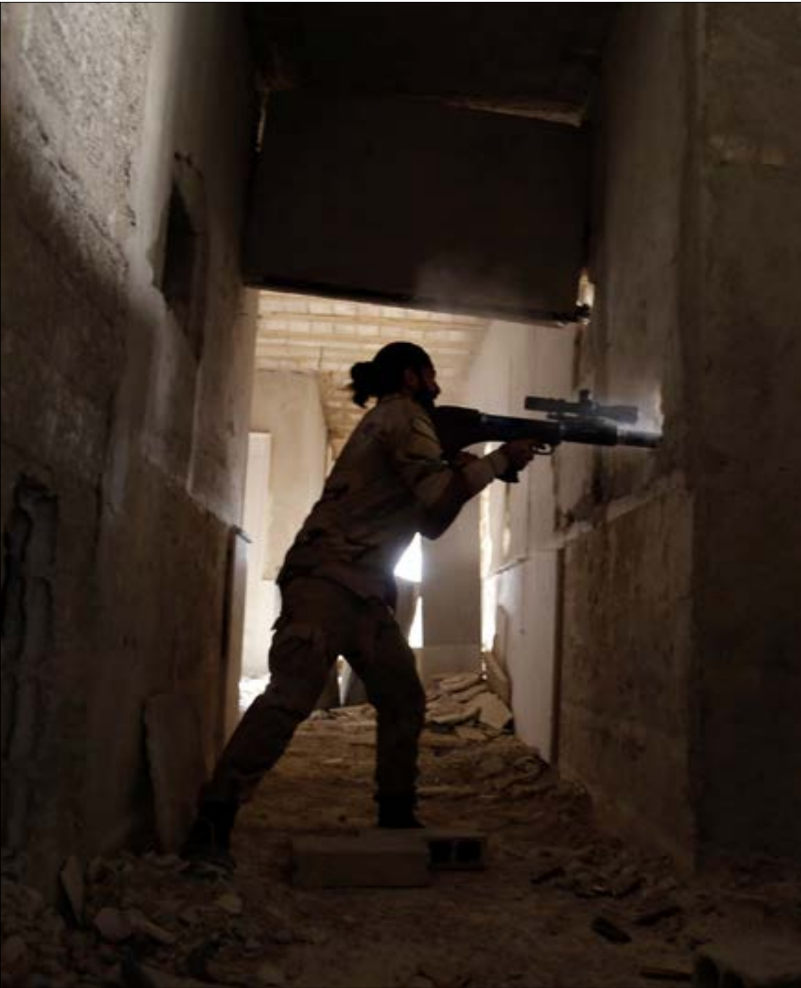
تواصل «النصرة» استقطاب مزيد من العناصر والتشكيلات إلى معسكر «التطرف القاعدي»

عاد الرئيس التركي إلى بلاده مساء أمس. بعدما أوصل رسالته إلى السعودية. تؤكد حضور أنقرة (العسكري) في الخليج. وهم مغادرتهم. تنفتح الازمة على فصل جديد يبدو. هذه المرة. أنه سيكون لروسيا دور فيه