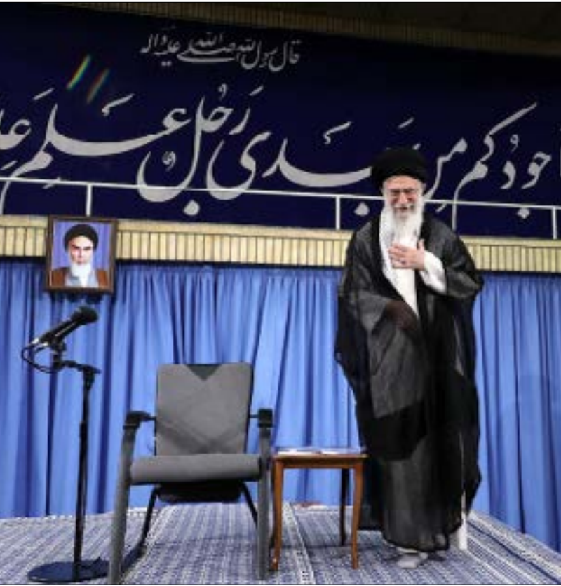
تُعكس إشارة روحاني إلى موقع «القائد» رؤيته السياسية

روحاني: الحكومة المقبلة تدعم خدمات الحرس التي يقدمها للبلاد