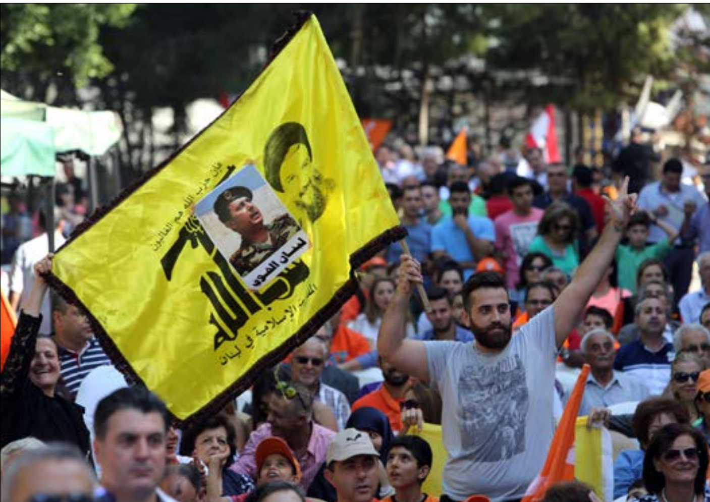
لا تعتقد المصادر المونبة أنّ دعم المقاومة في ممركتها سيؤثر على علاقات التيار السياسية (مروان طحطح)

قُرعت الطبول إيذاناً ببدء معركة تحرير جرود عرسال. فلم يتأخر التيار الوطني الحر عن تقديم الدعم بشراسة لرجال المقاومة، والجيش اللبناني الذي يحمي بلدة عرسال، بالنسبة إلى الضيادين والمناصرين ليس في الأمر استغراب، فلا غبار في الموقف الاستراتيجي