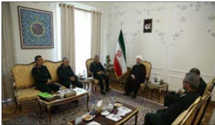
قدّم الوفد تهنئه لروحاني لانتخابه لولاية رئاسية ثانية

وفي السياق نفسه، أكد الرئيس الإيراني «دعم الحكومة المقبلة الكامل لخدمات حرس الثورة الإسلامية التي يقدمها للبلاد»، فيما أعلن القائد العام لـ«الحرس» الاستعداد «للتعاون الشامل مع الحكومة وبغية تحقيق أهداف الثورة الإسلامية»، وذلك تزامناً مع استعراض قادة «الحرس» لتقرير عن «الأنشطة وعن الجاهزية التي تتحلّى بها (قواتهم) في مختلف المجالات... (معربين أيضاً) عن الشكر لدعم الحكومة لتعزيز البنية الدفاعية للبلاد ومحاربة الإرهاب». وتزامن اللقاء مع إصدار «الحرس» لبيان ندد فيه «بانتهاكات الكيان الصهيوني الأخيرة وهجومه على المسجد الأقصى»، مؤكداً أنّ «ظهور الانتفاضة الجديدة ونهوض جيل