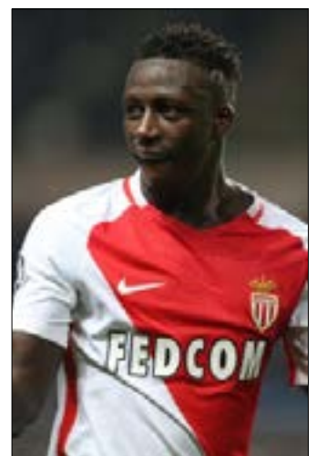
فُذرت صفقة انتقال مندي بنحو 58 مليون يورو (أرشيف)

واصل مانشستر سيتي الإنكليزي تعزيز صفوفه وخط دفاعه على وجه التحديد بإعلانه التعاقد مع مدافع موناكو الفرنسي الدولي بنجامان مندي لمدة 5 أعوام، في صفقة تقدر قيمتها بحوالي 58 مليون يورو. وقال مندي البالغ من العمر 23 عاماً: «أنا سعيد للغاية بانضمامي إلى صفوف مانشستر سيتي»، مضيفاً: «إنه أحد أفضل الأندية الرائدة في أوروبا ولديه في شخص بيب غوارديولا مدرباً ينتهج أسلوب اللعب الهجومي». وعزز غوارديولا خط دفاعه بالتعاقد مع المدافع الأيمن لتوتنهام اللندني كابل ووكر في صفقة تصل قيمتها إلى 54 مليون جنيه إسترليني. وبات مندي ثاني لاعب يتعاقد معه