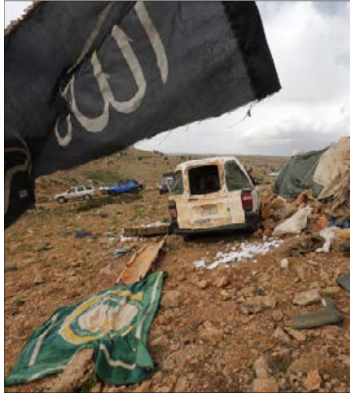
حرب الجرد انتهت معادلة بندقية في مواجهة بندقية (هيثم الموسوي)

والأحجار، لكنها تقع في خانة الاقتصاد والمجتمع، وليست كتلة سياسية مؤقتة. في معرض تشرجه للكتلة التاريخية يرى غرامشي أن التحالف السياسي هو تحالف ظرفي يوجبه صراع ظرفي، على عكس التحالفات الأخرى التي تقوم على أساس اقتصادي واجتماعي. لقد تحالف الجنوبيون والعرساليون لوقت طويل. بنوا حلفاً قوياً وصلباً لا تهزّه الأحداث. بنوه بالأحجار القوية. لكن الحجر لا يستطيع أن يتحدث.