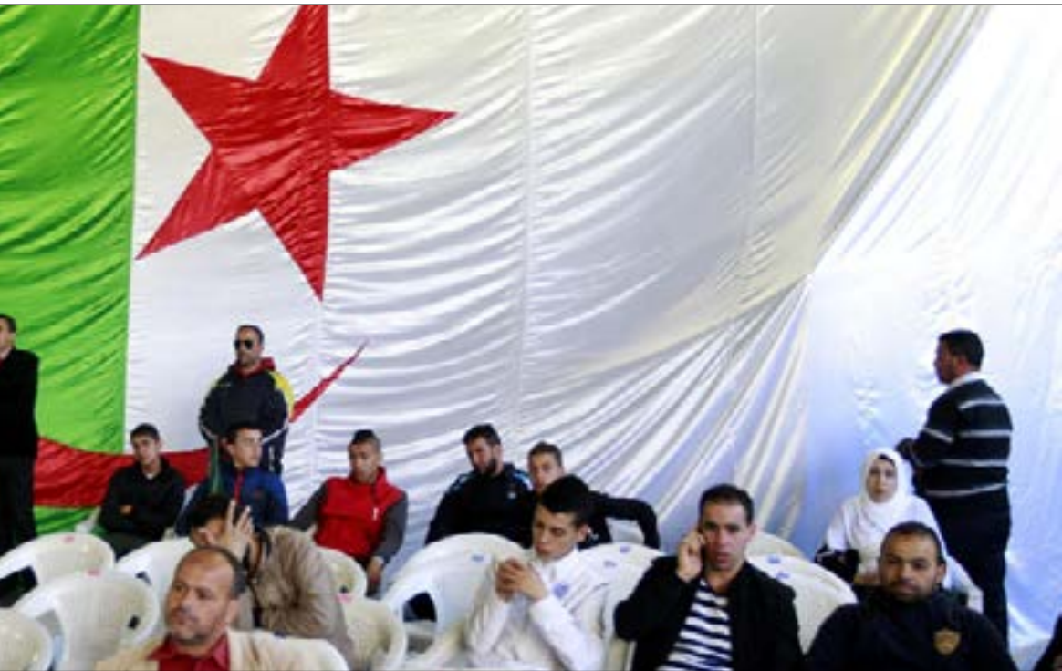
يُجد المنتخب للسان الجزائري نفسه أمام تساؤلات وشكوك كبيرة (عن الوباء)

في السنوات الأخيرة، وهم تدهور صحة الرئيس عبد العزيز بوتفليقة، كانت الصراعات تولد وتختفي في الساحة السياسية الجزائرية بين يوم وليلة، فيتغير الأشخاص في السلطة وداخلها بسبب هذه الصراعات، والتي دائماً ما يتم خوضها تحت شعارات المحافظة على الأمن والاستقرار والأموال العامة. وها هو اليوم الوزير الأول عبد المجيد تبون، يفتح سجلاً جديداً يستهدف أكثر رجال الأعمال قرباً من الرئاسة: علي حداد.