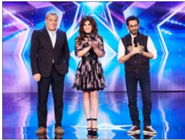
Arabs Got Talent من البرامج التي تقلص اجر لجان التحكيم والمدربين فيها

أما في مكتب دبي، فتساوى عدد الذين تم الاستغناء عن خدماتهم منذ أشهر حتى تاريخ الجمعة الماضي تزامناً مع عملية الصرف في لبنان. هكذا، صرف مكتب دبي أيضاً 25