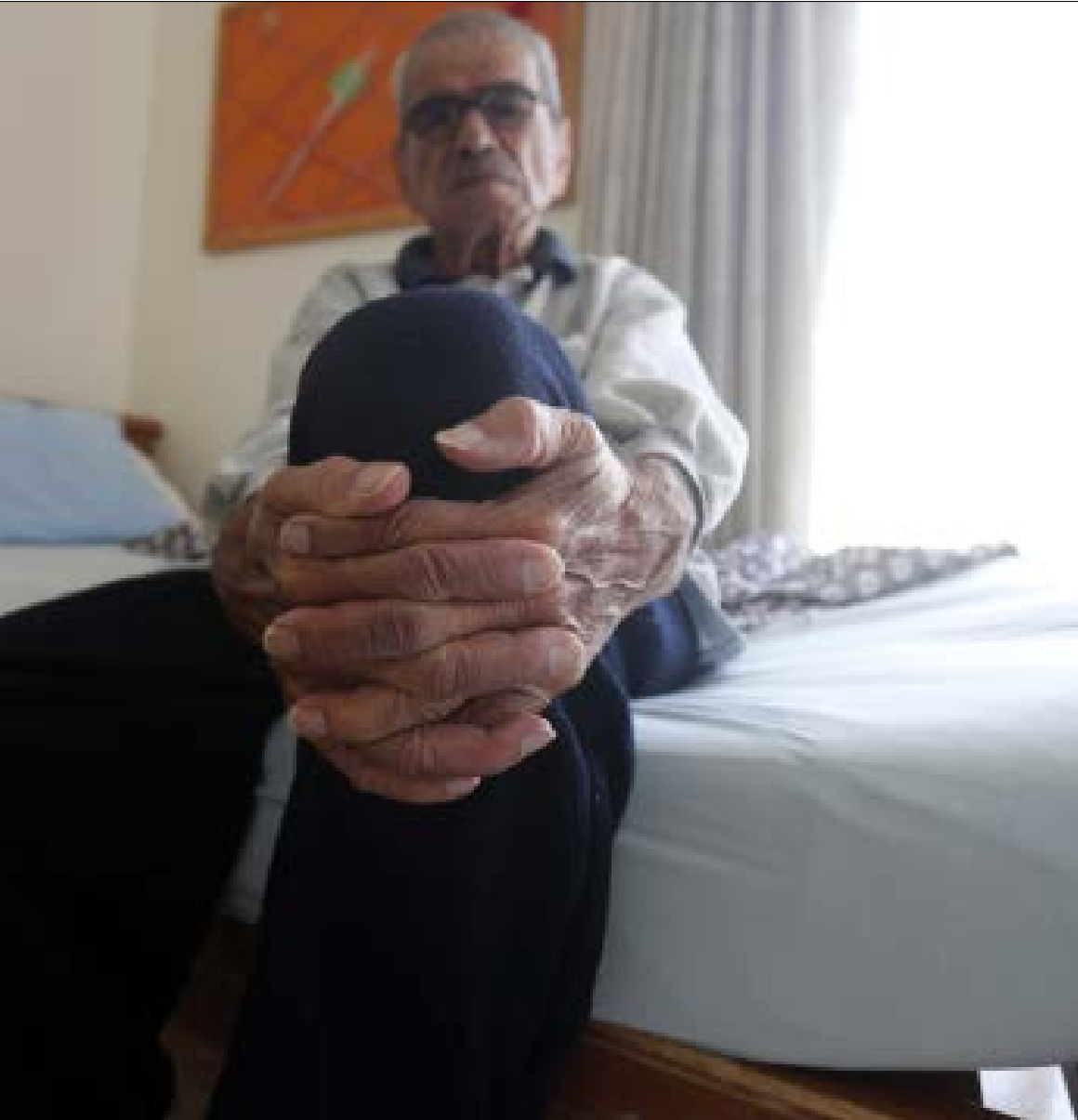
كركي: نأمل أن تقوم الدولة بواجباتها وتسدّد المبالغ المترتبة عليها (هيثم الموسوي)