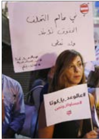
تتجج اغلب الكتل بـ«مشكلة تسويق» لترشيح النساء (مروان بوحيدر)

الهدف من مطالبة القوى السياسية بترشيح نساء ليس دعوة الذكورين إلى منح المرأة حقها، وكأنه منة منهم. كل ما في الأمر أن على المطالبين بالكوتا النسائية، تطبيق مطلبهم، داخل أحزابهم، وفي الترشيح إلى النيابة، على الأقل. وهنا الاختبار الذي سينجحون فيه، أو أنهم سينبتون مجدداً أن المطالبة بالكوتا ليست سوى شعار شعبي يرفعونه قبل الانتخابات، كما هي عاداتهم.