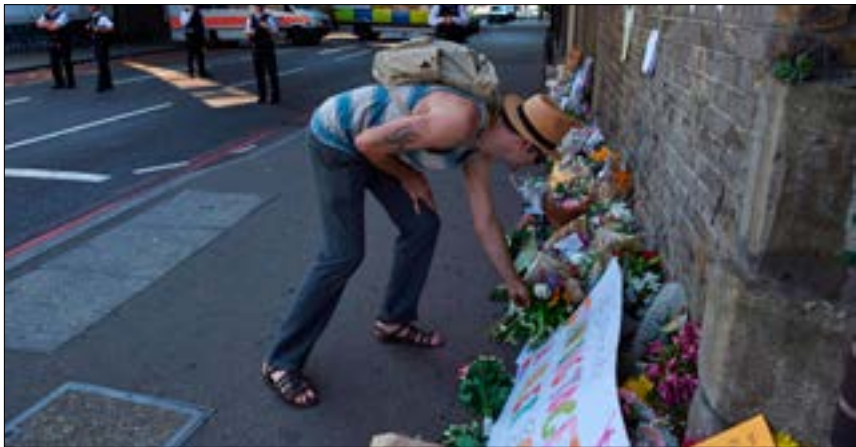
تشهد لندن هجمات تزايد من سخط الشارع على ماي (أضرب)

لذا تضيف أن «دور كوربين يأتي هنا». وتوضح المجلة الأميركية أنه «سيكون على المعارضة العمالية أن تدعم مقترحاً وفق الخطوط العريضة المذكورة أعلاه، إذ إنها البديل للخروج السلس من الاتحاد الأوروبي، الذي كانت تطالب به». أما السيناريو الذي وضعته المجلة أساساً لذلك، فهو أن «كوربين يمكنه أن يسوق هذه المعادلة لداعميه، على أنها انتصار، فيما يمكن أن تسمح ماي بحدوثها، بناءً على الحاجة للوحدة الوطنية».