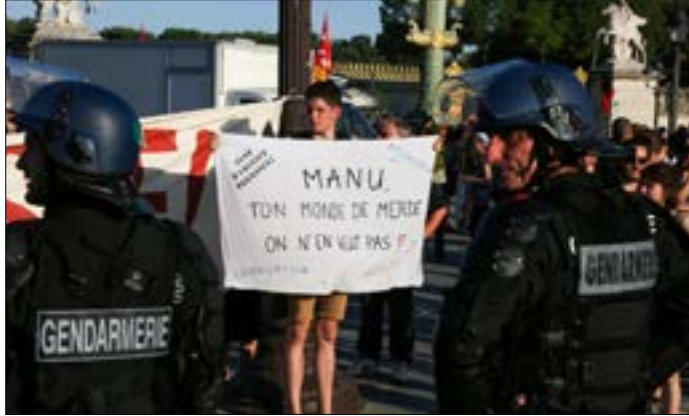
معارض لماكرون يرفع لافتة ترفض سياساته

في القارة الأوروبية، إذ سارعت المستشار الألمانية أنجيلا ميركل، التي ستخوض قريباً بدورها استحقاقاً انتخابياً، إلى تهنئة ماكرون على «الغالبية النيابية الواضحة» التي فاز بها، وفق ما ذكر المتحدث باسمها، فيما رأى وزير خارجيتها سيغمار غابريال، أن الطريق باتت «سالكة أمام الإصلاحات».