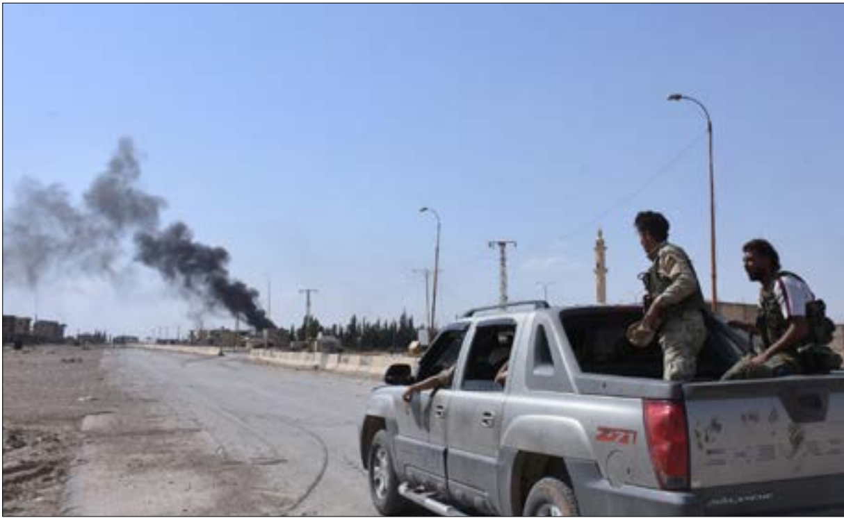
يُعدّ الجيش لتنشيط عدة عمليات منسّقة باتجاه السخنة

أعاد التصعيد الأخير من قبل الولايات المتحدة عبر إسقاط القاذفة السورية جنوب الرقة، التوتر بين واشنطن وموسكو إلى حاله ما بعد العدوان الأميركي على مطار الشعيرات. الرد الروسي كان - مجدداً - عبر تعليق العمل بمذكرة التفاهم حول سلامة الطيران في الأجواء السورية، وجاء مصحوباً بتحذير من مراقبة الدفاعات الجوية الروسية لجميع تحركات طائرات «التحالف الدولي» فوق الأراضي السورية غربي الفرات، على اعتبار أنها «أهداف شرعية».