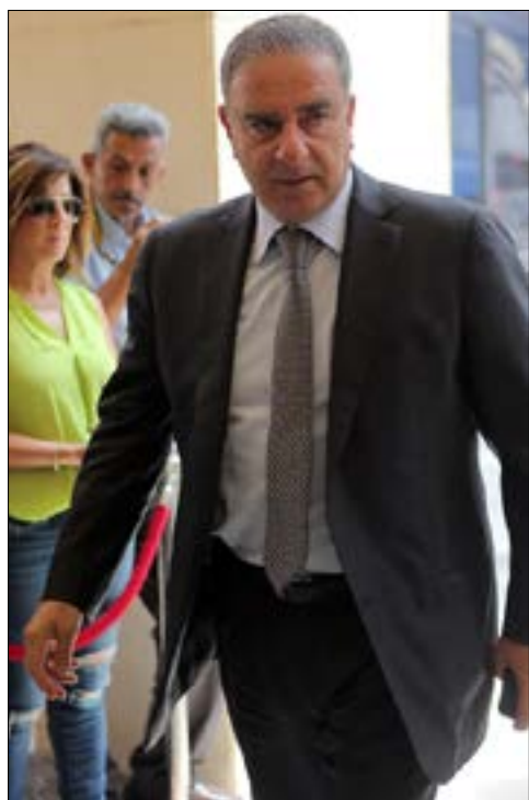
يسمى فرعون إلى تعزيز المصيبة بين اللبنانيين والسوريين (هيلم الموسوي)

جانبارت ومطران حمص عبدو عريش، يسوقان لنفسيهما على أنهما مرشحان «وسطيان»، فيما يملك المطران عبيسي ورقة قوة، هي حيازة الرهينة البوسنية 9 أصوات ناخبة، ما يسهل عليه الأمر للحصول على النصف زائداً واحداً، أي 15 صوتاً، في حال تعذر الانتخاب حتى الجلسة السادسة. و بانتظار «الدخان الأبيض»، يبقى أن أكثر من طرف، يتحدث عن تسوية ما، جرى الاتفاق عليها مسبقاً بين روما والرئيس السوري بشّار الأسد، لاختيار بطريك يستطع ترجمة رؤية الفاتيكان ولعب دور أساسي لحماية المسيحيين المشرقين، والحفاظ على علاقة متوازنة مع القوى السياسية في سوريا ولبنان ولم شمل الكنيسة.