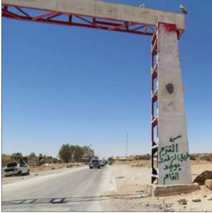
اشترطت ان تكون السيارات رابعة الدفع لتستطيع السير في الصحراء

وعقب البيان الروسي، خرج المتحدث باسم القوات الأميركية ضمن «التحالف»، ريان ديلون، ليؤكد أن واشنطن تعمل على تغيير مواقع طائراتها فوق سوريا «لضمان مواصلة استهداف (داعش) وضمان سلامة طواقمها»، وذلك في سيناريو مشابه للإجراءات الاحترازية التي اتخذتها القوات الأميركية في سوريا عقب عدوان الشعيريات. كذلك أوضح رئيس هيئة أركان الجيش الأميركي جوزيف دانفورد، أن بلاده تسعى إلى إعادة الخط الساخن بين الجيشين الأميركي والروسي، مؤكداً أن العمل جارٍ ضمن هذا الإطار «على المستويين الدبلوماسي والعسكري». ومن جانبه، قال المتحدث باسم البيت الأبيض شون سبايسر: «سنقوم بكل ما نستطيع لحماية مصالحنا في سوريا... وسنحتفظ بحق الدفاع عن أنفسنا هناك»، مضيفاً أن «من المهم إبقاء قنوات الاتصال مفتوحة مع روسيا».