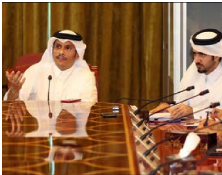
وزير الخارجية: ما دامت قطر تحت الحصار فلا مفاوضات