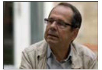
غريش في بيروت فلسطين يا حبي

«مش من زمان»: اليوم - الساعة التاسعة والنصف مساءً - مسرح المدينة (الحمرا - بيروت). للاستعلام: 01/753010