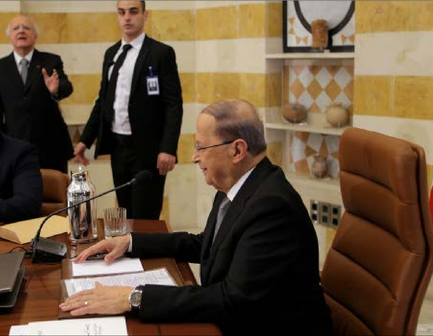
العهد مطالب بقانون انتخاب وبمعالجة الانفلات الأمني لأن هذا ما وعد به في خطاب القسم (هيثم الموسوي)

بين الأمن المتفلت والحوارات العقيمة حول قانون الانتخاب، ينظر إلى عهد الرئيس ميشال عون على أنه لم يبدأ فعلياً. فالتعثر الحالي ينعكس على صورته وعلى الوضع الداخلي المعرض أصلاً لشتى أنواع الأخطار