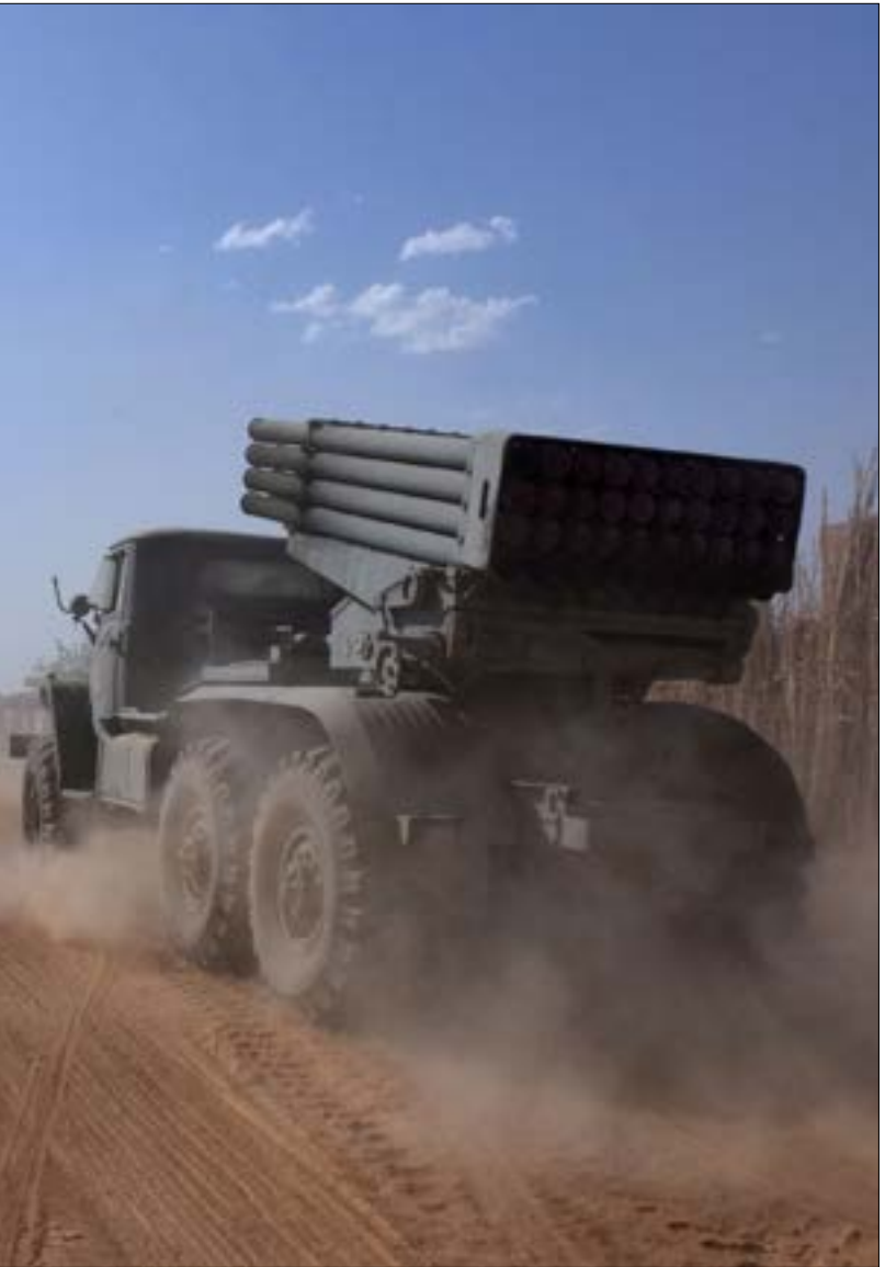
سيطر الجيش على منطقة تل دكوة الاستراتيجية في بادية ريف دمشق الشرقي

وعلمت «الأخبار» أن الحكومة تعمل على «احتواء البرزاني»، وتحاول «الملمة الأزمة عن طريق الحوار والاستيعاب»، وذلك عبر التوجه إليه بالقول: «إن كنت ترغب في إجراء استفتاء، فيمكنك أن تجربيه عن طريق منظمات المجتمع المدني (أي غير رسمي)». وتفسّر رسالة بغداد على أنها محاولة «دبلوماسية» لإفراغ «الاستفتاء» من محتواه، أولاً، وعدم إلزام أي من الطرفين به، ثانياً، والحفاظ على علاقة ودية مع الإقليم وانتهاج أسلوب حوار معيّن. ثالثاً.