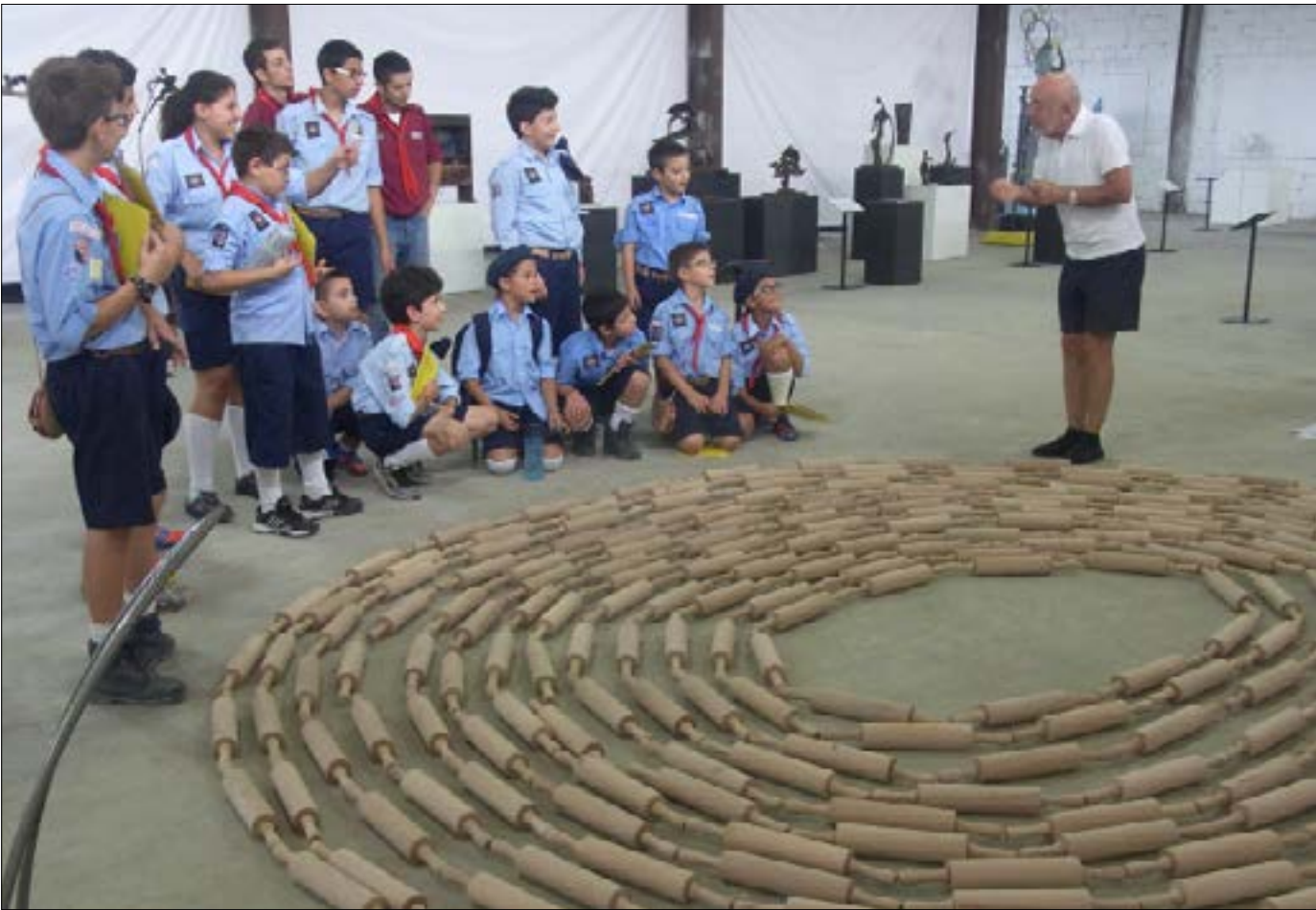
سيزار نمر مع الطلاب

في الحالة اللبنانية، تبدو المناسبة مجرد نكته للمحاولات الرسمية البدائية للتوثيق والحفظ. إذا ما استثنينا مساهماتها المقصودة لظمر الماضي، طوال السنوات التي تلت الحرب، وجدت الذاكرة الجماعية خلاصها على يد المبادرات الخاصة والفردية فقط. المؤرخ اللبناني سيزار نمر أحد هؤلاء الذين شقوا أبواب الماضي عبر التوثيق للفن التشكيلي اللبناني، من خلال مكتبته Recto Verso المرجعية، و«متحف مقام» الذي يحوي أعمالاً ترويحية سيرة النحت في لبنان، و«دار الفنون الجميلة» المختصة بالكتب الفنية