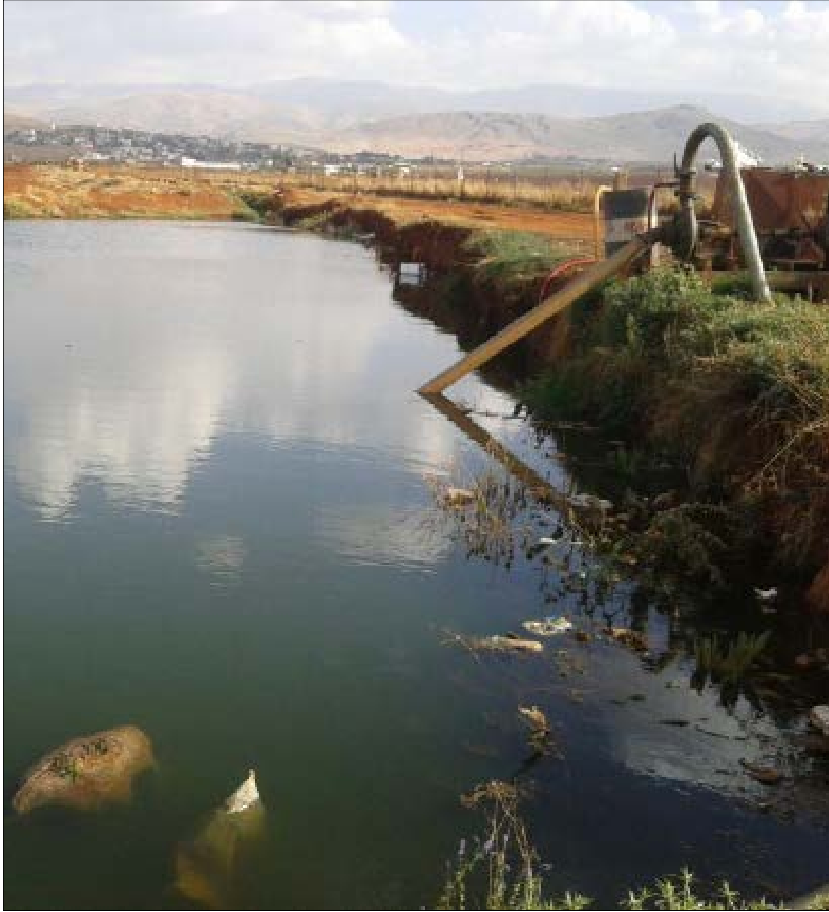
الري بمياه ملوثة

وفقاً لتقرير خاص عن لبنان حول مشروع القضاء على الملوثات العضوية الثابتة وذلك بالشراكة مع برنامج الأمم المتحدة للبيئة ومنظمة الأمم المتحدة للتنمية الصناعية، قد واجهت الجهود الرامية لتحديد كميات مخزون مبيدات الآفات من الملوثات العضوية الثابتة العديد من التحديات. كان من الصعب الحصول على البيانات المتعلقة بكمية هذه المواد الكيميائية لأسباب كثيرة، منها إنكار مصانع الكيماويات الزراعية عن إنتاج مثل هذه المواد الكيميائية، أو وجود مخزون منه، عدم وجود تصنيف مناسب للمبيدات من قبل الجمارك اللبنانية، عدم وعي المزارعين بطبيعة المبيدات المستخدمة، عدم وجود سجلات دقيقة وكاملة تفصل استخدام هذه المواد الكيميائية من قبل البلديات. إضافة إلى ذلك، لقد تبين أن العاملين في القطاع العام اللبناني، والعمال الزراعيين على وجه الخصوص، لا يعرفون على ما يبدو مخاطر مبيدات الآفات الحقيقية ويفتقرون إلى التعاليم عن السلامة.