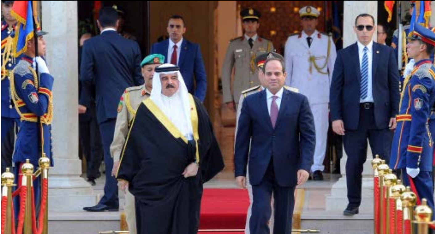
استقبلت القاهرة أمس، ملك البحرين حمد بن عيسى، فيما لم يصدر عقب «القمّة» أي إشارة لتخفيف الموقف حيال قطر

على عكس ما تشتهي سفت «المحمدات» في أبوظبي والرياض، توسعت رزمة الكباش الخليجي لتدخل مرحلة جديدة عنوانها «التدويل». مرحلة بدت مربكة لموقف مقاطعي الدوحة، ومهددة للرهان السعودي -الإماراتي على حصر النزاع مع قطر «المتمردة»، وفي العاصمة القطرية، ظهرت علائم «الانتعاش» والاستعداد لشوط طويل من التحدي في وجه مطلب الإخضاع، بعد تطور الموقف التركي بإبداء الاستعداد لإرسال قوات عسكرية إلى قطر