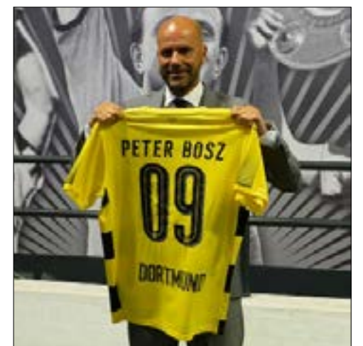
بوش خلال تقديمه رسمياً مدرساً لدورتموند

كان أمس يوماً للمدرّبين بامتياز في سوق الانتقالات الصيفية بين إيطاليا وألمانيا. بدءاً من إيطاليا، حيث أعلن المدرّب السابق لروما لوتشيانو سباليتي موافقته على تدريب إنتر ميلانو، وذلك قبل سفره إلى الصين لمقابلة مالكي النادي قبيل تعيينه المرتقب بشكل رسمي. وقال سباليتي للصحافيين في مطار ميلانو إنه وافق على صفقة الانتقال وسيوقع بنودها رسمياً قريباً، والمتوقع أن تضعه على رأس الجهاز الفني لإنتر لمدة ثلاثة أعوام. وقال سباليتي: "أنا سعيد لأنني ساكون مدرساً لإنتر"، وأضاف: "التوقيع؟ تم ترتيب كل شيء. قمنا