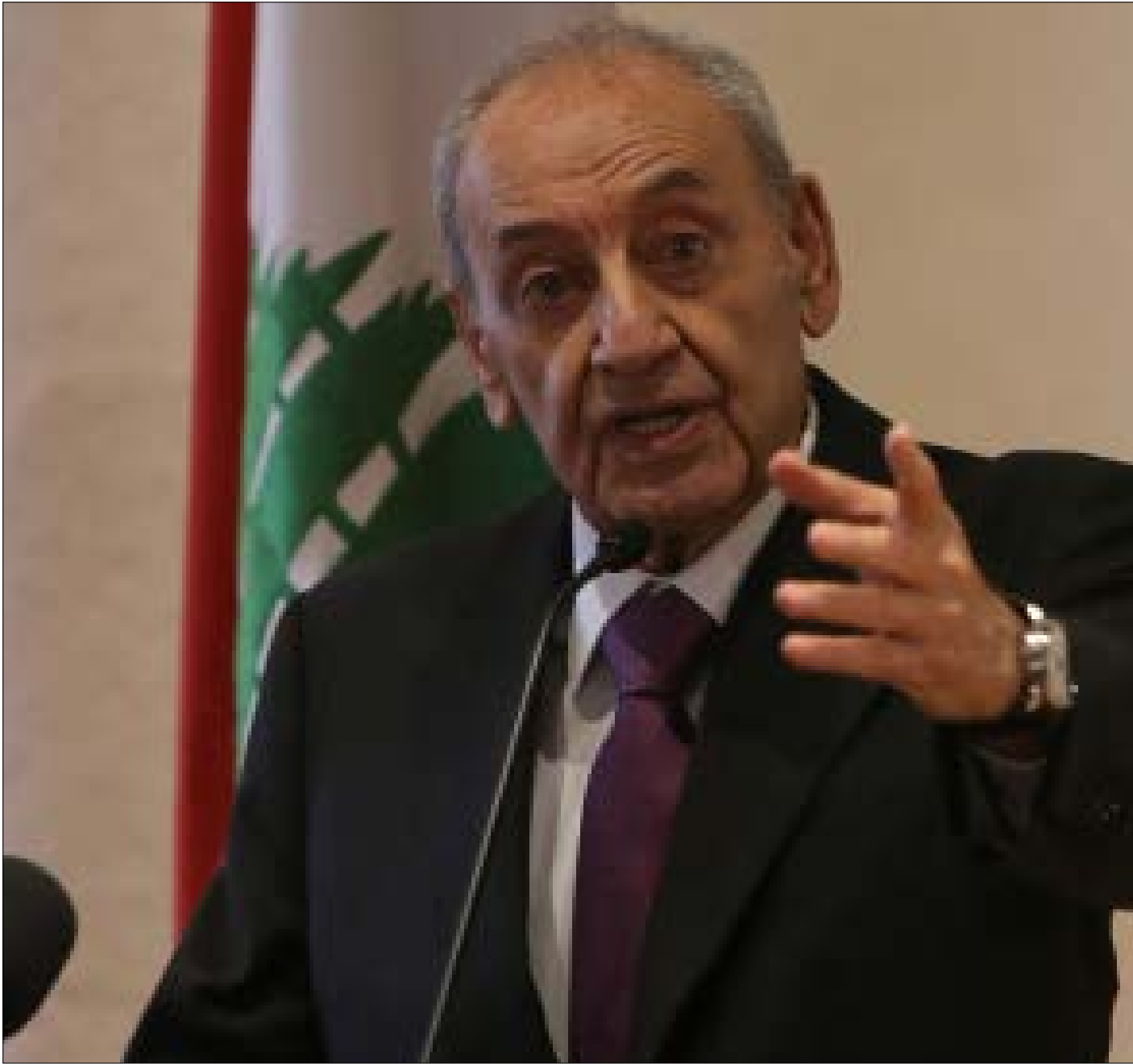
بري: نحن نلشد ما يمكن وصفه ببداية تقسيم المنطقة، فهل نعمت ببلدنا ونسير في هذا المسار؟ (مروان طحطح)

التشاؤك سيّد الموقف، حتى المفاوضون لا يتحدّثون بثقة عن قدرتهم على تخطّي العقبات، ولا يجدون إجابة واضحة عن السؤال الأكثر جدية: هل ما يُطرح اليوم يهدف إلى نفس الاتفاق، على قانون النسبية في 15 دائرة للعودة إلى الستين، أم أنه مناورة لرفع سقف التفاوض؟