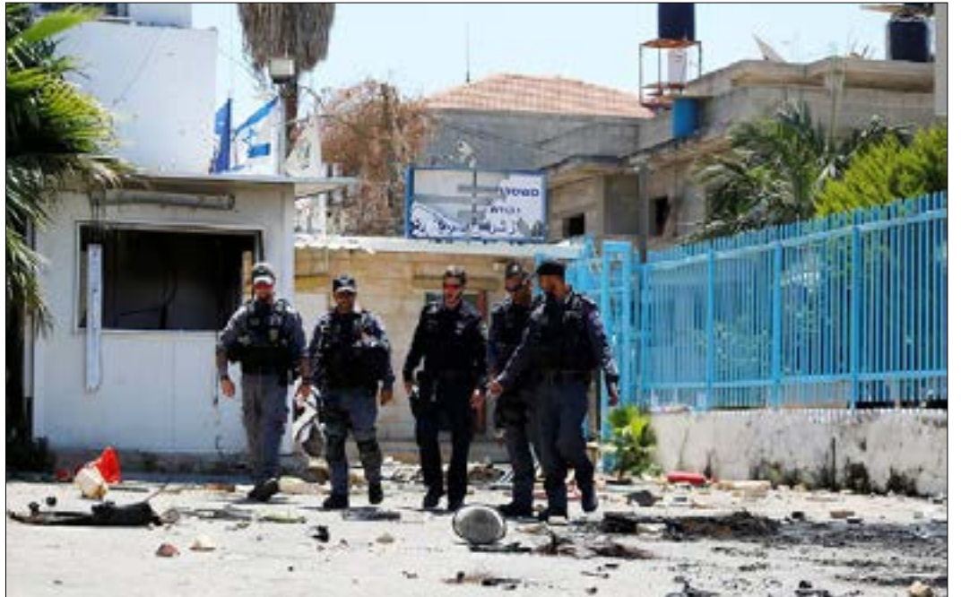
اندلعت اشتباكات عنيفة، كذلك أحرقت مركبات الشرطة