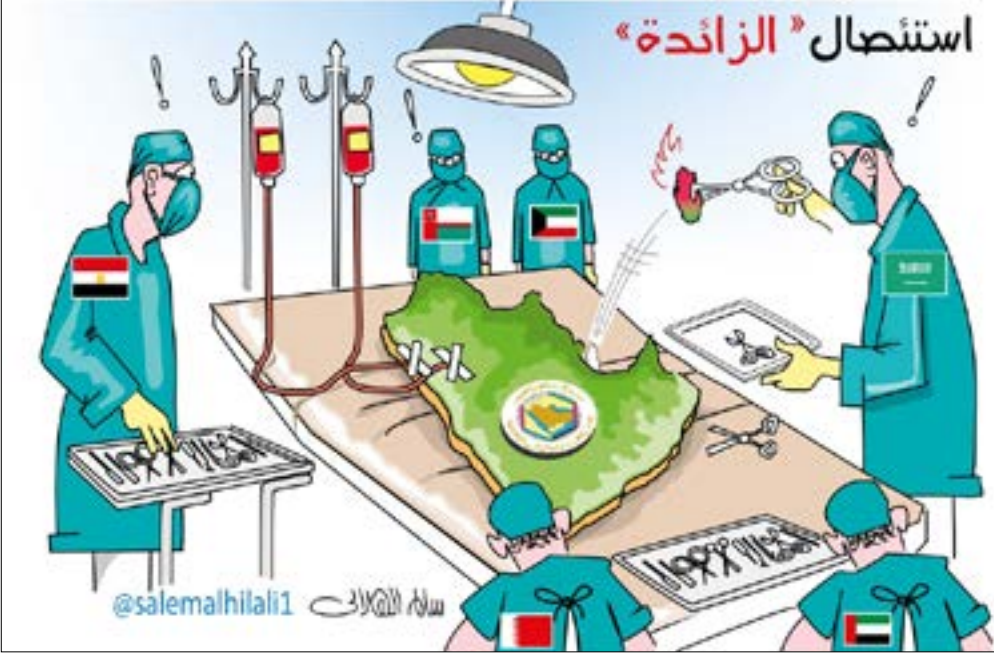
كاريكاتير نشرته صحيفة «عكاظ» السعودية أمس

أبعاده ورسائله مجرد كونه مقابلة تلفزيونية. إذ لا تشبه مقابلة مدير مركز أبحاث من جدة، مع القناة الثانية الإسرائيلية، أي مقابلة تجريها قنوات التلفزة الإسرائيلية مع أي شخصية عربية أخرى. أولاً للثقل الذي تتمتع به الرياض في أوساط واسعة في العالمين العربي والإسلامي، والثاني للرمزية التي تقدم نفسها بها. وثالثاً لكونه يأتي في سياق له ما قبله، وما بعده ويموازاته، خطوات سعودية تطبيقية أخرى، لها أهداف محدّدة، تتصل ببلورة تحالفات جديدة لاحتواء مفاعيل التطورات التي شهدتها وتشهدها المنطقة، تشكل الرياض وتل أيبب ركنيها الأساسيين. على ذلك، تأتي الخطوة الإعلامية السعودية ترجمة لقرار رسمي باستكمال المسار التطبيقي مع إسرائيل، الذي أخذ أشكالاً متعددة خلال المرحلة السابقة. ثم تلقى زخماً إضافياً بعد زيارة ترامب للسعودية، حيث بدأ أن العلاقة الإسرائيلية - السعودية مقبلة على تطور جديد. في المضمون، يلاحظ أن (بعض) الإعلام الإسرائيلي تبنى في مقاربة الأزمة مع قطر الرواية السعودية وتعامل مع التهم التي وجهتها الأخيرة لها، على أنها حقائق وليست فقط مجرد روايات متقابلة. وبالرغم من أن مضمون هذه التهم مدعاة «للسخرية» إلا أن بعض الإعلام الإسرائيلي ردد ما تروج له السعودية، واعتبر أن خلفية الأزمة تعود إلى أن قطر تدعم إيران والنظام السوري وحزب الله، وبحكم أن المنصة إسرائيلية وإكراماً للمضيف الإسرائيلي، كان لا بد «للضيف» السعودي أن لا يكتف بالتحريض على شريكه القطري في إنتاج هذا المشهد العربي، بل أدلى بدلوه أيضاً، بالتحريض على مقاومة الشعب الفلسطيني في مواجهة الاحتلال. ودعا إلى بناء شرق أوسط جديد، يقوم على شرعنة الاحتلال تحت مسمى «السلام»، وإلى مكافحة الإرهاب الذي يتفق مع إسرائيل في تشخيص مصاديقه.