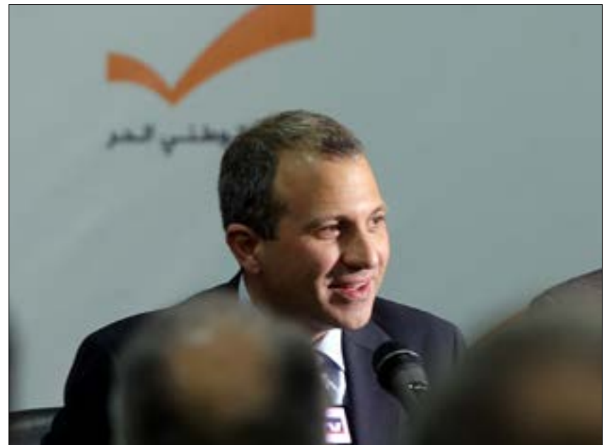
يفرض نادر الحريري التمتع إعلامياً على التشكيلات لعدم خلف إشكال مع باسيل (هيلم الموسوي)