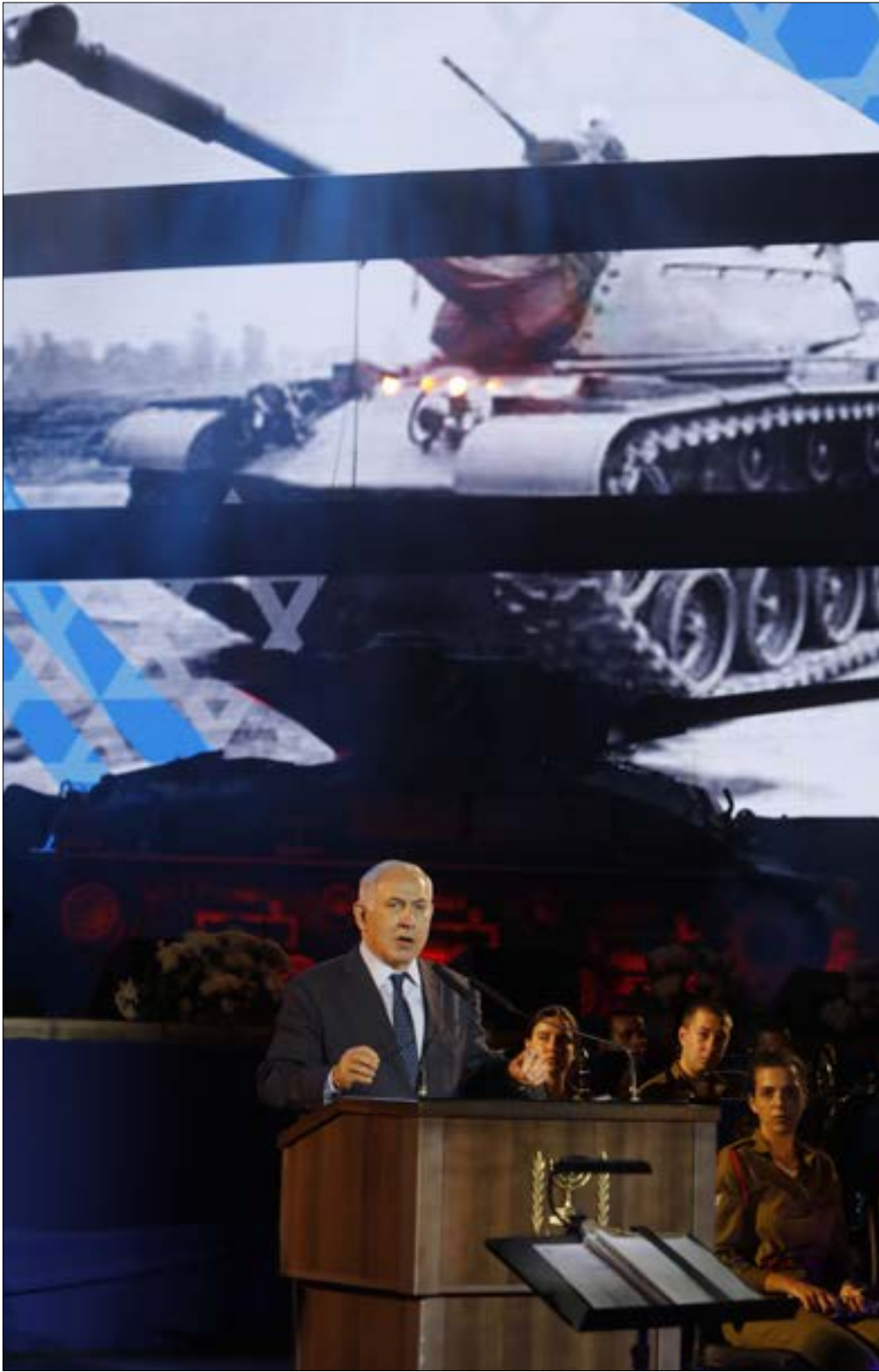
بحسب الرؤية الإسرائيلية، فإن الاستراتيجية الأميركية المتبعة ستزيد من تعاضل التهديد

بدءاً، يجب الإشارة إلى أن النتيجة الأولى، والأكثر دلالة في التحذيرات الإسرائيلية من الممرات الإيرانية، هي شبه التسليم الإسرائيلي بانتصار الدولة السورية وحلفائها في المساحة السورية، مع فقدان أدوات قلب المعادلة فيها. ويشير تركيز إسرائيل على الممرات إلى شبه استسلام بالانتصار السوري وفشل سلسلة الخطط الموضوعية تناعاً في السنوات الست الماضية، للإمساك بسوريا وإلحاقها بالمحور «المعتدل» المتماهي مع إسرائيل، الأمر الذي يبقى، أمام هذا المحور، التركيز، بمعنى التحذير، من تبعات وصل المساحة السورية بحليفها الإيراني. مع ذلك، تحذير إسرائيل من ممرات إيرانية إلى سوريا، أو دونها، لا يزيد أو يقلل من الجهد المبذول أميركياً لمنع تحقيق هذا الممر، لكن أيضاً مع الإدراك أن أصل توجه واشنطن بدورها لمنع الممر البري هو أيضاً تسليم من قبلها، علماً بأنها رأس ومحرك «محور الاعتدال»، بانتصار