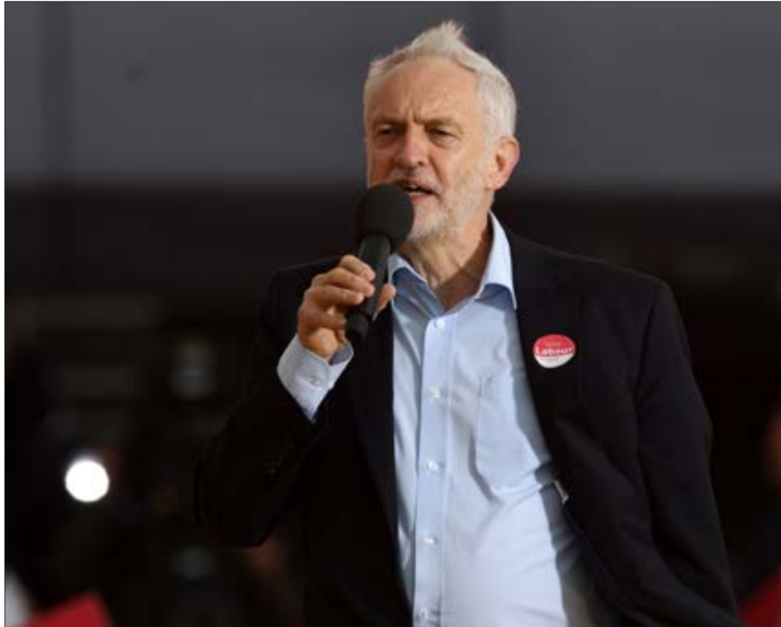
ظهر كوربن في الأيام الأخيرة شديد الثقة، فشنّ هجوماً حاسماً على ماي

ماي رئيسة الوزراء الحالية قدّمت للبريطانيين كل الأسباب كي ينفّضوا عنها. فإدارتها ملف «بريكست» اتسمت بالتخبّط والضعف وانعدام الخيال، ولم يمتح