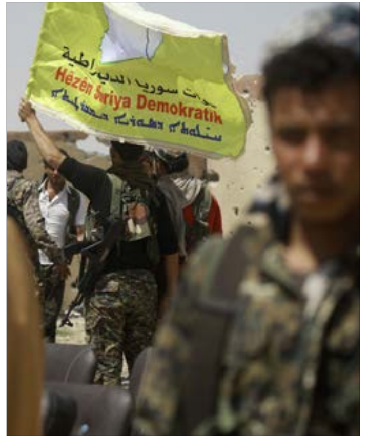
دخلت «قوات سوريا الديمقراطية» حي المشلب شرقي مدينة الرقة

في الوقت الذي أعلن فيه «التحالف الدولي» إطلاق المرحلة الأخيرة في معركة السيطرة على مدينة الرقة،