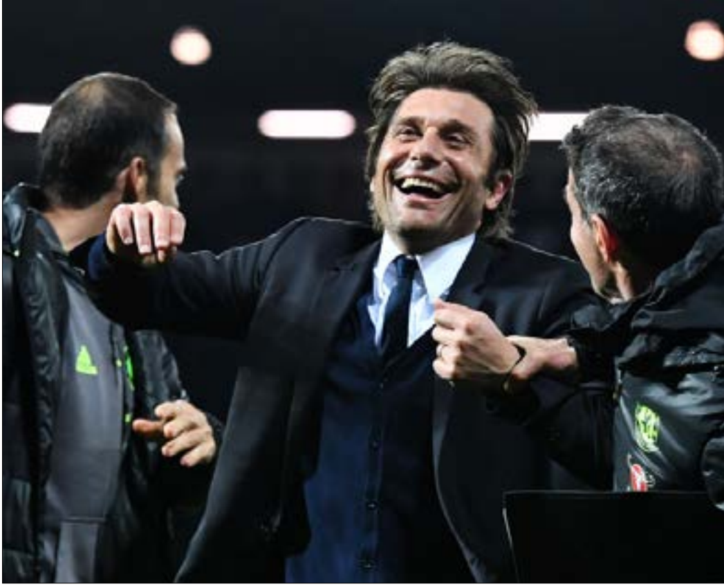
كونتي محتفلاً بالتتويج بعد الفوز على وست بروميتش البيوت

وايلكاي غوندوغان في الثاني. كذلك، حافظ أرسنال وتوتنهام على مجموعتهما، فيما أعطى ليفربول بقيادة مدربه الألماني يورغن كلوب، انطباعاً في النصف الثاني من الموسم الماضي بأنه سيكون منافساً شرساً على اللقب. هذا كان المشهد الإنكليزي في بداية الموسم. مدربون كبار ونجوم من الطراز الرفيع جدد على «البريميير ليغ». رهان تشلسي كان على رجل اسمه أنطونيو كونتي. المدرب