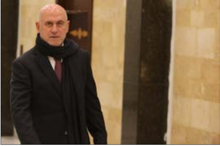
ينظر فنيانوس اجوبة ديوان المحاسبة ومجلس شورى الدولة

موريشيوس» من أجل تزويد المتاجر في المنطقة الحرة. يضيف التقرير: «وبعد استدعاء رئيس الوزراء السابق، سيسافر محققون إلى سويسرا بهدف الحصول على تفاصيل بشأن دوفري حول الاتفاق المعقود مع نانداي سورناك وراكش غولجوري».