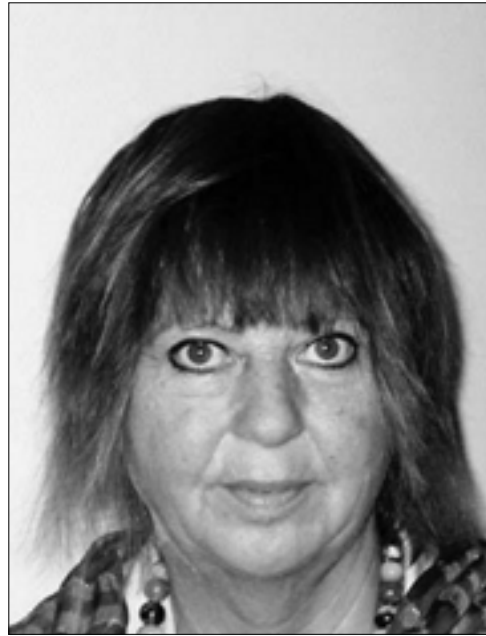
المخرجة الألمانية هونيكا ماورير

قدّمت ماورير شهادتها البصرية التوثيقية لمحطة أساسية من تاريخ الصراع العربي الإسرائيلي تتوقف عند تواريخ سياسية متقاطعة بين لبنان وفلسطين والعالم العربي. شاهدنا مقاطع ممنتجة من أفلامها «الحرب الخامسة»، و«أشبال»، و«أطفال فلسطين»، و«الهلال الأحمر الفلسطيني»، وأخرى من تلك التي تولّت إنتاجها أيضاً «منظمة التحرير الفلسطينية» كجزء من الإهتمام بصورتها الإعلامية. «لدينا أطباء كثر، ولكن ليس لدينا مخرجون»، قال لها أبو عمار يوماً عندما اجتازت شاشات العالم وجاءت إلى لبنان لترى الثورة الفلسطينية بنفسها. في السبعينيات، أرادت هذه الصحافية والمخرجة أن تنخرط مباشرة في الحركة السينمائية المقاومة التي أرسنتها «وحدة أفلام فلسطين»، بعدما التقت ببعض مخرجيها في