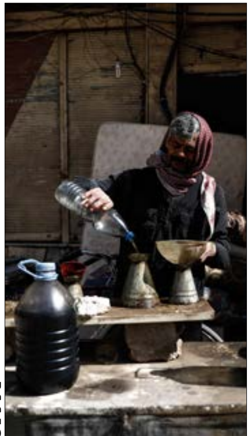
رجل ببيع «وقوداً منتجاً من البلاستيك» في مدينة دوما في ريف دمشق

على وقع المكاسب الميدانية التي يحققها الجيش السوري وحلفاؤه منذ عدة أشهر، تأهل دمشق أن يكون العام الحالي بداية المشوار نحو استعادة البلاد تدريجياً لكامل إنتاجها النفطي والغازي. وهو أمر لن يتحقق قبل عام 2022 وفق التقديرات الرسمية