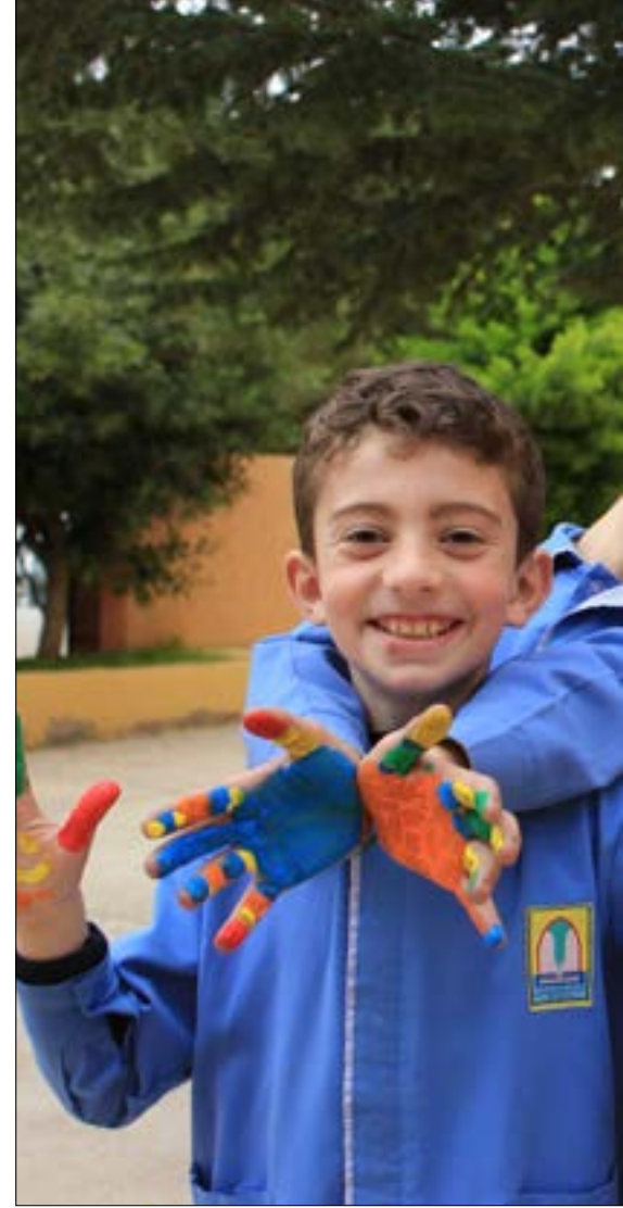
الهدف هو إعطاء التلميذ فرصة الاستمرار في المسار التعليمي وليس إتجائه

بمقدور المدرسة العادية أن تأخذ على عاتقها معالجة المشاكل والصعوبات التعليمية لدى المتعلمين على تنوعها واتساعها وانتشارها؟ أم يُترك المتعلم لقدره؟ وكيف نساعد التلامذة في إكمال مسارهم التعليمي بالشكل الذي يتناسب مع استعداداتهم وقدراتهم ومواهبهم الخاصة بحيث يصبح كل تلميذ حالة بحد ذاتها؟