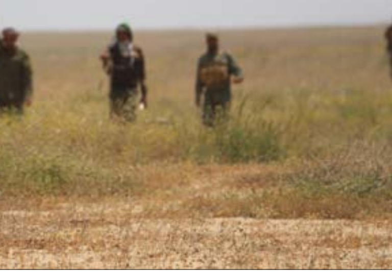
المرحلة الثانية تهدف إلى استعادة مدينة البعاج (الأخبار)

القوات الأميركية إلى هناك. ويشرح أن الأميركي لن يثبّت في عمق الصحراء، بل سيوكل إلى «أدواته» من كلا البلدين القيام بتلك المهمة، غير أن هذه «الأدوات» تدرّك جيداً أن «الحشد لن يسمح لها بذلك»، من دون أن يستبعد إمكانية الاشتباك أو الاحتكاك معهم، في المراحل المقبلة. وتضيف مصادر «الحشد» أنه بعد الوصول إلى الحدود السورية وإمساكها، فإن الخطوة التالية المتوقعة ستكون إطلاق «معارك الجيوب»، أي المحيط الجنوبي للقبروان وبادية البعاج وصحراء القائم، في إشارة إلى أن غربي الأنبار (عنه، راوه، القائم)، ومنطقة النقاء محافظات نينوى - صلاح الدين - الأنبار، ستكون هدفاً مرتقباً لتلك القوى المتقدمة، فلا يمكن أن «نمسك بعض حدود ونترك بعضاً آخر»، بتعبير أحد قادة «الحشد»، الذي يؤكد أن الأمر مرهونٌ في النهاية بيد «القائد العام للقوات المسلحة»، رئيس الوزراء حيدر العبادي.