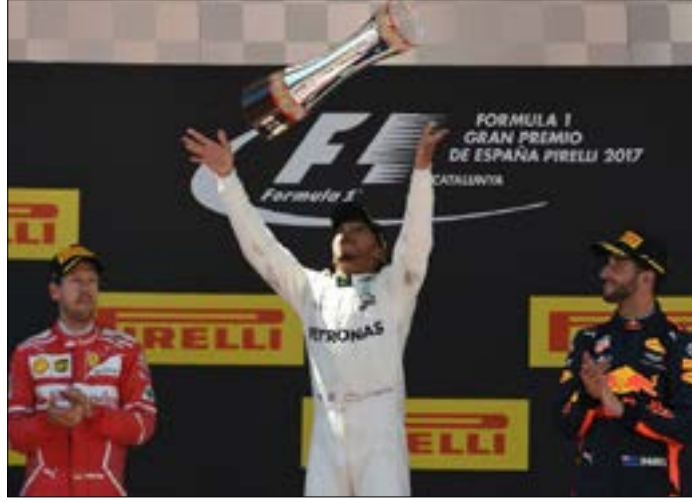
هاميلتون بعد تتويجه بكأس المركز الأول

وشهد السباق خروج سائق مرسيدس الفنلندي فالنتيري بوتاس بسبب عطل في المحرك، ومواطنه سائق فيراري كيمي رايكونن بعد تضرر جهاز التخليق الأمامي في سيارته عند المنعطف الأول من