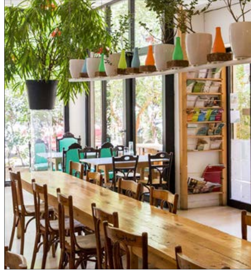
تصبر طاولات عن التقاليد المحلية من خلال الأكل

تعريف معنى الربح. فالرجل لا يبحث عن مكسب مادي من جراء المشاريع التي أطلقها كما يشير، بقدر ما يريد المساهمة بنشر العدالة الاجتماعية. فالربح على ما يقول «ليس محصوراً بالربح المادي. هناك ربح اجتماعي وريح بيئي لا يمكن تجاهلها. أما الريح المادي فهو وسيلة لاستمرار هذه المهمة وتطويرها وتنميتها وليس هدفاً بحد ذاته».