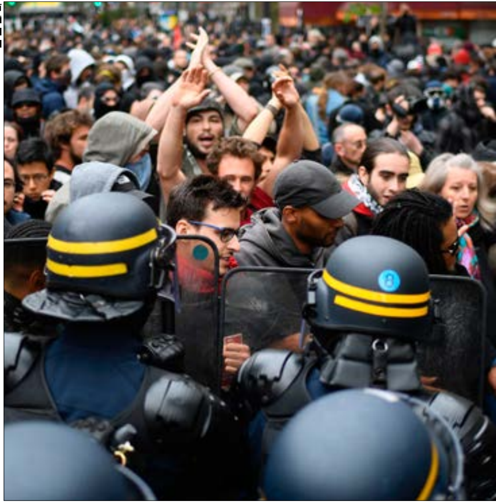
تظاهر الآلاف في باريس أمس لإظهار عزمهم على التصدي لتوجهات ماكرون الاقتصادية

الجناب الذين سيغادرون صفوفه للترشح تحت لوائح ماكرون. مشاكل الاشتراكيين ستجعل الرهان متركزاً على جان لوك ميلانشون، في المعركة من أجل غالبية يسارية في البرلمان المقبل. زعيم «فرنسا المتقدمة» لن يكتفي بالقاعدة الواسعة التي صوتت له في الجولة الرئاسية الأولى (7 ملايين صوت)، بل يراهن أيضاً على استمالة غالبية الممتنعين (16 مليون صوت). إلا أن ذلك قد لا يكون كافياً لتحقيق الأغلبية من مجموع 47 مليون ناخب. ولذا، يُرتقب أن تشهد حملة الانتخابات التشريعية صراعاً محموماً بين «فرنسا المتقدمة» و«الجمهوريين» من أجل استقطاب الفئات التي صوتت لماكرون («اضطراباً»، والتي تمثل مخزوناً ضخماً يُقدر بنحو 8,9 ملايين ناخب. وبالتالي، هؤلاء هم الذين سيلعبون دور الحكم في ترجيح الكفة بين اليمين واليسار في البرلمان المقبل، لتكون الأغلبية من نصيب التيار السياسي الذي سينجح في استقطاب أكبر عدد منهم.