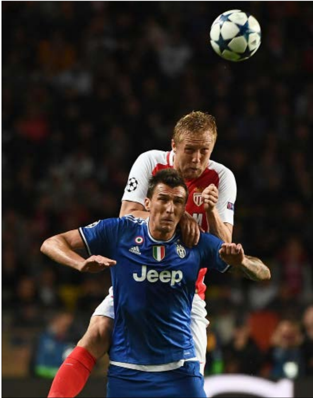
لم تحمل مباراة موناكو ويوفنتوس ذهاباً المستوى التنافسي المتوقع

وعلى الرغم من وفرة الأهداف المسجلة حتى الآن في ذهاب نصف النهائي، إلا أنها لم تعادل أو ترتفع فوق المعدلات التي كانت عليها في المراحل السابقة. التراجع التهديفي انعكس بشكل سلبي على المستوى الفني للمباريات وجدتها. فالفارق في المستوى الفني كان واضحاً على سبيل المثال بين يوفنتوس وموناكو. تفوق الأول تكتيكياً، ولعب بانضباط