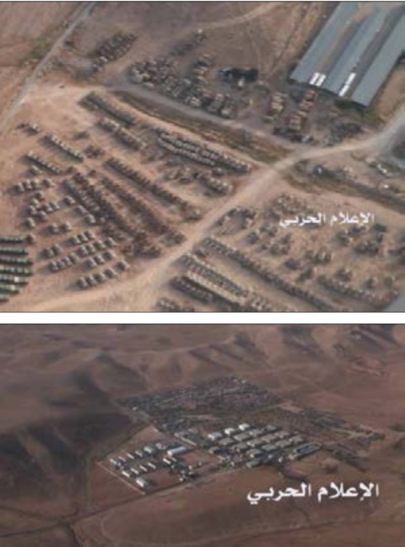
صور نشرها «الإعلام الحربي» للحشود الأميركية في الأردن

احتشدت القوى المحلية والإقليمية والدولية في معسكرين، يهدف كل منهما إلى السيطرة على منطقة الحدود العراقية السورية، أو على أجزاء منها. وتتفرّع عن ذلك أهداف أخرى لكل واحد من المعسكرين. تريد واشنطن إقامة حزام أمني في الجنوب والشرق السوريين، بهدف استخدامه للضغط على دمشق ميدانياً، وفي أي مفاوضات مستقبلية، ولتضع محور المقاومة من تدمير صموده الميداني طوال السنوات الماضية، والحوّل دون فتح طريق دمشق - بغداد البرية، ومن خلفها، طريق بيروت - طهران. الحشود الأميركية تجري بذريعة القيام بمناورات «الأسد المتأهب» الدورية، داخل الأراضي الأردنية. لكن محور المقاومة لا ينظر إليها بهذه البراءة. يوم أمس، نشر «الإعلام الحربي» التابع للقوات الحليفة لسوريا صوراً جوية تظهر الحشود داخل الأراضي الأردنية. رسالة واضحة بأن ما «تقومون به يقع تحت مرمى البصر، والنار». وأتبع «الإعلام الحربي» الصور ببيان منسوب إلى «مصدر مطلع»، حمل تهديداً مباشراً للأميركيين إذ قال: «ليعلم الأميركيون وحلفاؤهم أنهم سيدفعون الثمن غالباً، وسيكونون أهدافاً جراً استباحتهم الأرض السورية».