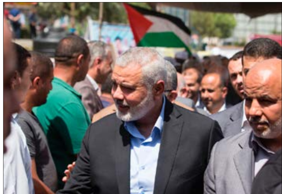
هنية في أول إطلالة بعد رئاسته المكتب: قضية الاسرى على رأس أولوياتنا (أف ب)

في قطاع غزة وتجنّب الإقامة في قطر، لما للأخيرة من رمزية سلبية وتأثيرات على العلاقات الخارجية. ووفق المعلومات، إن بقاء «أبو العبد» في غزة، رغم المخاطر الأمنية المترتبة على شخصه، سيسهّل على «حماس» التقرب من طهران والقاهرة أكثر، ويبقي الرجل على تواصل مباشر مع الجسم العسكري للحركة. كذلك، يرى هنية أن الإقامة في الدوحة «قد تزعج المصريين، ومن الأفضل لتحسين العلاقة مع أكثر من جهة البقاء في غزة». تضيف المصادر في «حماس» أنه «سيكتفي بال جولات الإقليمية، وبعقد اجتماعات متفرقة لقيادة الخارج والعودة إلى غزة... غالبة أعضاء المكتب السياسي في هذه الدورة هم من أبناء القطاع». وعملياً، تبين بعد إعلان «حماس» أول من أمس أسماء أعضاء مكتبها السياسي الجديد، وهم: موسى أبو مرزوق، ويحيى السنوار، وصالح