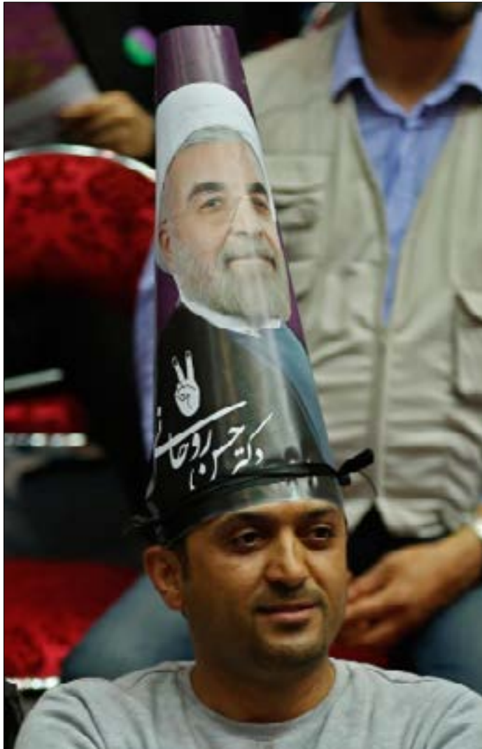
اتهم روحاني المحافظين بأنهم حاولوا تخريب الاتفاق النووي

وفي تصريح مقتضب لـ «الأخبار»، رفض الدبلوماسي الإيراني عباس خامنه يار التعليق على تحليل الظروف الحالية للسباق الرئاسي، لكنه أكد في الوقت نفسه تصدر روحاني نتائج استطلاعات الرأي لقائمة المرشحين، حتى الآن. وقال: «علينا الانتظار لنرى نتيجة المناظرة الثالثة والأخيرة للمرشحين، ومدى تأثيرها على آراء الناخبين الإيرانيين، لأن نتائج استطلاعات الرأي قد تتغير بعد المناظرة الأخيرة». ورجّح الملحق الثقافي الأسبق لدى السفارة