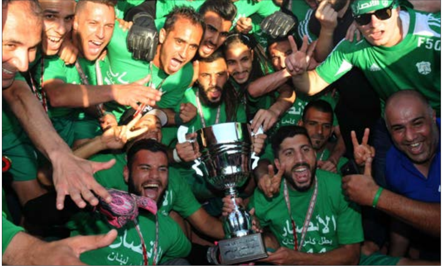
لاعبو الأنصار مع الكأس الرابعة عشرة