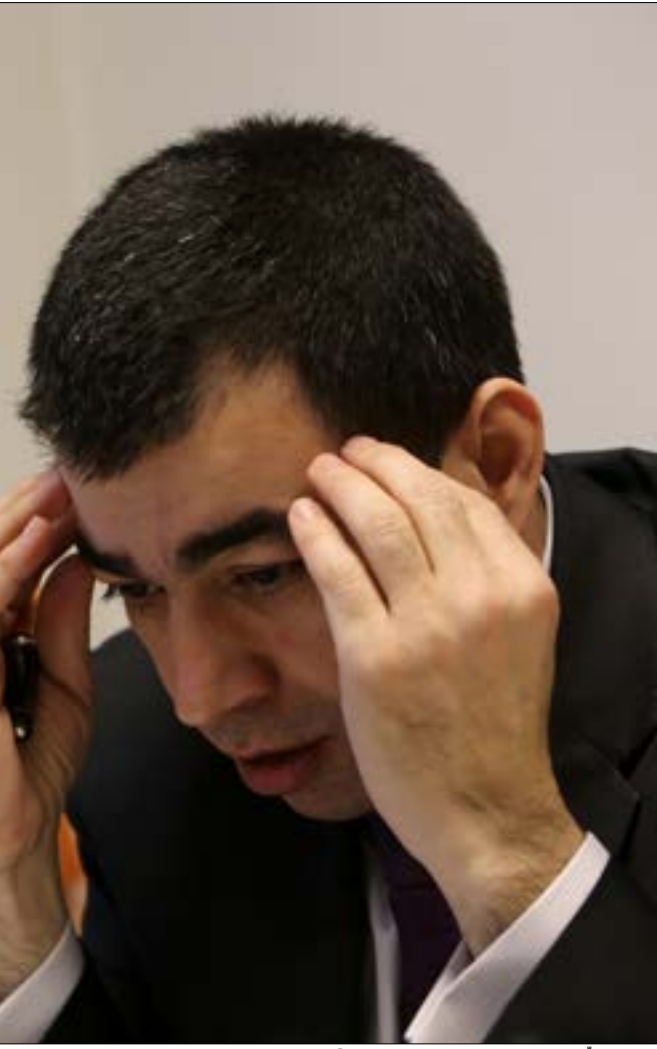
لجنة فضّ العروض تركت الباب مفتوحاً على الاستئجار والتاويل

كان لافتاً في الجلسة أن أحد ممثلي الشركات سأل عن مسالة شكلية تتعلق بالتوكيل المطلوب، إلا أن القاضي لم يجب عن السؤال، بل قال بوضوح إنه لا يعلم. مصادر اللجنة بزّرت للقاضي ردّه بالإشارة إلى أنه لم يطلع على الملف حتى يعطي رأيه القانوني!