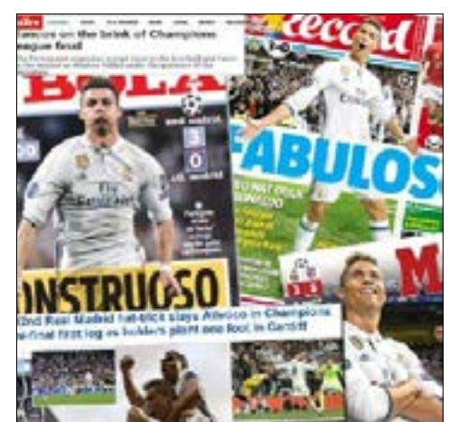
احتل رونالدو أغلفة الصحف الأوروبية

كان النجم البرتغالي كريستيانو رونالدو، لاعب ريال مدريد، محور الاهتمام أمس بعد ثلاثيته التي قاد بها فريقه إلى الفوز على أتلتيكو مدريد 0-3 في ذهاب نصف نهائي دوري أبطال أوروبا. وبات رونالدو أول لاعب يسجل ثلاثيتين متتاليتين في «التشامبيونز ليغ» بعد «هاتريك» في إياب ربع النهائي أمام بايرن ميونيخ الألماني، كما أصبح صاحب الرقم القياسي بعدد الأهداف في نصف النهائي بـ 13 هدفاً ورفع رصيده إلى 104 أهداف قياسية في البطولة وإلى 400 بقميص الملكي. اللافت أن الدون «بأهدافه الـ 104