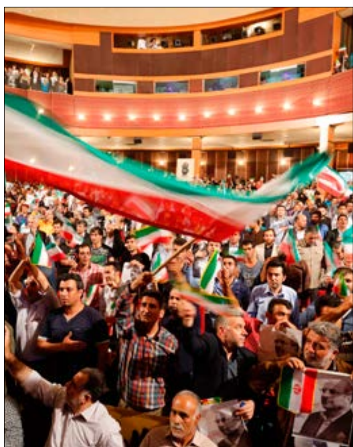
ستشهد الأيام الأخيرة من فترة الدعاية الانتخابية عملية استقطاب للاصوات

تشهد إيران معركة رئاسية حامية برز أول معالمها مع انطلاق الدعاية الانتخابية وتقديم المرشحين الستة برامجهم. وفيما تتضح مؤشرات مواجهة الرئاسية بانقسامها إلى شطرين، يبدو التيار المحافظ داعماً لثلاثة مرشحين، هم رئيس