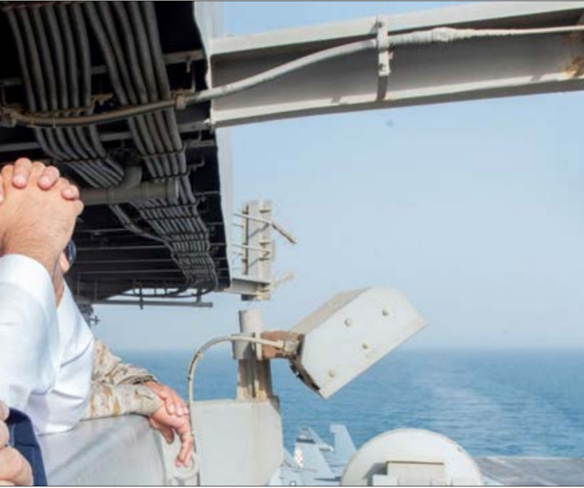
مجنويات الجنود محطة منذ الشهر الرابع لبدء العدوان على اليمن

السعودي وابنه، القادران كما قال الأخير على حسم المعركة بسرعة لو أرادوا، على الإغراق على جنود المملكة كل مدة، علماً بأن القوات المسلحة المشاركة في العدوان لم تحقق أيًا من النتائج التي تمنّاها الاثنان على مدى عامين ونصف؟