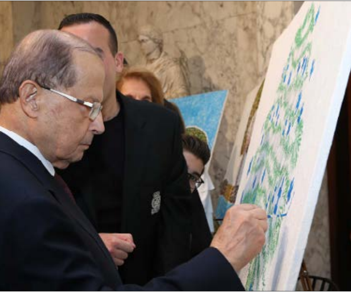
يتوقع كثيرون أن يبادر عون إلى خطوات لتفادي الفراغ (دالاتي ونهرا)

سقطت كل إمكانيات المناورة، والبلاد مقبلة على أزمة كبرى اسمها الفراغ في المجلس النيابي. ولتفادي الشغور التشريعي، لم يبق سوى خيارين: إما النسبية، أو «قانون الدوحة». وعلى الرغم من ارتفاع الكلام الإيجابي عن النسبية، لا يزال «الستين» متقدماً على سواه