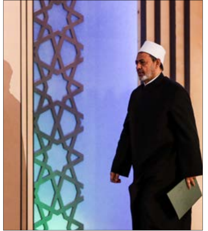
تخشى الرئاسة من تداعيات الإطاحة بالطيب

تصطدم الرغبة الملحة لدى السلطة في الوقت الحالي، في إطاحة شيخ الأزهر الحالي، أحمد الطيب، الذي يفترض أن يبقى في منصبه لنحو 15 عاماً أخرى على الأقل، بمخاوف حقيقية من الغضب الشعبي تجاه القانون، ولا سيما أن الطيب الذي يُعد «رمزاً للإسلام السني» في