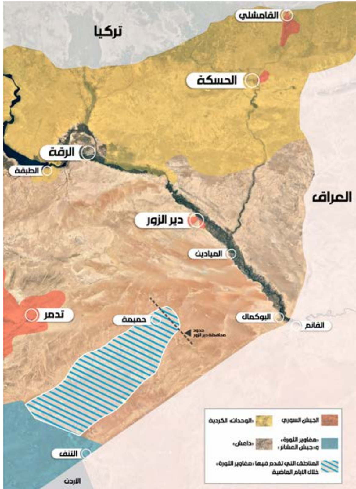
(تصميم سنان عيسى)

في المقابل، أبدى ترامب ثقته بإمكانية التوصل إلى «اتفاق سلام»، من دون أن يتطرق إلى كيفية إنجاز هذا الأمر. وبينما