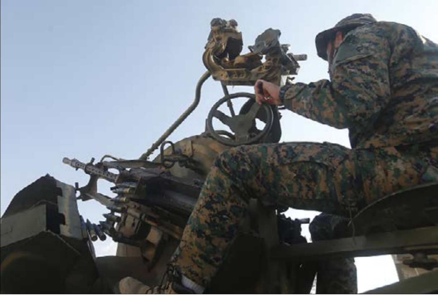
أي تطور عسكري في الجرد يحتاج إلى مواكبة سياسية من الحكومة (هيلم الموسوي)