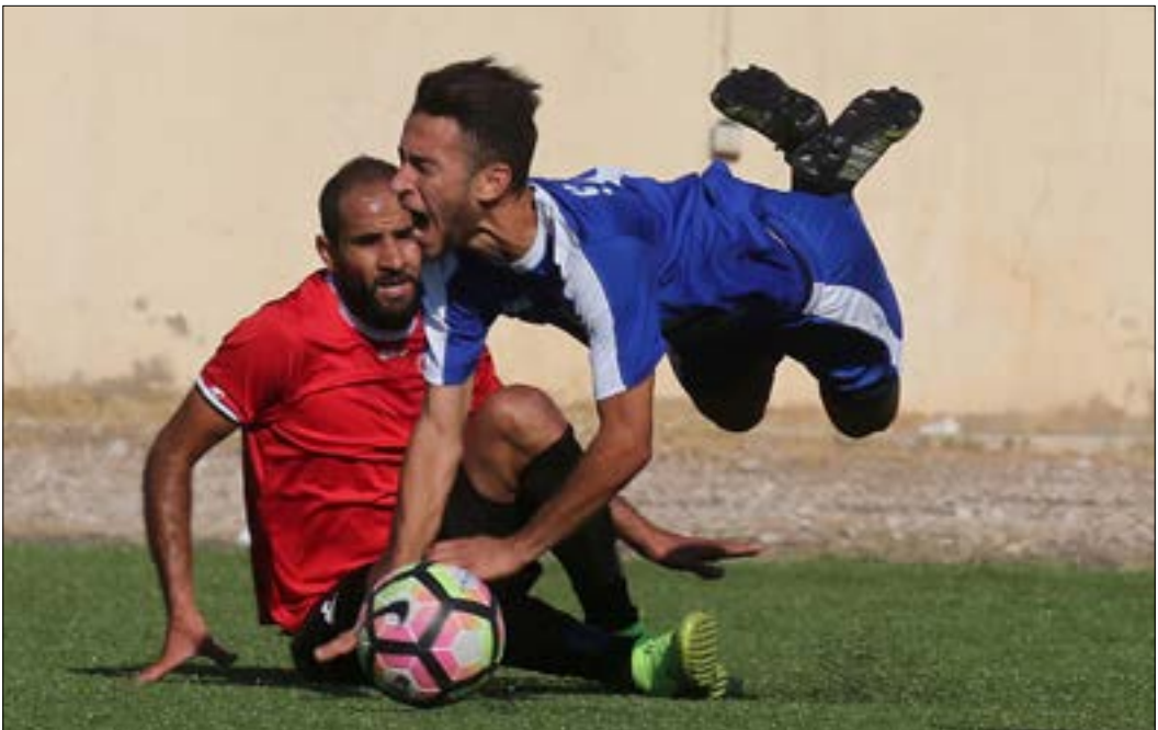
تعادل الإخاء وشباب الساحل سلباً في مرحلة الذهاب