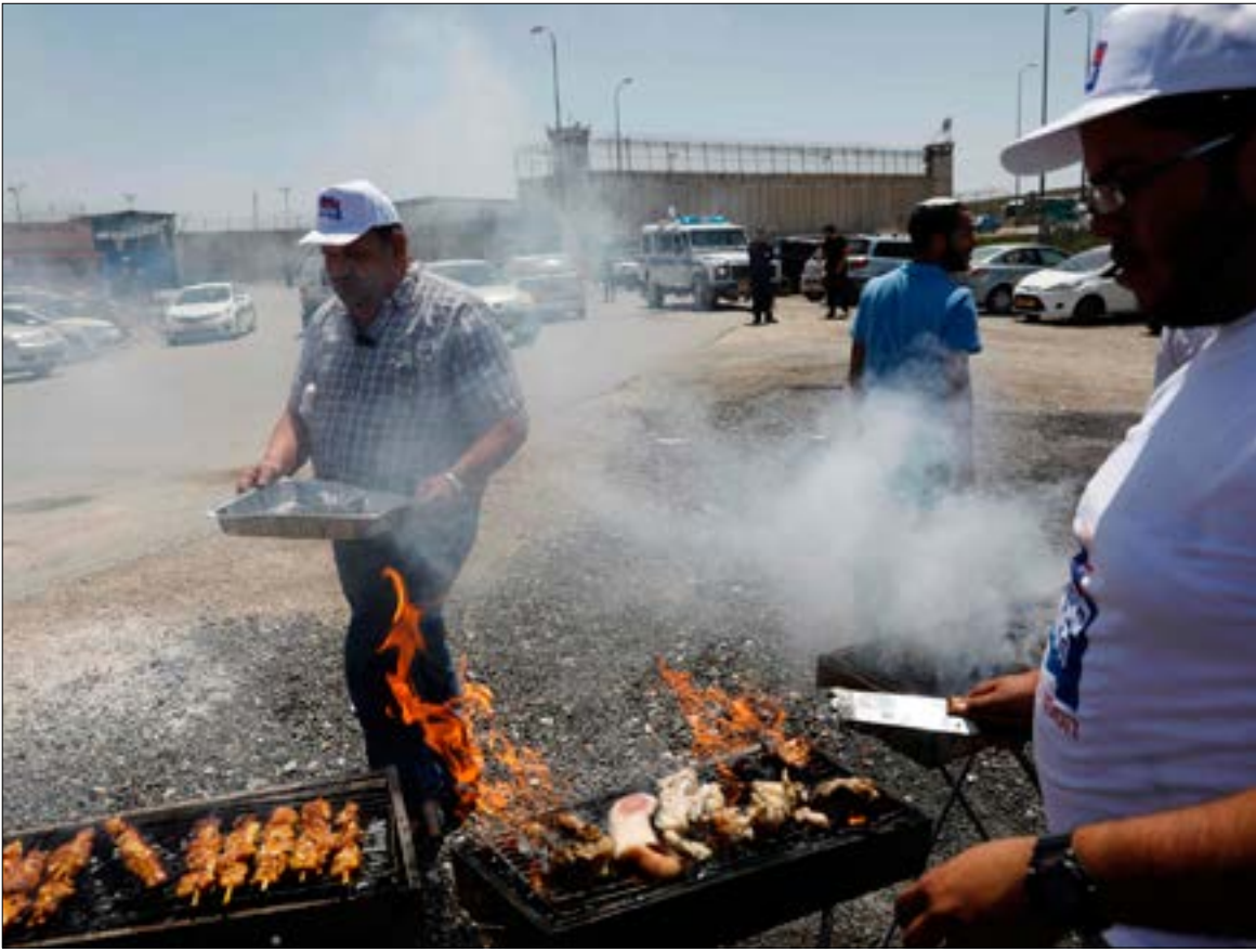
حاول المستوطنون بحماية الجيش استفزاز الأسرى المضربين بإقامة الشواء بجانب السجون