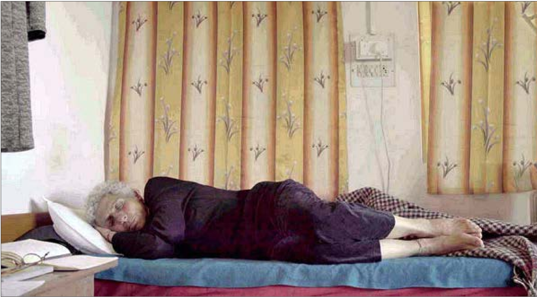
هنا «عزيزي» «الحيوان» (2016)

فنون معاصرة في معرضها الفردي الأول في بيروت، تلتقط الفنانة لحظات حاسمة ومفصلية في التاريخ المصري المعاصر. شريطها «زائر الليل - يوم أن تحصى السنين» (2011)، و«عزيزي الحيوان» (2016) يعرضان في «متحف سرسق» (الأشرفية) حتى 12 حزيران (يونيو) المقبل، ويستكشفان تبدل ملامح كثيرة في هوازين القوى وتشكّل الهويّات الفردية والجماعية بعد «ثورة يناير»