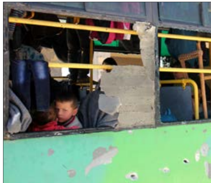
يخلف الإيحاء بالعودة إلى البلدتين من شخص لأخر

أهوالك شائعة مر بها أهالي كفريا والفوعة الخارجين من وجم الحصار إلى حضن الدولة المقتد. فقد الأرض التي صمدوا فيها طويلاً، والتفجير الذي استهدفهم في حي الراشدين في حلب، وفوضى استقبالهم في مراكز الإيواء بين حلب وحمص واللاذقية، زادت من المهم وحينهم إلى بلداتهم