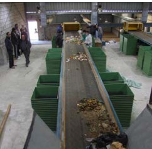
معمل عين بعلك في تجاربه الاولى

المشاركين في لقاء تشاوري لعرض دراسة تقويم الأثر البيئي لتطوير المعمل ورفع قدرة إنتاجه الذي دعا إليه اتحاد بلديات قضاء صور أمس. تلك الخلاصة ليست شرطاً طارئاً لإنجاح المعمل، بل إن الدراسة الهندسية والبيئية والتقنية التي وضعت لإنشاء المعمل عام 2004، تقوم على الفرز من المصدر.