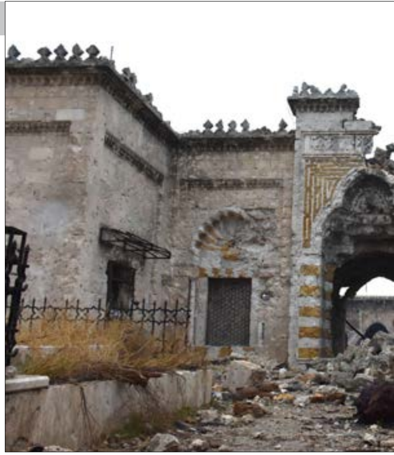
العريقة. أما سوق «بؤابة القصب» التاريخي القريب، فهو في حال جيدة. كان السوق يضم محال وورش تصنيع مفروشات منزلية، وقد عاود بعضها نشاطه أخيراً.

الجامع الأموي يُقسم الضرر اللاحق بالجامع الأموي