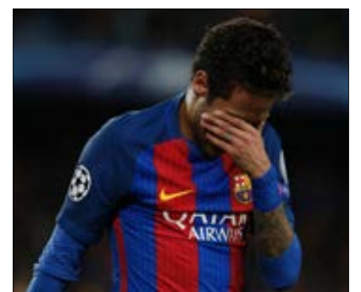
نيمار يبكي بعد خروج برشلونة من دوري الأبطال

بطبيعة الحال، تصدّر خروج برشلونة من ربع نهائي دوري أبطال أوروبا أمام يوفنتوس الإيطالي عناوين الصحف الإسبانية بشقيها الكاتالوني والمدريدي. وعنوان صحيفة «سبورت» الكاتالونية: «وداع مشرف»، مصحوباً بصورة للبرازيلي نيمار وهو يبكي حزناً على الخروج بعد أن خسر الفريق ذهاباً بثلاثية نظيفة، فيما انتهى الإياب بالتعادل السلبي. وأشارت الصحيفة إلى أن «البرسا» حاول جاهداً لكي ينتفض على «اليوفي»، ولكن لم تكن أمامه خيارات، وهجومه كان غير فعال، فيما اختارت