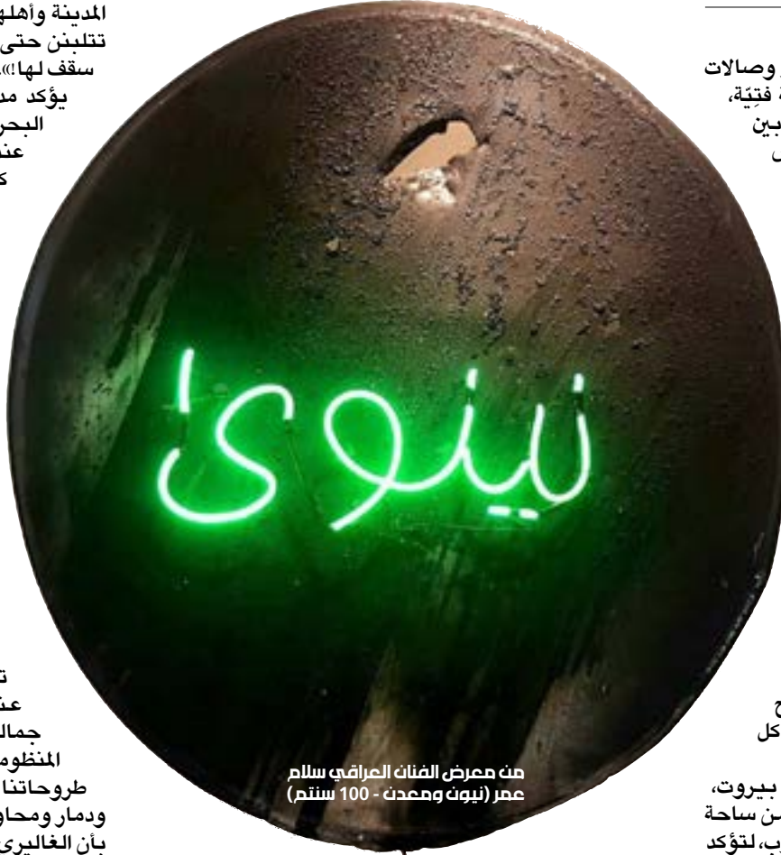
من معرض الفنان العراقي سلام عمر (نيون ومعدن - 100 سنتم)

«بيروت مدينة لا سقف لها. هي تتحمل الجميع!» يجيبنا الفنان العراقي القدير أحمد البحراني عندما نسأله عن سبب إصرار كل الفنانين العرب، وتحديداً العراقيين، أن يمرّوا من خلال بيروت. ويضيف: «الفنان العربي يأخذ ختم نجاحه من بيروت. ميزة هذه