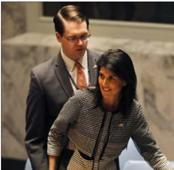
هالي: أميركانت تقف صامتة

انتهى إليها الاتفاق. إذ إن انتقال المسلحين المعارضين والسكان من بلدتي الزيداني ومضاي، يعني أن سيطرة الجيش السوري، ومعه حزب الله، على الحدود المشتركة مع لبنان من الشمال الشرقي الى المصنع باتت كاملة.