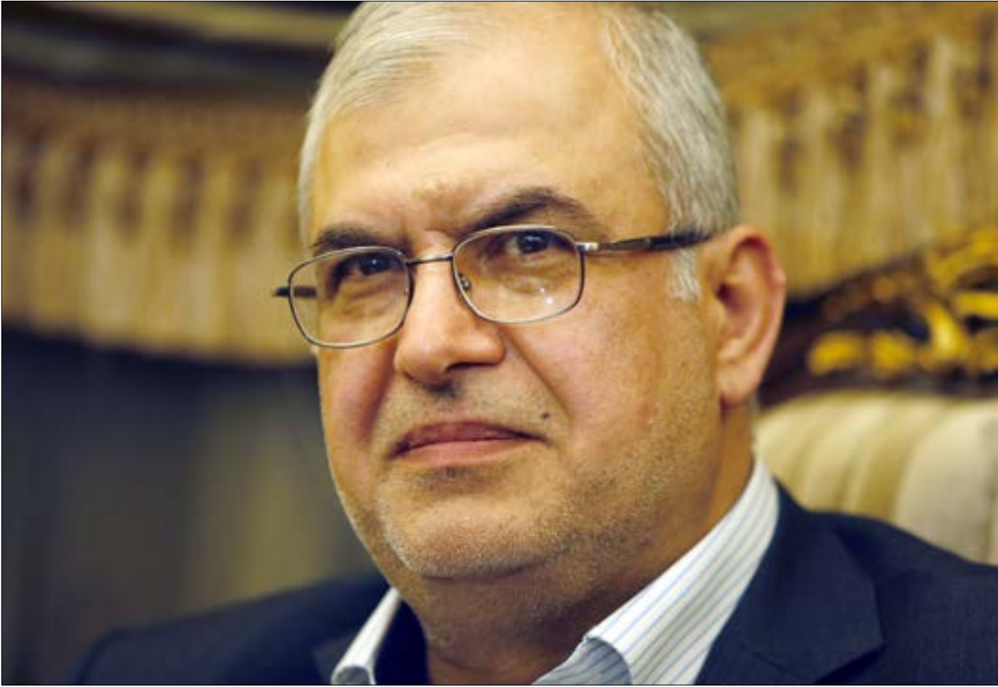
رعد: كل صيغ القانون المختلط ستكون نتيجهما بات ناكل حقا احدهما

هل تشهد الأيام المقبلة فتح ثغرة في جدار الأزمة تسمح بالتوصل إلى قانون جديد للانتخابات النيابية، يعتمد النظام النسبي؟ حتى يوم أمس، كانت كل المواقف تشير إلى أن الأفق مسدود. لكن رئيس كتلة الوفاء للمقاومة النائب محمد رعد، كشف معطيات جديدة. ففي خطاب له في بلدة زوطر الشرقية في الجنوب، قال رعد: «خلال أيام - إذا صدقت النيات - فسيتم الانتهاء من القانون الانتخابي. وإنما في ربع الشوط الأخير من إنجازهم». وعبر رعد بصراحة عن رفض كل صيغ القانون المختلط، قائلاً: «كل صيغ القانون المختلط حتى لو نجحت صيغة منها ستكون نتيجهما بكل بساطة وصراحة بأن ناكل حق أحد