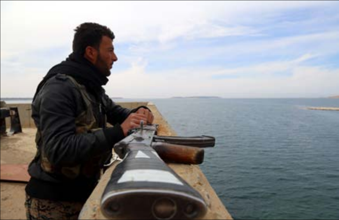
تنتظر فرقة هندسية عسكرية أميركية ضوءاً أخضر للبدء بإصلاح البنية التحتية للمطار (أ، ب)

تعيدات معركة «الرقة» الموعودة بلغت ذروتها مع سيطرة «قسد» مدعومة بقوات أميركية وبريطانية. على مطار الطبخة. وتستعد فرقة أميركية لإعادة تأهيل المطار تمهيداً لضخه إلى قائمة المواقع المحتلة أميركياً تحت اسم «قواعد عسكرية لمحاربة الإرهاب». وبالتزامن يستمر الإعداد لـ «الطبخة السياسية» الملائمة لمعارك الشرق السوري بأكمله. فيما تتزايد فرص «القدرلة» في التحول إلى حقيقة تفرضها «قوة الأمر الواقع»