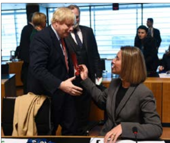
بدا الشرط الأوروبي لتمويل إعادة الإعمار متاخراً عن الرؤية الأميركية (أ، ب)

حدوث انتقال سياسي فعلي، متأخراً عن الرؤية الأميركية التي لا تتطرق حالياً وعلناً إلى أي ملف سوى الحرب ضد «داعش» وإضعاف نفوذ إيران في سوريا. وعلى هامش اجتماع أسس في لوكسمبورغ، توافق عدد من وزراء خارجية الاتحاد الأوروبي على أنه لا يمكن للرئيس الأسد البقاء في السلطة في ختام المرحلة الانتقالية السياسية. وأشار وزير الخارجية الفرنسي جان مارك إبرولت إلى ضرورة «حصول انتقال سياسي فعلي، وعند انتهاء العملية السياسية... لا يمكن لفرنسا أن تتصور أن سوريا هذه يمكن أن يديرها الأسد». وأضاف أنه «لن يكون هناك سلام دائم بما يشمل مواجهة الإرهاب من دون عملية سياسية». ومن جهتها، قالت مفوضة السياسة الخارجية في الاتحاد الأوروبي، فيديريكا موغيريني، إنه «بعد ست سنوات من الحرب، يبدو من غير الواقعي تماماً الاعتقاد بأن مستقبل سوريا سيكون تحديداً كما كان عليه في السابق. لكن يعود للسوريين أن يقرروا». وولفت وزير الخارجية الألماني، زيغمار غابرييل، إلى نقطة مهمة قد تفرض حضورها