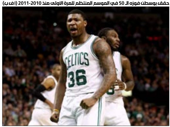
حقق بوسطن فوزه الـ 50 في الموسم المنتظم للمرة الأولى منذ 2010-2011

ويدين حامل اللقب بفوزه ليبرون جيمس الذي سجل 41 نقطة، بينها