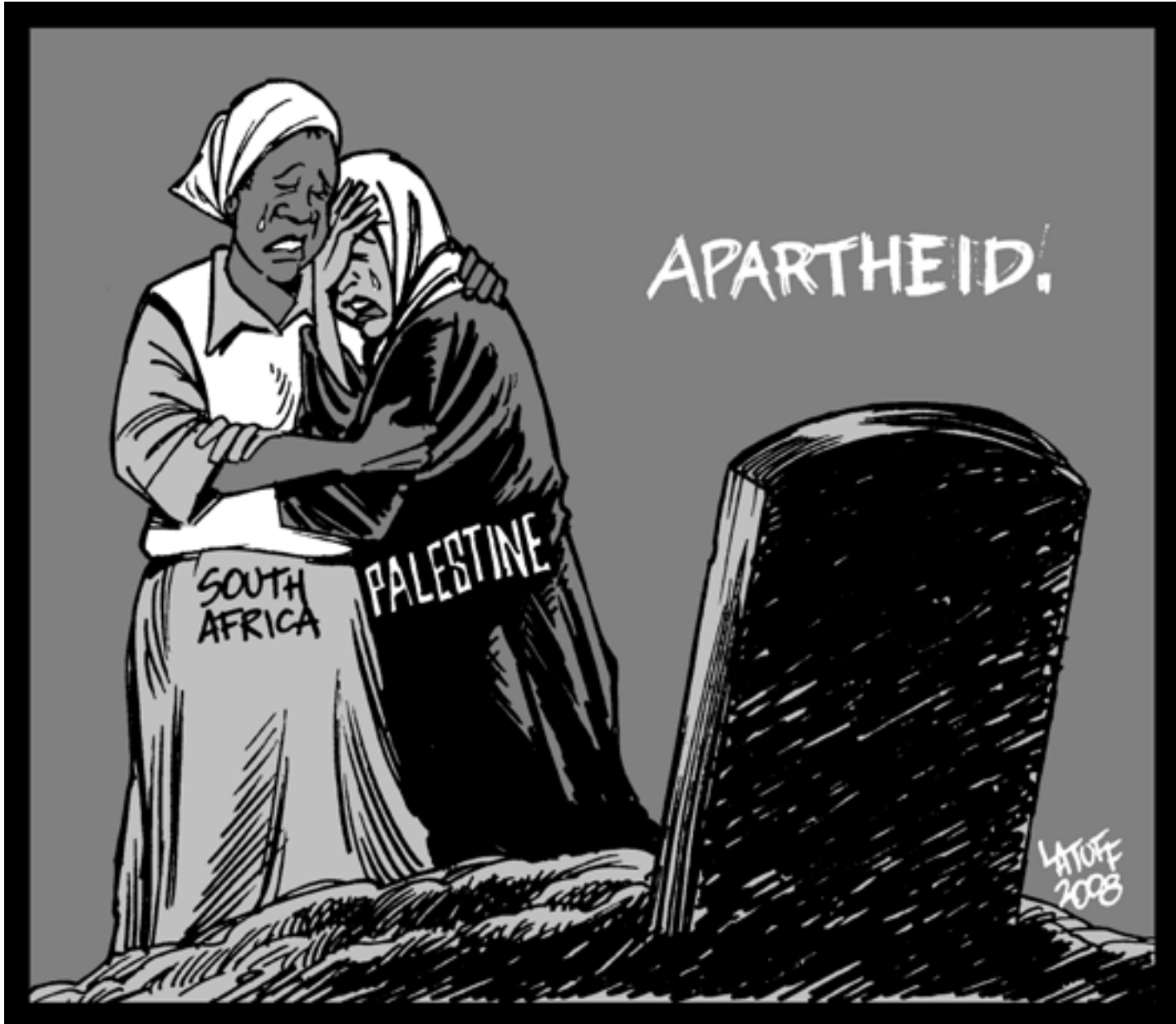
لطوف - البرازيل

تحت شعارات فضفاضة على شاكلة «الانفتاح على الآخر» و«الوحدة» و«مد جسور السلام والتواصل»، يتحضر قضاء مدينة جبيل اللبنانية الساحلية (شمال بيروت)، في الصيف، لاستقبال مهرجان «تومورولاند» (أرض الغد)، الأكبر من نوعه عالمياً في مجال الموسيقى الإلكترونية. الحدث الشهير ينتظره كثيرون من اللبنانيين بحماسة وشغف كما يبدو على مواقع التواصل الاجتماعي، خصوصاً أنه يجري في لبنان للمرة الأولى، إذ قال أحدهم على فيسبوك: «أضخم نشاط من نوعه قادم إلى إحدى أقدم مدن العالم».