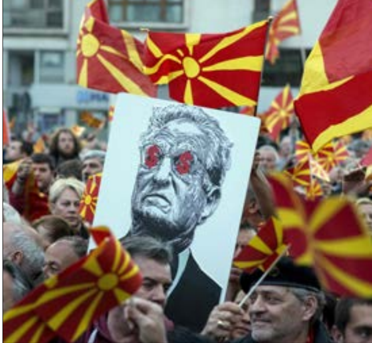
تظاهر الآلاف تنديداً بمشروع يعتبر الألبانية لغة رسمية في مقدونيا

إعلان الرئيس الصربي استعداده «شخصياً» للدخول مع جيشه إلى شمال كوسوفو في حال تعرضت الأخيرة للمواطنين الصرب. إلا أن «القشة التي قصمت ظهر البعير» كانت إعلان الرئيس الكوسوفي هاشم تاجي، عزم بلاده، على الرغم من تحذيرات «الناتو» والولايات المتحدة، إنشاء «جيش وطني من 5000 عنصر»، في خطوة أثارت غضب صربيا، التي قال سفيرها لدى موسكو سلافينكو تيرزيتش، إن «غايتها الجيوسياسية تصب في مشروع ألبانيا الكبرى». ووفق مراقبين، فإن السلطة الفاسدة في كوسوفو، تسعى، من خلال زعزعة الأمن والاستقرار بحجة «حماية السيادة»، لإنقاذ نفسها من ثورة