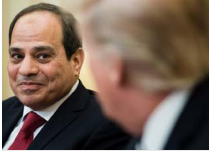
كان مسؤوول اميركي قد أكد ان مسالة حقوق الإنسان ستثار مع السيسي