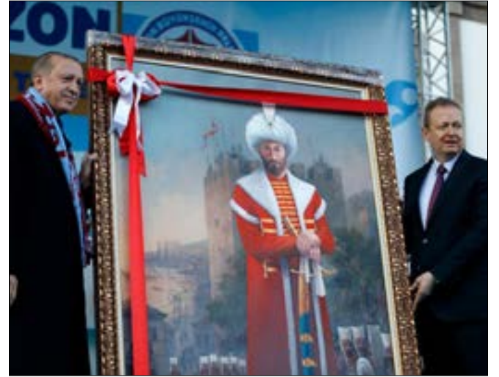
لوحة للسلطان محمد الفاتح هدية والي طرابزون لأردوغان أمس

رفع الرئيس التركي مرة جديدة، أمس، من حدة مواقفه تجاه الأوروبيين، مضيفاً إلى مفرداته عبارات يصعب قولها من قبل زعيم دولة كانت ترغب في الانضمام إلى الاتحاد الأوروبي