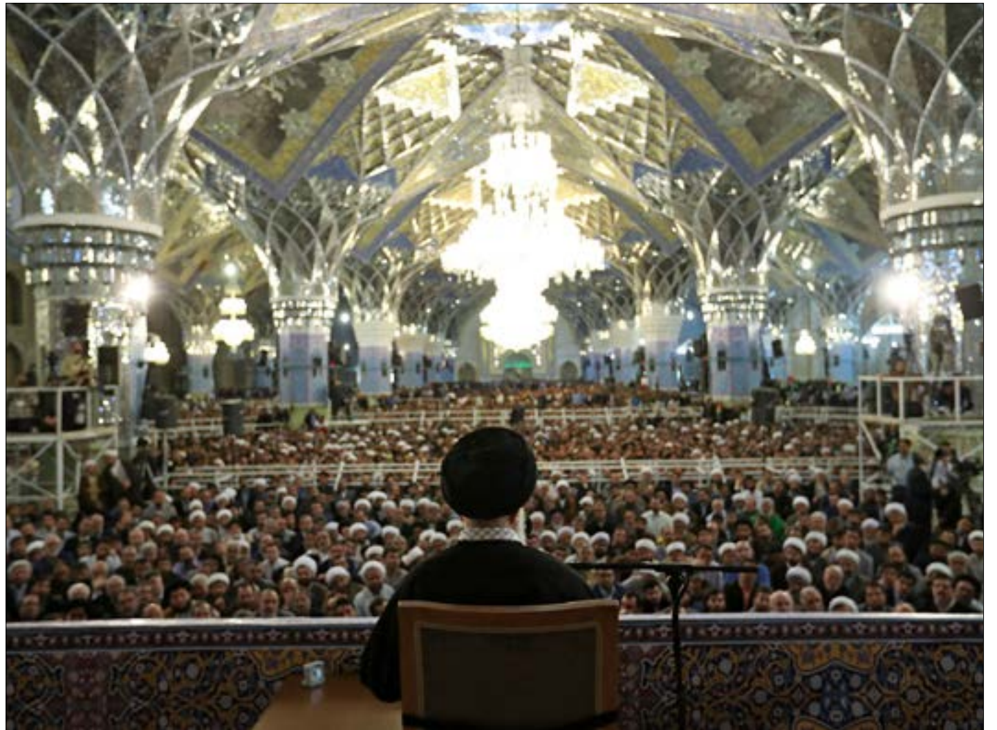
خامنئي: هذا العام مهمّ نظراً إلى الحاجة لتحرك اقتصادي وللاستعدادات الرئاسية والبلدية

قد يسير الخليجيون، وخصوصاً الرياض، ضمن مخططات ترامب، فهي تفيدهم. إذ هم يتعاملون هذه المرة مع إدارة في البيت الأبيض مستعدة للتدخل الجدي والمباشر في الشرق الأوسط، وهي من هذه الناحية مخالفة في توجهاتها لإدارة باراك أوباما. أما بخصوص القاهرة، «فلغاية الآن، لم نستشعر ضغوطاً أميركية جدية علينا... هناك أحاديث،