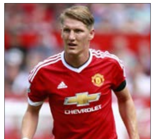
سيلعب شفافينشتايفر في صفوف شيكاغو فاير

تصدر قائد منتخب ألمانيا السابق باستيان شفافينشتايفر العناوين، أمس، بعدما أعلن تركه مانشستر يونايتد الإنكليزي وانتقاله إلى فريق شيكاغو فاير الأميركي. وظهر شفافينشتايفر (32 عاماً) وهو يتحدث في صفحته على موقع 'تويتر'، قائلاً: 'أصدقائي في مانشستر يونايتد، قررت الانتقال بشكل دائم إلى شيكاغو فاير. كنت أمل تحقيق المزيد لكم، لكن حان وقت التغيير بالنسبة إلي'. ولم يكن شفافينشتايفر هذا الموسم ضمن حسابات المدرّب البرتغالي جوزيه مورينيو. وأضاف بطل العالم مع منتخب ألمانيا 2014: 'شكراً لدعمكم