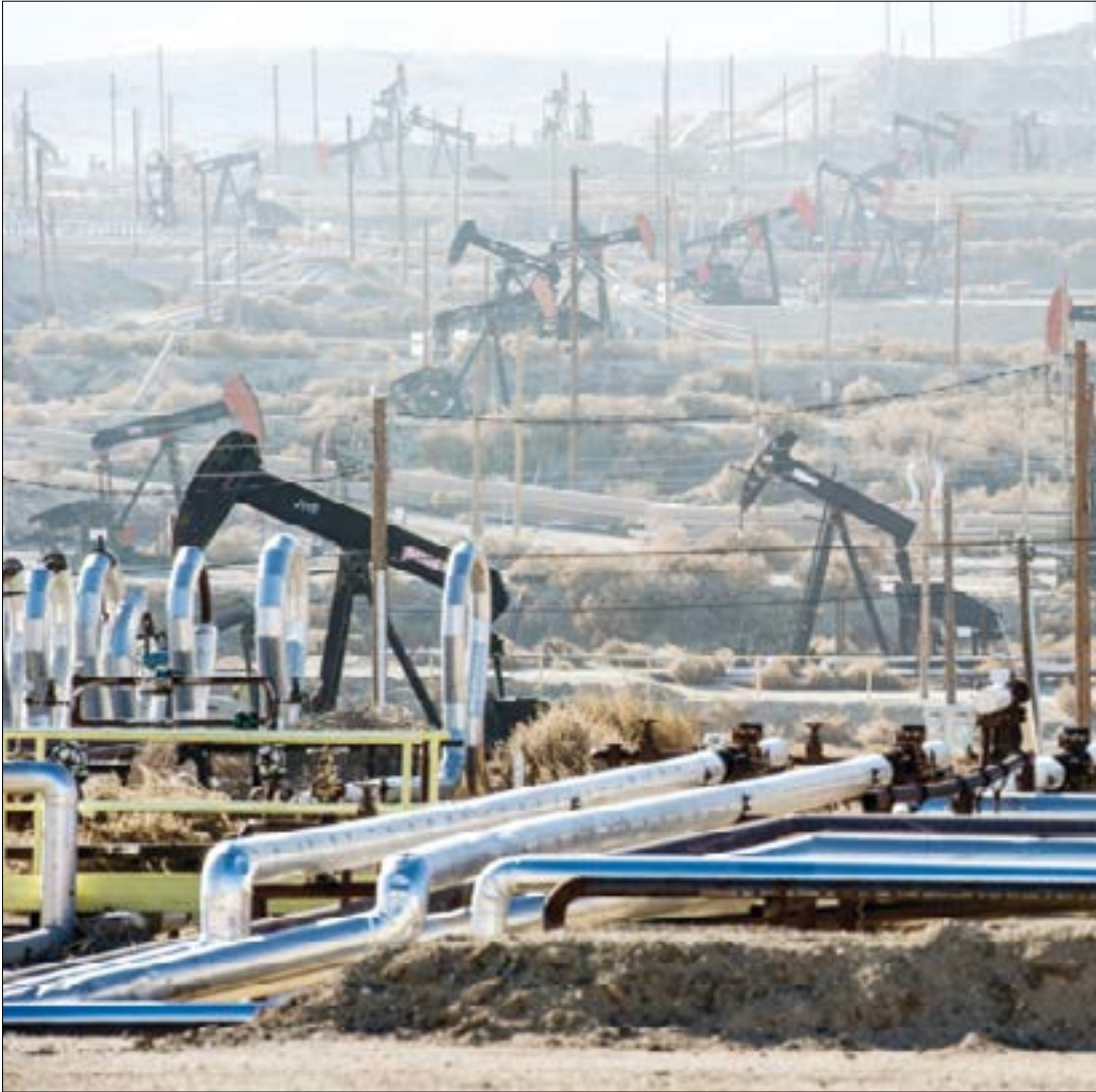
تقييم الاستفادة من الثروة النفطية لن يتحقق قبل 10 سنوات (ارشييف)