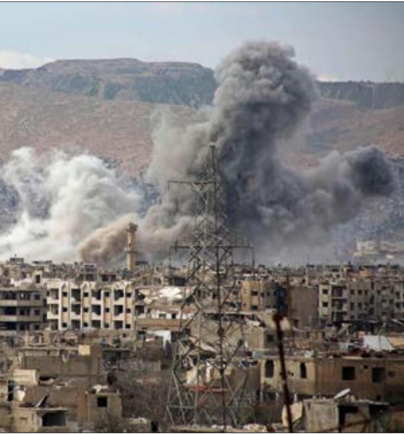
أسهمت سيطرة المسلحين على «معمل الغزل» في تعزيز حالة القلق في الأحياء المجاورة

تخوض «هيئة تحرير الشام» معارك في عدد من جبهات الميدان. ترافق وحملات إعلامية ضخمة تحقّق «مكاسب» افتراضية لا تعكس ما يجري على أرض الواقع. ومع استمرار الاشتباكات في أطراف جوبر والقابون، دون نجاح المسلحين في فك حصار القابون وبرزة، أطلقت «الهيئة» معركة جديدة شمال مدينة حماة، حاشدة خلفها فصائل المعارضة. لتثبت حضورها وسيطرتها على جبهات الميدان السوري