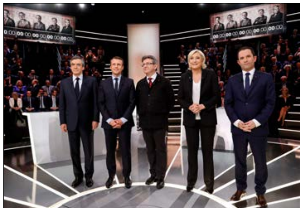
اعتبرت لوموند، أن ملنشون كان الفضل والأكثر تماسكاً (أضرب)

واعتباره الأكثر قدرة على هزيمة مارين لوين، بدأ بإثارة المخاوف من حصول زلزال سياسي غير متوقع. إذ يُخشى أن يسفر الاقتراع عن مفاجآت مغايرة تماماً لتوجهات الاستطلاعات، على غرار ما حدث في استحقاقات رئاسية فرنسية سابقة. ففي عام 2002، كانت استطلاعات الرأي تتوقع أن تدور المنافسة أساساً بين جاك شيراك وليونيل جوسبان، وألا ينال رئيس «الجبهة الوطنية» حينها، جان ماري لوين، سوى 10 في المئة من الأصوات. لكن زعيم اليمين المتطرف نال ضعف تلك النسبة، ما تسبب في إقصاء المرشح الاشتراكي منذ الدورة الأولى. وكان هامش الخطأ الذي وقعت فيه الاستطلاعات أكثر فداحة في انتخابات الرئاسة لعام 1995، إذ كانت تتوقع أن تنحصر المنافسة بين ليونيل جوسبان وإدوار بالادور، وألا ينال شيراك سوى 5 في المئة من الأصوات. لكن الأخير اكتسح صناديق الاقتراع،