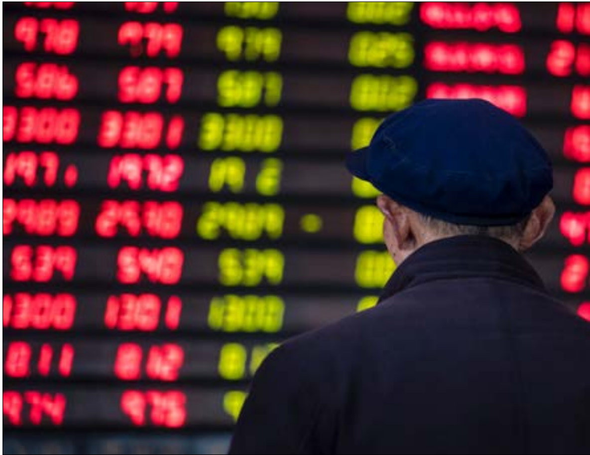
ينبغي، لتحقيق التنمية، اعتماد إجراءات هي نقيض تلك التي صالت المؤسسات الدولية بها، منذ مطلع الثمانينيات (أضرب)

هذا الخيار، أكثر مما أملت الطبيعة النيو-باتريمونيالية لهذه الأخيرة (المصدر نفسه: 199).