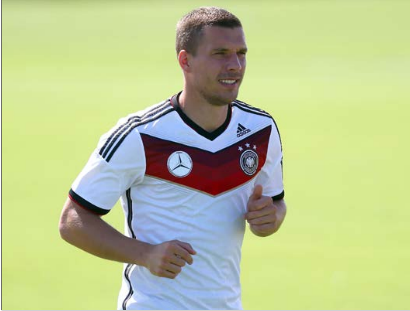
سيفيق مونديال البرازيل الذكرى الأجل لبودولسكي مع ألمانيا

تبرز الليلة المباراة الدولية الودية بين ألمانيا وضييفتها إنكلترا على ملعب 'سيغنال إيدونا بارك'. وهنا برنامج المباريات (بتوقيت بيروت): كمبوديا × الهند (09,00 صباحاً) اليمن - فلسطين (13,00) الفلبين - ماليزيا (13,30) تشيكيا - ليتوانيا (19,00) ألمانيا - إنكلترا (21,45) اسكتلندا - كندا (21,45).