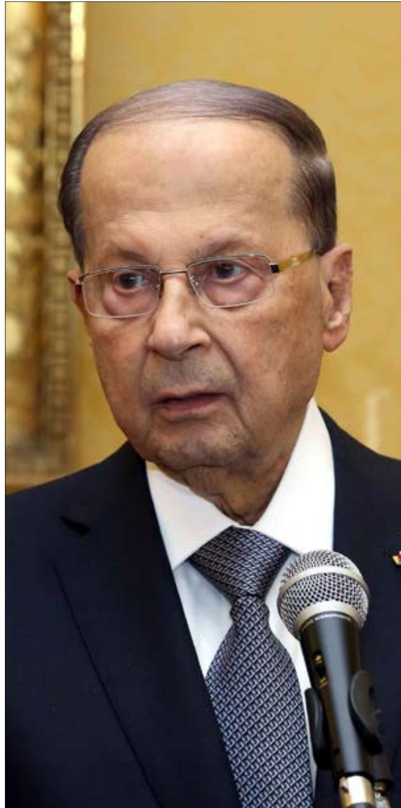
«أزمة» تصريحات عون حول حزب الله مستمرة؟

تعرض بانون وميرسر في الماضي إلى اتهامات بمعاداة السامية، ويقول البعض أنّ بانون قد شعر بالغرابة (كمسيحي أبيض، جنوبي ومحافظ ومن خلفية عسكرية) في مجتمع وول ستريت «اليهودي الطابع»، وأن هذه التجربة السيئة كانت من أسباب حنقه على المصرفيين. في تفسير هذه المعركة بين النخب الأميركية، يقول صديق - هو طبيب وباحث في بوسطن - أنّ نخبة ترامب وأفكارها تشبه السردية الخلدونية عن قائد سلالة متأخر، جاء وسلالته في حالة انحدار وتراجع، وهو يؤمن بأنه سيقدر على استعادة أمجاد أجداده عبر إحياء العصبية المؤسسة. في هذا التشبيه، يعتبر ترامب وبانون أنّ «العصبية المؤسسة» في أميركا هي نخبتها البيضاء