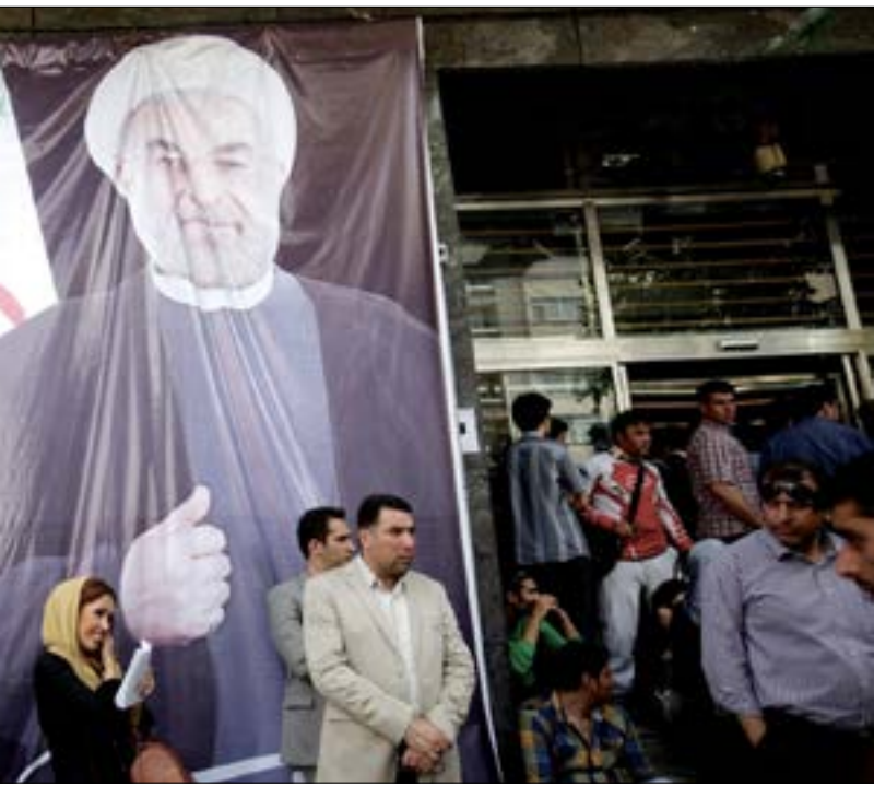
يتمركز الجدل السياسي «لشورى» الإصلاحيين، حول نقطتين (عن الويبي)

مع اقتراب موعد الانتخابات الرئاسية الإيرانية في 19 أيار المقبل، بدأ المشهد يتضح شيئاً فشيئاً. وعلى الرغم من أن التيار المحافظ لم يحدّد مرشحيه بعد، إلا أن التيار الإصلاحي أبدى دعمه للرئيس حسن روحاني، ولكن ضمن هذا التيار هناك خطط مختلفة لتقديم هذا الترشيح