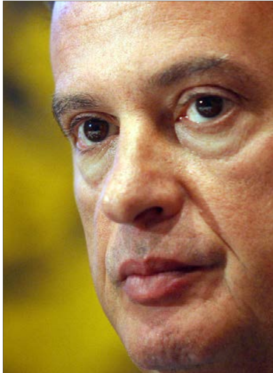
الإصدار أظهر «هفرة» في عرض الدولارات وليس سناً بحسب المزاعم (هيلم الموسوي)

(الشريحة الثانية) من 7,12% إلى 7%، نظراً إلى الطلب الكثيف عليها، إذ إنَّ هذا العائد لا يزال مغرباً جداً مقارنةً بمعنّلات الفائدة المنخفضة في الأسواق العالمية. شكّل هذا "الضربة القاضية" لمعظم التبريرات التي أعلنها حاكم