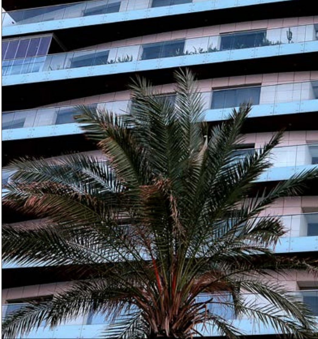
الضرائب على الشقق الشاغرة تحدّ من المضاربة العقارية (هيلم الموسوي)

«بروباغندا الركود» و«البيع القليل» التي يروّج لها المستثمرون في قطاع العقارات، تدحضها الأرقام نفسها، إذ بلغت أثمان عقود البيع المسجلة في الدوائر العقارية نحو 12,6 ألف مليار ليرة في عام 2016 (8,5 مليارات دولار)، وهو رقم مرشح للارتفاع كونه لا يشمل البيع على الخريطة ولا العقود بموجب وكالات بيع التي لا يجري تسجيلها فوراً، والمقدرة بنحو 2,5 مليار دولار أميركي، ليصل مجموع البيوعات العقارية إلى نحو 11 مليار دولار في عام 2016، تشكّل الأرباح نصفها، على الأقل، أي نحو 5,5 مليارات دولار. وهو رقم ثابت منذ خمس سنوات، إذ بلغت نحو 8 مليارات دولار في عام 2015، و9 مليارات في عام 2014، و8,8 مليارات في عام 2013، و8,9 مليارات دولار في عام 2012، و8,8 مليارات في عام 2011 و9,3 مليارات دولار في عام 2010 (تاريخ ذروة الفورة العقارية). وهي بيوعات بأحجام هائلة متغلّطة منذ أعوام من أي ضريبة على الأرباح، فيما يجري استيفاء رسوم تسجيل من المشترين وضرائب الأملاك المبنية من الشقق المأهولة وتُغى منها الشقق الشاغرة التي تجري المضاربات على أسعارها.