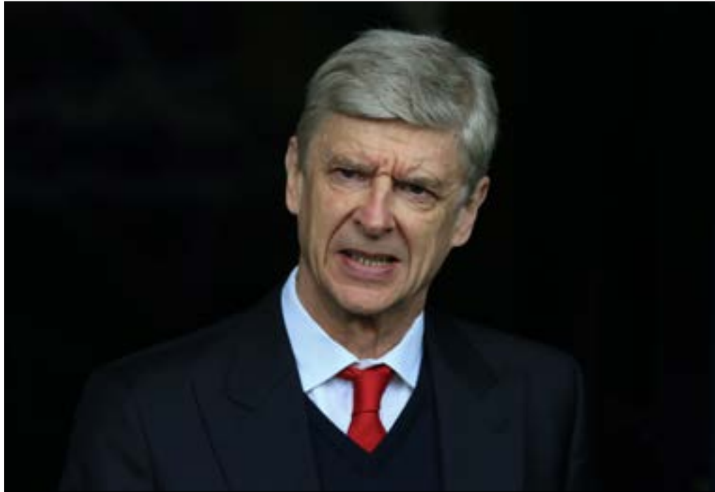
سيلت ارسنال ووينغر القرار في الوقت المناسب وبالطريقة المناسبة