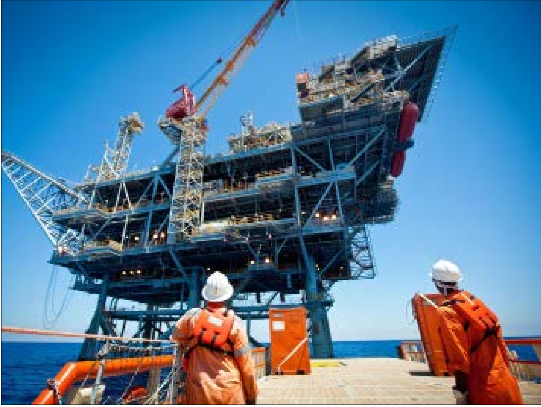
تستند إسرائيل في طلبها هذا إلى وجود ثلاثة من هذه البلوكات بمحاذاة «حدودها البحرية» (الأخبار)

قرر كيان العدو الإسرائيلي إصدار قانون لترسيم الحدود البحرية لفلسطين المحتلة. ليضم جزءاً من المنطقة البحرية اللبنانية تحت احتلاله. وسرّب بأنه طلب من الولايات المتحدة والامم المتحدة الضغط على لبنان لوقف دورة تراخيص التنقيب عن النفط في البلوكات اللبنانية الجنوبية. بذريعة وجود نزاع على جزء منها. موقفاً رأت فيه مصادر لبنانية رسمية «محاولة لا تقدّم ولا تؤخر للتشويش على الإطلاق، التاجح لدورة التراخيص في لبنان». لكن في الواقع، يتّجه العدو عبر خطوته، إلى تثبيت التزام على مساحة تبلغ أكثر من 800 كلم مربع من المنطقة الاقتصادية الخالصة الواقعة قبالة شواطئ الجنوب