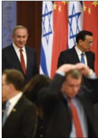
برفقة نتنياهو 90 رجل أعمال وهو أكبر وفد اقتصادي إسرائيلي يزور الصين

ويقوم نتنياهو بزيارة للصين تستمر ثلاثة أيام، وذلك لمناسبة مرور 25 عاماً على إقامة علاقات دبلوماسية بين البلدين. ومن المتوقع أن يلتقي، اليوم، الرئيس الصيني شي جين بينغ. ويرافق نتنياهو 90 رجل أعمال، وهو أكبر وفد اقتصادي إسرائيلي يزور الصين، بحسب التلفزيون الصيني الرسمي. والتقى الوفد الإسرائيلي بالرؤساء التنفيذيين للعديد من الشركات الصينية الكبرى، مثل عملاق الإنترنت "بايدو" و"علي