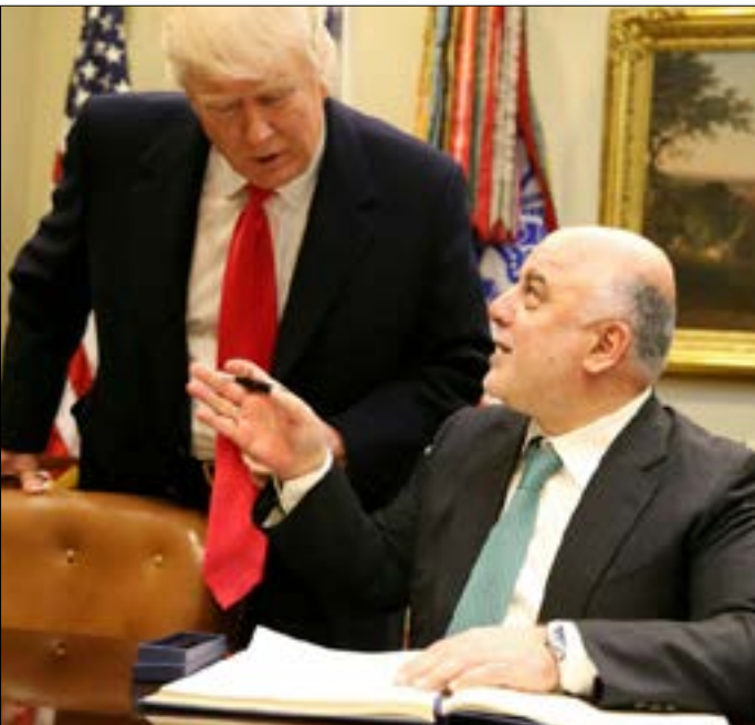
ترامب: شكّلت إيران إحدى قضايا المحادثات

وبرغم حديث العبدي عن وعود ترامب له بزيادة «الدعم»، فإن أليات ذلك تبقى محل تساؤلات، خاصة لأن اقتراح ترامب للموازنة الأميركية يشمل تقليصاً يناهز 30 في المئة من تمويل وزارة الخارجية والوكالة الدولية للتنمية، وذلك