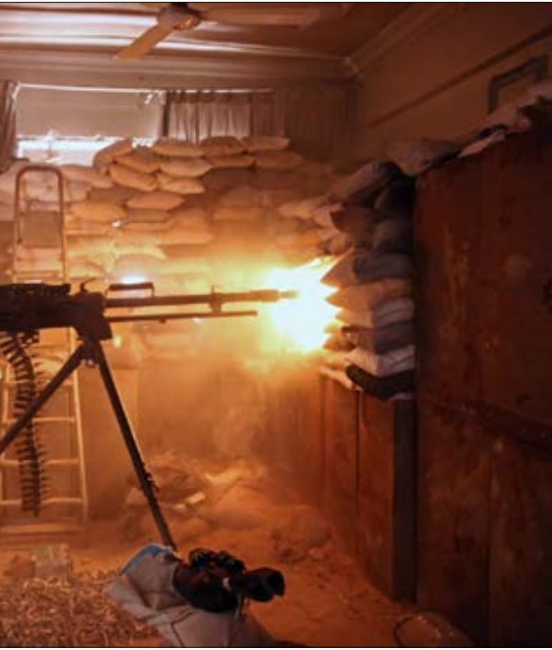
اشتبك هجوم الجيش المضاد خطط كسر الحصار عن القابون وبرزة (أ، ب)

تعمل موسكو على إدارة التجاذبات في الشمال السوري، ورسم خطوط واضحة للطرفين الفاعلة على الأرض ضمن إطار مشترك وهو ثق باتفاقات، في مساح منها للإخراج الصرام من الميدان إلى طاولات المحادثات. ويأتي إعلانها إقامة فرع لـ «مركز المصالحة» في عفرين كخطوة إضافية لتلك الجهود