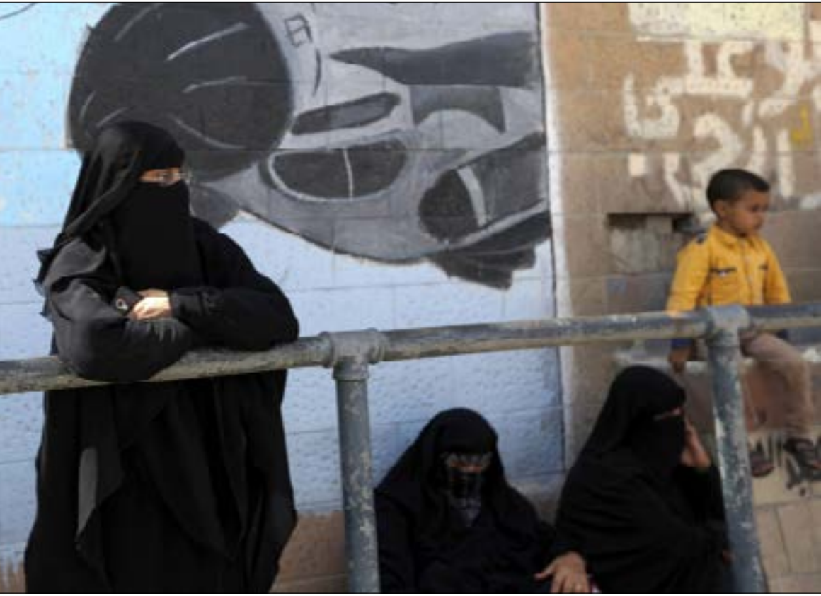
حاوّل السعوديون فصل المقاتلين اليمنيين داخل المملكة عن اتصالهم بالأراضي اليمنية

على الغلاف من كان يتخيل أن تتحوّل الحرب على اليمن إلى الساحة السعودية الداخلية؟ صحيح أن هذه التجربة عاشتها المملكة مع حركة «أنصار الله» سابقاً، لكن ليس بهذا الاتساع أو الصمود على الأرض. نحو عامين ولم تتمكن المملكة إلا من استعادة موقع واحد رغم كل محاولاتها