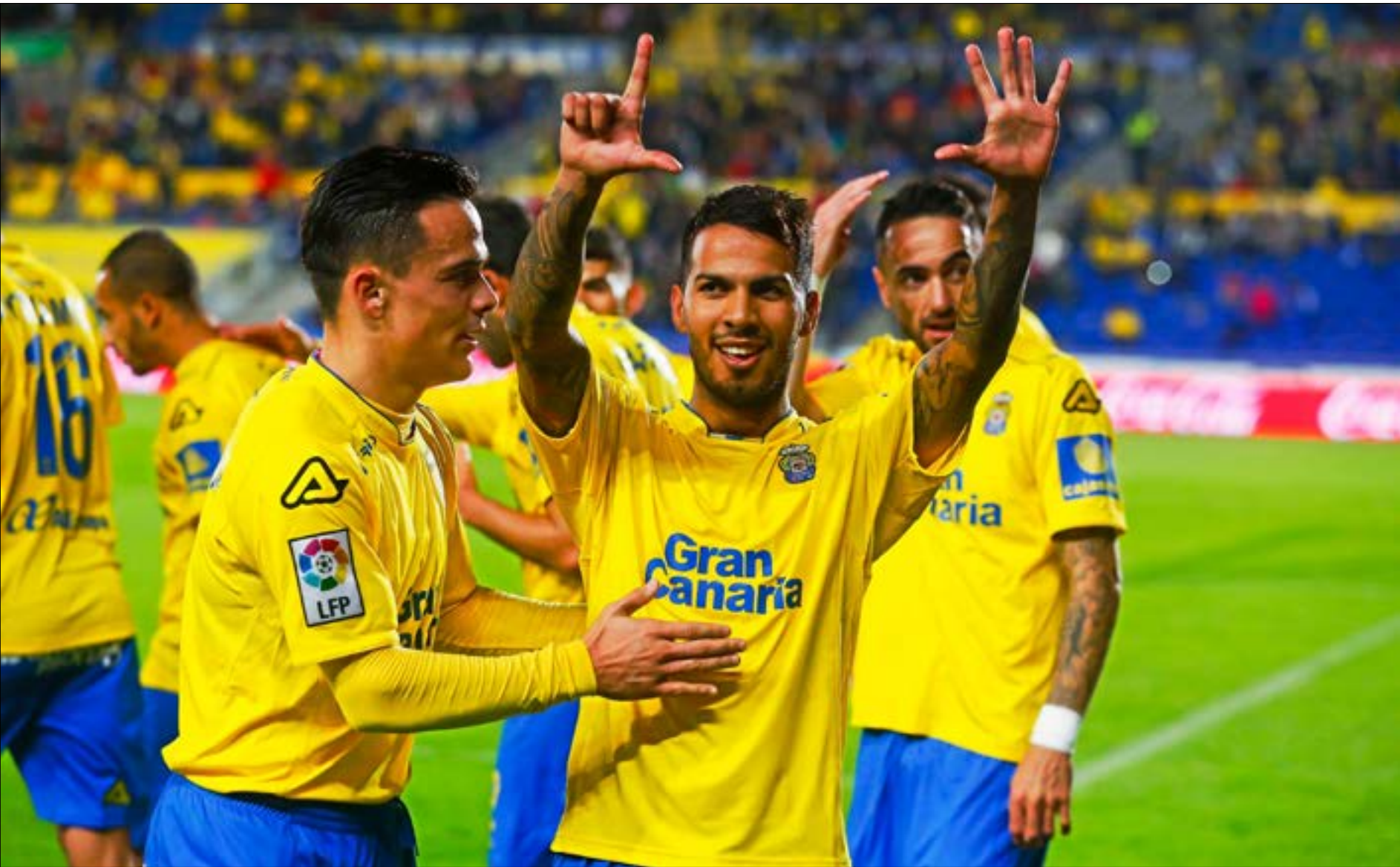
ضم لاس بالماس ستة لاعبين جدد هذا الموسم (اريفيف)

تحقيقها، لعل أبرزها التغلب في الجولة الأخيرة على فياريال 1-0، فيما أحرجوا الريال الذي تعادل معهم بصعوبة بالغة 3-3. في ذلك الأسبوع استعاد الفريق حسنه التهديفي، إذ سجل 8 أهداف في خمسة أيام. ما يعادل ما أحرزه الفريق على مدار 11 مباراة سابقة بين شهري كانون أول وشباط الماضيين. فبعد تعادله مع الريال تغلب على أوساسونا 2-5، ليستفيق في شهر آذار محققاً بعض النقاط ومخلصاً من محصلة شهر شباط الذي لم يحصد فيه أي نقطة.