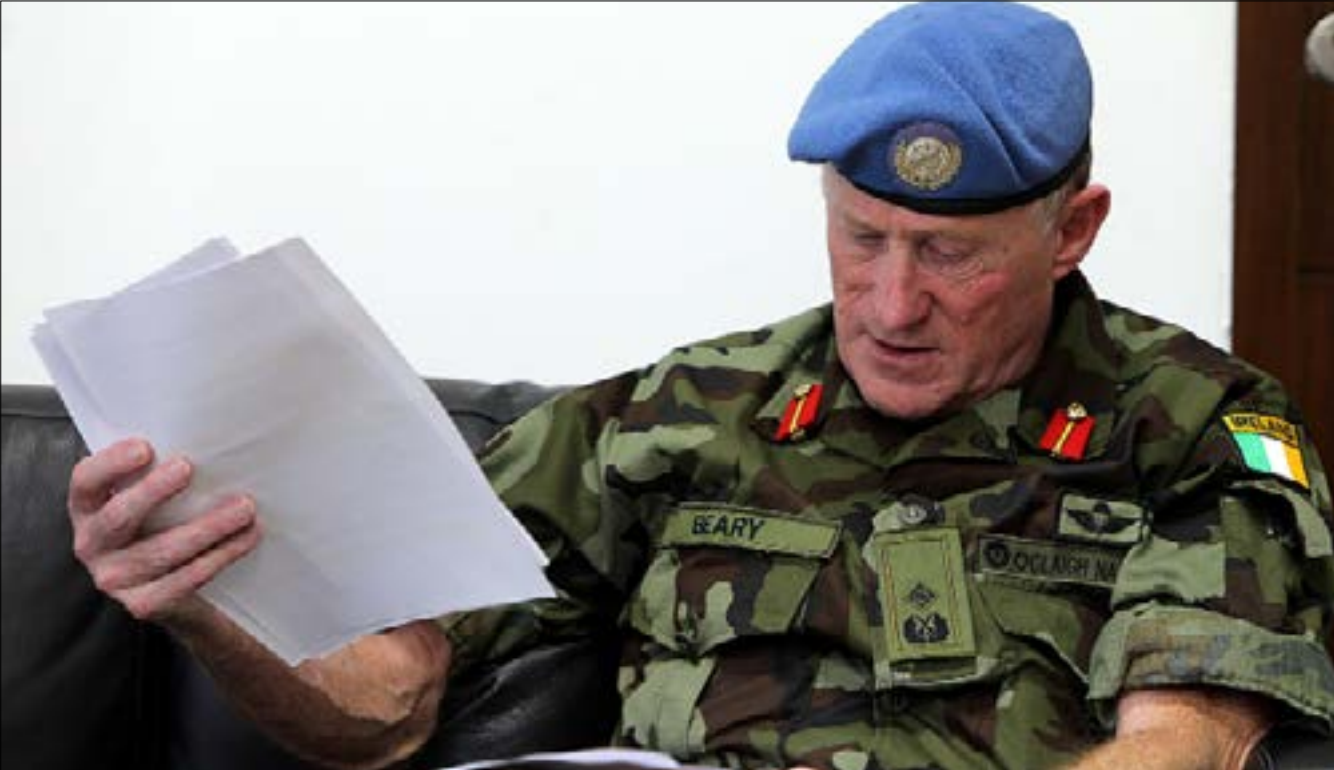
الرد على التهديدات الإسرائيلية ضد الرئيس عون خارج عملنا (هيلم الموسوي)

في مكتبه المطل على الخليج من رأس الناقورة حتى حيفا، ثبت قائد اليونيفيل مايكل بيرري أربع ساعات كبيرة على الحائط، أولها لتوقيت نيويورك حيث مجلس الأمن الدولي، وثانيها لدلغاني مسقط رأسه في إيرلندا، وثالثها لتوقيت قبائل الزولو في أفريقيا، ورابعها لتوقيت الناقورة التي تستوعبهم جميعاً. يخشى البعض أن يضيع الجنرال بين مواقيت العالم حتى يكاد ينسى أن مهمته وقواته وقرارات مجلس الأمن تمشي على توقيت الجنوبيين. في جنوب الليطاني، سُجلت تحولات سلبية متتالية منذ تولي بيرري منصبه في تموز الفائت. من دون سبب مباشر، قطع التواصل مع