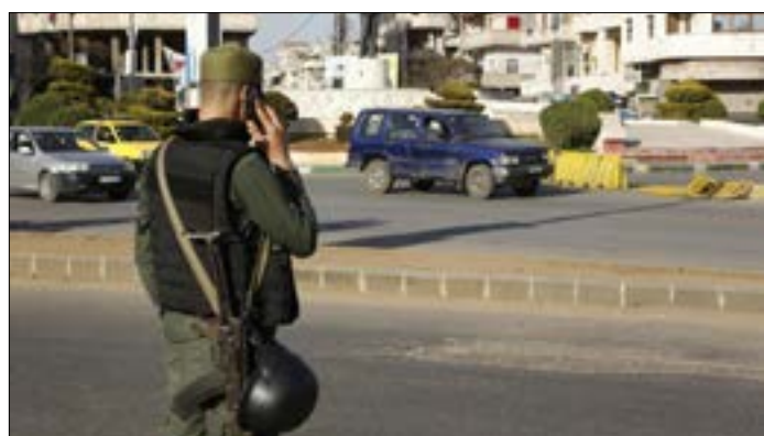
ستسلم الشرطة إلى جانب كتيبة من الشرطة السورية الروسية مرافق، الحي وحوالته (أ ف ب)

تهريب البضائع والمواد الاستهلاكية إلى داخل الحي تشكل مصالحة كبرى للمستفيدين من حصار الحي، تقف في وجه الحل أيضاً. ولدى محافظ حمص طلال البرازي الإجابات عن جميع النقاط المطروحة، إذ يعلق على العراقيل المذكورة بدبلوماسية، فيبرر الأمر بضرورة الصبر لمعالجة كل المشكلات التي تواجه الحل، في ظل إنجاز أكثر من 90% من بنود الاتفاق. ويضيف في حديثه إلى «الأخبار» أن بعض الفصائل في الحي يتمكنون تخريب الاتفاق ليتمكنوا من تشكيل عامل ضغط على الدولة السورية، بهدف التنازل عن بعض الشروط، وهذا ما لن يحصل، حسب تعبيره. وقبيل توجهه إلى اجتماع مسائي، بشأن تطورات ملف المفاوضات حول الحي، يرى المحافظ أن إنجاز الملف لا يتطلب أكثر من ساعات، إذ إن ما لم ينجز بعد متعلق بالزمن اللازم لتطبيق كافة البنود، إضافة إلى الوقت الذي يتطلبه إنجاز التسويات. ويحدد عدد المسلحين داخل الحي بما لا يقل عن 1500، وفي حال