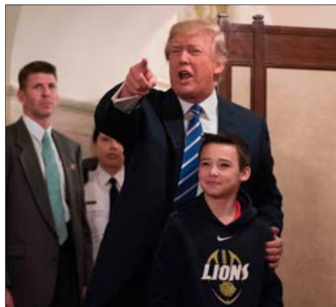
بحث مستشارو ترامب الاكتفاء بعقد لقاء ثلاثي مع عباس و نتنياهو

يبدو أن الرئيس الأميركي دونالد ترامب وجد وقتاً، في جدول أعماله المزدحم بالتحديات الداخلية، للبدء بخطوات أولى على طريق استكشاف آفاق محاولة تحريك المسار الفلسطيني. ضمن هذا الإطار، يندرج الاتصال الهاتفي بينه وبين رئيس السلطة محمود عباس. لكن بات واضحاً، كما كان مقدراً، أن أي مسار مفترض ما زال مضبوطاً بالثوابت الإسرائيلية التي كان تعاني من مفاعيلها السلطة الفلسطينية. فقد أوضح بيان عن البيت الأبيض، في أعقاب الاتصال، أن «اتفاق السلام يجب أن يكون نتاج مفاوضات مباشرة بين الطرفين، وأن الولايات المتحدة سترافق القادتين الإسرائيلية والفلسطينية بشكل وثيق، من أجل تحقيق التقدم نحو هذا الهدف، لكن لا