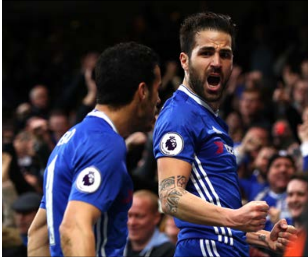
حقق بيدرو وفابريغاس أرقاماً مميزة مع تشلسي (أرشيف)

وبالتحديد في الدوري المحلي الذي يتصدره بفارق 10 نقاط عن أقرب ملاحقيه. لعل مباراة الـ 0-4 كانت انطلاقة تشلسي نحو استمرارية التألق، إذ فاز بعدها بـ 13 مباراة متتالية. لا شك في أن تشلسي الذي اهتزت شبكته 20 مرة فقط هذا الموسم في الدوري المحلي يحوز بالشراكة مع توتنهام لقب أقوى خط دفاع في البطولة. هذه الإيجابية تقابلها