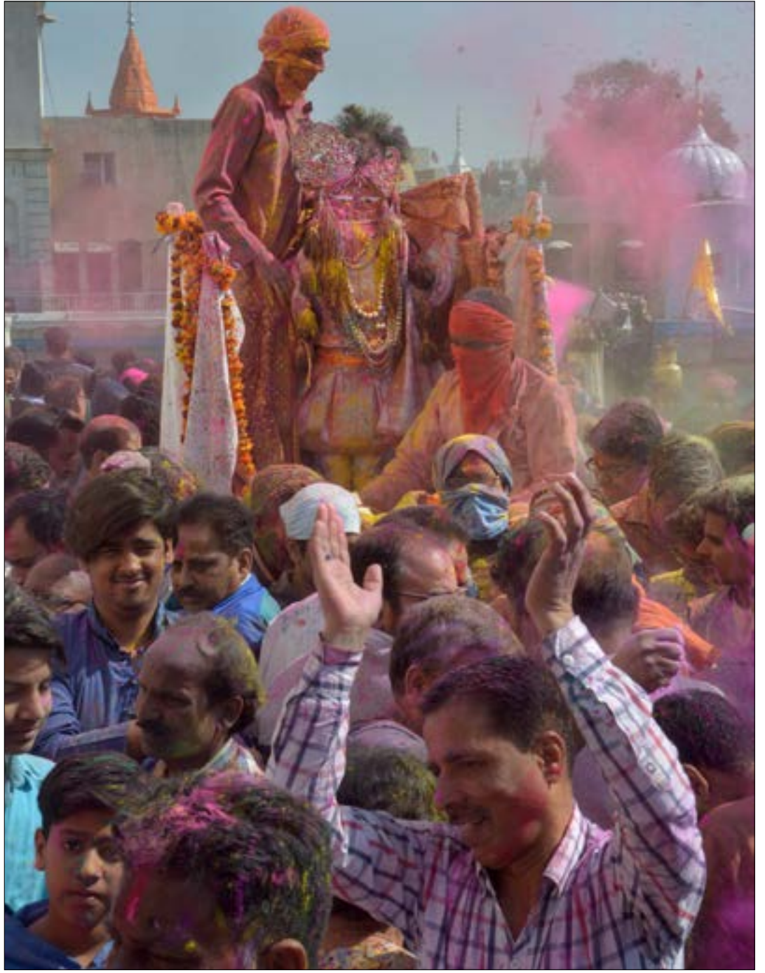
إنه موعد إعلان قدوم الربيع، والاحتفال بانتصار الخير على الشر، وإعادة وجه العلاقات العنقطة بين الناس. في هذا الوقت من كل سنة، تحتفل الهند والنيبال بهجران «هولي» أو «مهرجان الألوان». هذا ما فعله الناس الذين خرجوا أمس إلى الشوارع، للرقص والترشق بالألوان على وقع الموسيقى في مدن عدة من بينها كولكاتا الهندية.

* منقول، بغير تصرّف، عن: إنجيل «يسوع الثاني»/ الإصحاح الأخير. 7/12/2016