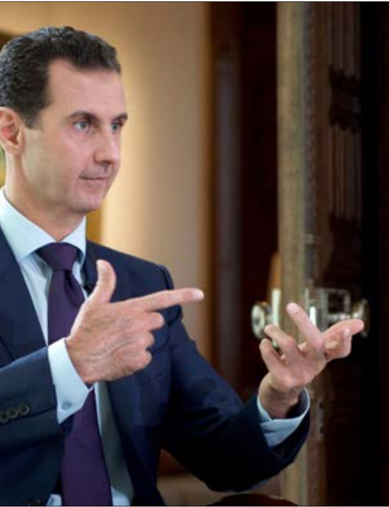
أشار الأسد إلى أن الجيش اقترب من مدينة الرقة وستكون إحدى أولوياته

فيما يُنظر أن تلعب مخرجات الجولة المقبلة من محادثات أستانة دوراً رئيسياً في دعم جهود المبعوث الأممي ستيفان دي ميستورا في جنيف، يأتي إعلان وفد المعارضة المسلحة نيته التخلي عن أستانة، ليظهر بوضوح قدرة تركيا على إثبات عمق تعاونها مع روسيا لإنجاح اللقاء. وانعكاس ذلك على المعطيات في الشمال السوري وخاصة في محيط منبج، بالتوازي مع إدانة دمشق الوجود الأميركي والتركي هناك