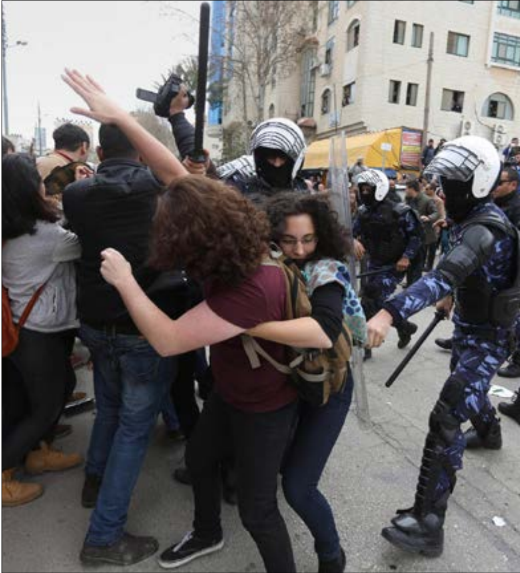
اعتدى أمن السلطة على والد الأعرج والنساء والصحافيين (أي بي إيه)

تزامناً مع محاكمة الأعرج ورفاقه والاعتداء على المحتجين خارج قاعة المحكمة، اعتصم عشرات المتضامنين في غزة وأمام عدد من السفارات الفلسطينية في العواصم العربية رفضاً لمحاكمة المقاومين وسياسة التنسيق الأمني. وشهدت العاصمة اللبنانية بيروت اعتصاماً أمام السفارة الفلسطينية، كذلك اعتصم عشرات الشبان أمام السفارة في العاصمة