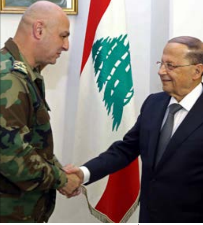
للمرة الأولى منذ عام 1970 يُعيّن قائد للجيش في ظروف طبيعية