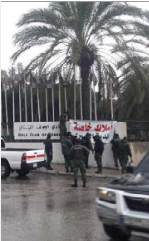
مداخيل الفولف من الاشتراكات تبلغ 6 ملايين دولار سنوياً وعقد إشغال الأرض يبلغ ألف ليرة سنوياً

السهرة على ضوء الشمعة. كانت لمبات "الفلوروسونت" مزعجة ومسببة للكآبة، ضوءها الأبيض الخفيف والناهت، وصوت الصفيح الحاد الذي كانت تصدره بعد طول الإستخدام، كانا يسببان الصداع والملل، لكن أجمل ما فيها أنها كانت جهازاً كهربائياً يمكن تصليحه لا مجرد لمبة. في وقت لاحق، استبدلت لمبات "الفلوروسونت" بلمبات "التوفير"، إضاءتها أشد، وأمنة، وعلى عدة