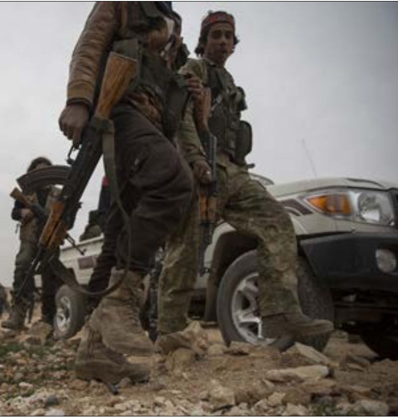
مسرح رذ الفعك التركي قد يشمك مناطق لا تحفظات اميركية في شانها

فيما انفرد «مجلس منبج العسكري» بالحديث عن اتفاه لتسليم قوات سورية مناطق في ريف منبج الغربي. سارعت انقرة إلى الكشف عن اتفاه بينها وبين موسكو ينص على ترسيم خطوط ميدانية مع الجيش السوري. لا تصريحات رسمية سورية أوروبية في الشائيت. علاوة على غموض في الموقف الأميركي من الاتفاه الذي يعني تنفيذه دخول الجيش السوري نطاقاً مشمولاً بالاهتمام الأميركي المباشر. تنفيذا الاتفاه سيؤدي في الوقت نفسه إلى مسار «منبج - الرقة» لت يكون سالكا بسهولة أمام الغزو التركي