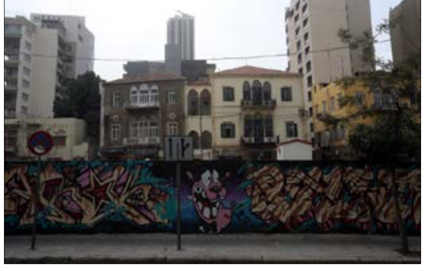
مبنى «بيت ورد» في الأشرفية