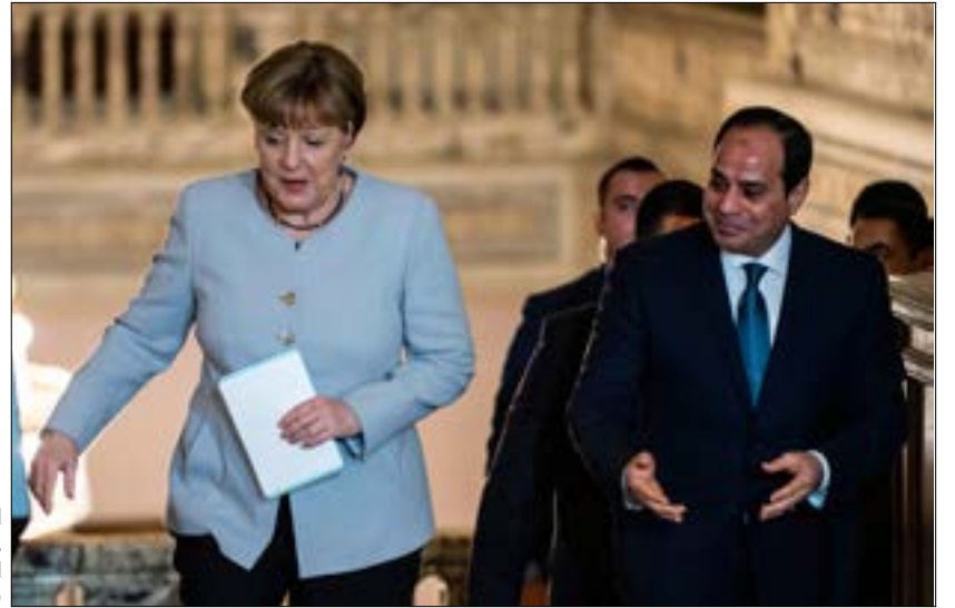
القاهرة: حرسون على حقوق الإنسان ولكن المنطقة لها ظروفها

الإرهاب واللاجئون وملف حقوق الإنسان، إلى جانب السياسات الاقتصادية للقاهرة والأزمات السورية والليبية، هي أبرز الملفات التي بحثتها المستشارة الألمانية مع الرئيس عبد الفتاح السيسي، خلال زيارتها القصيرة للقاهرة، والتي جدد خلالها الرئيس المصري رفضه إقامة مخيمات للاجئين