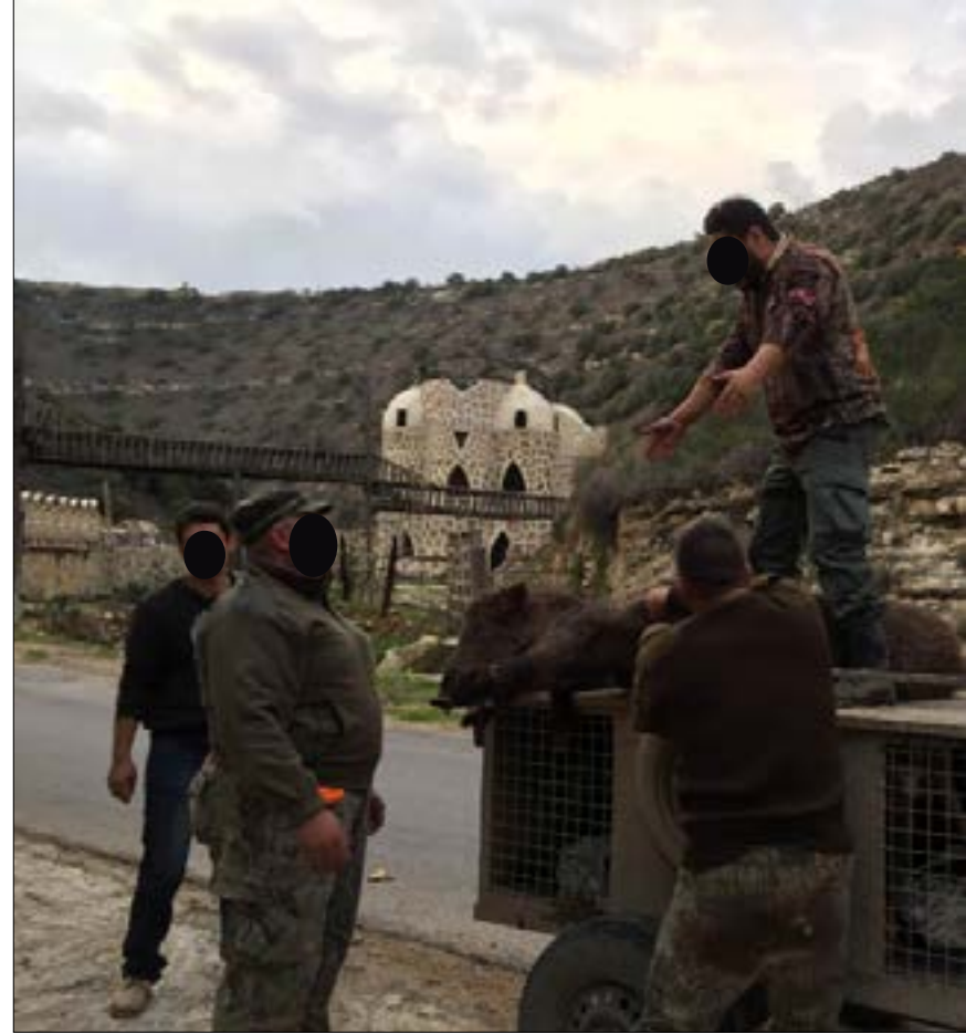
صباوت يستعرضون خنازير برية اصطادوها في وادي تفاعتا

ورد عشوائياً، لتبرير الصيد. "هذا لا يعني الصيد بأعداد غير محددة. إذ