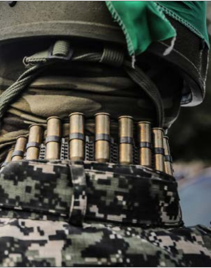
وَضَعَت المقاومة في حالة تأهب نسيف حالة الطوارئ قبل الحرب (نضال الوحيد)

إلا إذا تجاوزوا كل القواعد»، وضعت كلها المقاومة الفلسطينية في حالة تأهب ما قبل القصوى، وخصوصاً بعد إعلان المتحدث الرسمي باسم «كتائب القسام»، الجناح العسكري لـ «حركة المقاومة الإسلامية - حماس»، أبو عبيدة، معادلة جديدة.