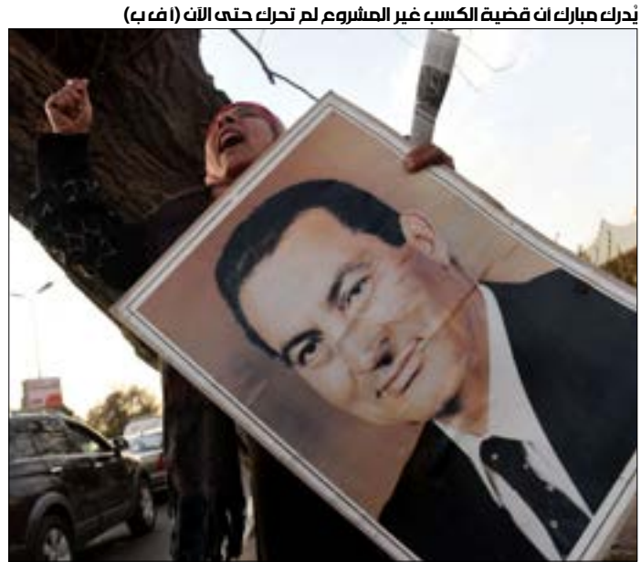
يُذكر مبارك أن قضية الكسب غير المشروع لم تحرك حتى الآن

مبارك لم يقتل الثوار في «25 يناير»، حكم قاس من محكمة النقض - أعلى جهة قضائية - صدر أمس بحق الرئيس الأسبق الذي خرج الملايين ضده في الشوارع وسقط أكثر من 1200 ضحية، قبل أن يجبر على التنحي وتسليم السلطة للمجلس الأعلى للقوات المسلحة، بعد 18 يوماً من خروج المتظاهرين ضده. براءة الرئيس المصري الأسبق، حسني مبارك، المنتوقعة منذ عامين بعد تبرة المحكمة وزير الداخلية الأسبق حبيب العادلي ومساعديه، جاءت في جلسة استغرقت نحو ثماني ساعات في أكاديمية الشرطة في القاعة التي نقلت إليها محكمة النقض للمرة الأولى في تاريخها لدواع أمنية، بينما أصبح مبارك بموجب الحكم حراً طليقاً، ولم يصدر ضده سوى حكم بالحبس لمدة 3 سنوات في قضية «القصور الرئاسية»، وهي القضية الوحيدة التي أدين فيها بعد خروجه من السلطة.