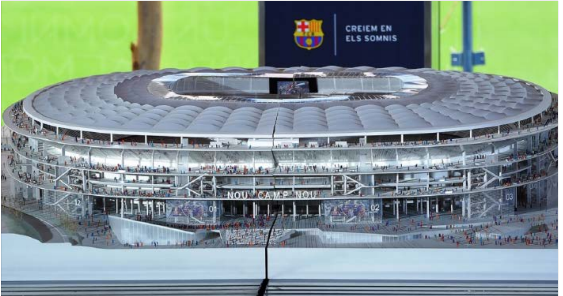
مجموع تصميم ملعب «كامب نو» بطلته الجديدة (أرشيف)

عند الكشف عن المشروع: «ما ستقوم به يعتبر تحويلاً مذهباً للملعب سانتياغو برنابيو الذي هو أحد رموز مدينتنا، ونرغب بأن نجعله أحد أفضل الملاعب في العالم». أما جار ريال أتلتيكو فقد ذهب أبعد من قطبي الكرة الإسبانية وقرر تشييد ملعب جديد بمواصفات عالمية بدلاً من ملعبه «فيستي كالدرون» حيث سينتقل إليه في الموسم المقبل. ووصلت أعمال البناء في الملعب الذي سيحمل اسم «واندا ميتروبوليتانو» ويتسع لـ 67 ألف متفرج إلى مراحلها الأخيرة وستبلغ الكلفة الإجمالية للمشروع 300 مليون يورو. وانتهاء بإنكسار فإن توتنهام يخوض مبارياته الأخيرة على ملعبه «وايت هارت لين» إذ إنه سينتقل إلى ملعب «ويمبلي» في الموسم المقبل بانتظار الانتهاء من تشييد ملعبه الجديد بجانب ملعبه الحالي والذي سيصبح جاهزاً لاستضافة المباريات في موسم 2018-2019.