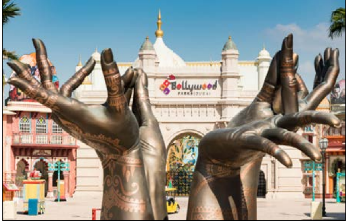
عروض هوليوود الساحرة يحتضنها مسرح «راج محل»