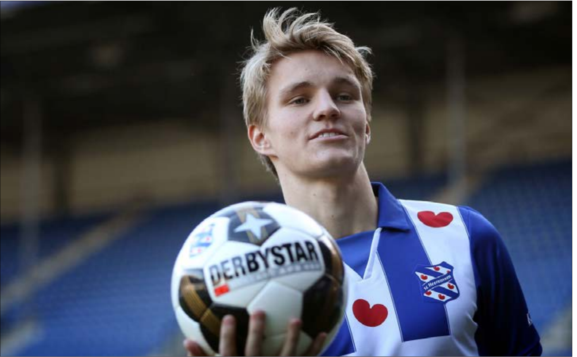
أوديفارد من موهبة كبرى في ريال مدريد إلى معار لهيرنزفيل الهولندي