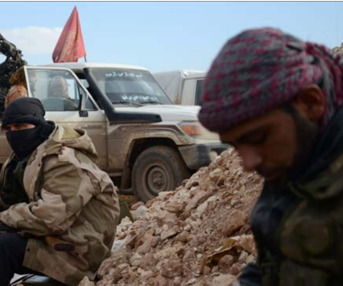
تظهير دور «أحرار الشام» في وادي بردى يرتبط بمفاوضات الأستانة