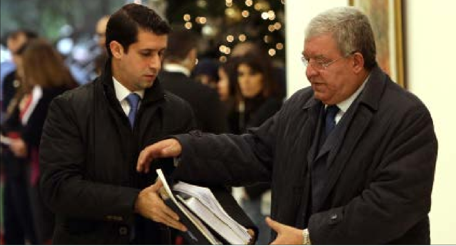
القرار لم يصدر عن المشوق، بل عن مجلس الأمن المركزي

مرة جديدة، يشتمك الصرام بين الوزير السابقة أشرف ريفي وتيار المستقبل، على خلفية معلومات جرى تداولها بهاضي طرابلس أمس، عن صدور قرار بخفض عدد مرافقيه من 60 إلى 20. رسالة القرار تكتمت في توقيتها: صدر عشية زيارة وزير الداخلية نهاد المشوق إلى السعودية.