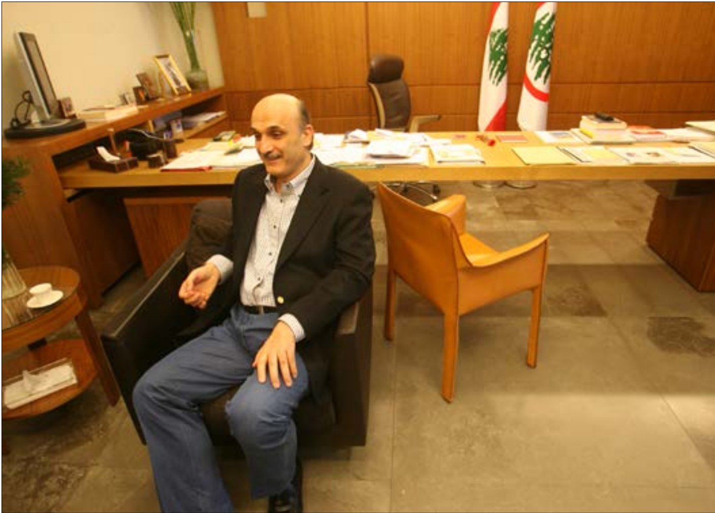
المواعيد الدستورية أهم من أي اعتبار (هيام الموسوي)

■ انطباعي أن الرئيس نبيه بري يفاوض عنه وعن حزب الله في قانون الانتخاب كما جرى في