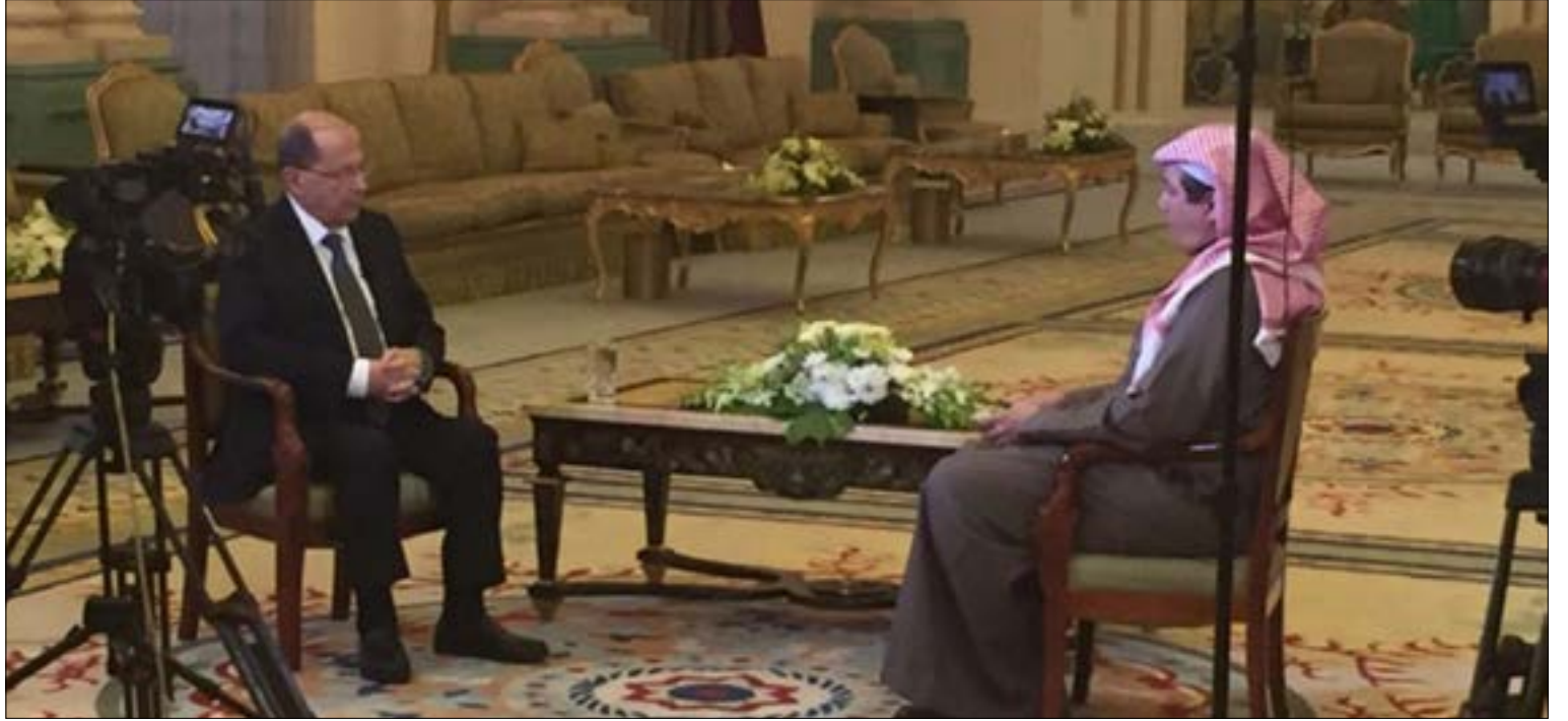
تركي الدخيل مستضيفاً عون في حلقة تعرض مساء اليوم على «العربية»

على خط مواز، نشر المدير العام لقناتي «العربية» و«الحدث» السعوديتين تركي الدخيل عبر تطبيق إنستغرام الإعلان الترويجي لحلقة اليوم من برنامج السياسي «مع تركي الدخيل» التي يستضيف فيها الرئيس ميشال عون، وتعرض عند الساعة السادسة مساءً بتوقيت بيروت على قناة «العربية».