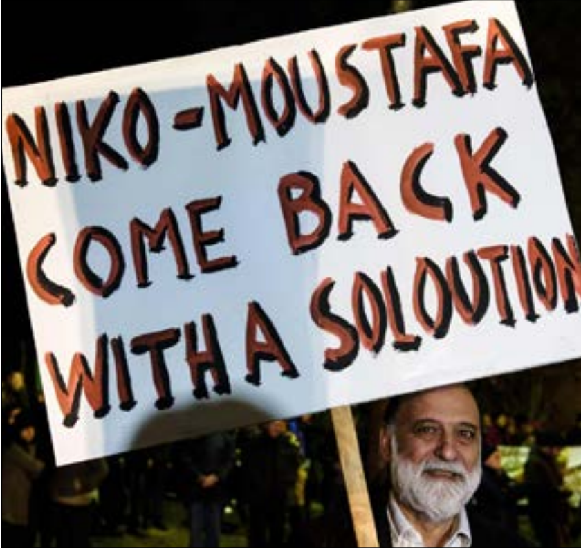
يشارك عن طرفي قبرص مصطفى أقينجي ونيكوس أناستياياديس

الأمن والضمان محور مناقشات المؤتمر الذي سيحضره ممثلون عن الاتحاد الأوروبي بصفة «مراقب خاص».