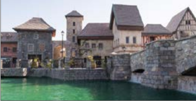
متاجر ومطاعم حديثة بنكهة القرن التاسع عشر