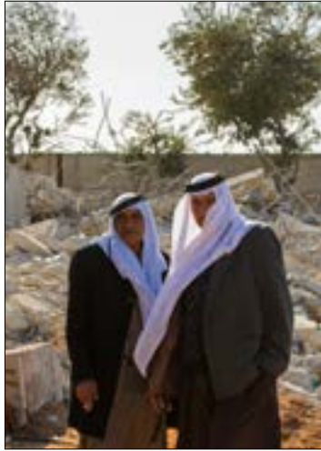
ستنعرض آلاف البيوت للهدم في حال قوننة ما حدث في قلقسوة

وجهتها «لجنة المتابعة العربية»، التي عقدت اجتماعاً طارئاً في أعقاب هدم المنازل في قلقسوة، كذلك نظمت بعض الوقفات التضامنية في عدد من القرى والبلدات وجامعتي القدس العبرية ونزل أبيب. ورغم الاستجابة الواضحة لقرار اللجنة، انتقد ناشطون فلسطينيون أعضاء «القائمة العربية المشتركة» في الكنيست، ورئيس «المتابعة»، محمد بركة، ورأوا أن قرار الإضراب لا يرقى إلى مواجهة الاحتلال وسياساته، داعين في الوقت نفسه إلى استقالة النواب العرب من الكنيست. وقالوا أيضاً إن الإضراب استهلك وصار مفرغاً من أي قيمة نضالية، مطالبين باستغلال الموقف للنزول إلى الشارع والنظار.