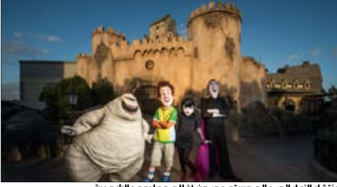
ينتقل الزوار الى عالم مستوحى من افلام هوليوود الشهيرة